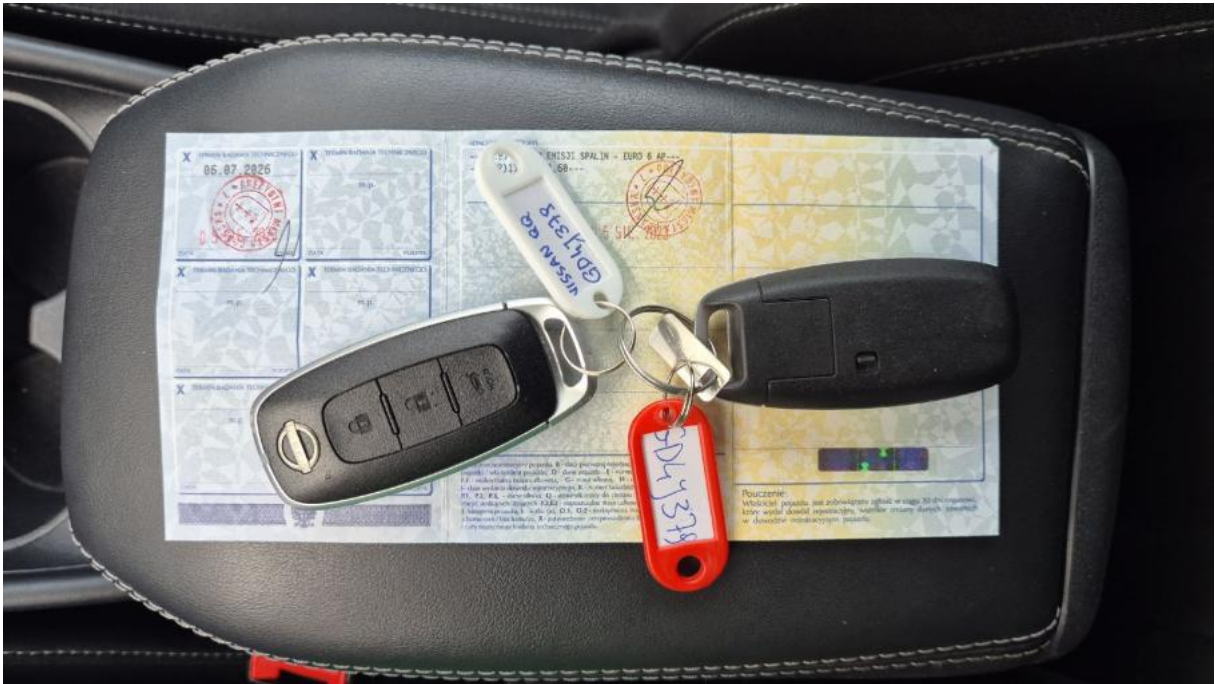
Fot. 29 Dow. Rej. Str.2 i klucze