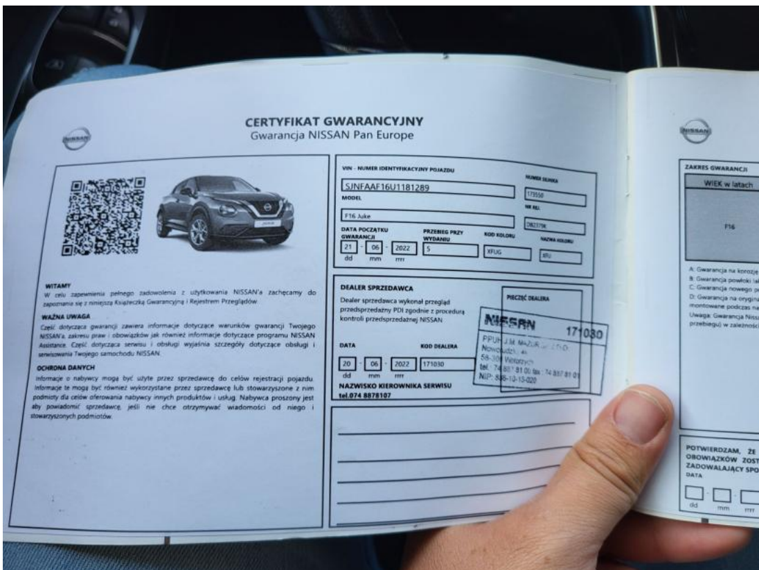
Fot. 34 Książka serwisowa – dane