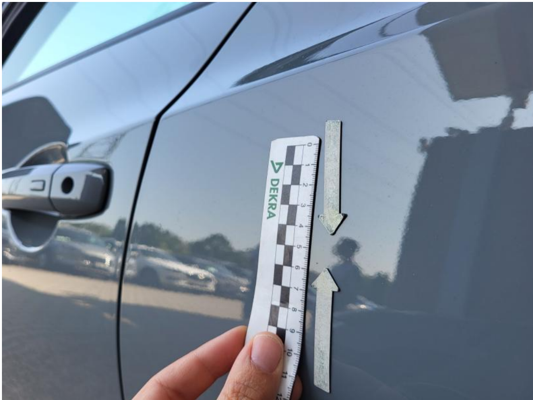
Fot. 43 Drzwi tylne L - Wgniecenie/odkształcenie 1