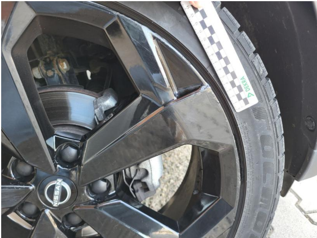
Fot. 39 Felga aluminiowa przednia P - Rysa/odprysk 2