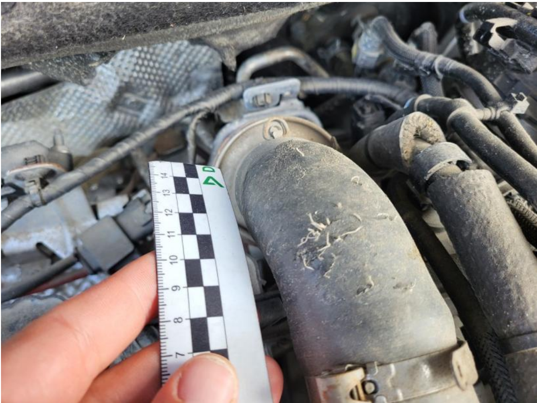
Fot. 37 Zdjęcie do protokołu