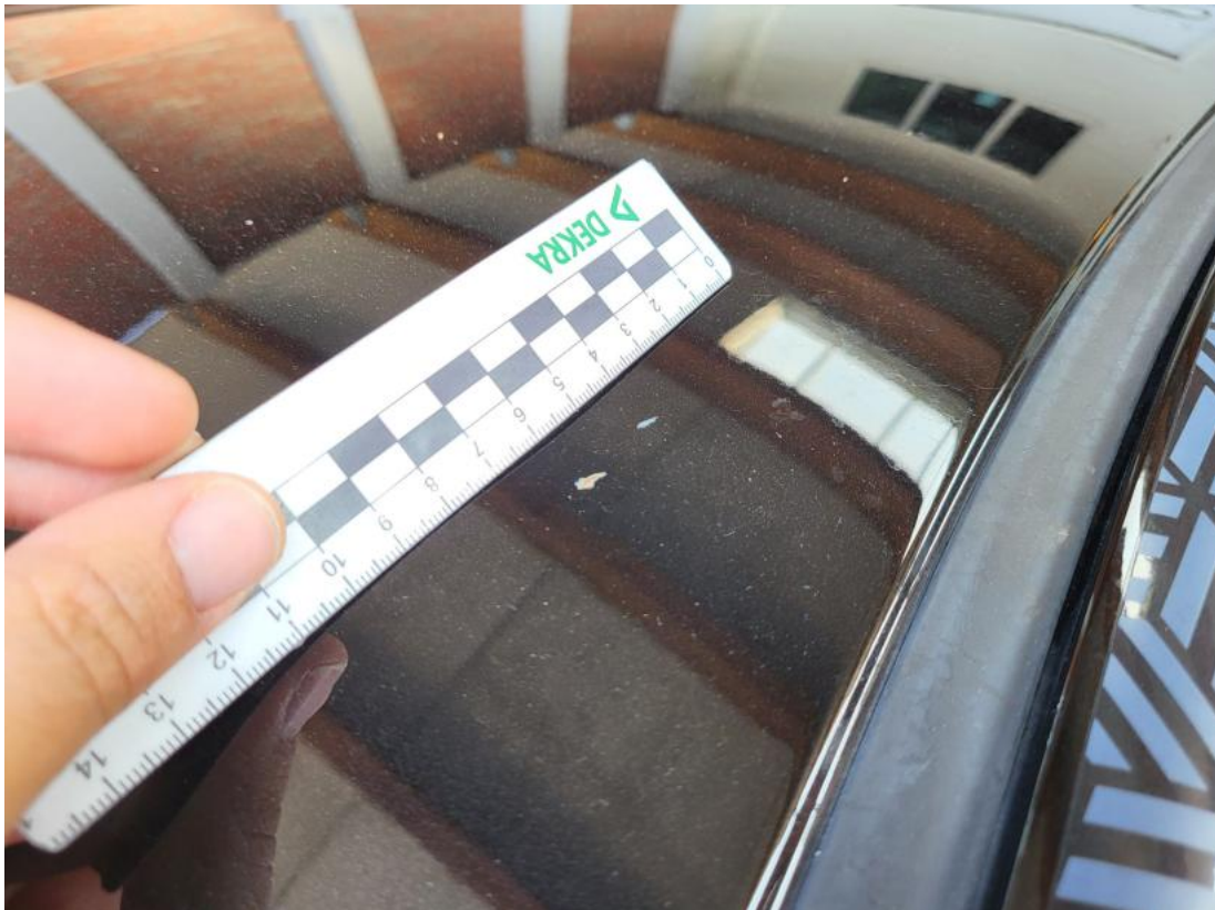
Fot. 41 Dach - Rysa/odprysk 1