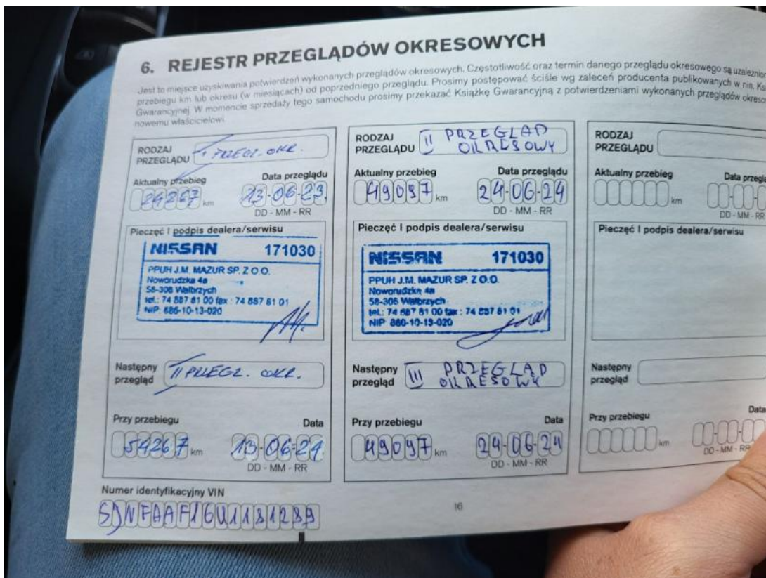
Fot. 35 Książka serwisowa – ostatni przegląd