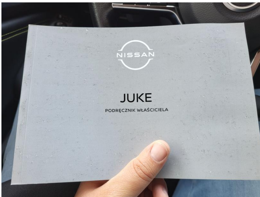
Fot. 36 Instrukcje