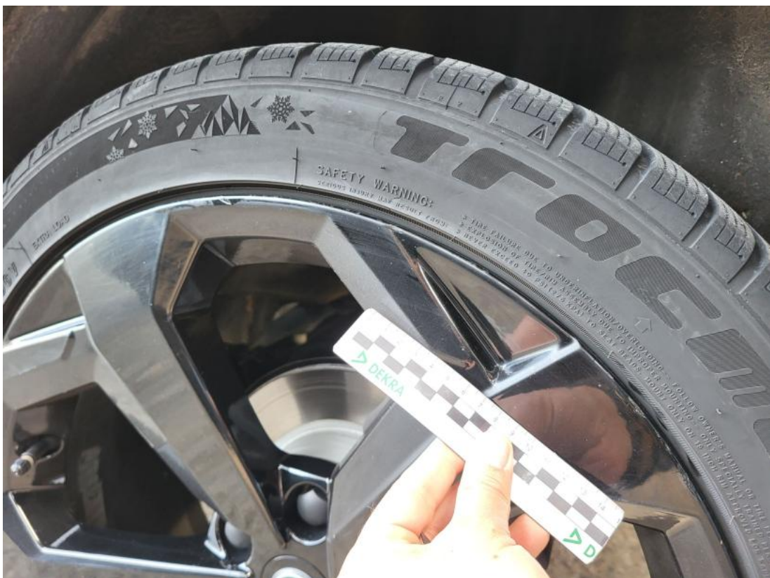
Fot. 42 Felga aluminiowa tylna L - Rysa/odprysk 1