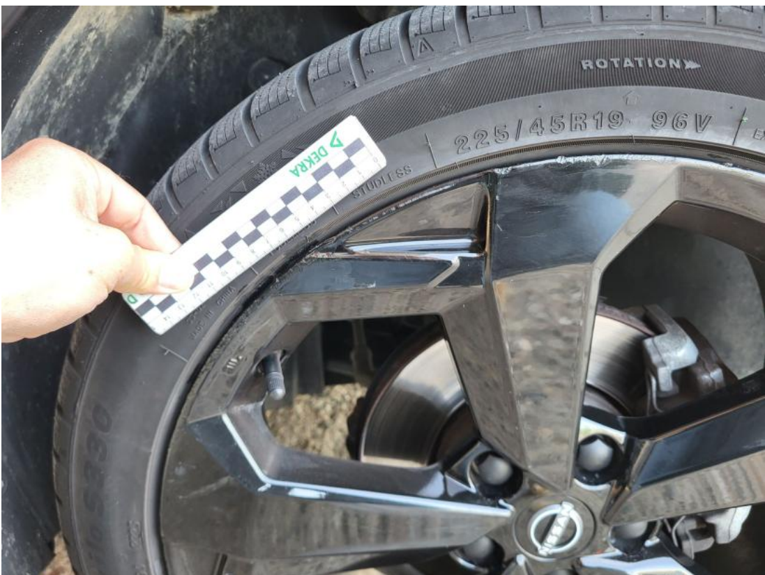
Fot. 38 Felga aluminiowa przednia P - Rysa/odprysk 1