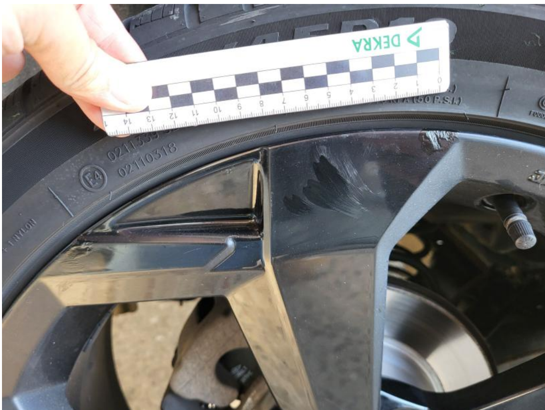
Fot. 40 Felga aluminiowa tylna P - Rysa/odprysk 1