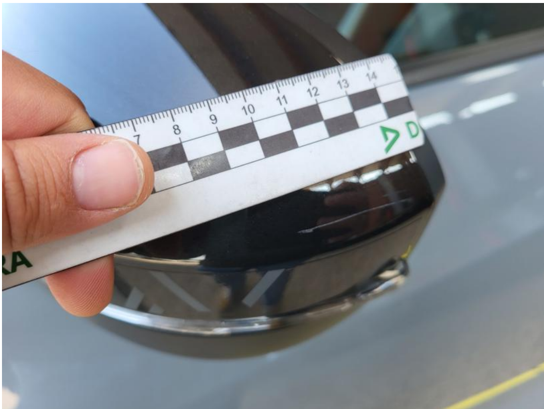
Fot. 44 Lusterko zew L - Rysa/odprysk 1