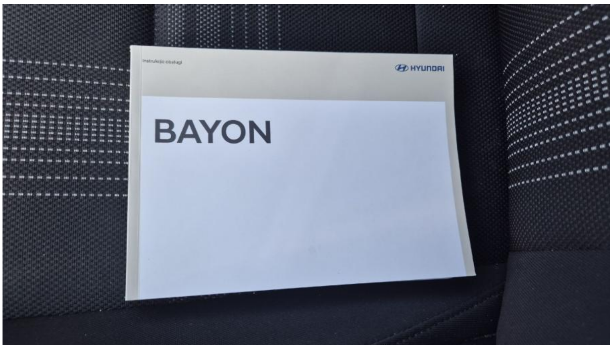
Fot. 32 Instrukcje