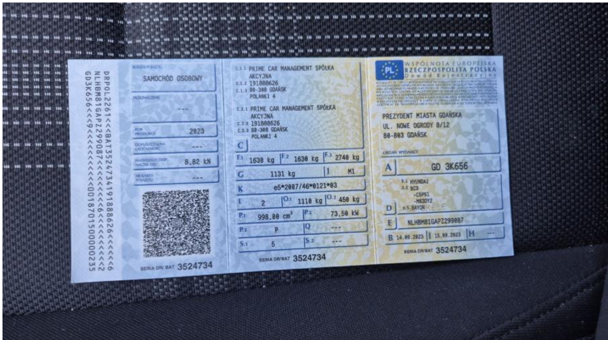
Fot. 28 Dowód rej. Str. 1