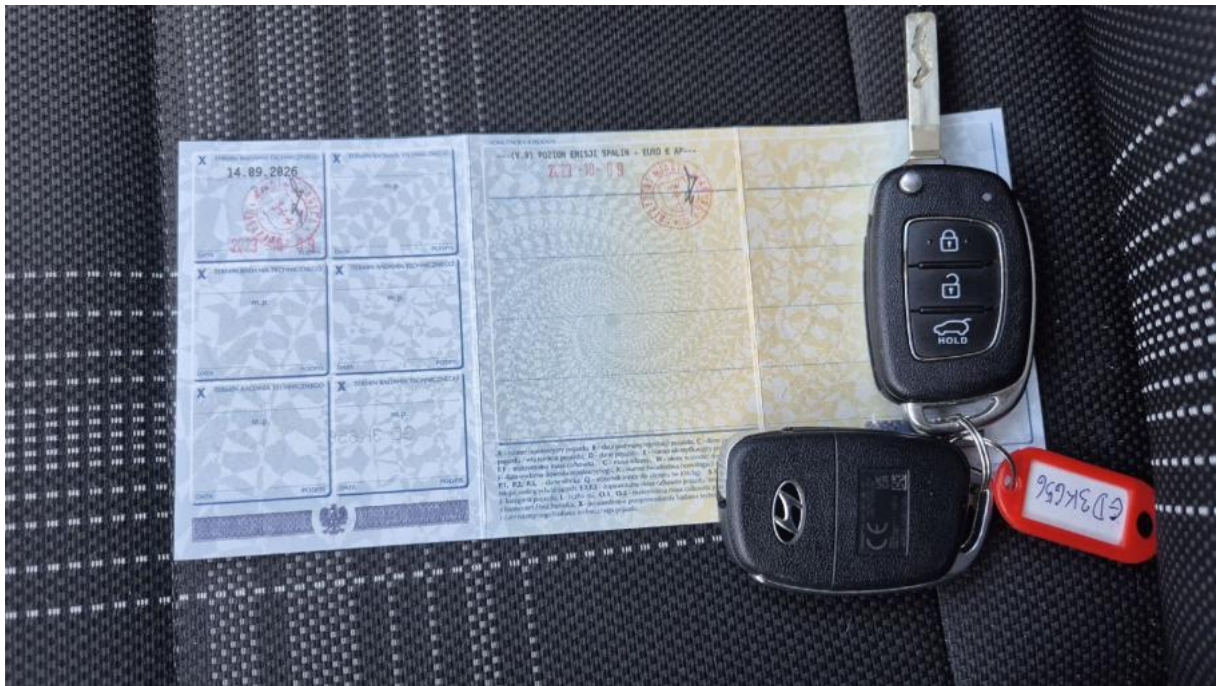
Fot. 29 Dow. Rej. Str.2 i klucze