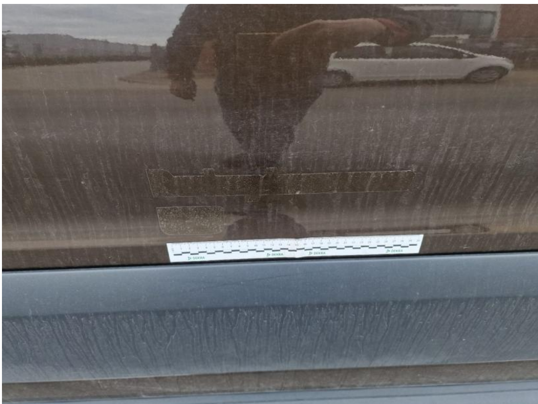
Fot. 62 Drzwi tylne L - zdjęcie poglądowe 2