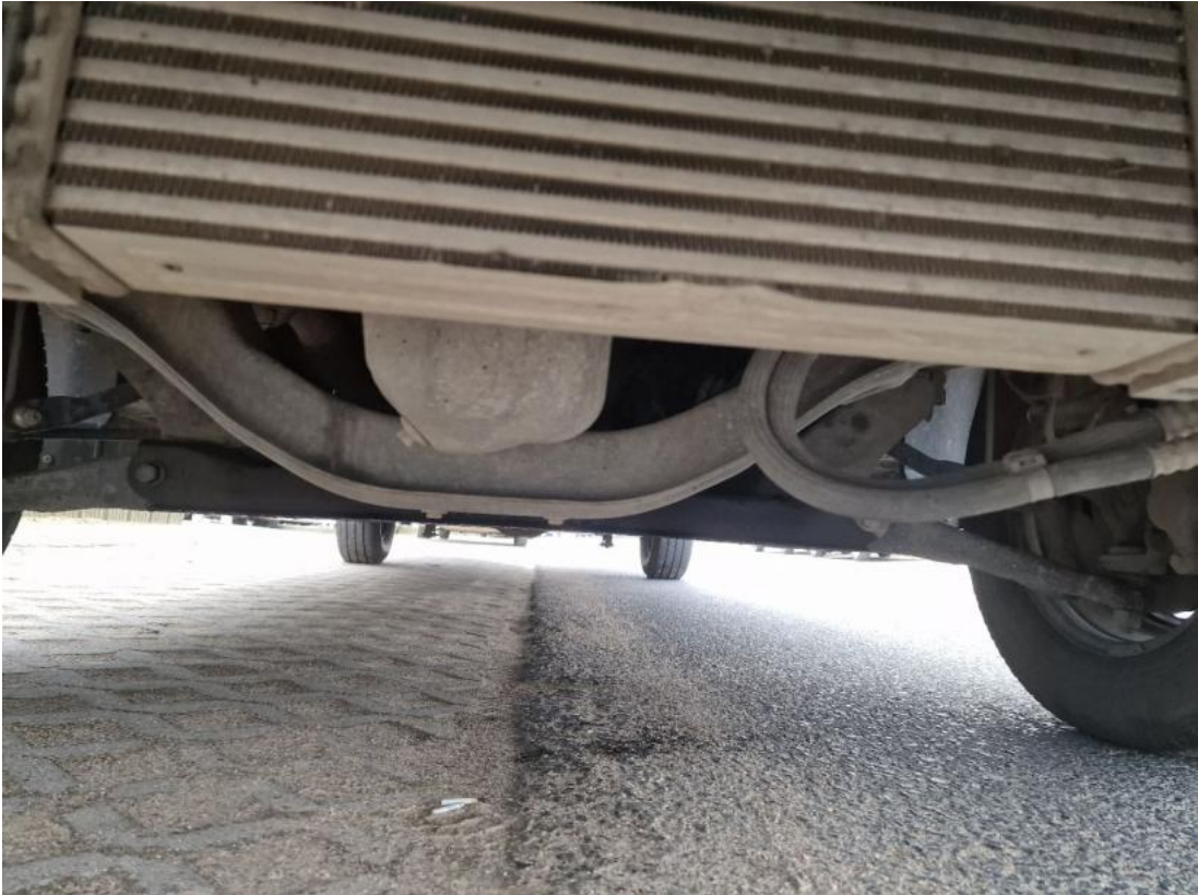
Fot. 27 Spód pojazdu przód