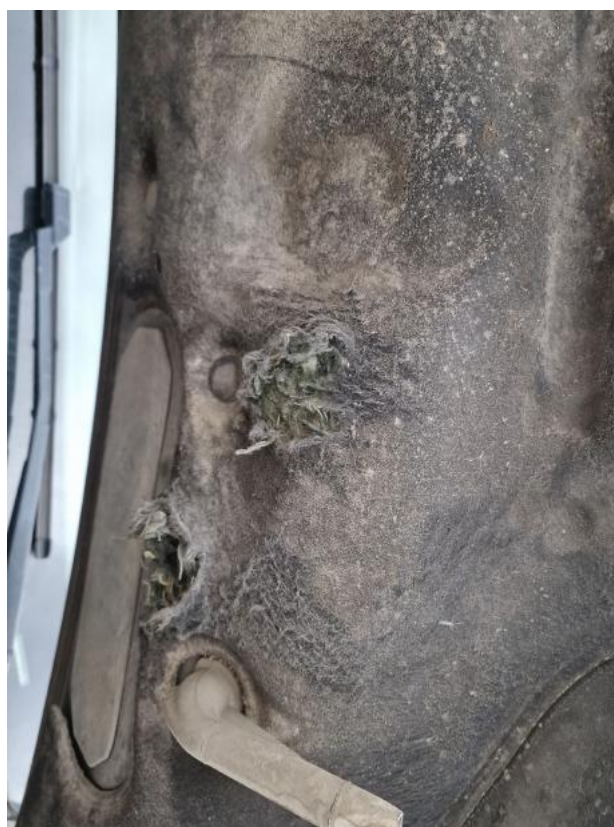
Fot. 36 Zdjęcie do protokołu