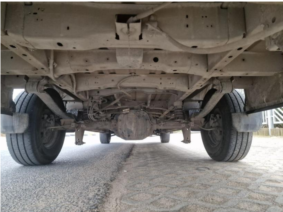
Fot. 28 Spód pojazdu tył