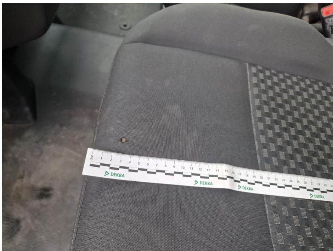
Fot. 64 Fotel prz. lew. - zdjęcie poglądowe 1