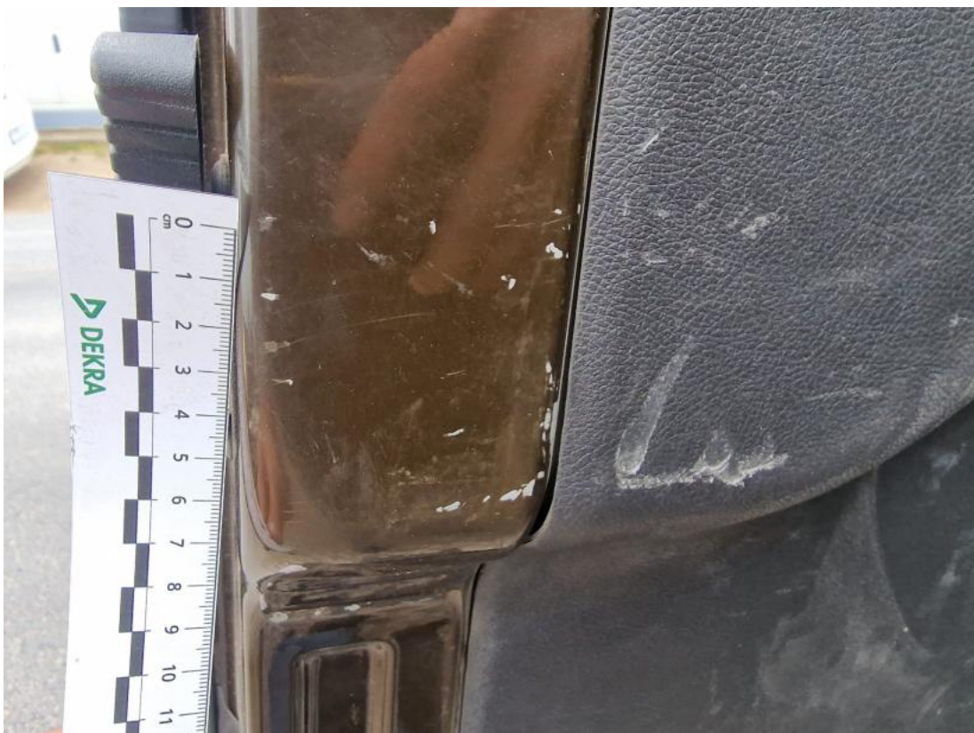
Fot. 66 Drzwi tyłu lewe - zdjęcie poglądowe 1