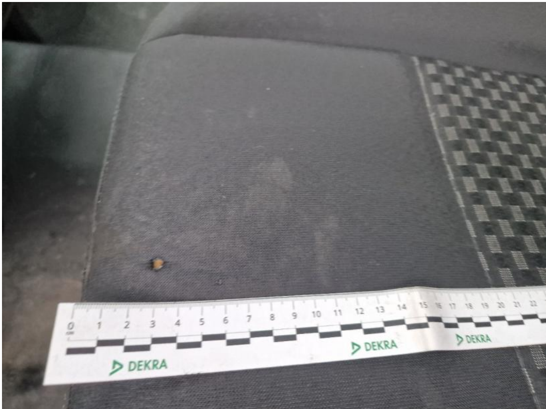
Fot. 65 Fotel prz. lew. - Inne 1