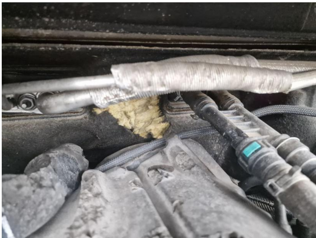
Fot. 37 Zdjęcie do protokołu