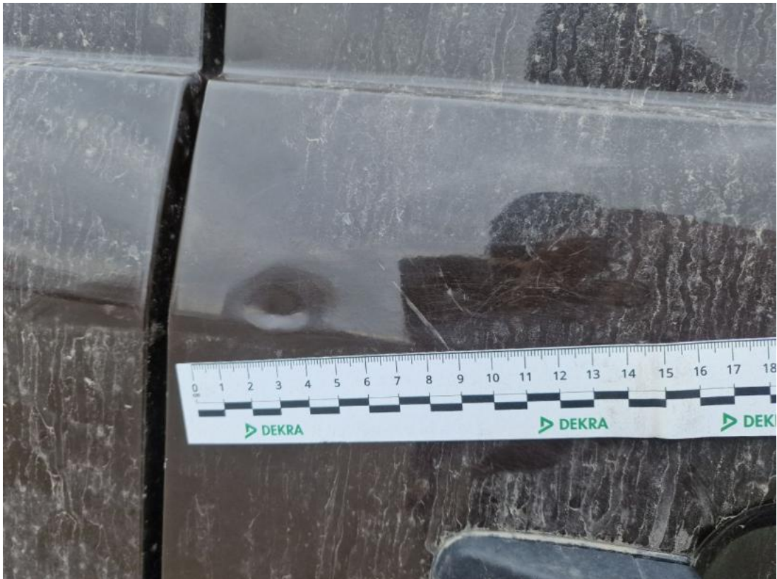
Fot. 51 Pokrywy bagażnika - Wgniecenie/odkształcenie 1