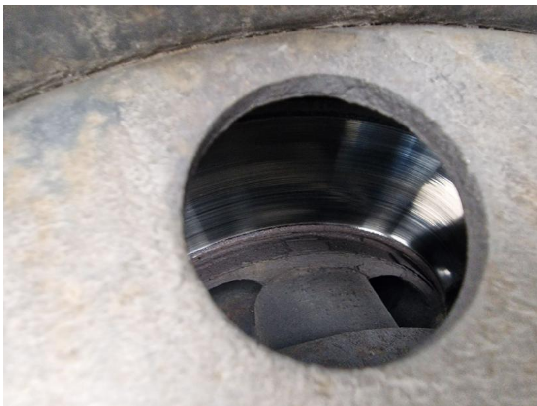
Fot. 32 Tarcza hamulcowa tylna lewa