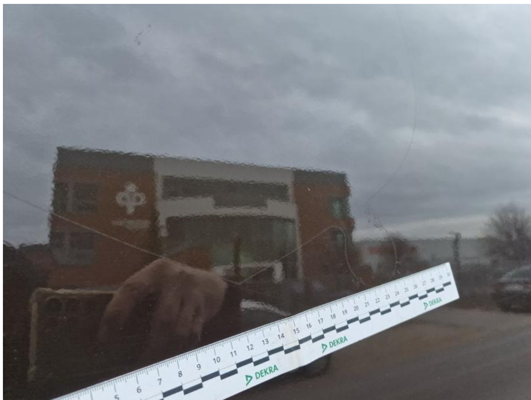
Fot. 63 Drzwi tylne L - Inne 1