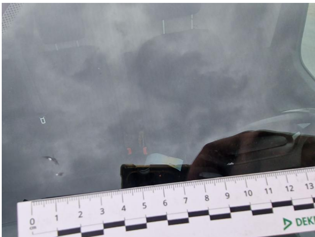
Fot. 38 Szyba czołowa - zdjęcie poglądowe 1