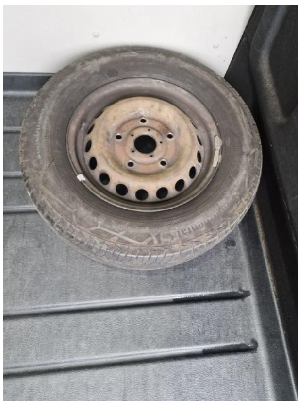
Fot. 26 Koło zapasowe