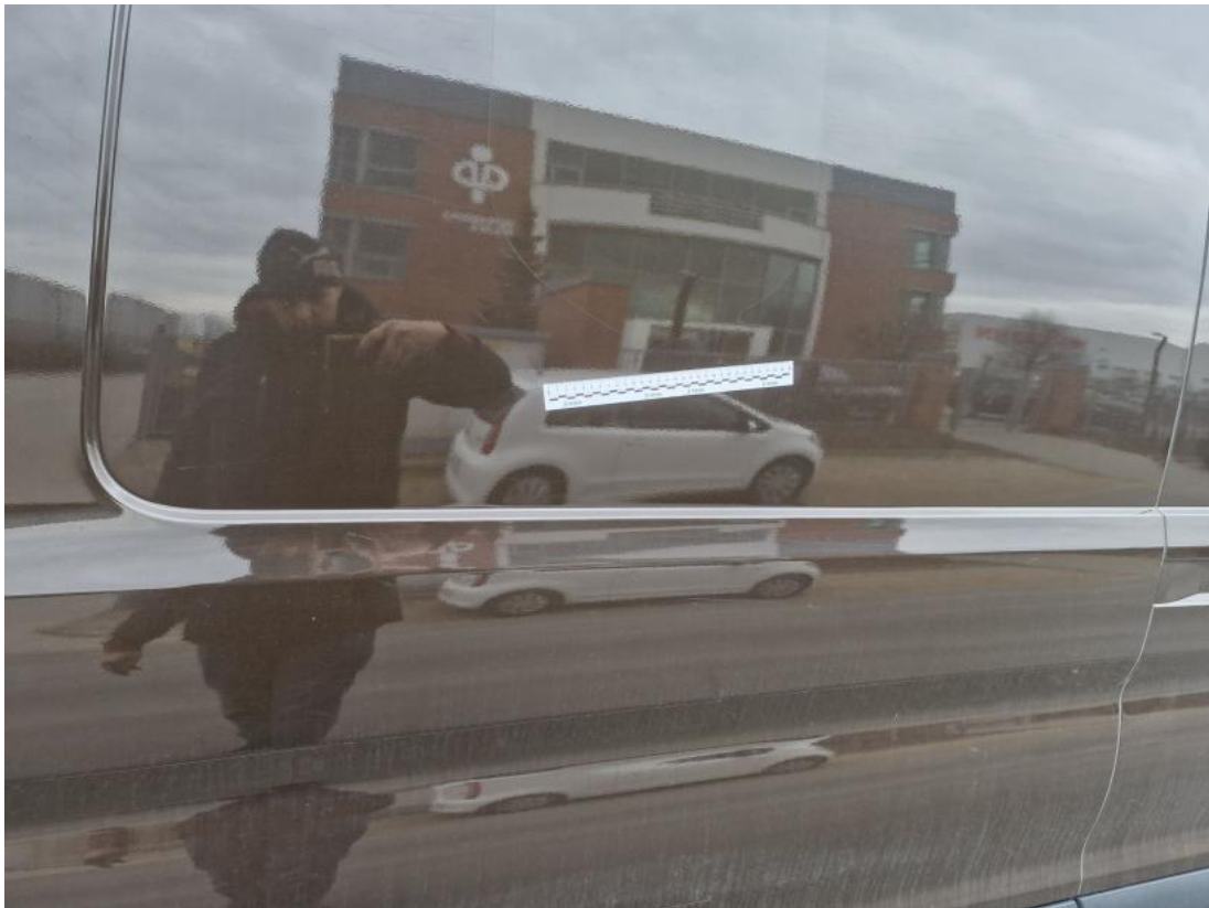
Fot. 61 Drzwi tylne L - zdjęcie poglądowe 1