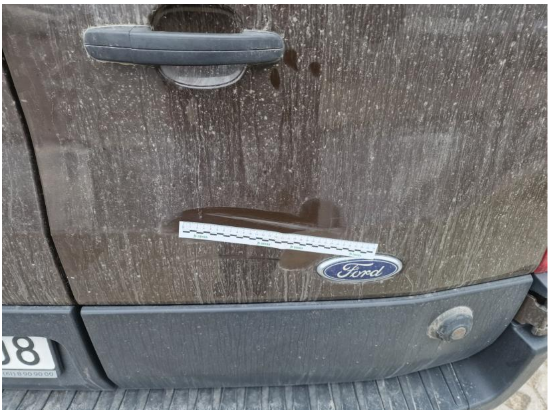
Fot. 52 Pokrywy bagażnika - Wgniecenie/odkształcenie 2