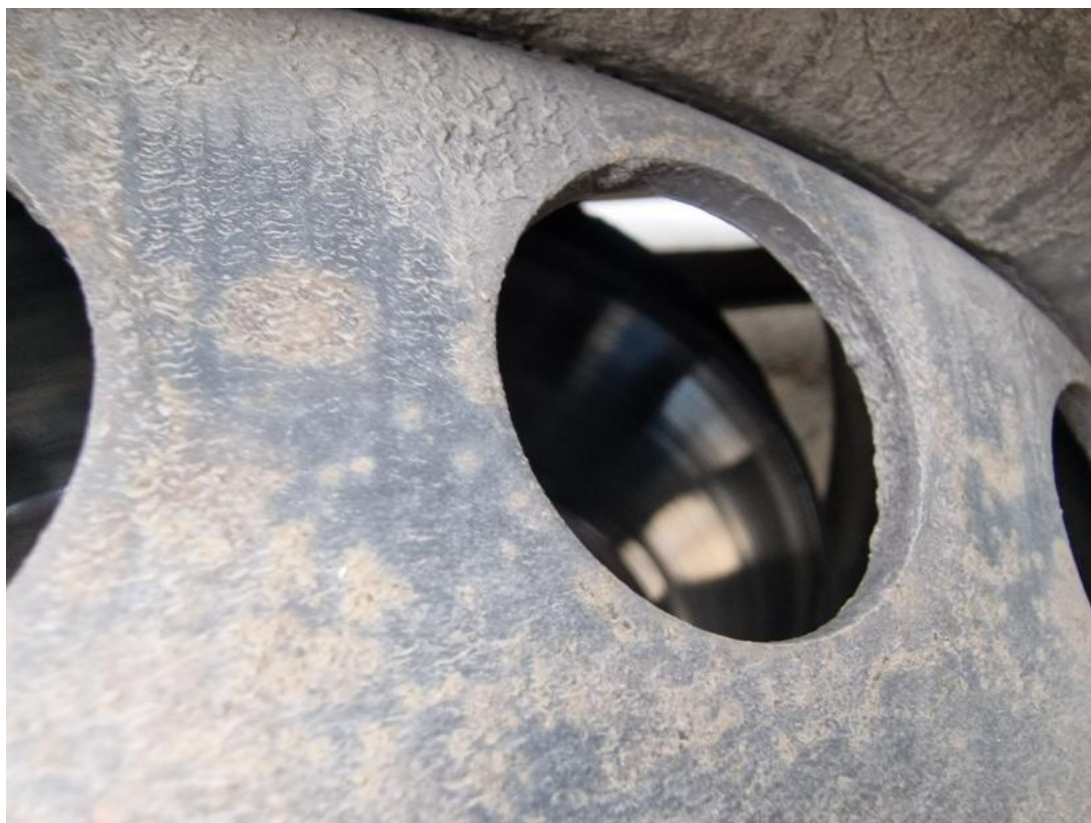
Fot. 31 Tarcza hamulcowa tylna prawa