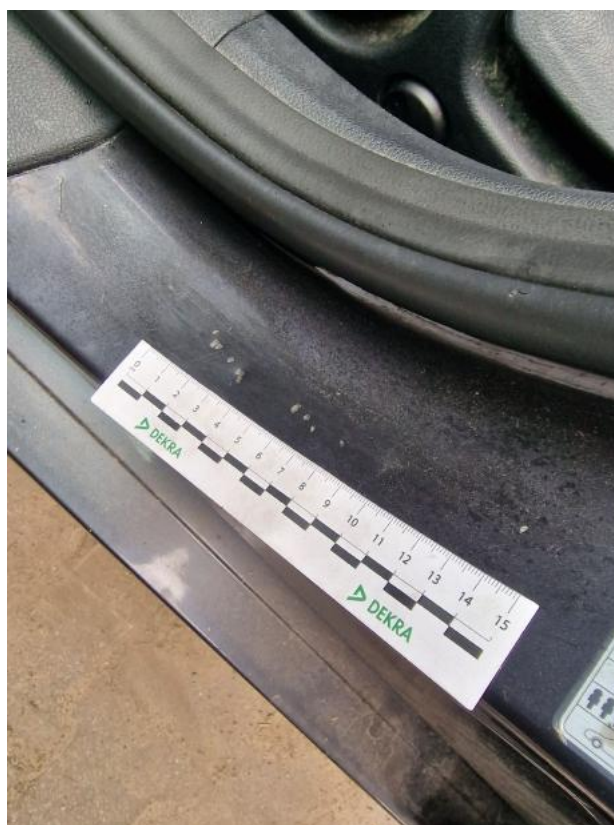
Fot. 62 Próg L - zdjęcie poglądowe 1