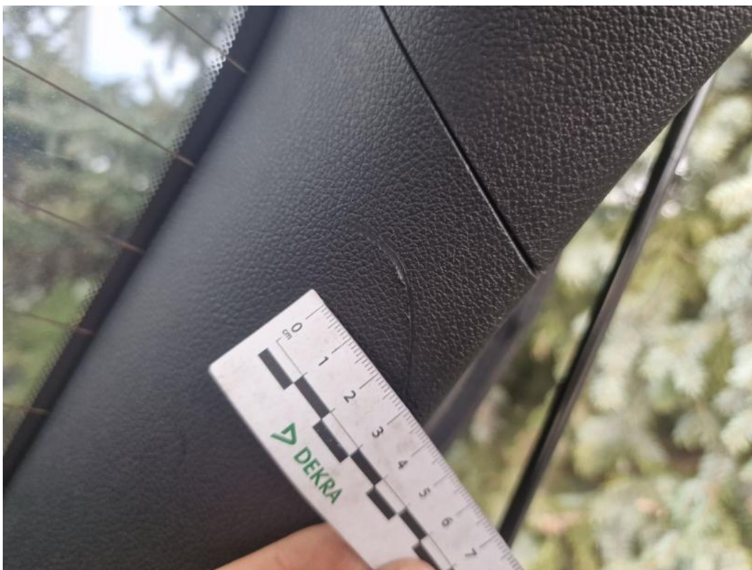
Fot. 74 Wykładzina pokrywy tylnej - Rysa/odprysk 1