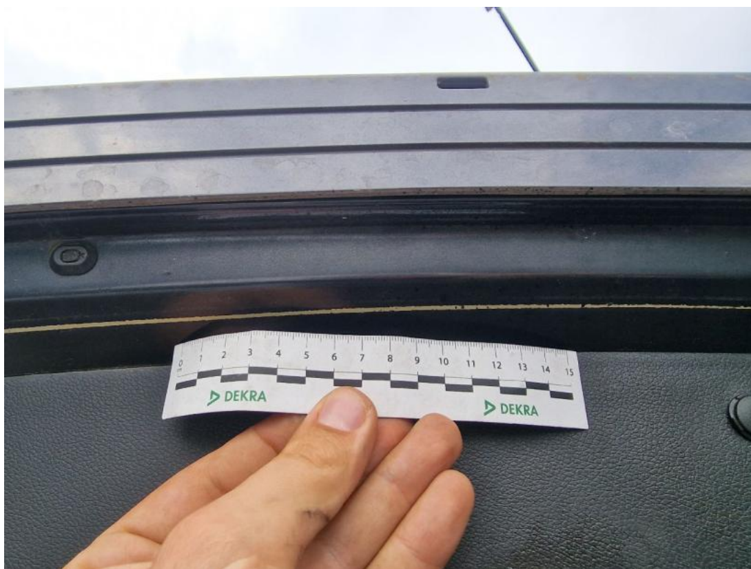
Fot. 44 Pokrywy bagażnika - Rysa/odprysk 1