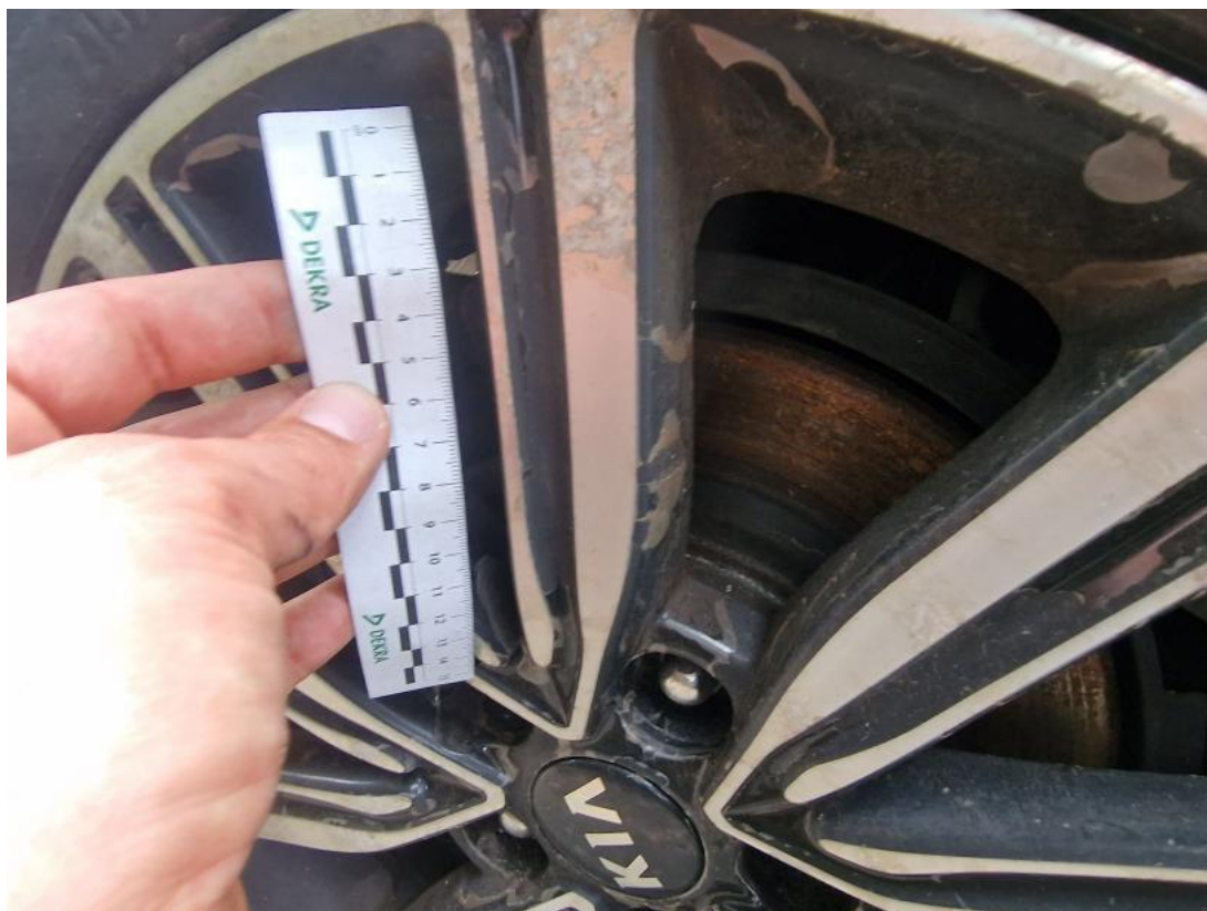
Fot. 37 Felga aluminiowa przednia P - zdjęcie poglądowe 1