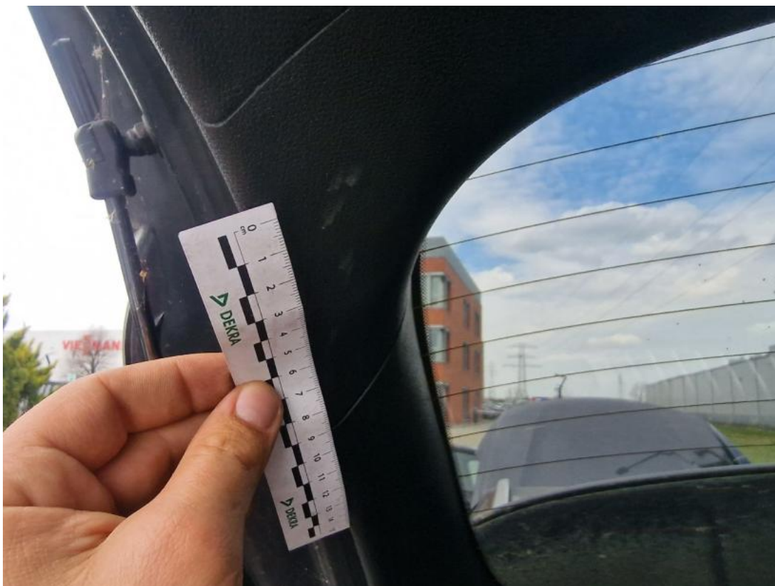
Fot. 73 Wykładzina pokrywy tylnej - zdjęcie poglądowe 2