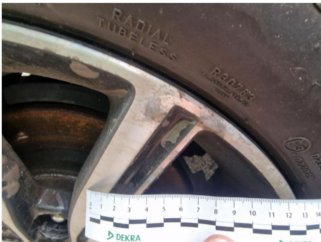
Fot. 41 Felga aluminiowa przednia P - Inne 1