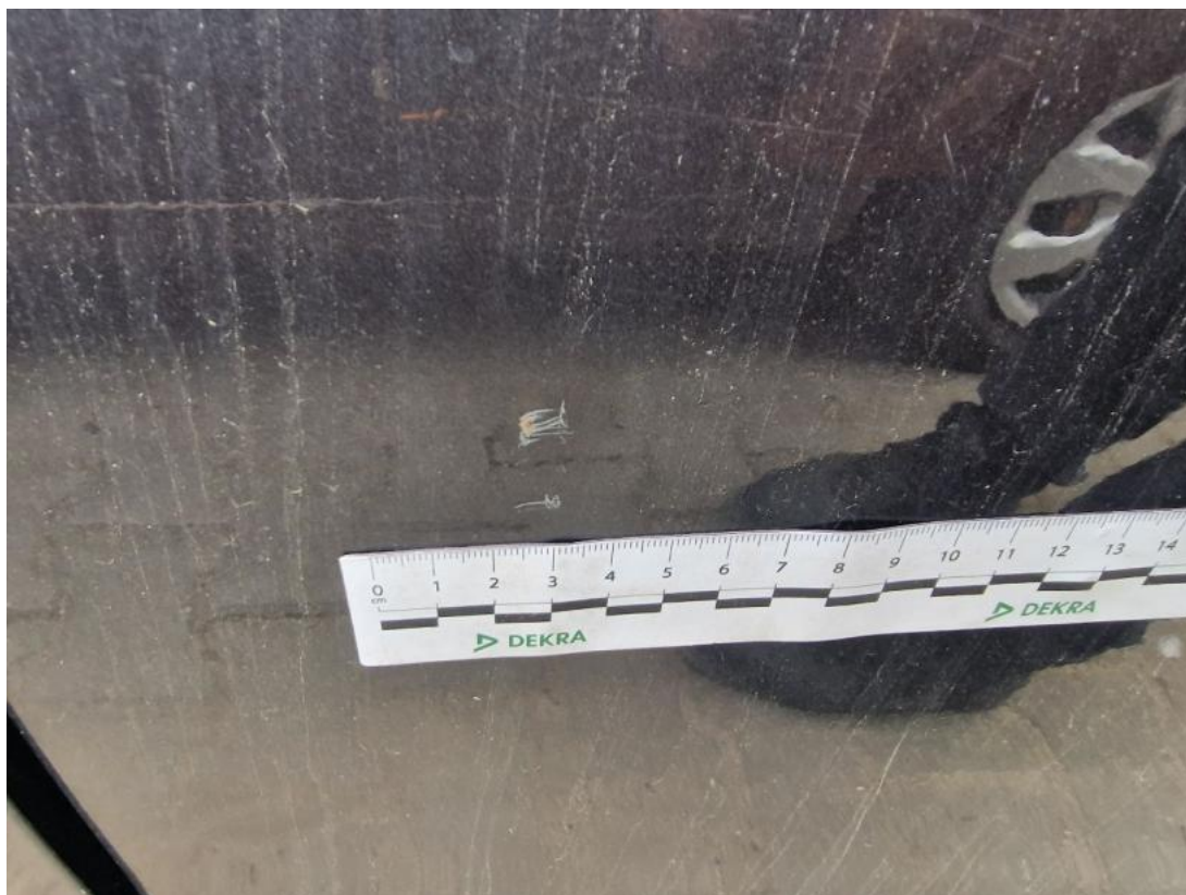
Fot. 61 Drzwi tylne L - Rysa/odprysk 1