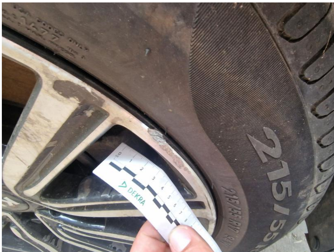
Fot. 39 Felga aluminiowa przednia P - Rysa/odprysk 1