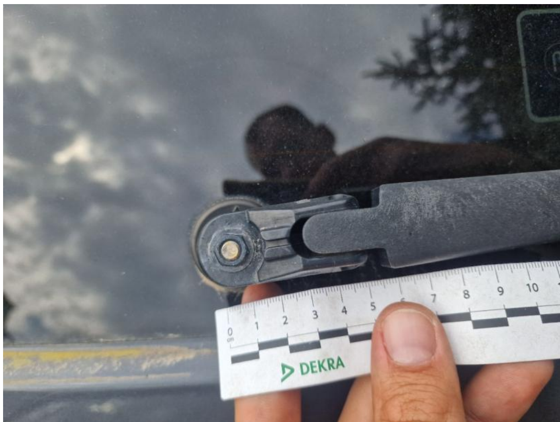
Fot. 47 Ramię wycieraczki tylnej - Inne 1