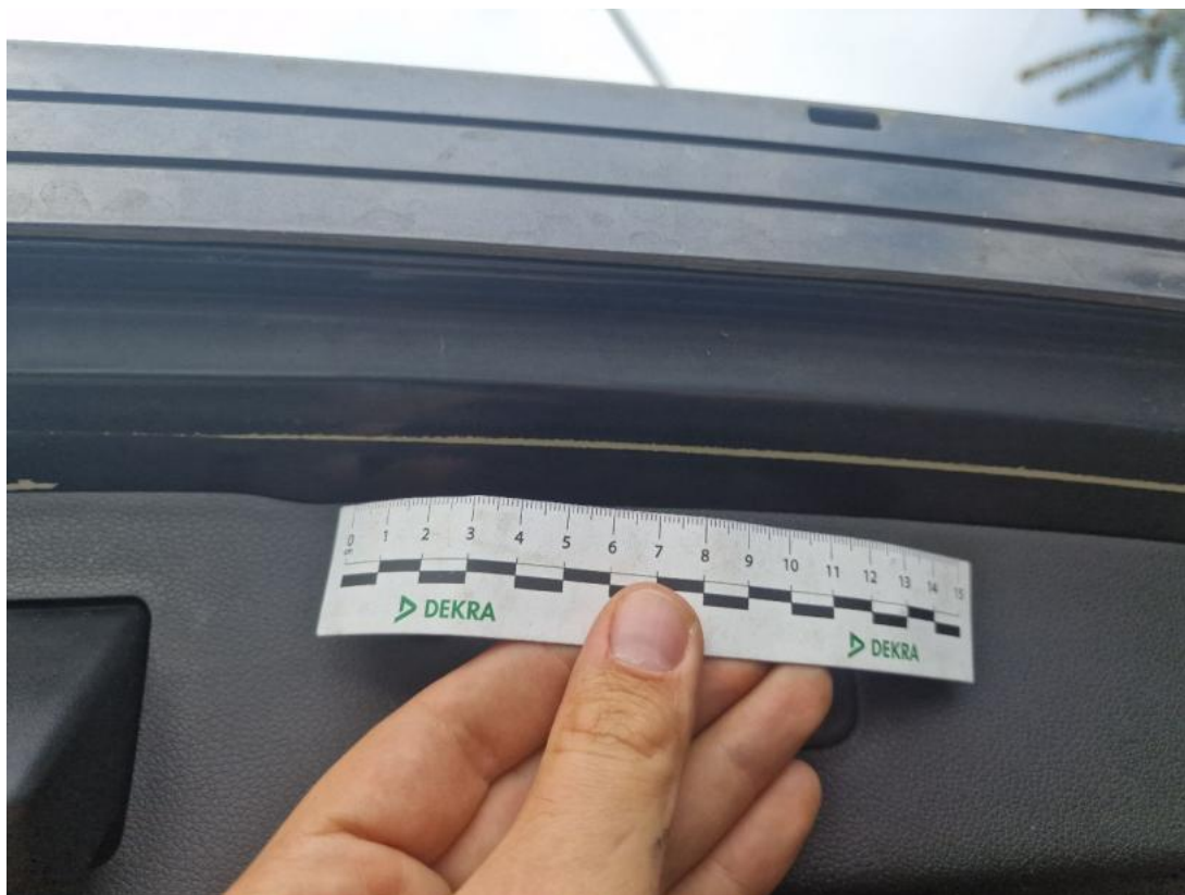
Fot. 43 Pokrywy bagażnika - zdjęcie poglądowe 2