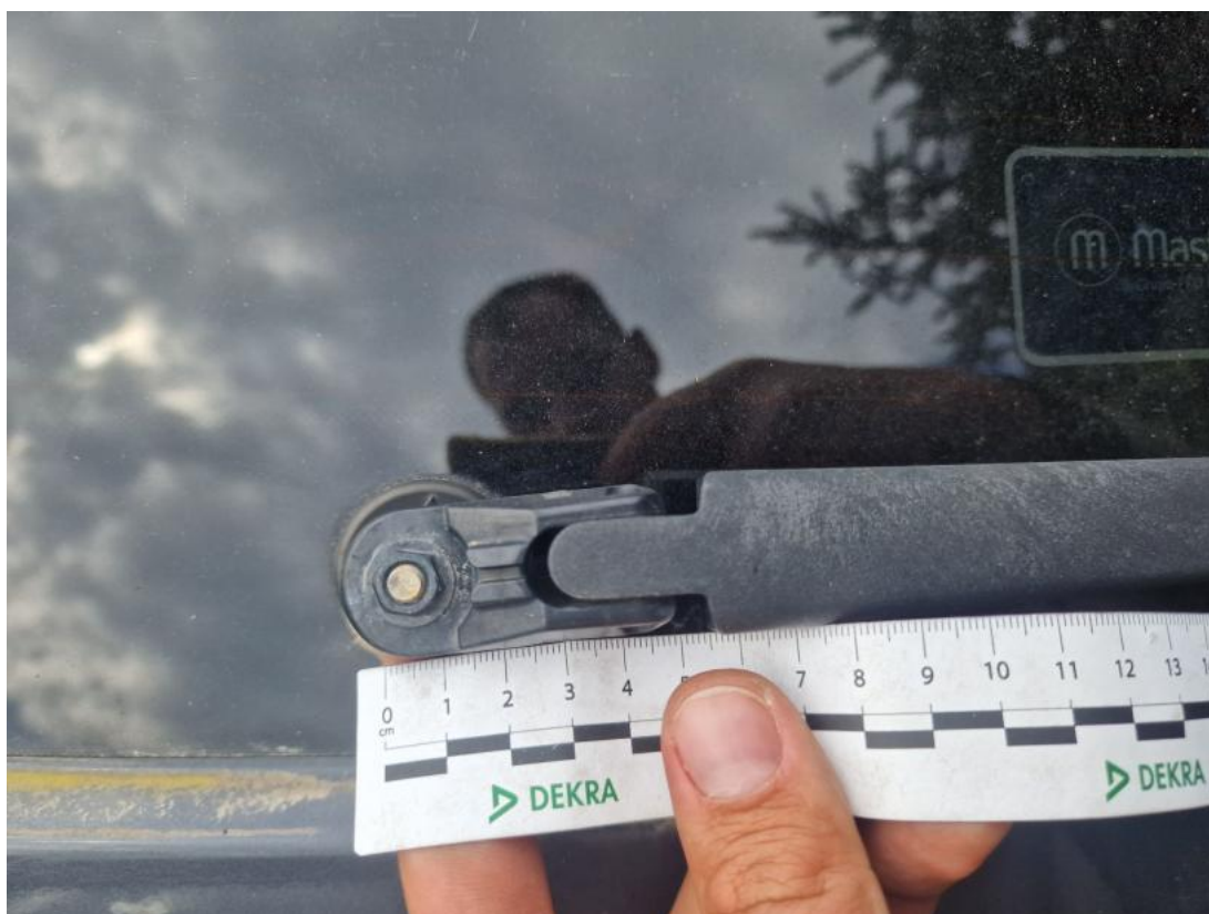
Fot. 46 Ramię wycieraczki tylnej - zdjęcie poglądowe 1