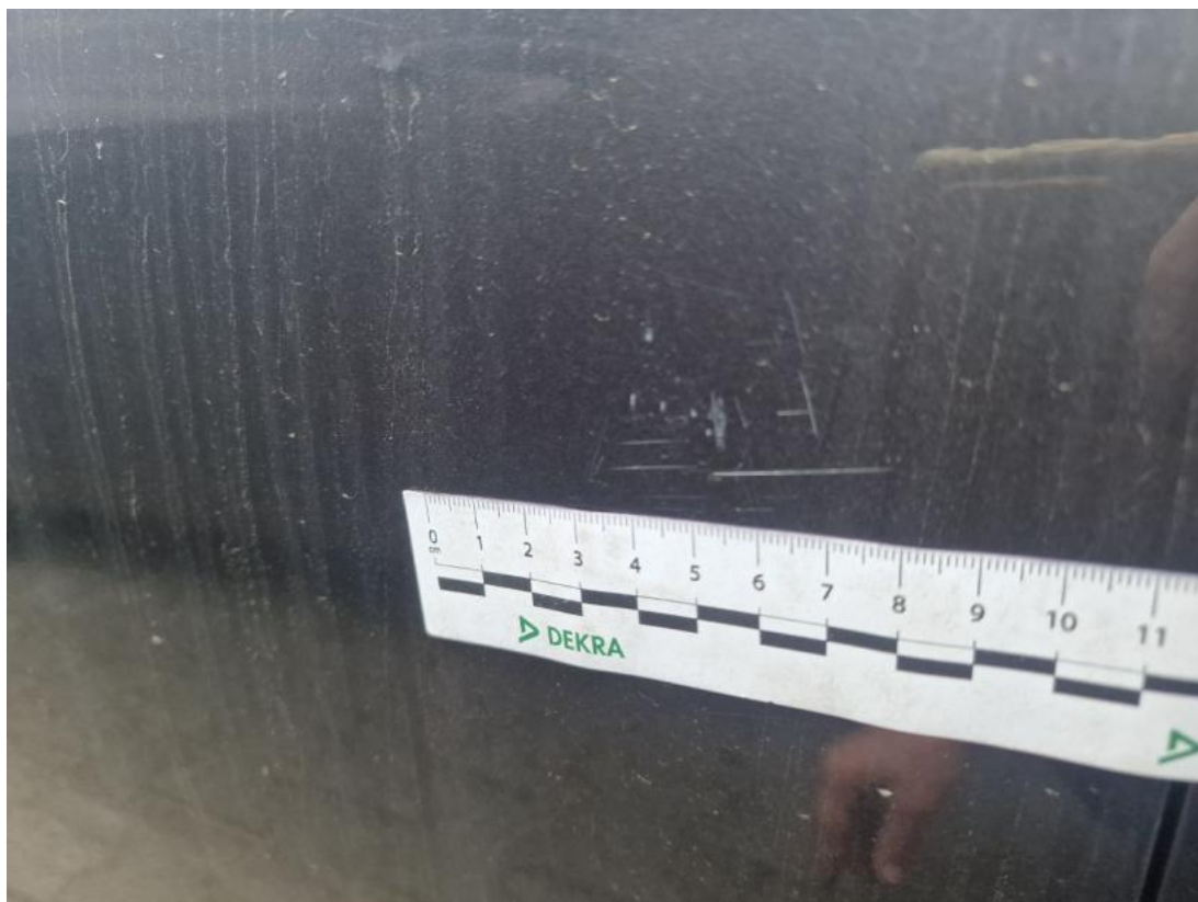
Fot. 59 Drzwi przed L - Rysa/odprysk 1