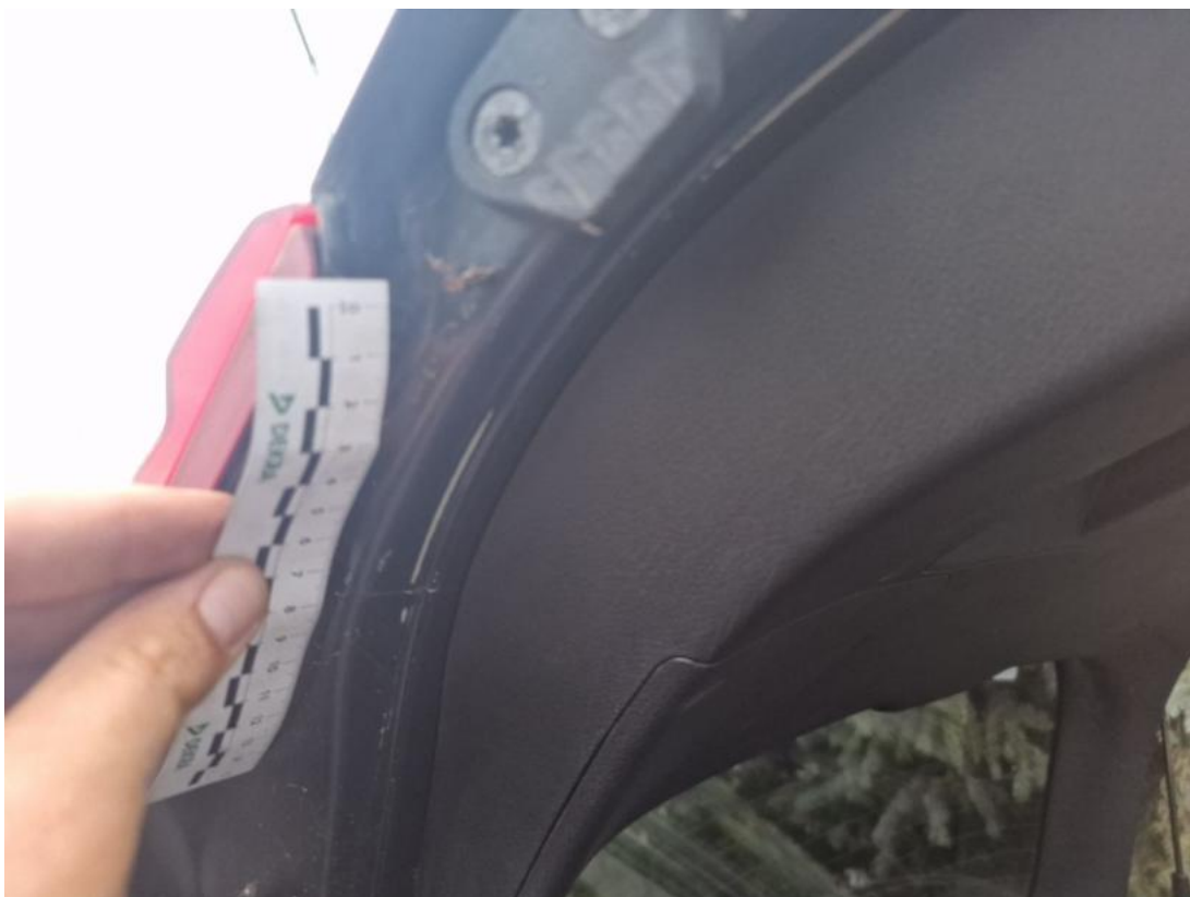
Fot. 45 Pokrywy bagażnika() - Rysa/odprysk 3