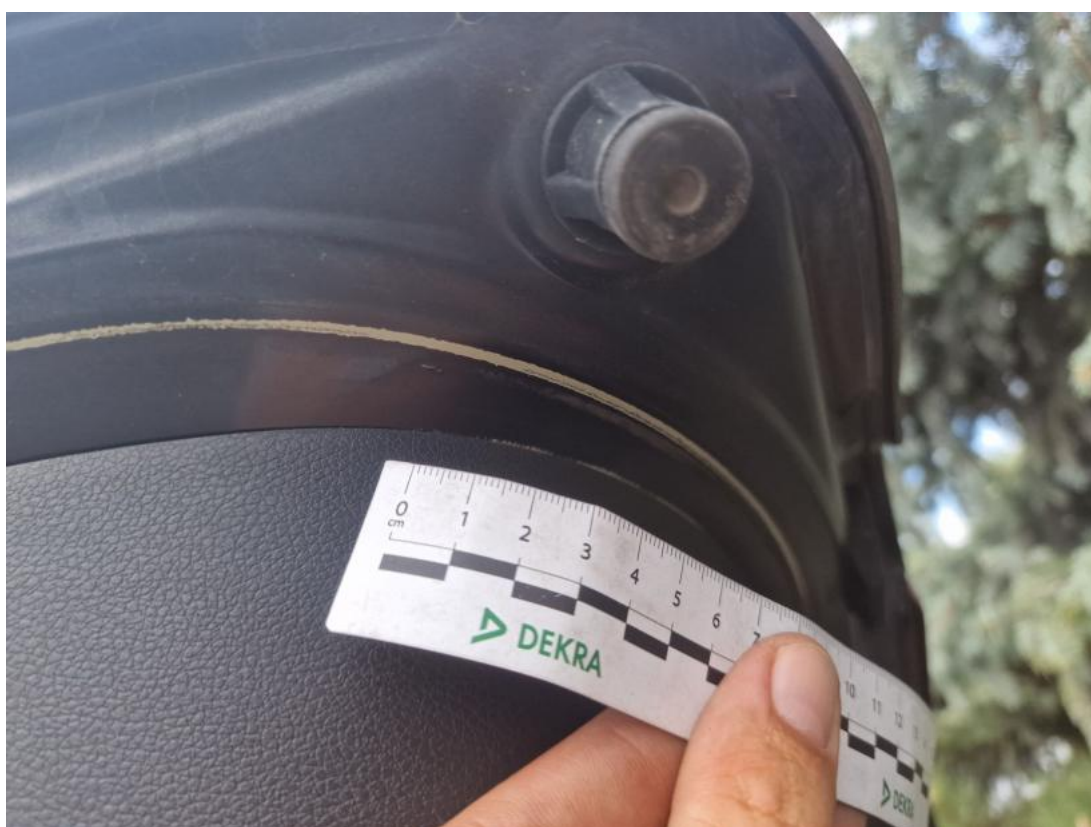
Fot. 42 Pokrywy bagażnika - zdjęcie poglądowe 1