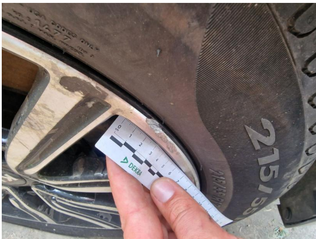
Fot. 40 Felga aluminiowa przednia P() - Rysa/odprysk 3