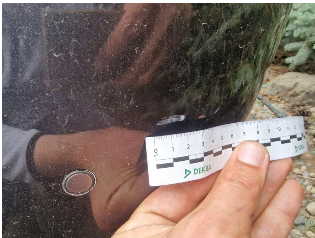
Fot. 48 Zderzak tylny - zdjęcie poglądowe 1