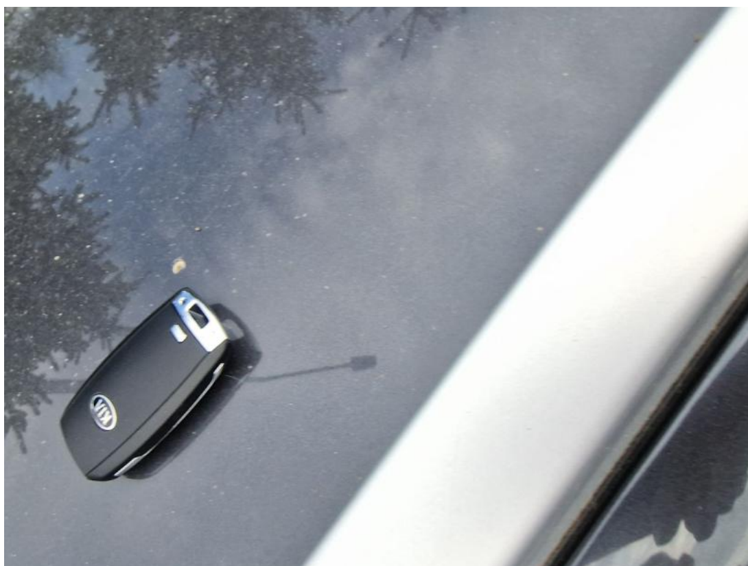
Fot. 32 Zdjęcie do protokołu