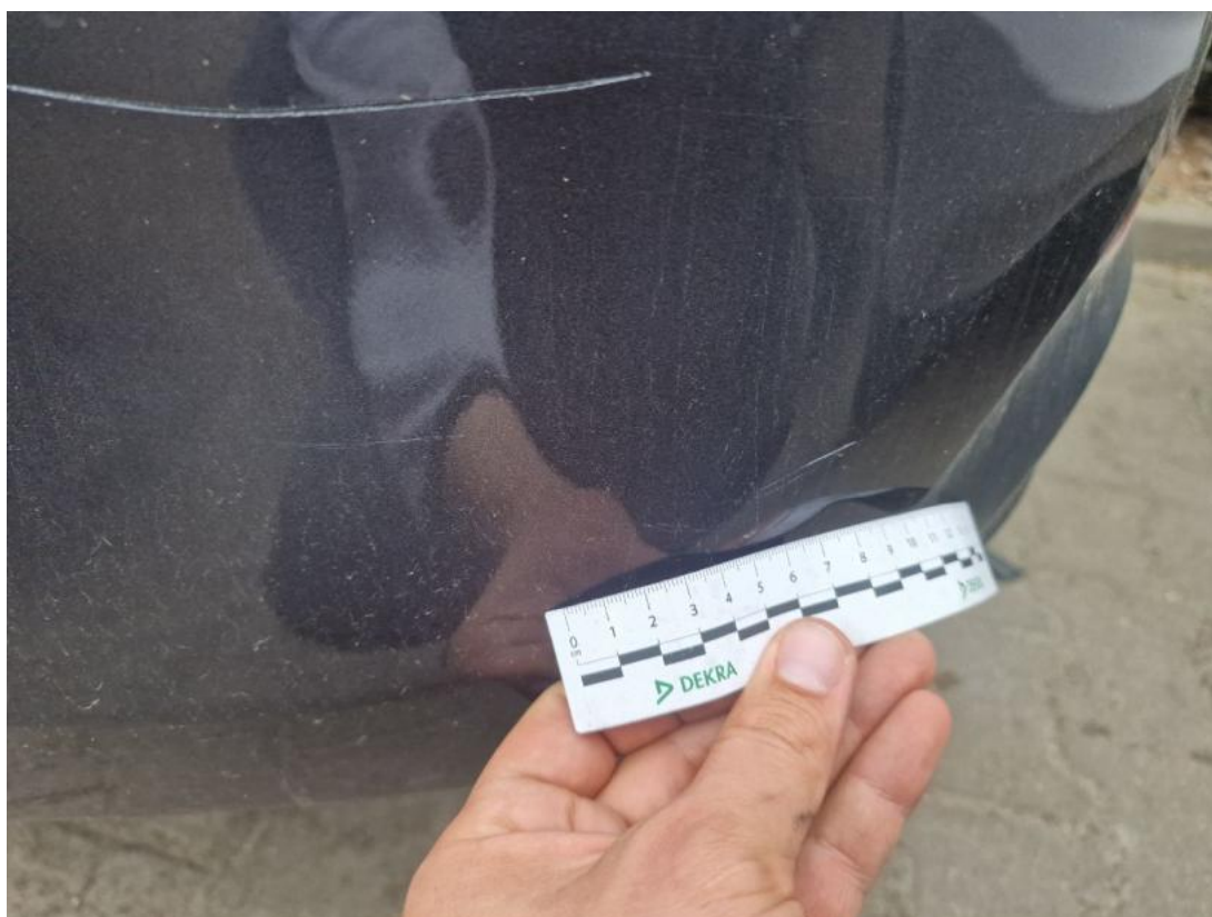
Fot. 52 Zderzak tylny() - Rysa/odprysk 3