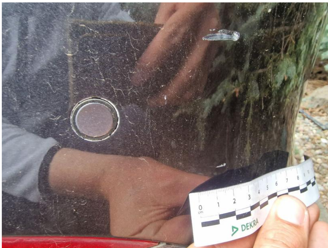
Fot. 49 Zderzak tylny - zdjęcie poglądowe 2