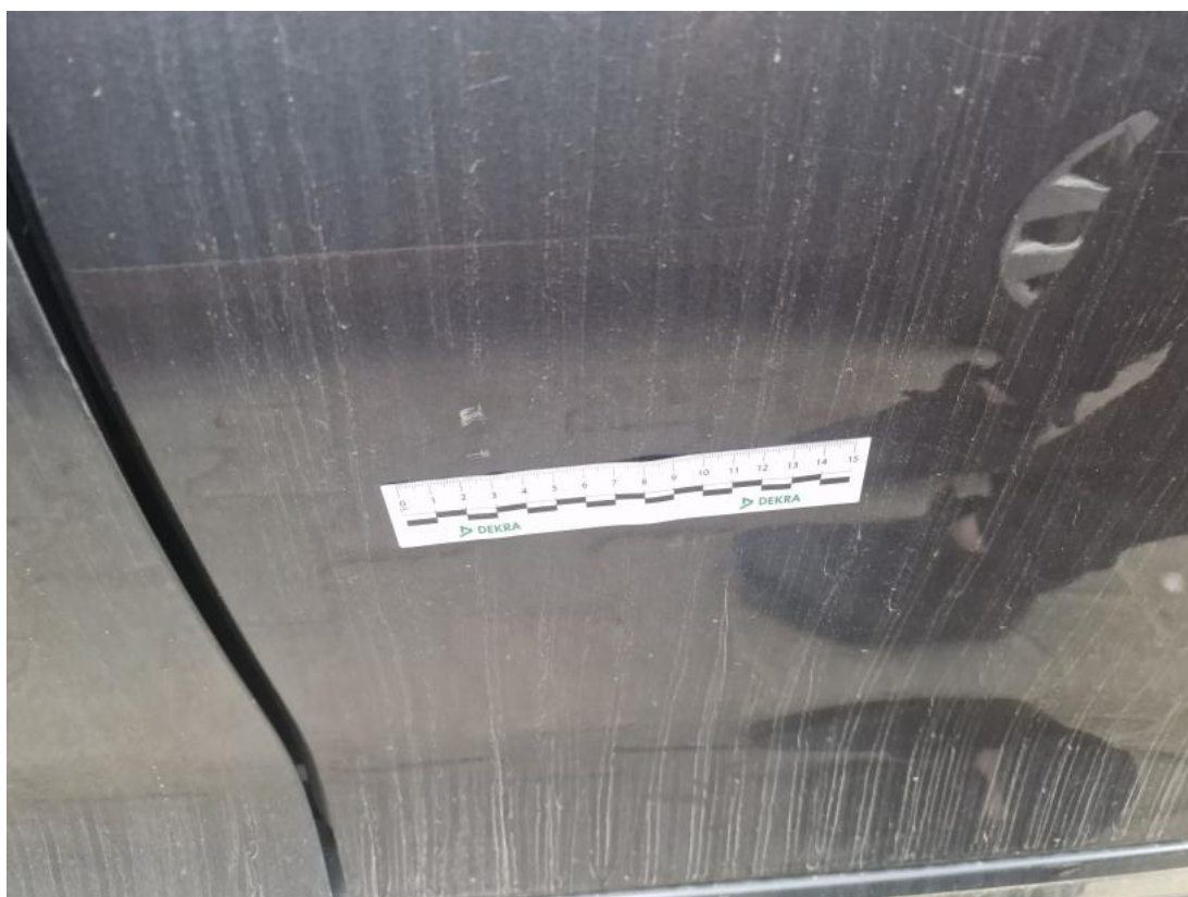
Fot. 60 Drzwi tylne L - zdjęcie pogładowe 1