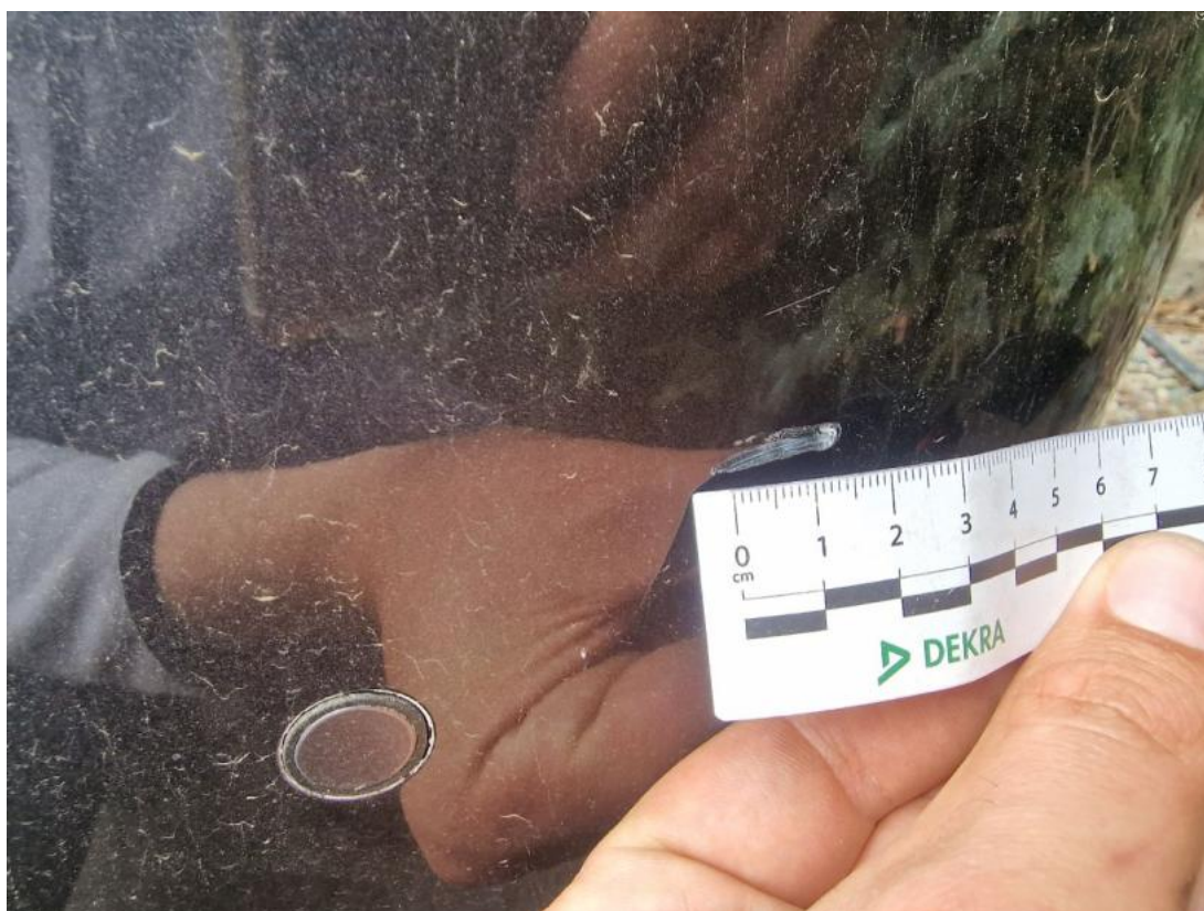
Fot. 50 Zderzak tylny - Rysa/odprysk 1