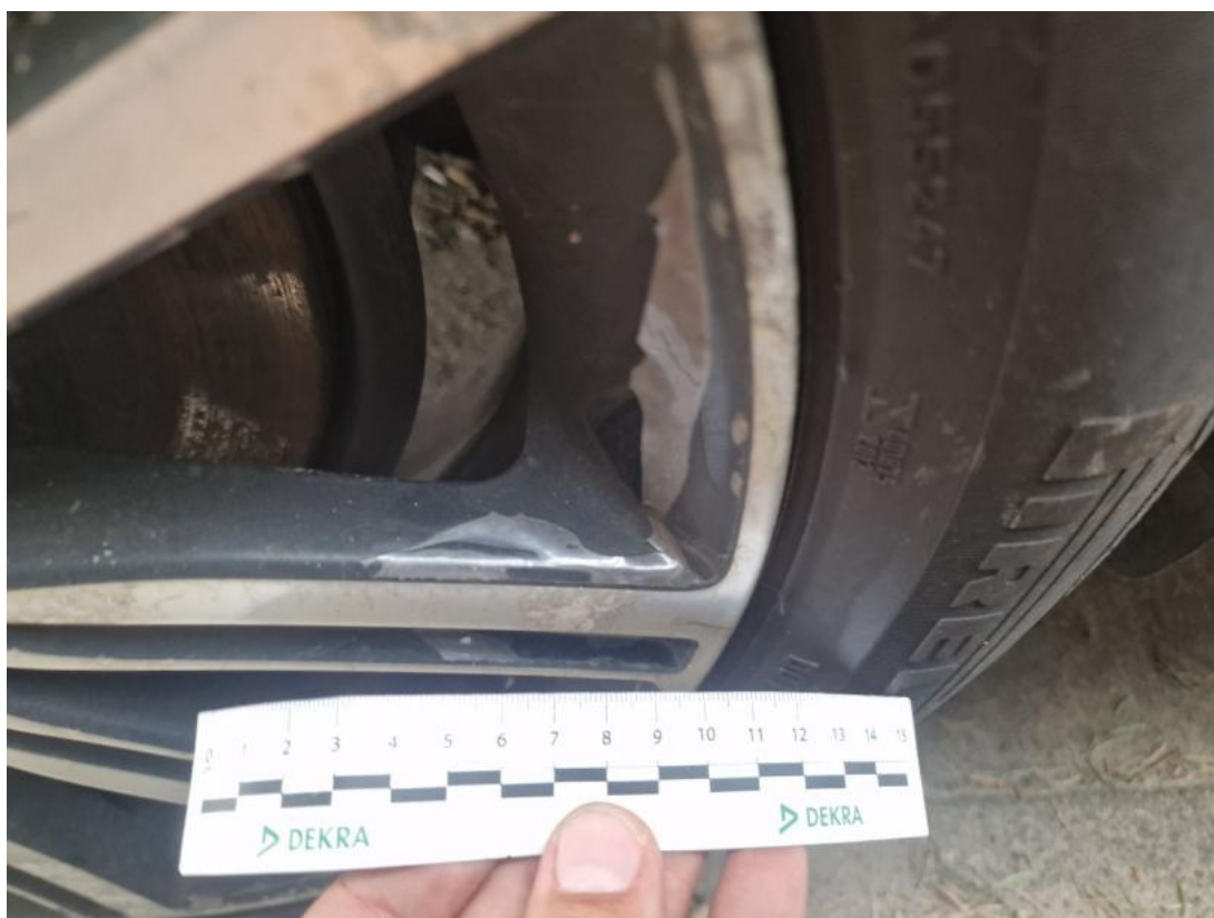
Fot. 38 Felga aluminiowa przednia P - zdjęcie poglądowe 2