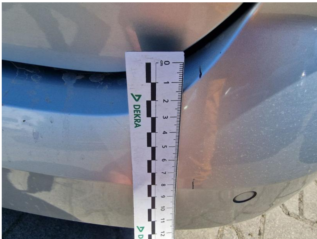
Fot. 51 Zderzak tylny - Rysa/odprysk 1