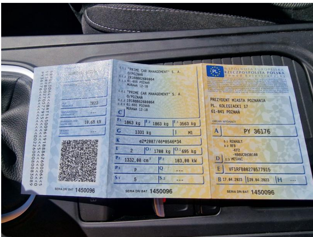
Fot. 32 Dowód rej. Str. 1