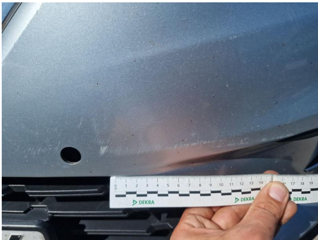
Fot. 41 Zderzak - Rysa/odprysk 1