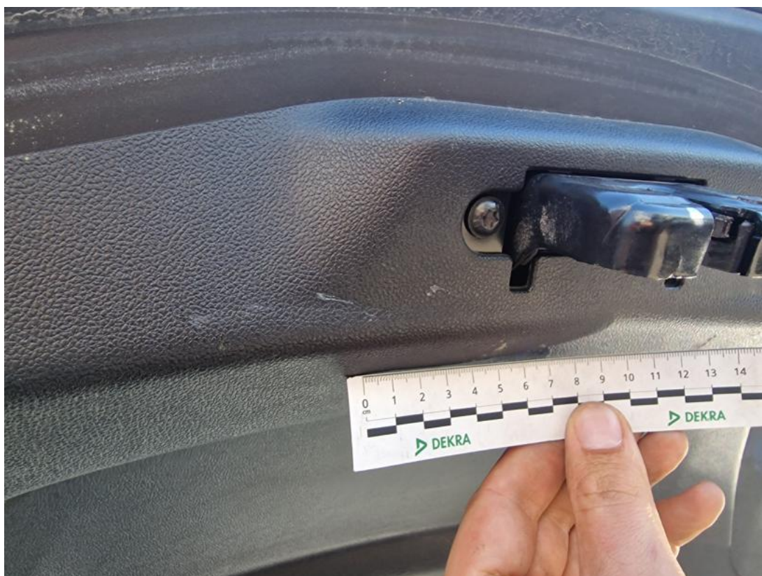
Fot. 52 Wykładzina pokrywy tylnej - zdjęcie poglądowe 1