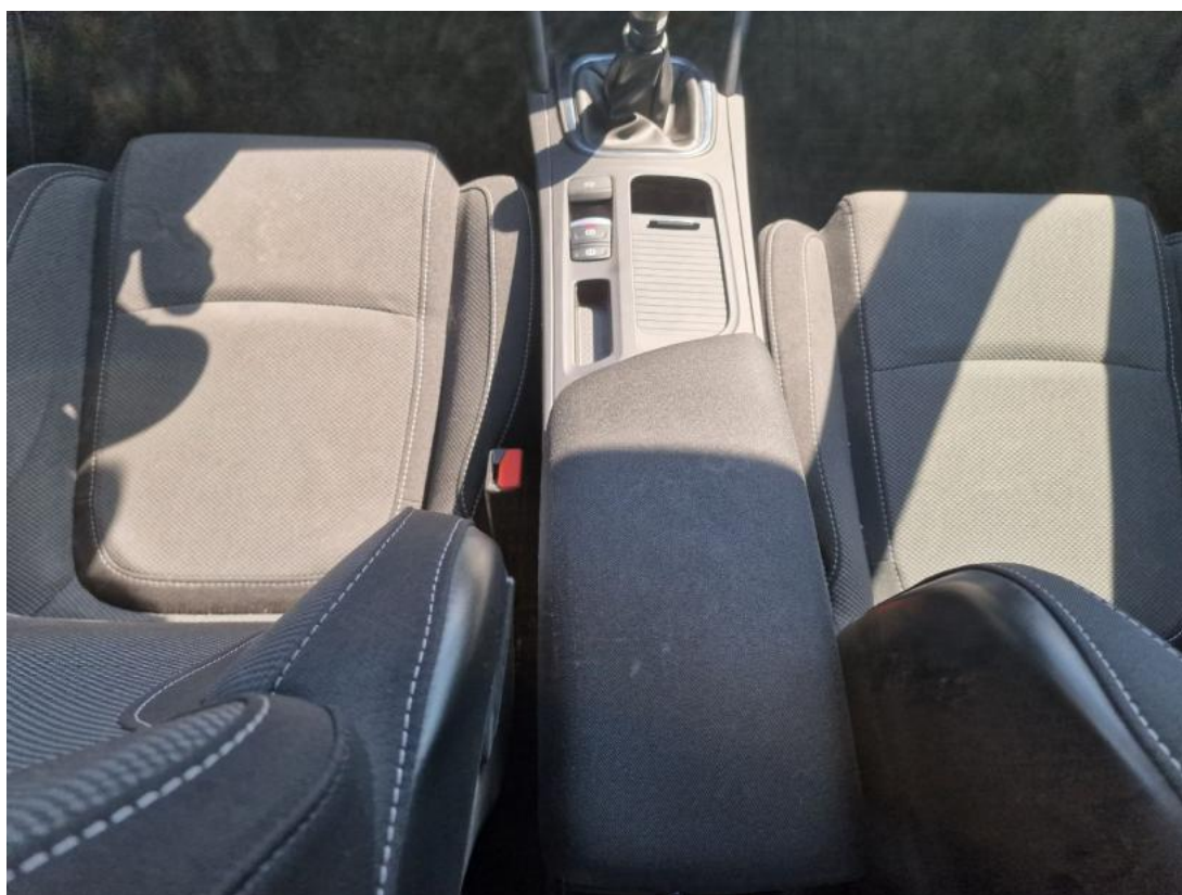
Fot. 20 Tunel środkowy