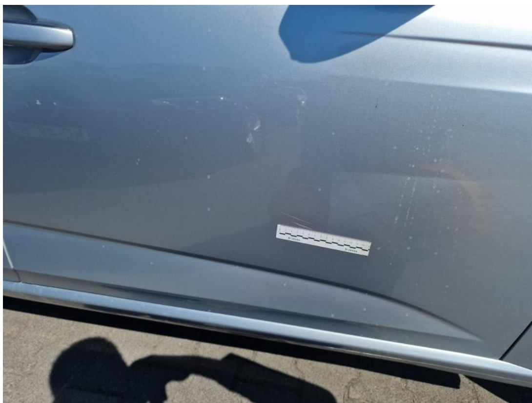
Fot. 42 Drzwi przednie P - zdjęcie poglądowe 1