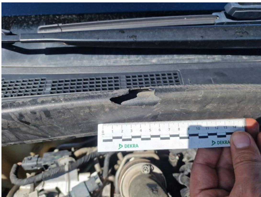
Fot. 34 Zdjęcie do protokołu