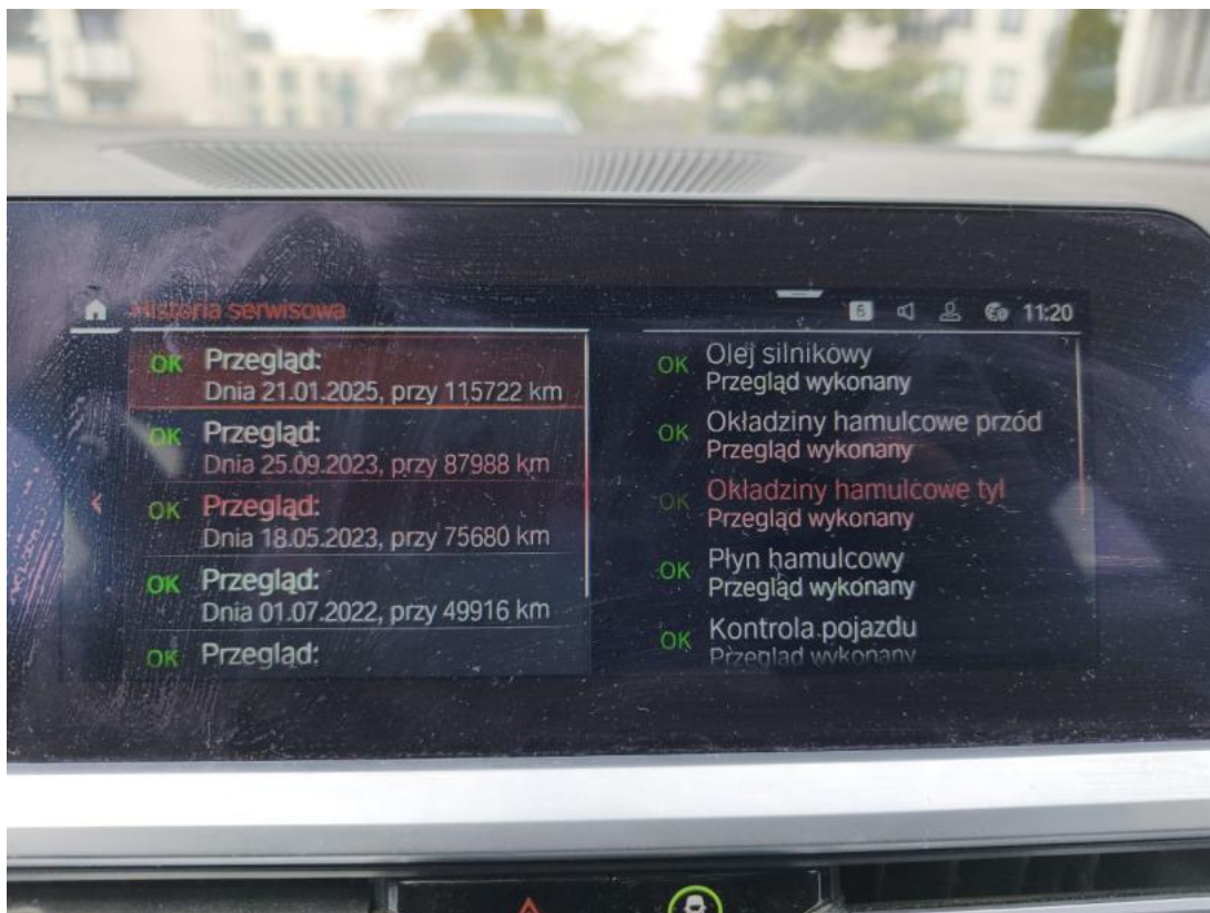
Fot. 37 serwis