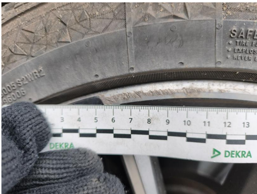
Fot. 47 Felga aluminiowa tylna L() - Rysa/odprysk 3