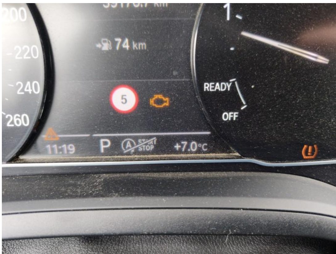
Fot. 36 kontrolka