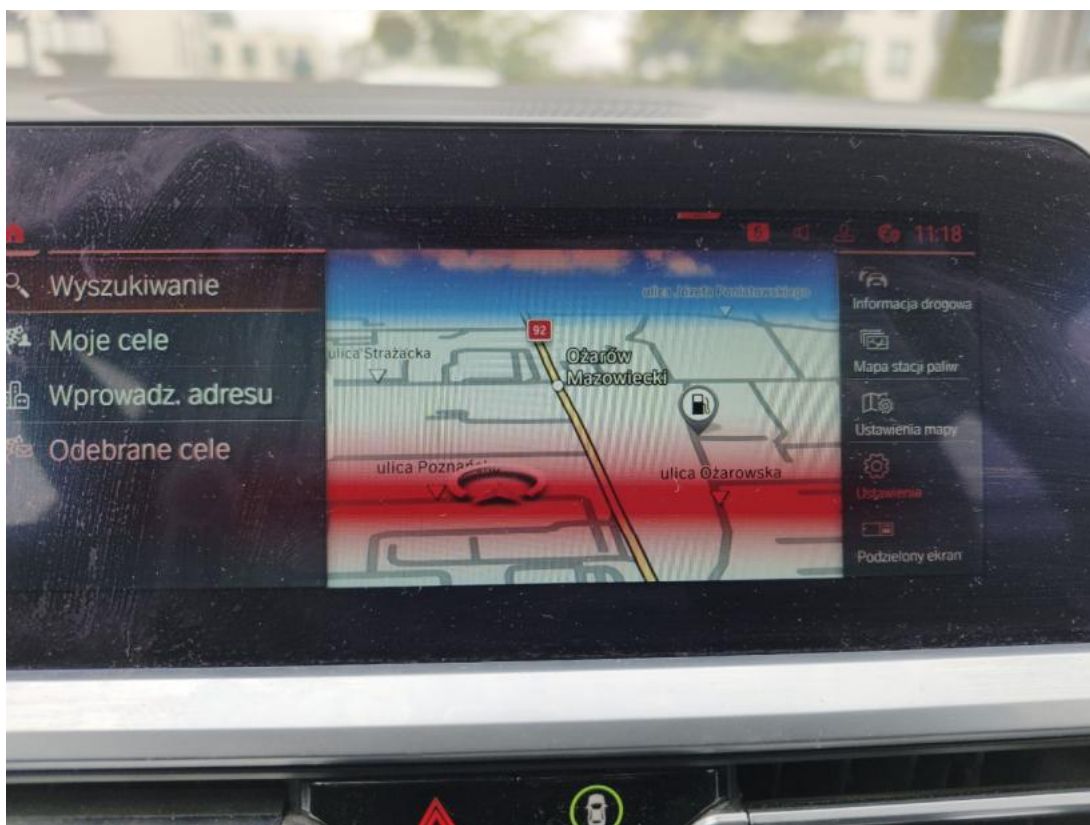
Fot. 34 nawigacja