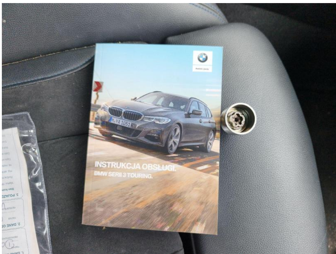
Fot. 32 Instrukcje