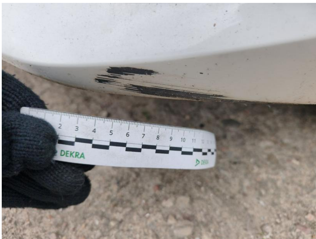
Fot. 42 Zderzak() - Rysa/odprysk 3