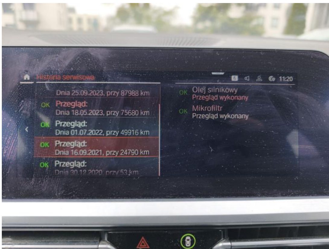
Fot. 38 serwis