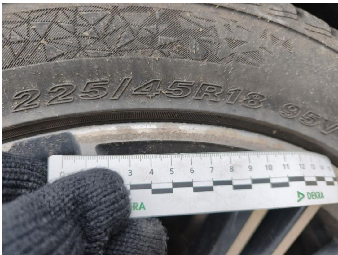
Fot. 44 Felga aluminiowa przednia P() - Rysa/odprysk 3