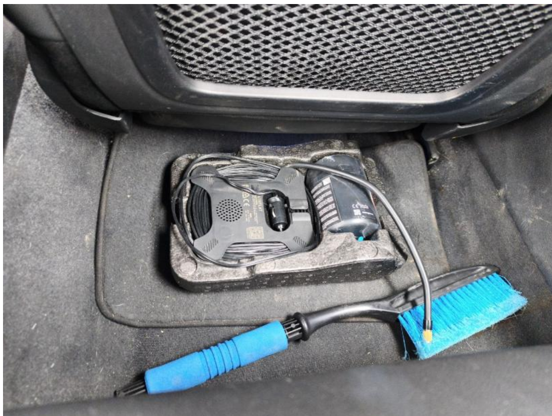
Fot. 33 Zestaw naprawczy koła