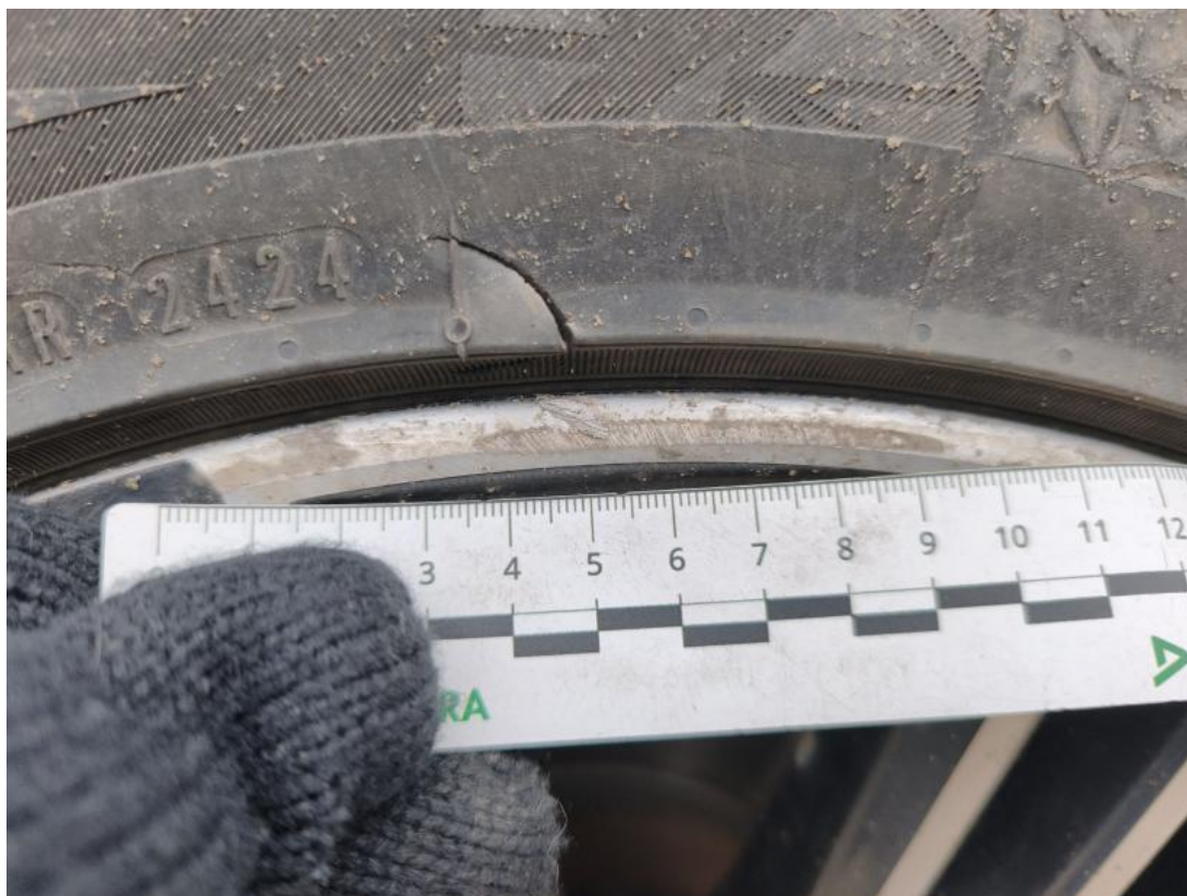
Fot. 43 Felga aluminiowa przednia P - Rysa/odprysk 1