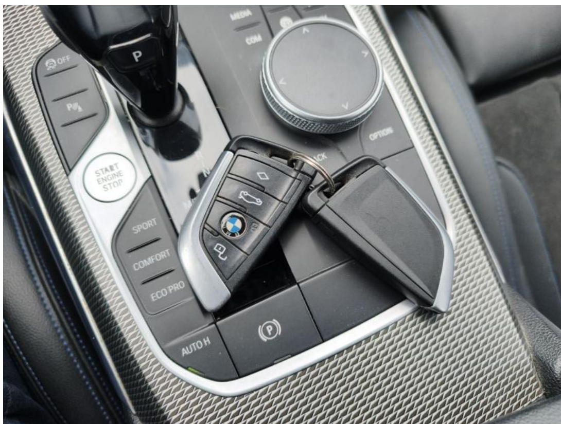
Fot. 35 klucze