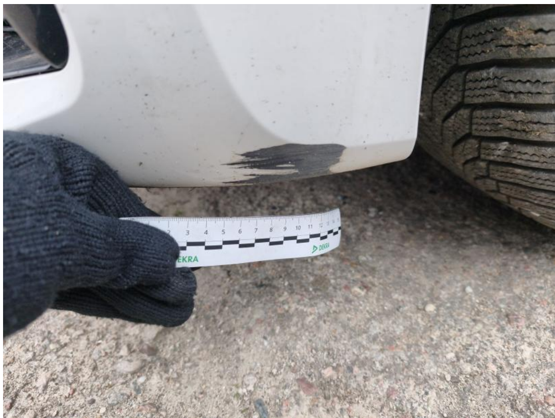
Fot. 41 Zderzak - Rysa/odprysk 1