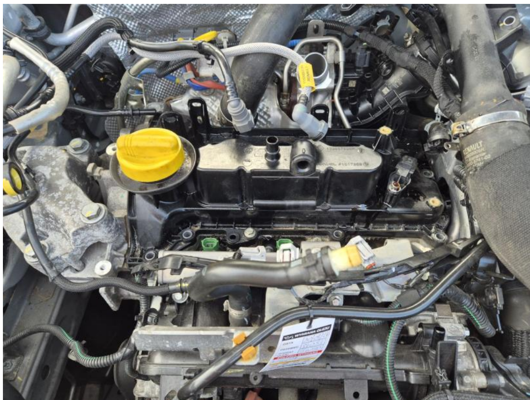
Fot. 37 Zdjęcie do protokołu