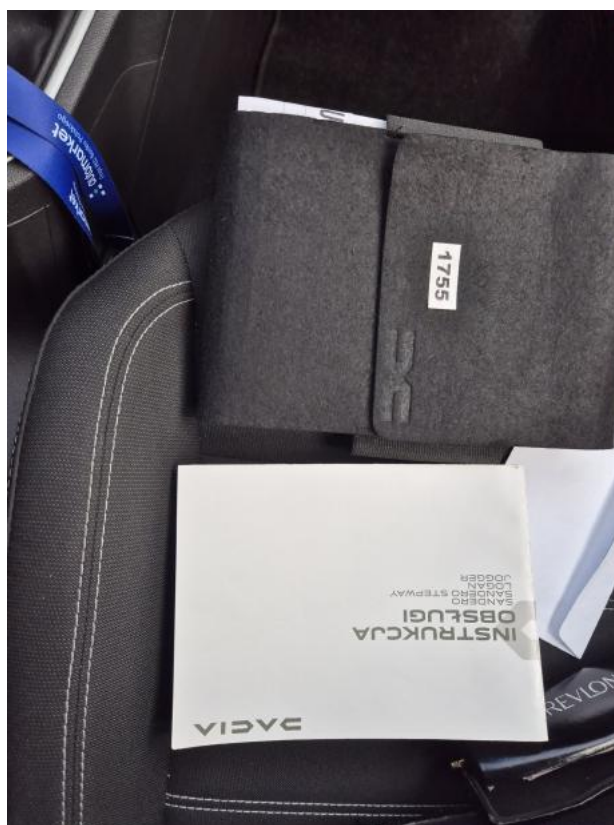
Fot. 35 Instrukcje