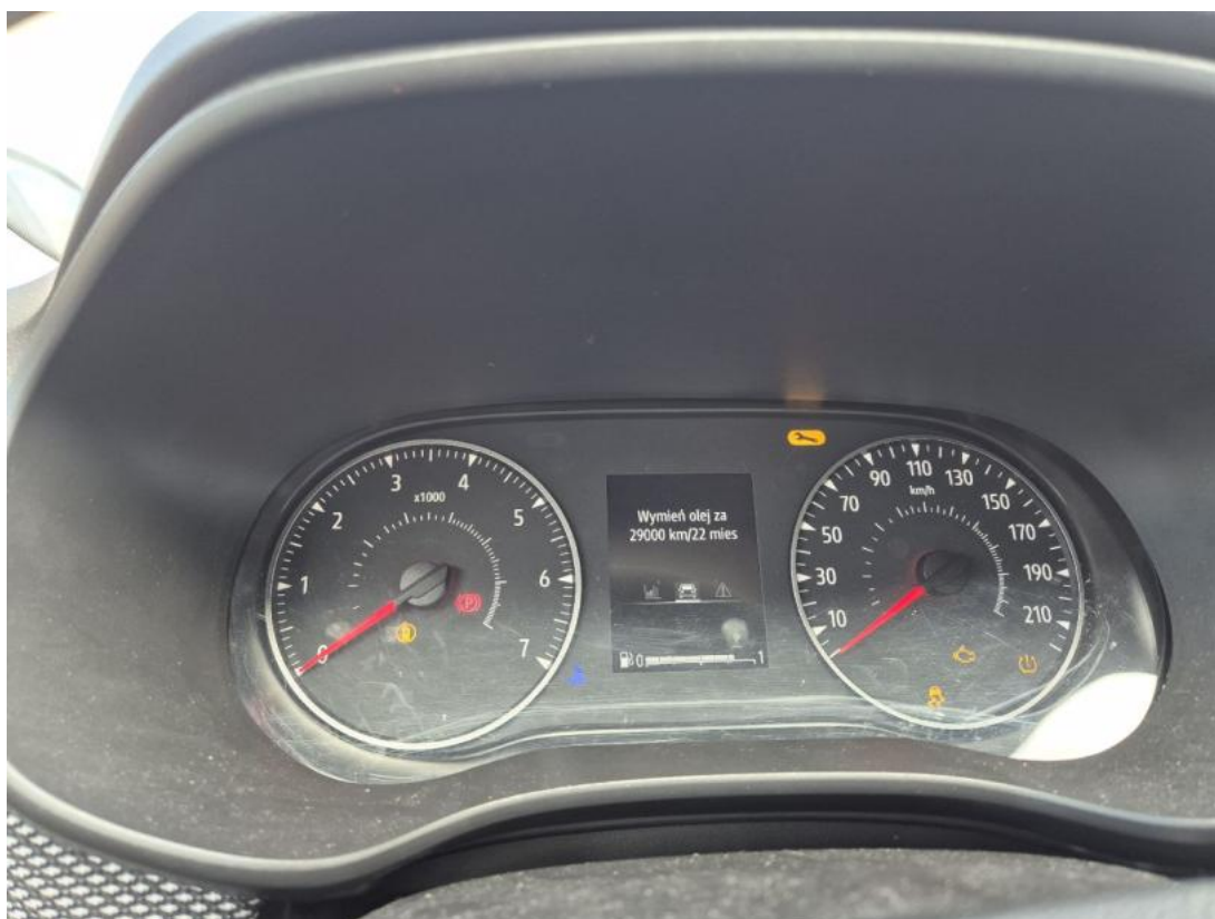
Fot. 16 Zestaw wskaźników - serwis