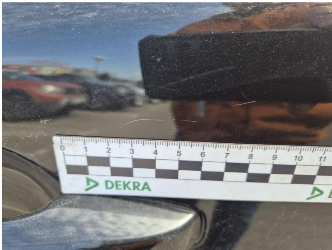
Fot. 41 Drzwi tylne L - Rysa/odprysk 1