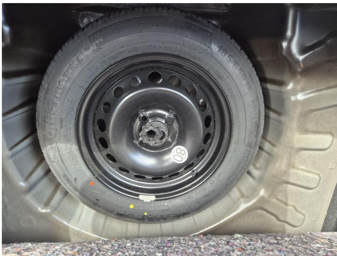
Fot. 26 Koło zapasowe