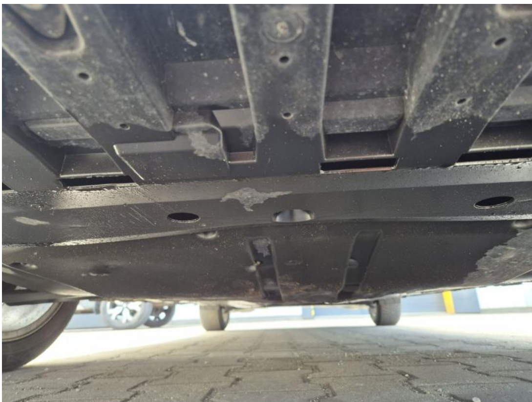
Fot. 27 Spód pojazdu przód