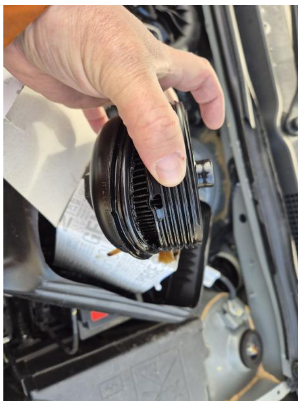
Fot. 36 Zdjęcie do protokołu