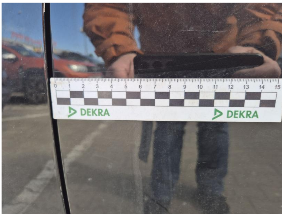
Fot. 42 Drzwi tylne L - Rysa/odprysk 2