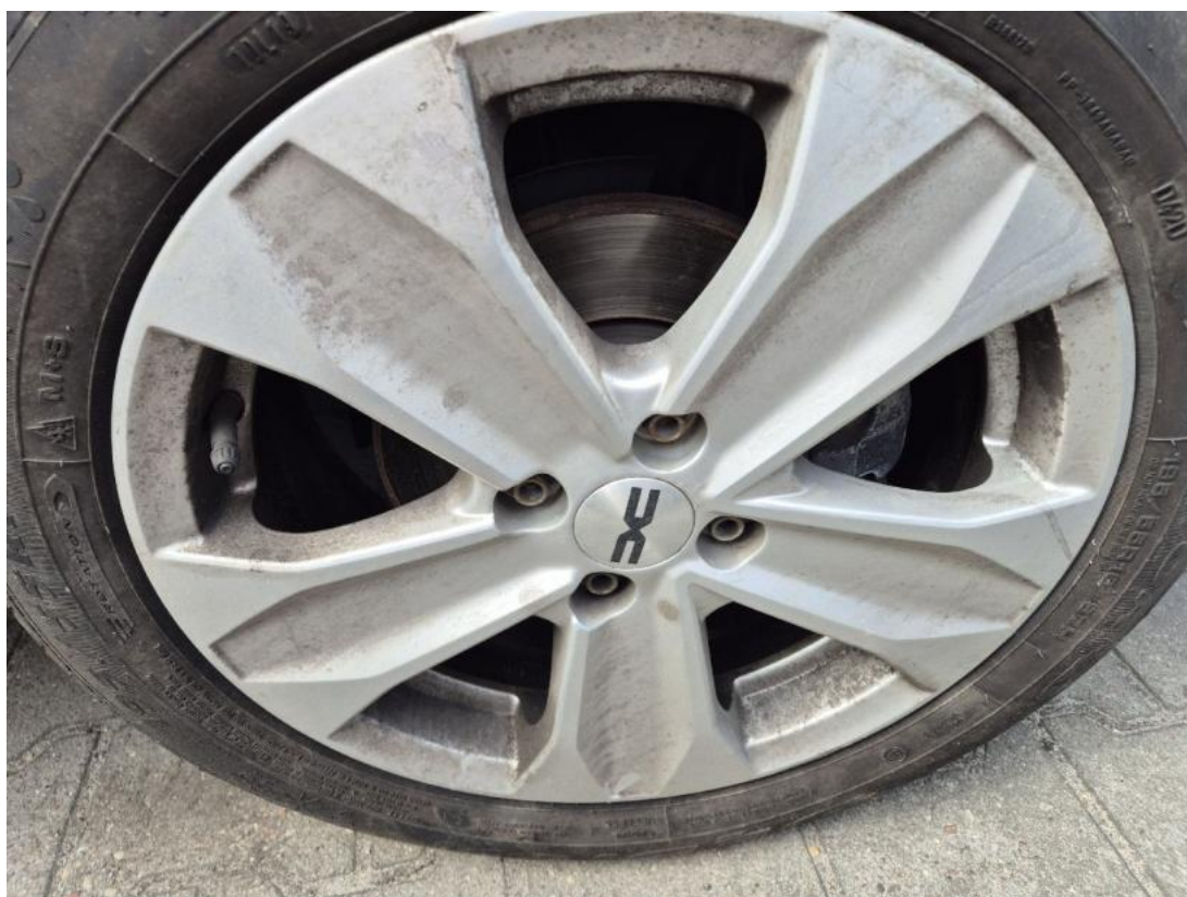
Fot. 30 Tarcza hamulcowa przednia prawa