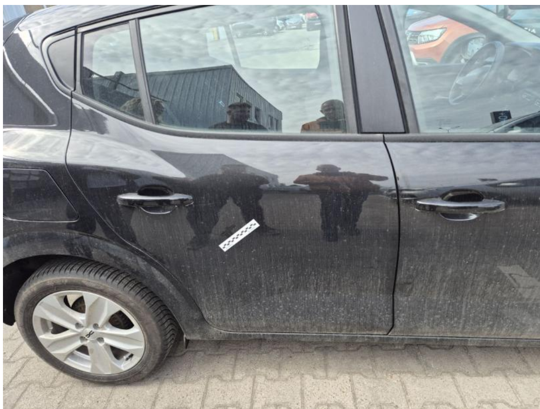
Fot. 38 Drzwi tylne P - zdjęcie poglądowe 1