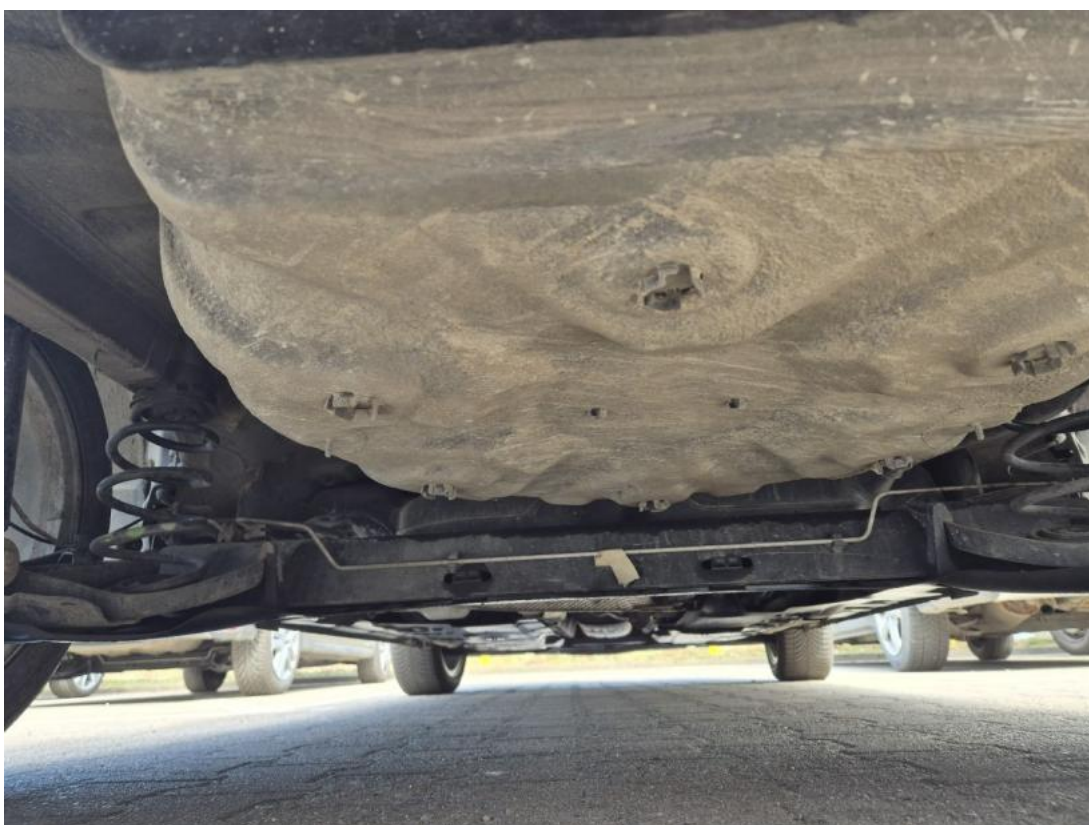
Fot. 28 Spód pojazdu tył