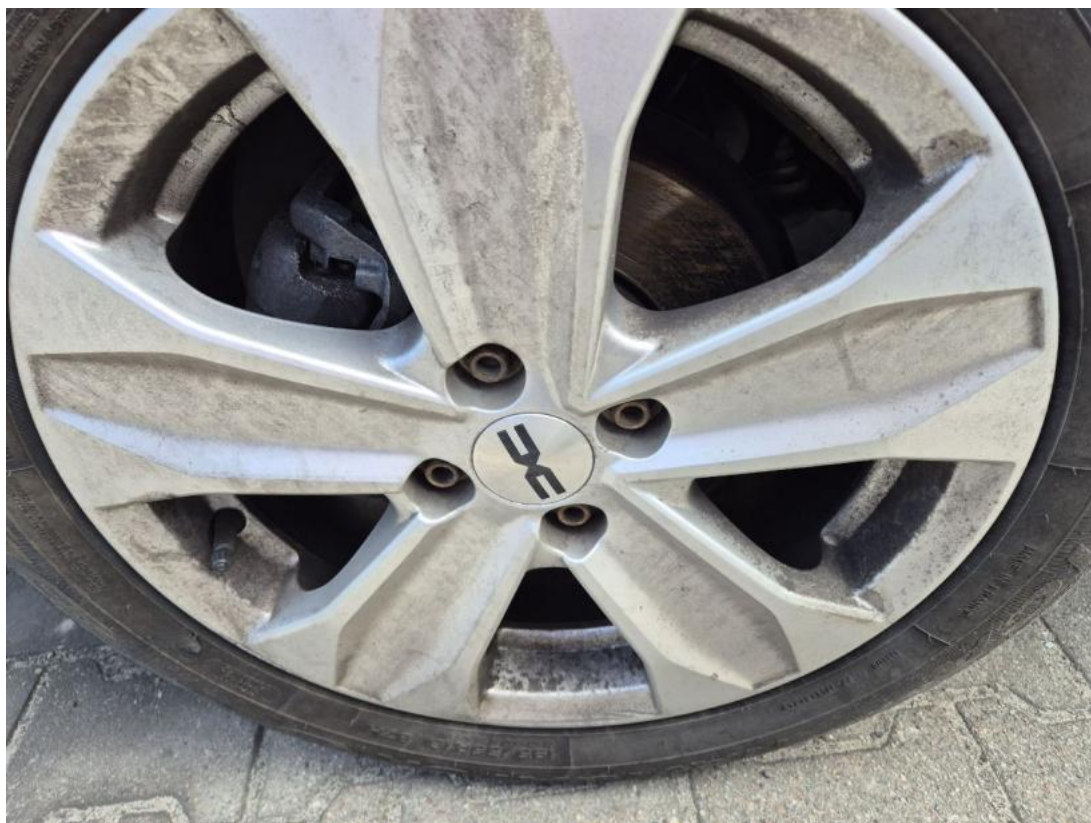
Fot. 29 Tarcza hamulcowa przednia lewa