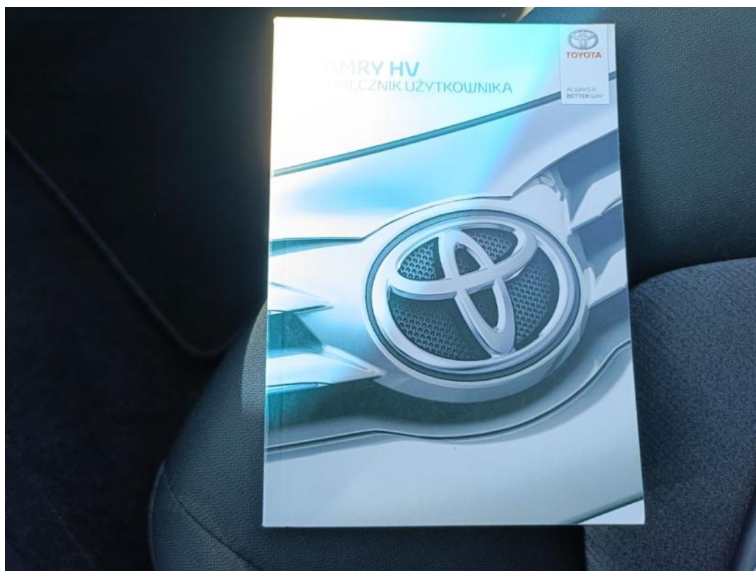
Fot. 36 Instrukcje