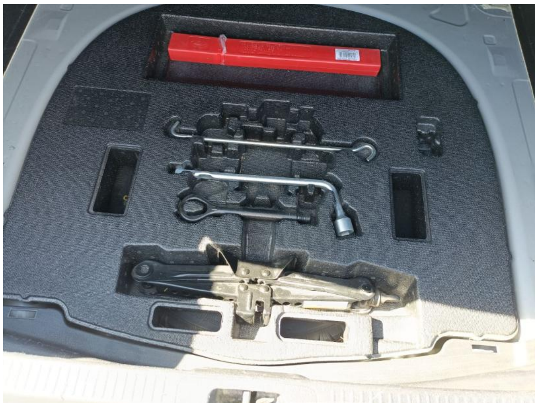
Fot. 37 Zdjęcie do protokołu