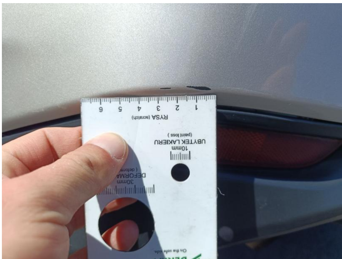
Fot. 52 Zderzak tylny cz L - Rysa/odprysk 1