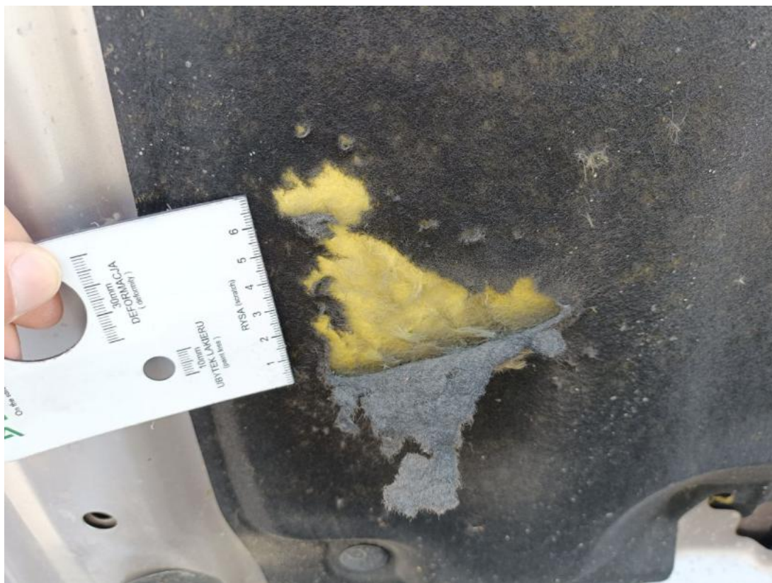
Fot. 45 Wykładzina pokrywy komory silnika - Pęknięcie/rozerwanie 1