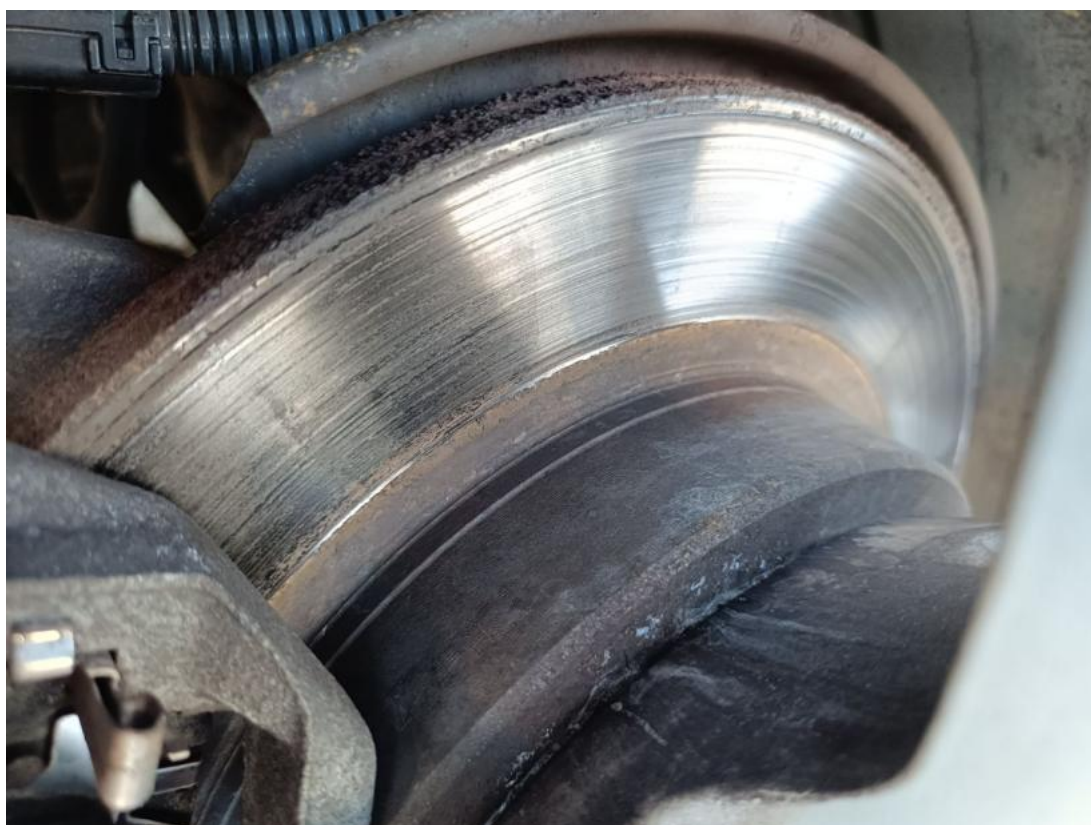
Fot. 30 Tarcza hamulcowa tylna prawa