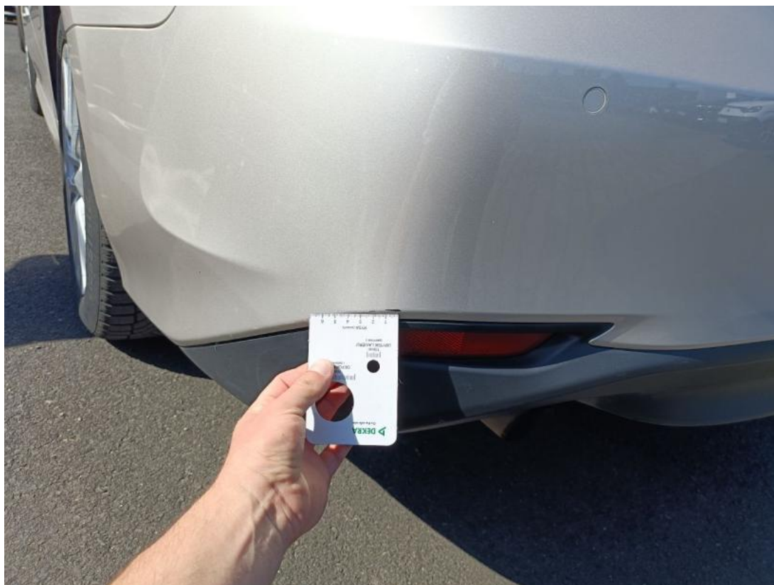
Fot. 51 Zderzak tylny cz L - zdjęcie poglądowe 2