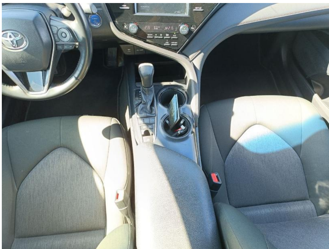
Fot. 20 Tunel środkowy