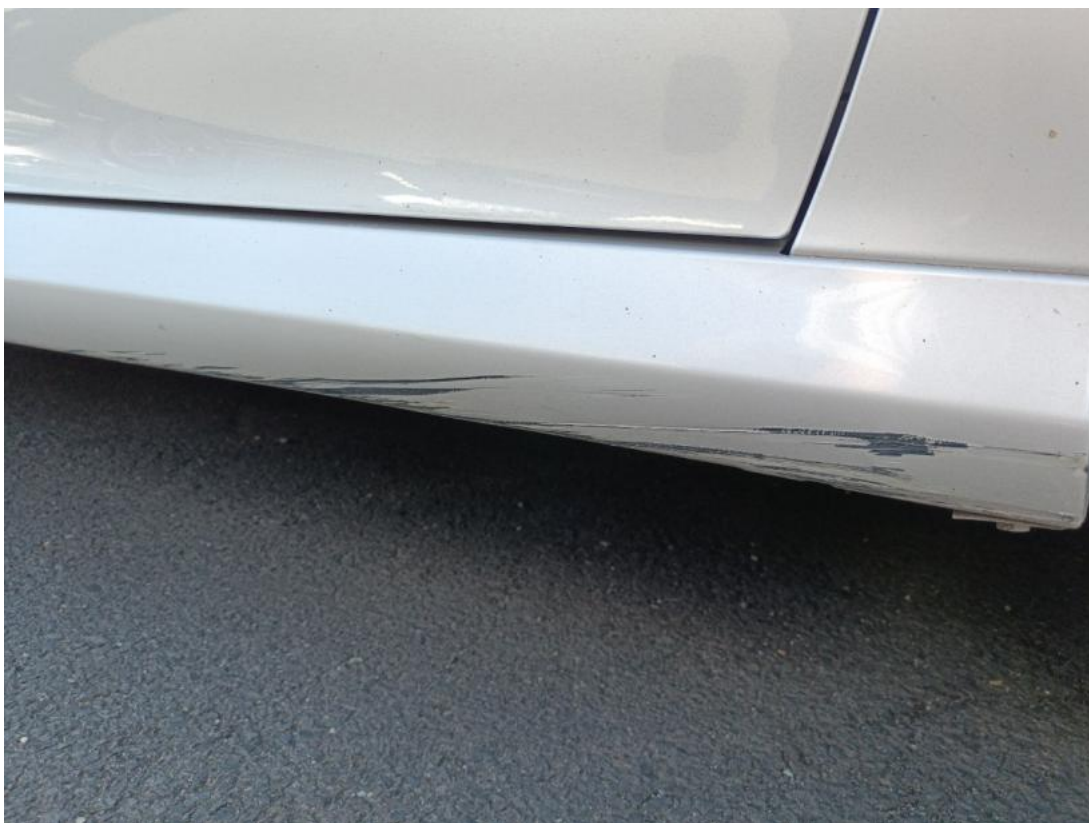
Fot. 49 Próg P - Rysa/odprysk 2