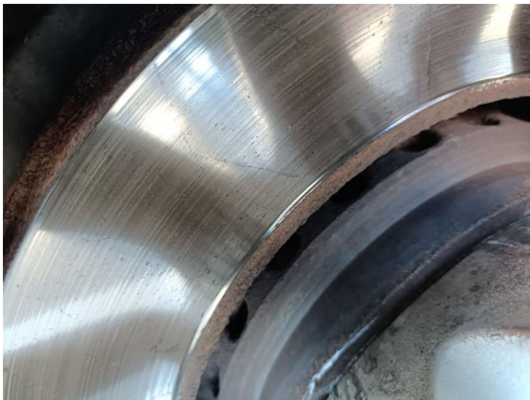
Fot. 29 Tarcza hamulcowa przednia prawa