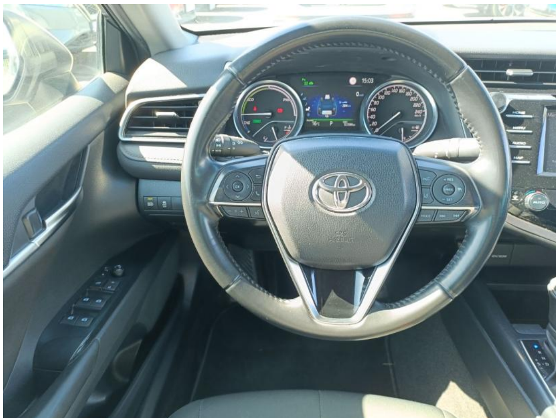
Fot. 21 Kierownica (na wprost)