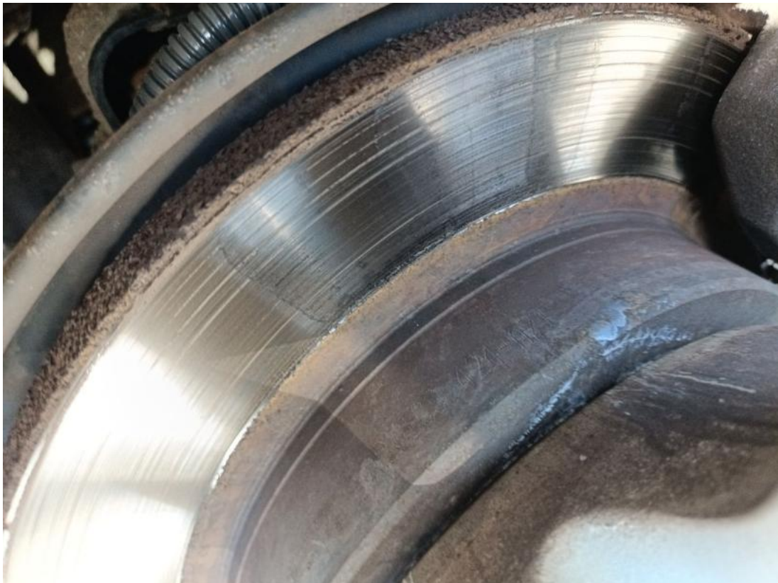
Fot. 31 Tarcza hamulcowa tylna lewa