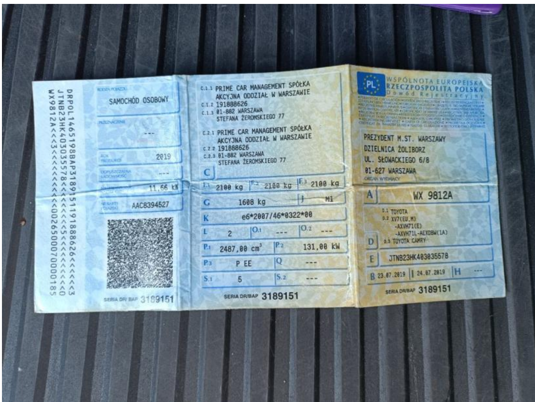
Fot. 32 Dowód rej. Str. 1