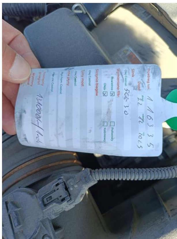
Fot. 38 Zdjęcie do protokołu