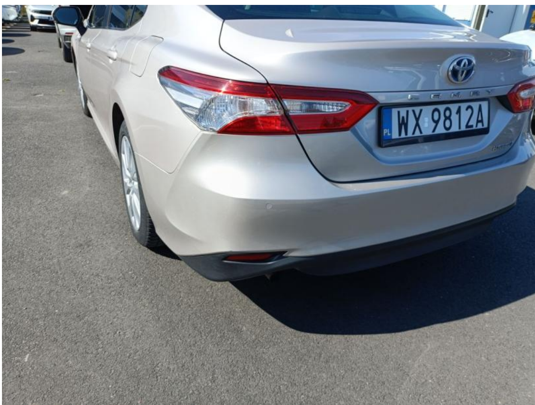
Fot. 50 Zderzak tylny cz L - zdjęcie poglądowe 1