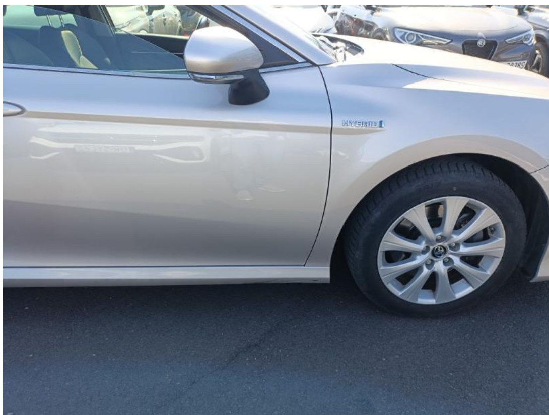
Fot. 46 Próg P - zdjęcie poglądowe 1