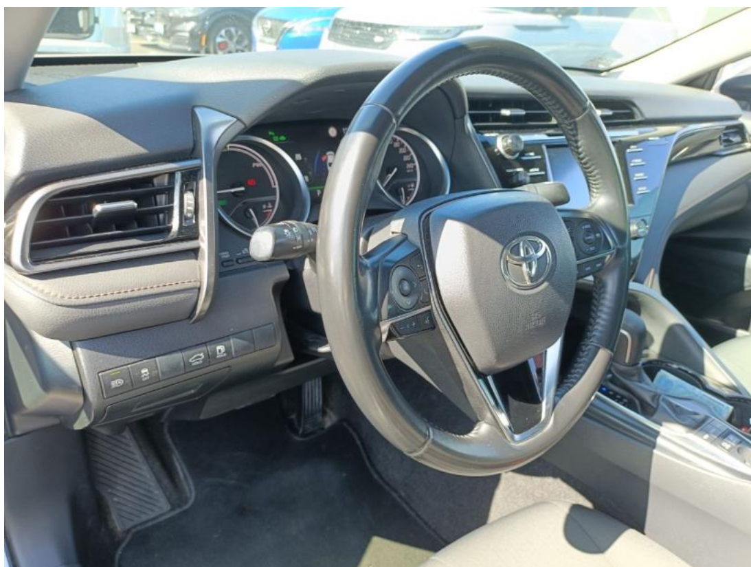
Fot. 22 Kierownica z lewej strony