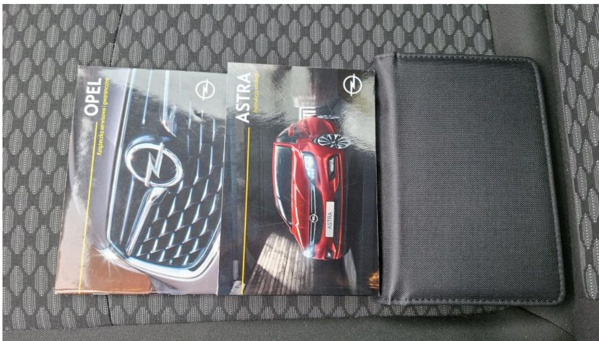
Fot. 36 Instrukcje