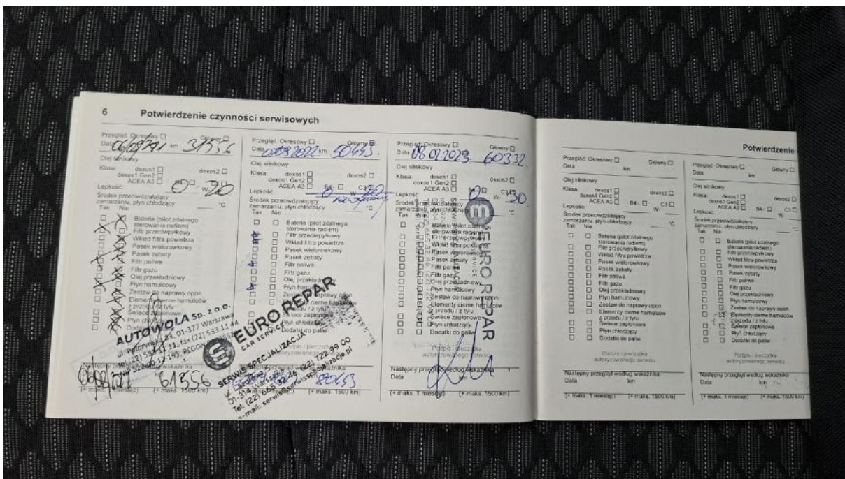
Fot. 35 Książka serwisowa – ostatni przegląd