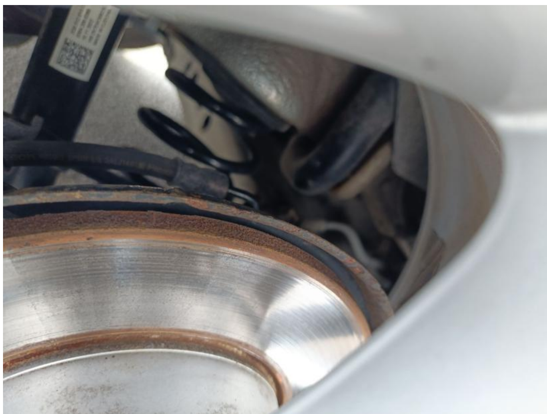
Fot. 30 Tarcza hamulcowa tylna prawa