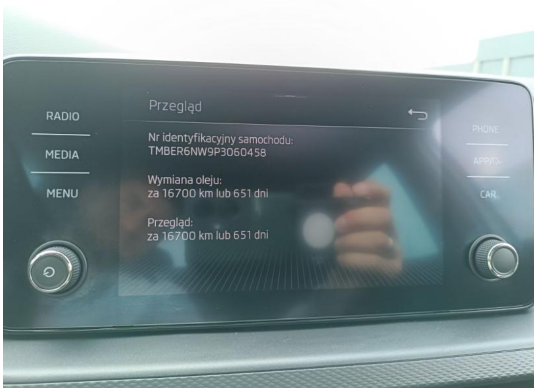
Fot. 34 Książka serwisowa – ostatni przegląd