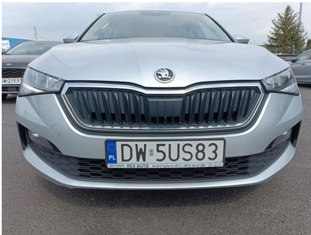
Fot. 36 Zderzak przedni cz dolna - zdjęcie poglądowe 1