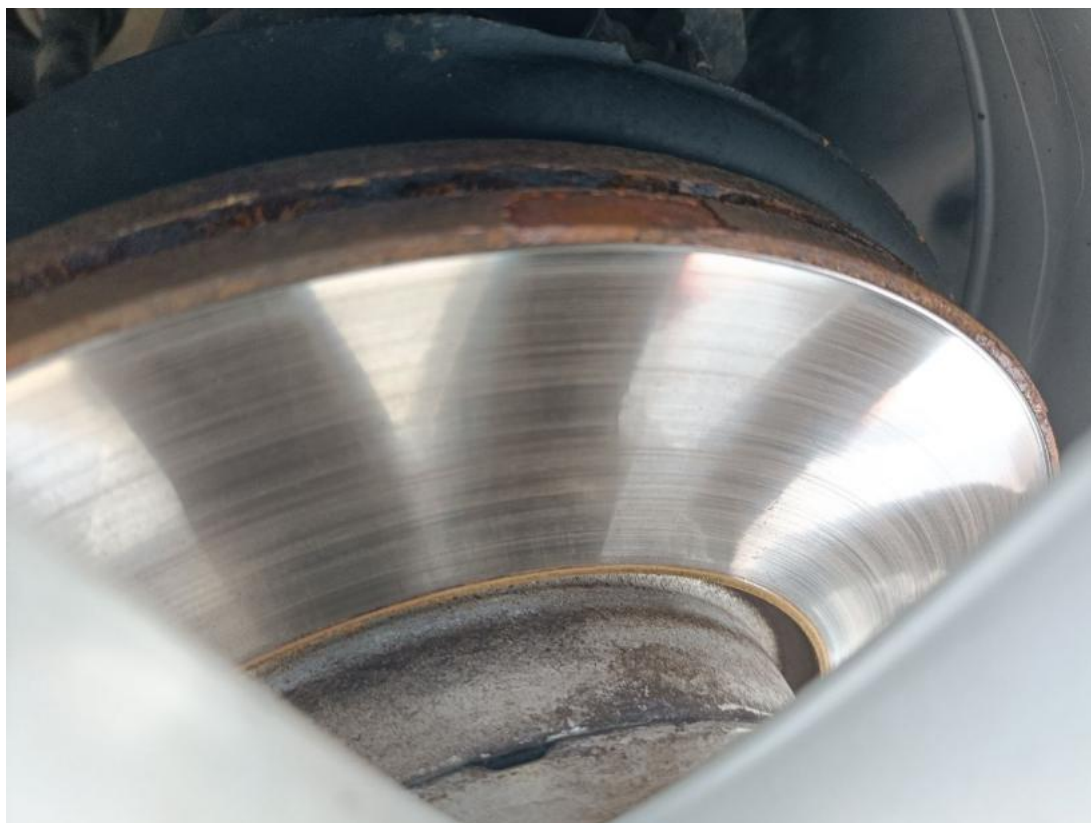
Fot. 29 Tarcza hamulcowa przednia prawa