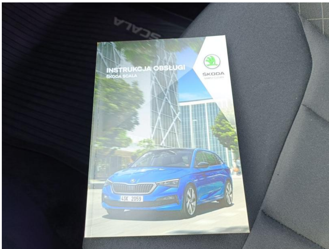
Fot. 35 Instrukcje