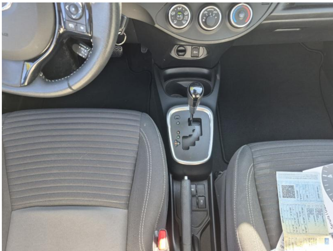
Fot. 21 Tunel środkowy