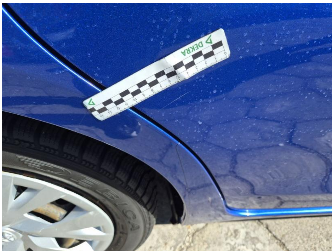
Fot. 42 Drzwi tylne P - Rysa/odprysk 2