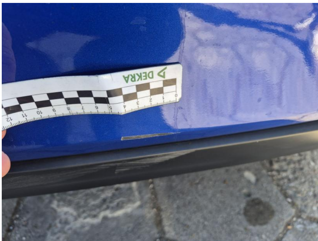
Fot. 44 Zderzak tylny - Rysa/odprysk 1