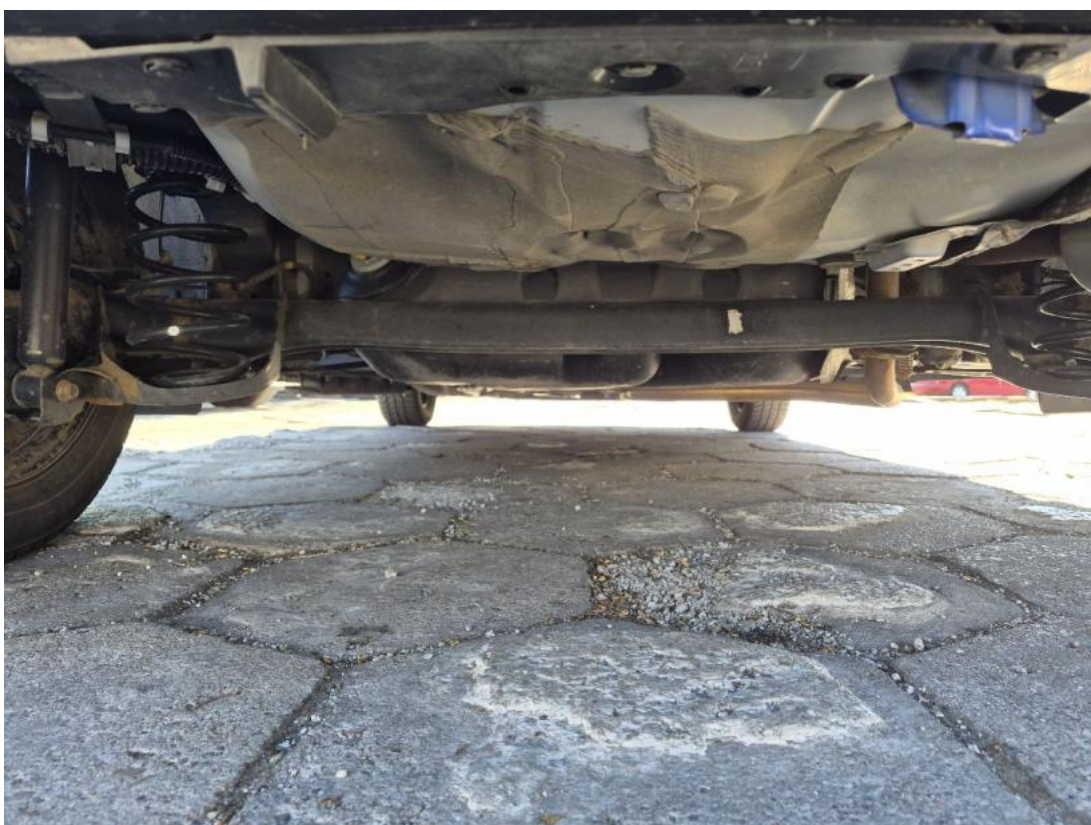
Fot. 28 Spód pojazdu tył