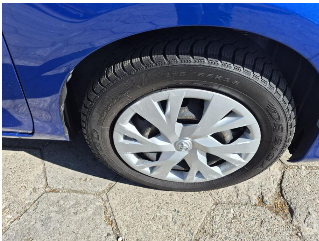
Fot. 30 Tarcza hamulcowa przednia prawa