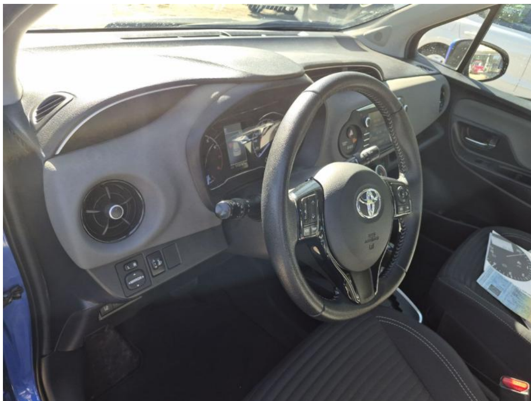
Fot. 23 Kierownica z lewej strony