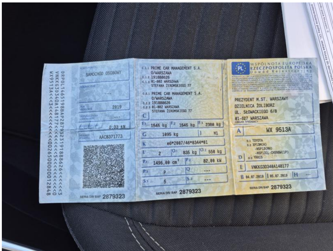
Fot. 33 Dowód rej. Str. 1