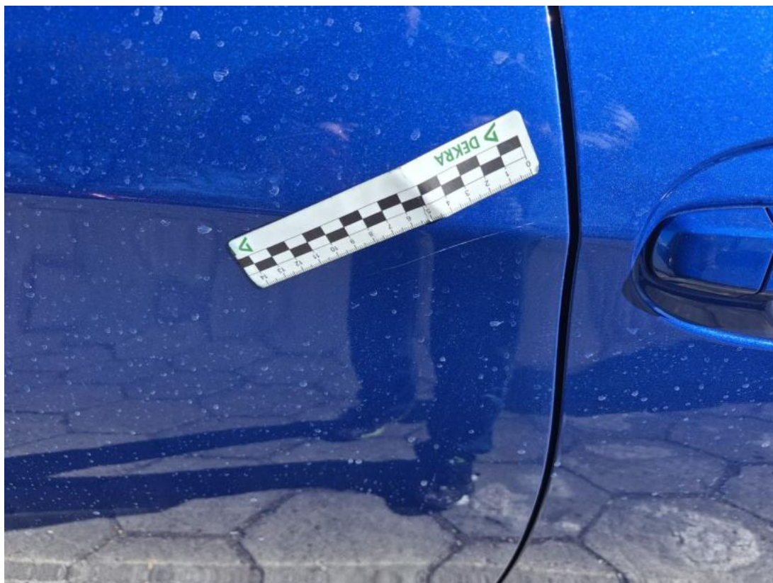
Fot. 41 Drzwi tylne P - Rysa/odprysk 1