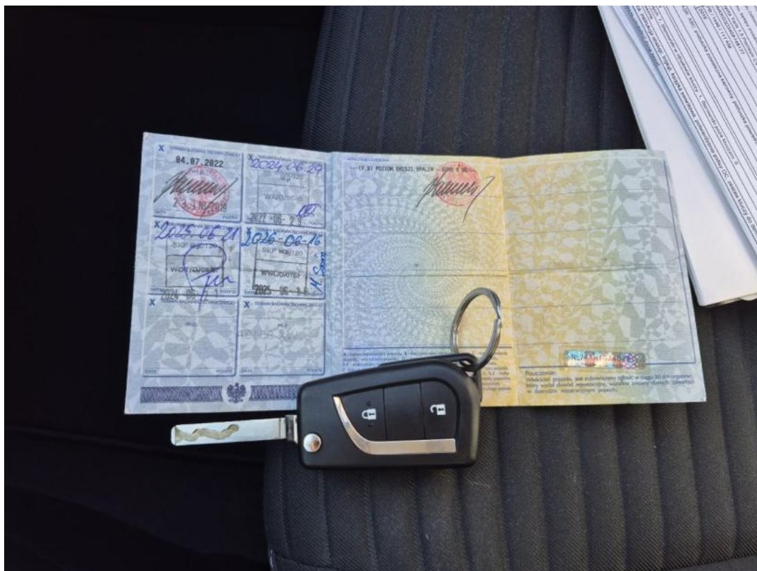
Fot. 36 Dowód rej. str. 2