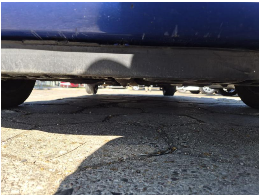
Fot. 27 Spód pojazdu przód