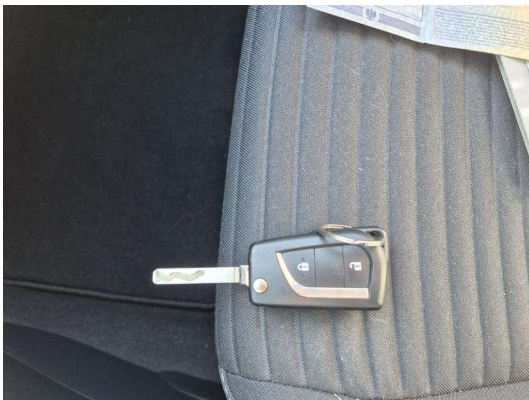
Fot. 38 Kluczyki