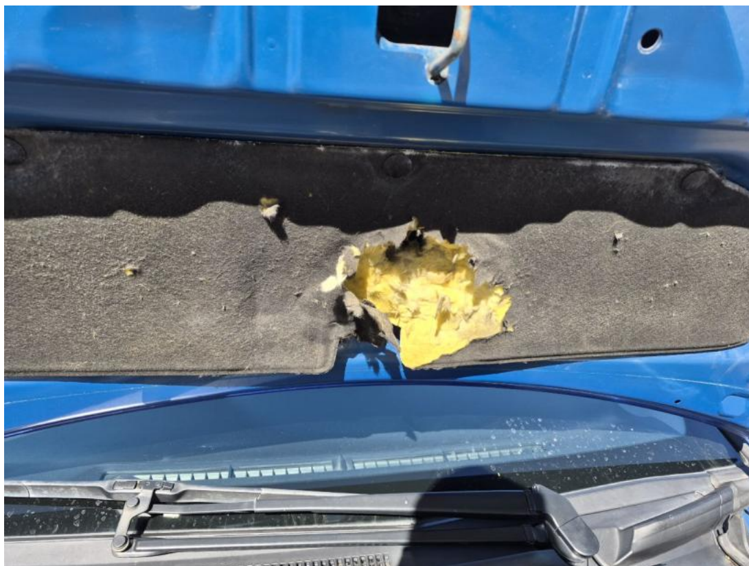
Fot. 39 Wykładzina pokrywy komory silnika - Pęknięcie/rozerwanie 1