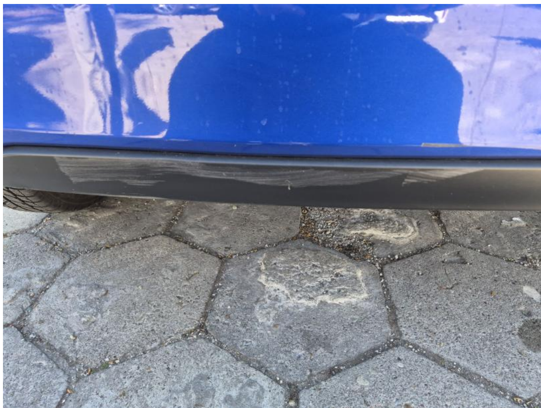
Fot. 43 Spojler zderzaka tylnego - Rysa/odprysk 1