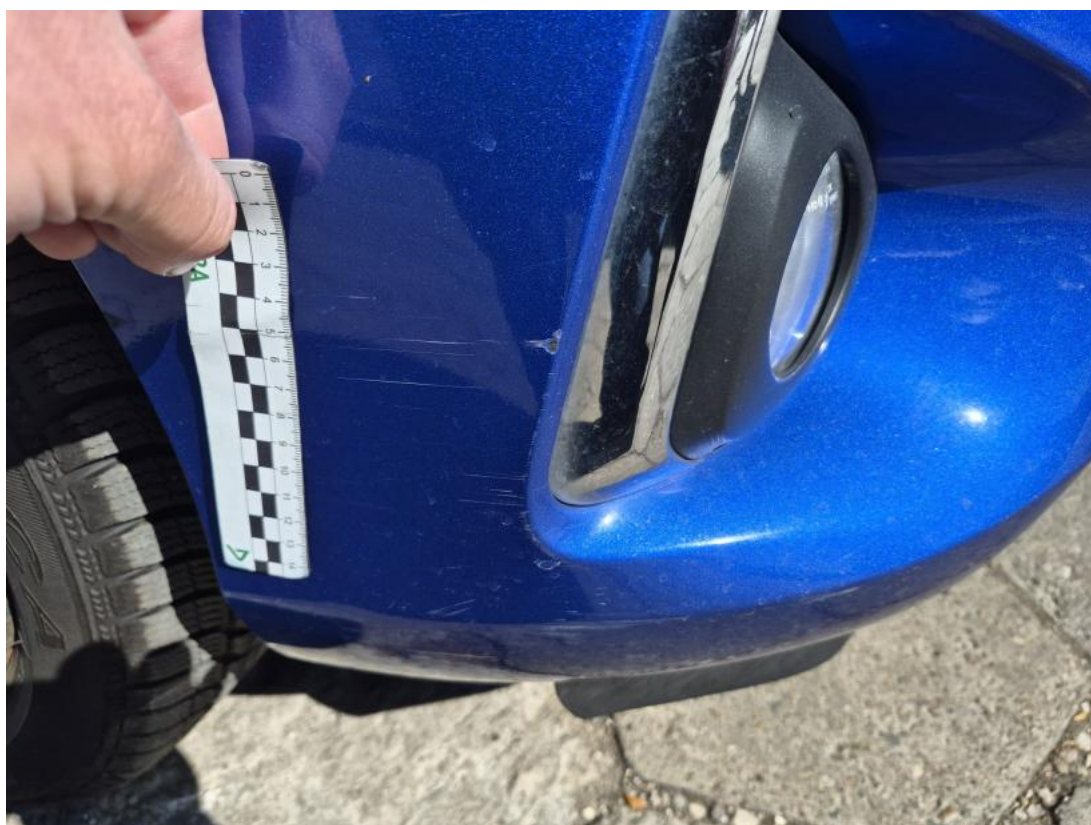
Fot. 40 Zderzak - Rysa/odprysk 1