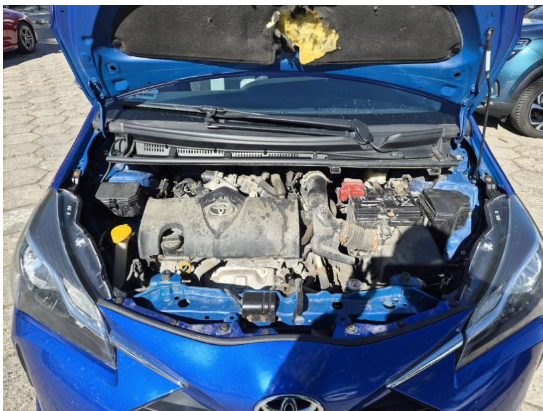
Fot. 24 Komora silnika