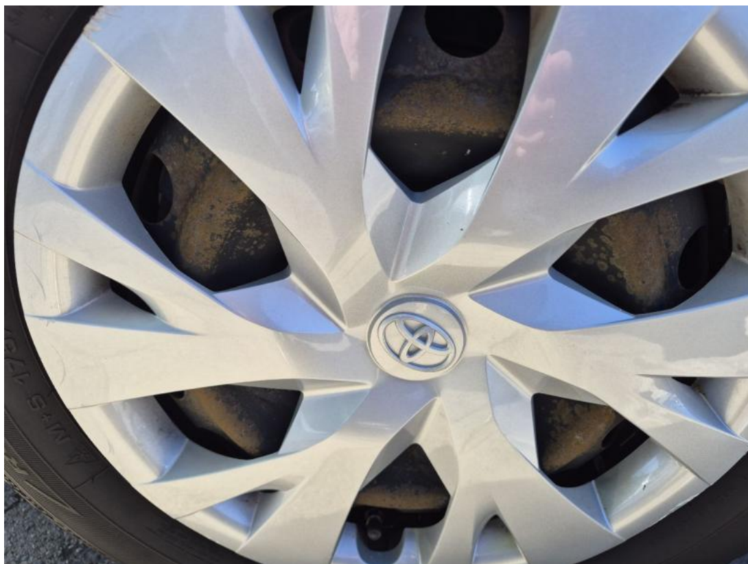
Fot. 29 Tarcza hamulcowa przednia lewa