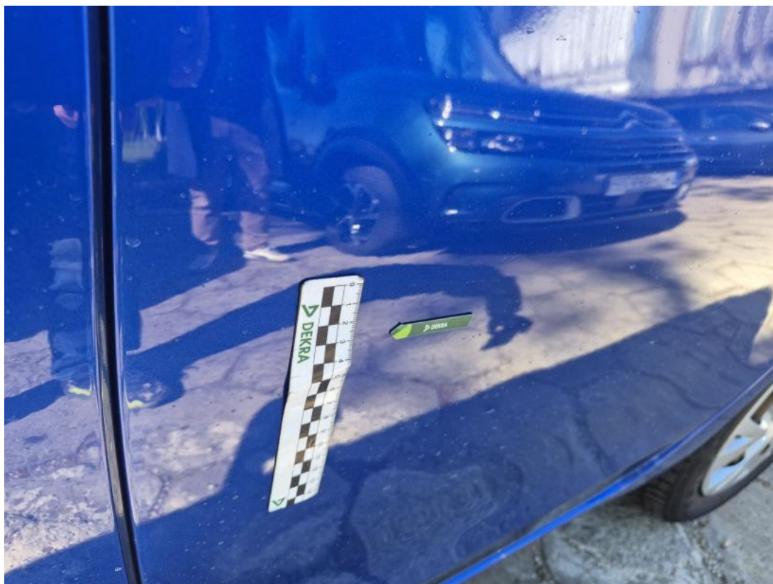
Fot. 45 Drzwi tylne L - Wgniecenie/odkształcenie 1