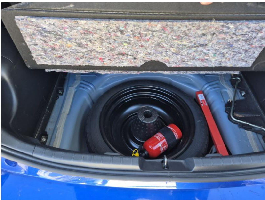
Fot. 26 Koło zapasowe