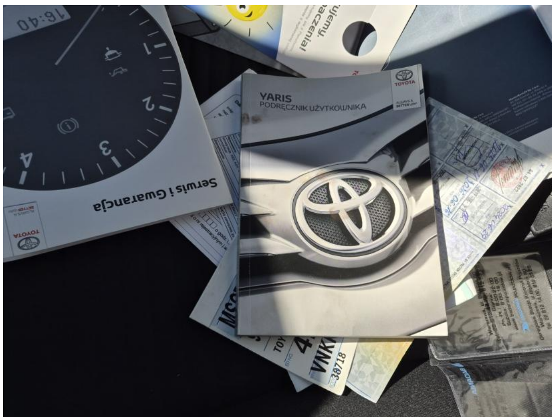
Fot. 37 Instrukcje