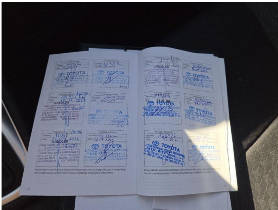
Fot. 35 Książka serwisowa – ostatni przegląd