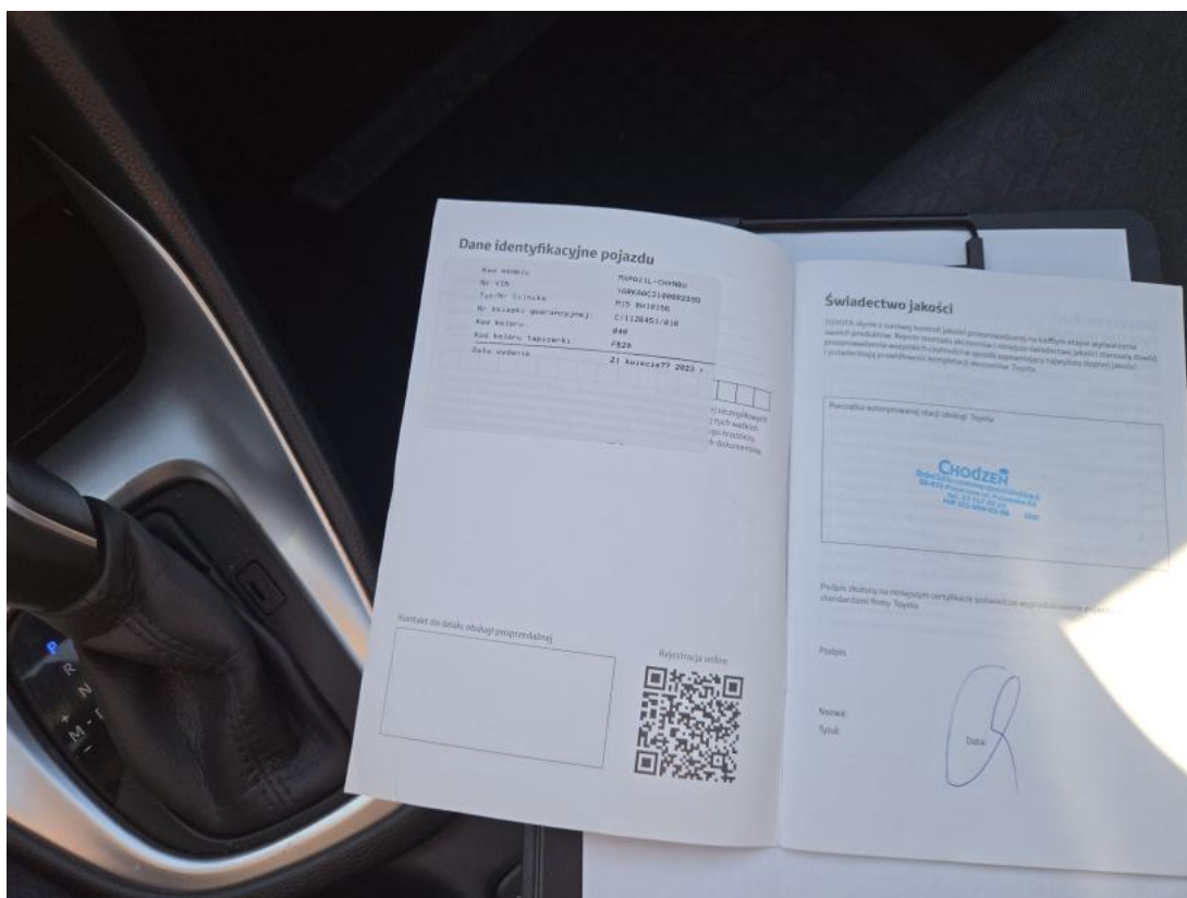
Fot. 34 Książka serwisowa – dane