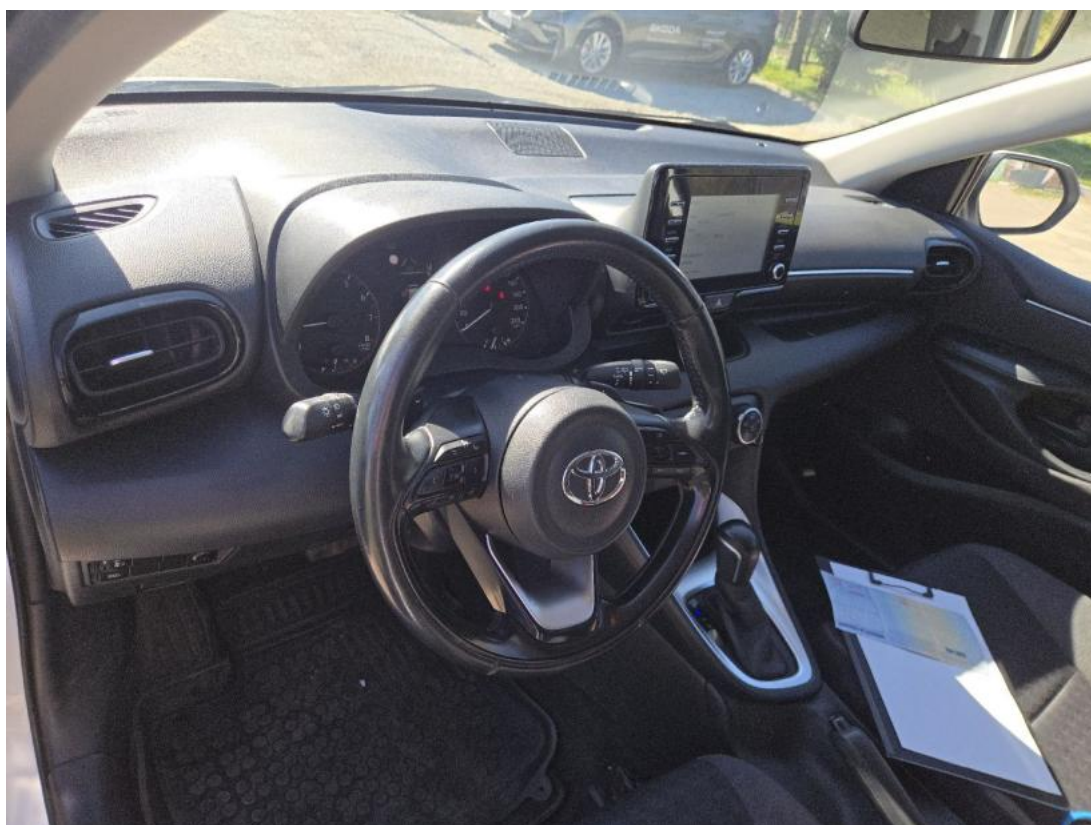
Fot. 22 Kierownica z lewej strony