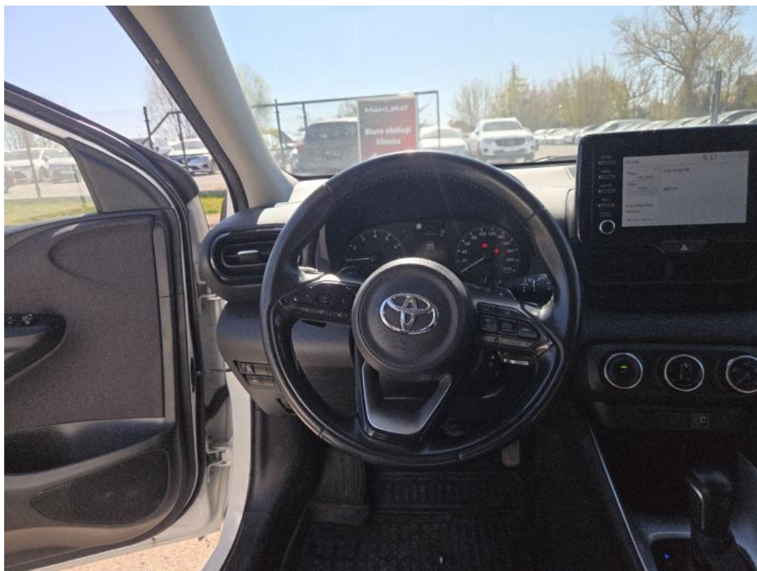
Fot. 21 Kierownica (na wprost)