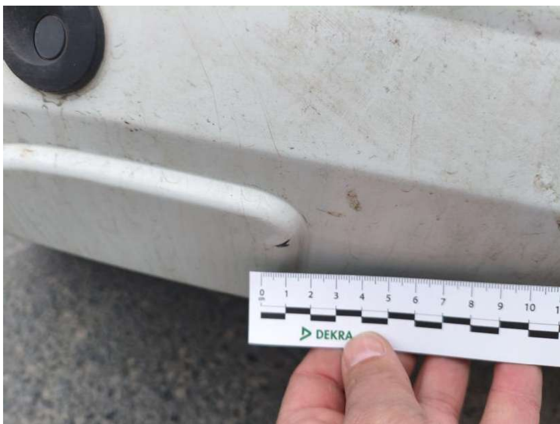
Fot. 54 Zderzak tylny - zdjęcie poglądowe 1