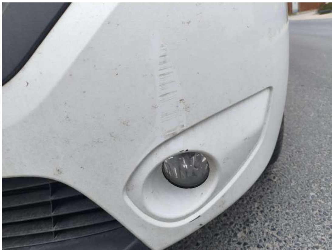
Fot. 41 Zderzak - Rysa/odprysk 1