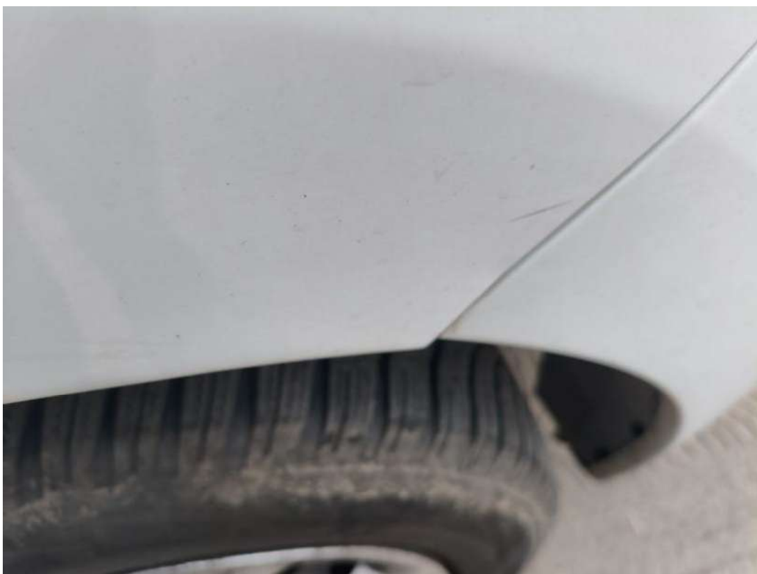
Fot. 44 Zderzak - Inne 2