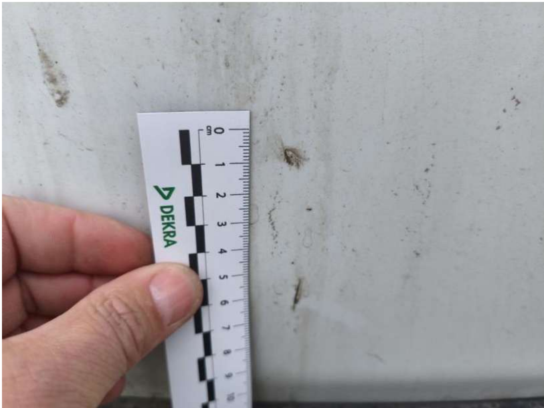
Fot. 47 Pokrywy bagażnika - zdjęcie poglądowe 1