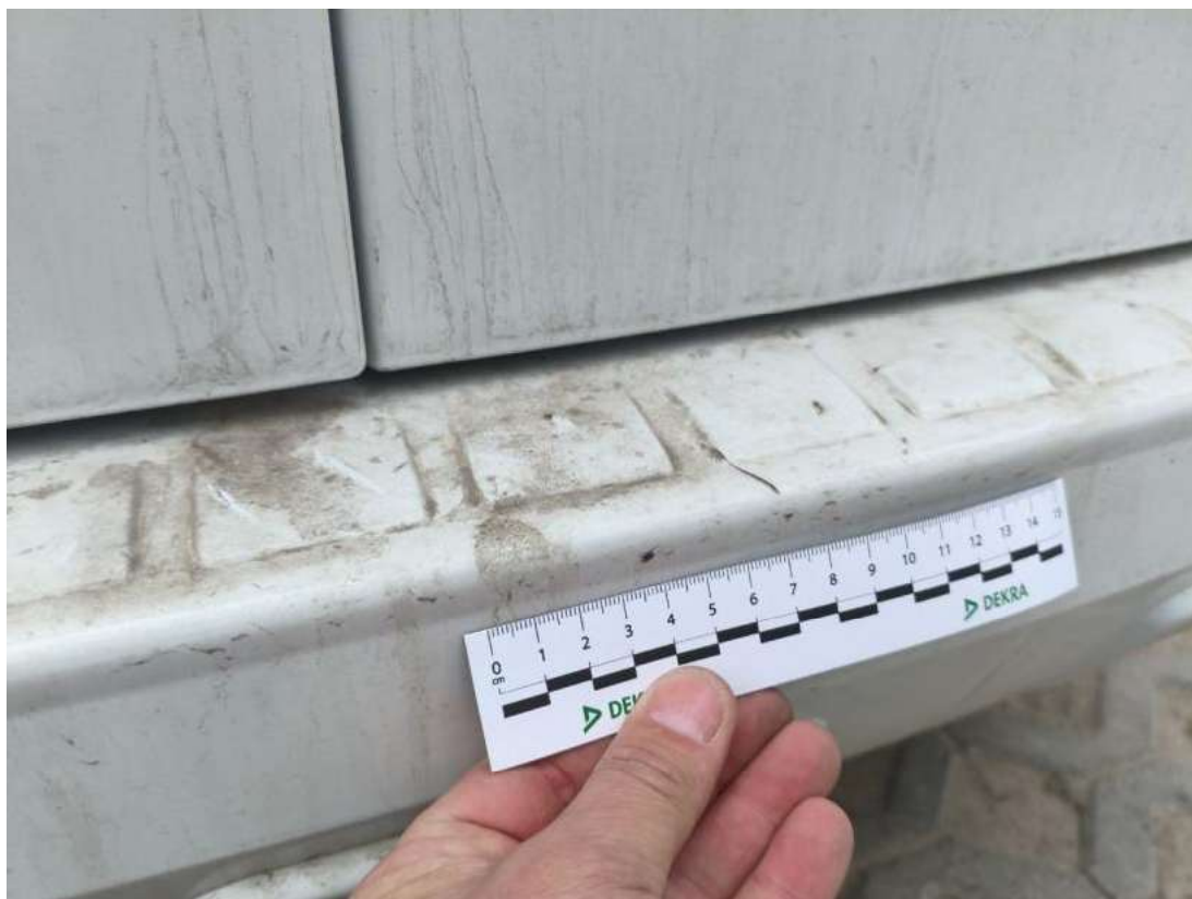
Fot. 57 Zderzak tylny - Rysa/odprysk 2