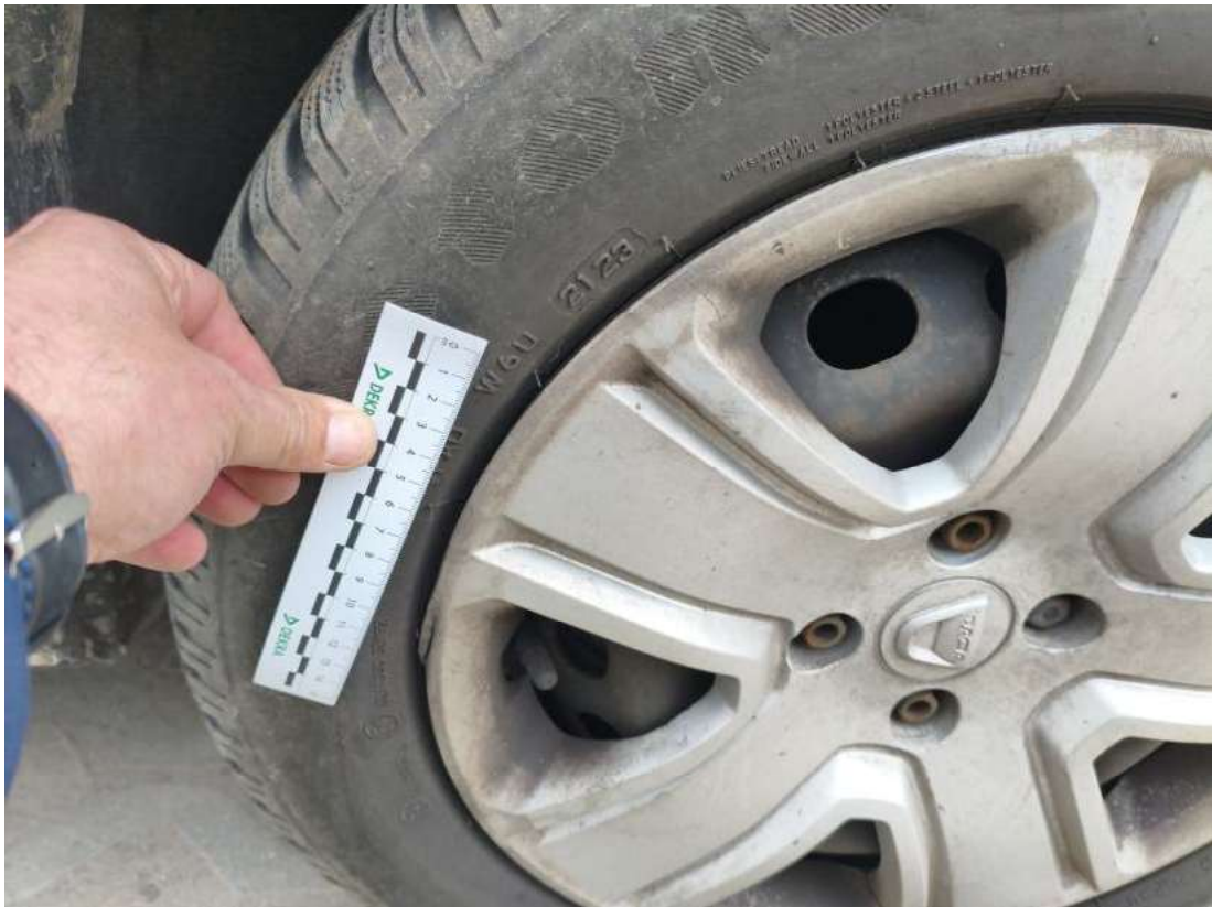
Fot. 45 Kołpak przedni P - Pęknięcie/rozerwanie 1