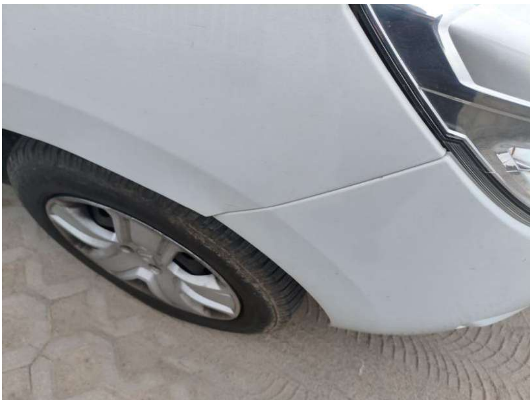
Fot. 43 Zderzak - Inne 1