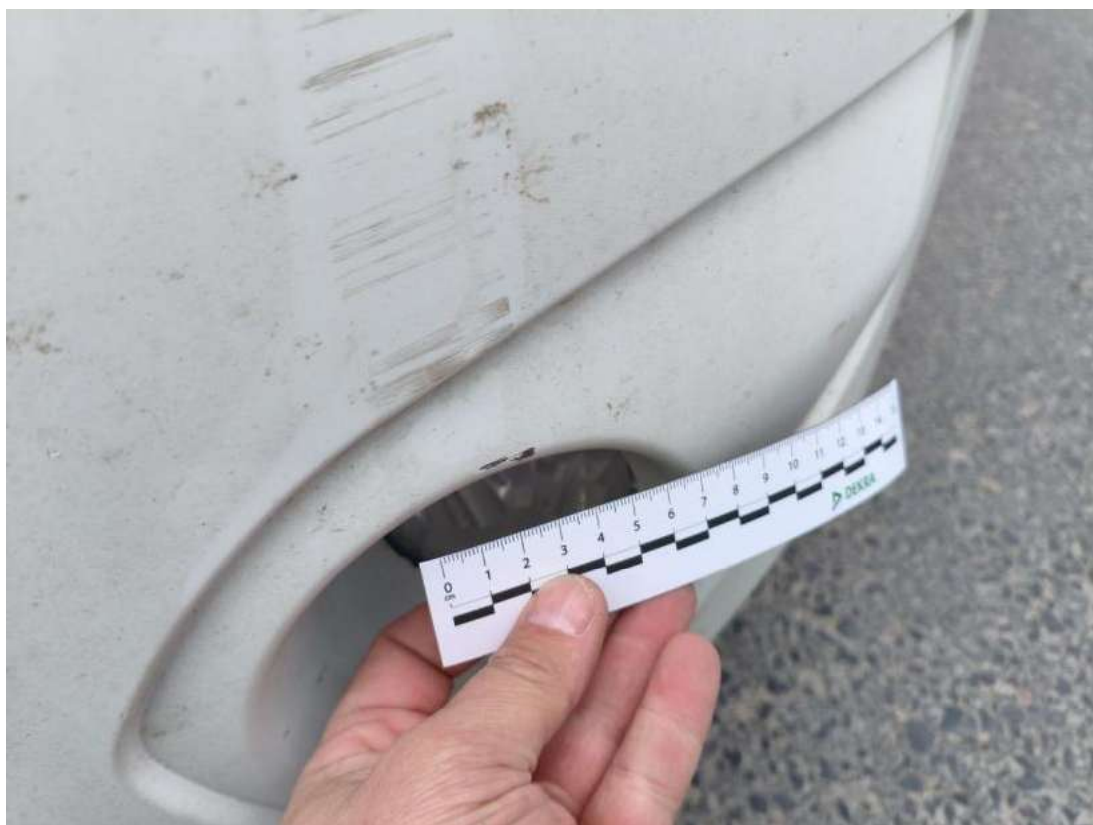
Fot. 42 Zderzak - Rysa/odprysk 2