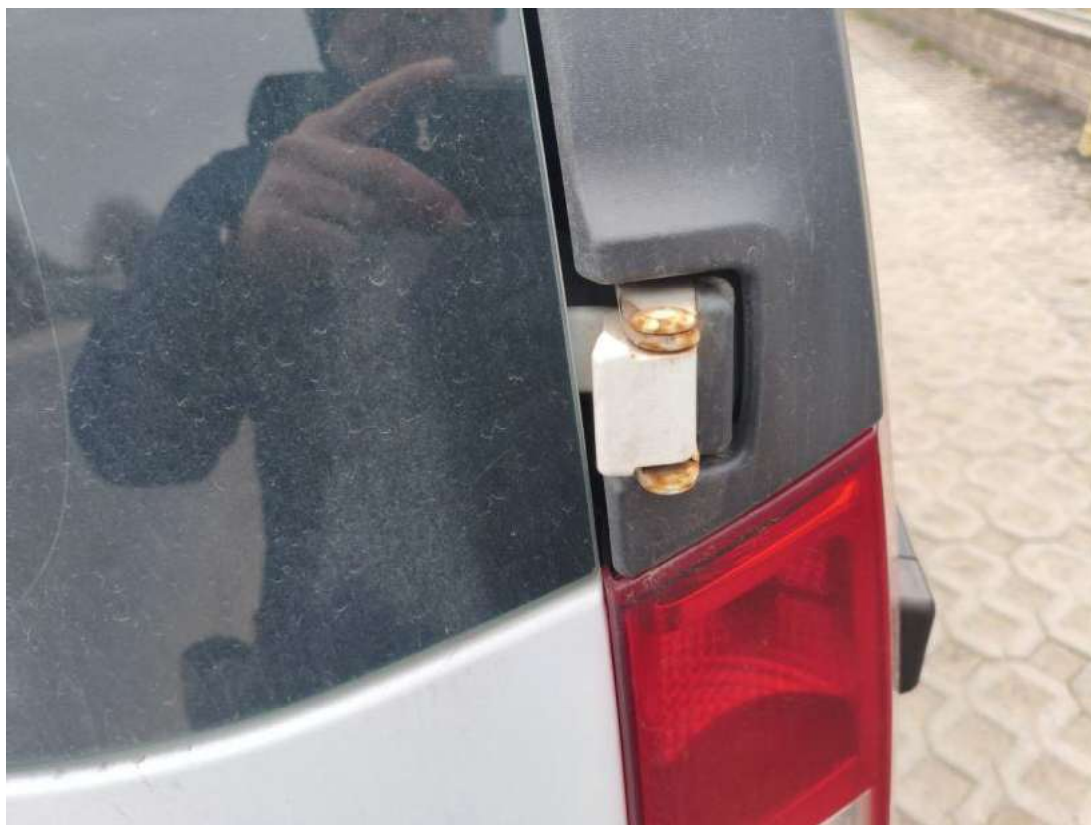
Fot. 53 Zamek pokrywy tył() - Inne 3