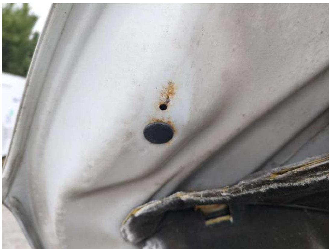
Fot. 34 Pokrywa komory silnika - zdjęcie poglądowe 1