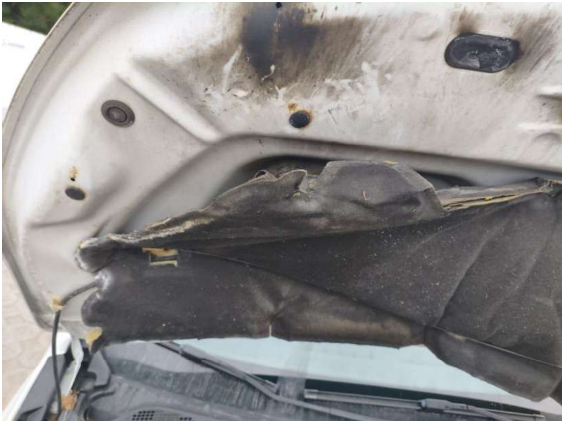
Fot. 35 Pokrywa komory silnika - zdjęcie poglądowe 2