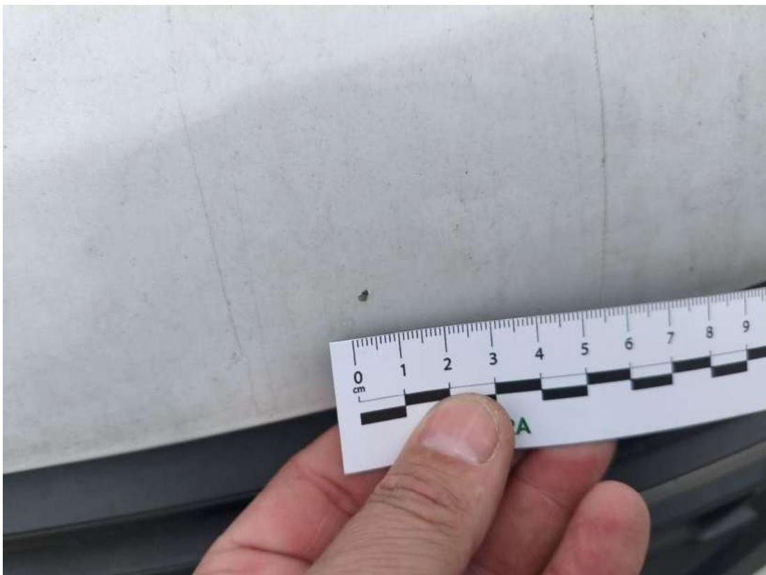
Fot. 36 Pokrywa komory silnika - Rysa/odprysk 1