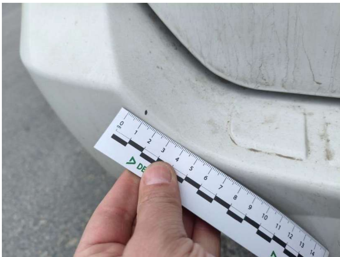
Fot. 58 Zderzak tylny() - Rysa/odprysk 3