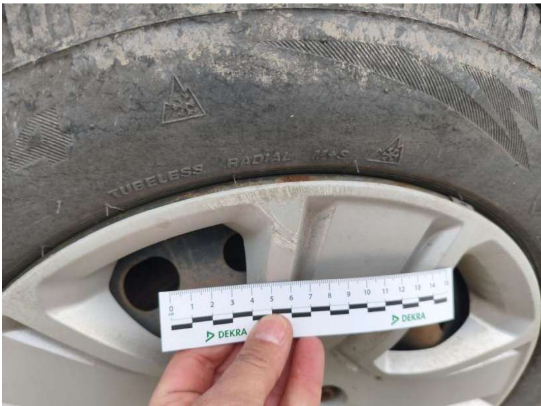
Fot. 46 Kołpak tylny P - Rysa/odprysk 1