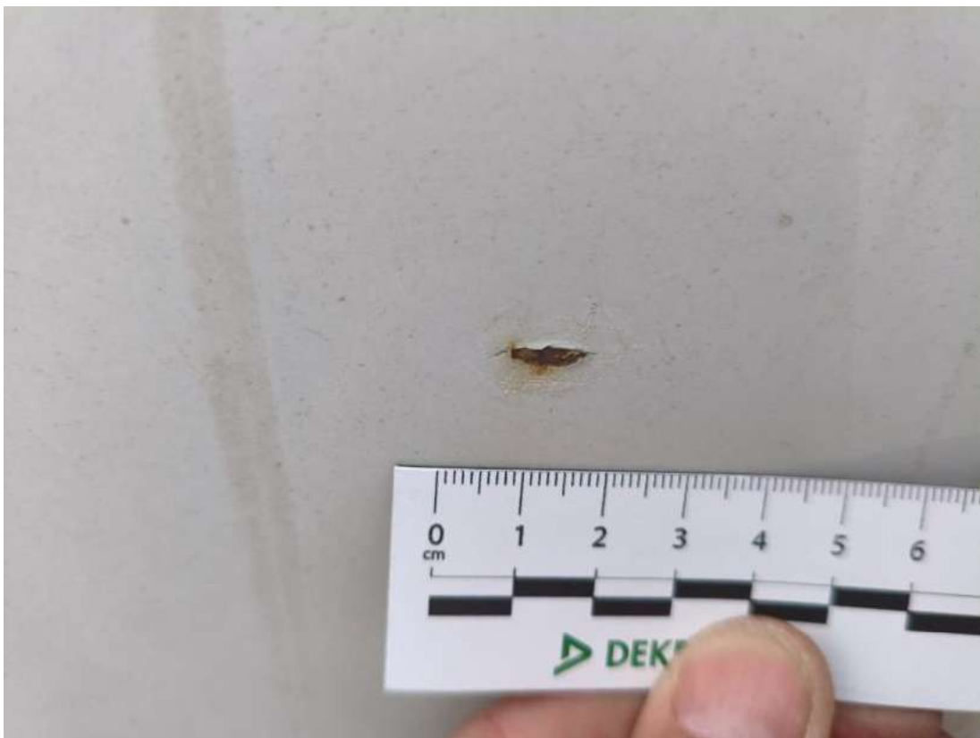
Fot. 48 Pokrywy bagażnika - zdjęcie poglądowe 2