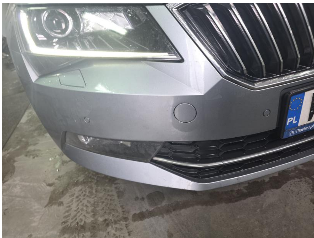
Fot. 38 Zderzak - zdjęcie poglądowe 1