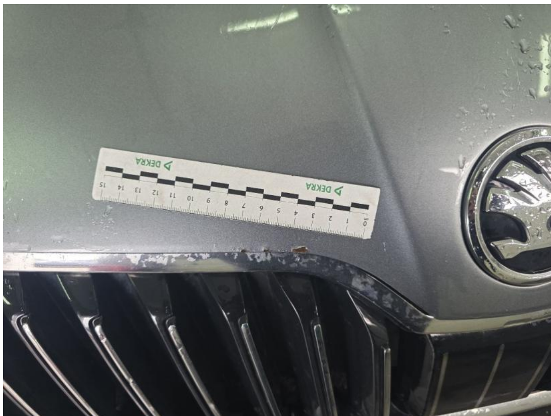
Fot. 37 Pokrywa komory silnika - Rysa/odprysk 1