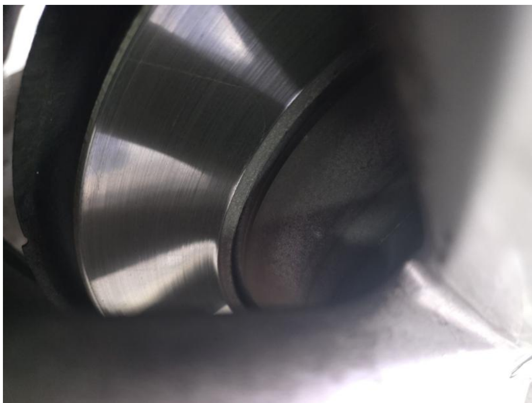
Fot. 30 Tarcza hamulcowa tylna prawa