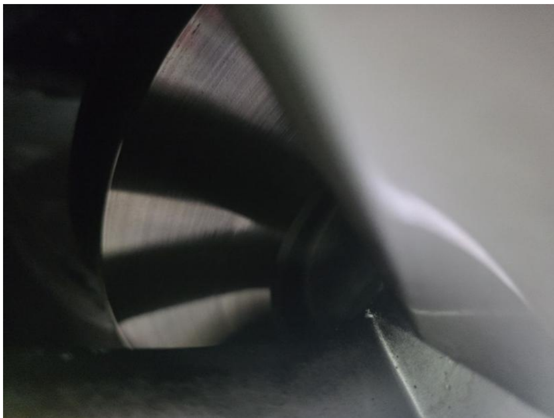
Fot. 29 Tarcza hamulcowa przednia prawa