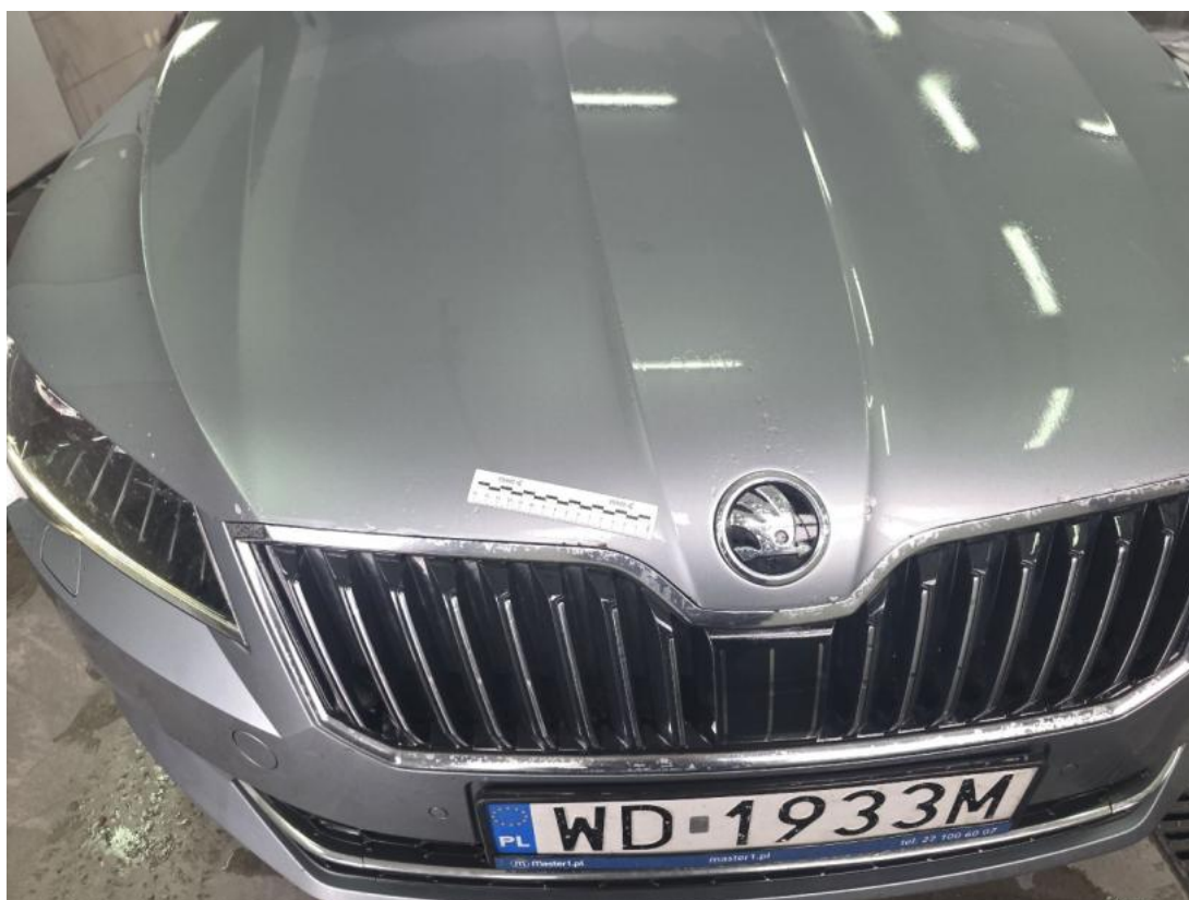
Fot. 36 Pokrywa komory silnika - zdjęcie poglądowe 1