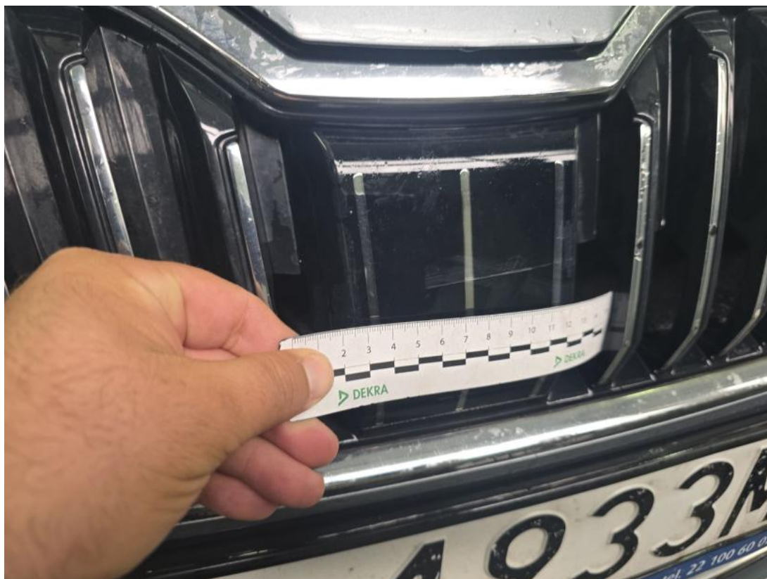
Fot. 35 Atrapa przednia - Pęknięcie/rozerwanie 1