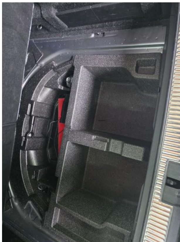
Fot. 34 Zestaw naprawy koła