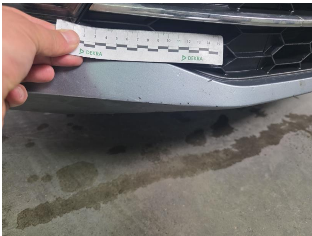
Fot. 40 Zderzak - Rysa/odprysk 2