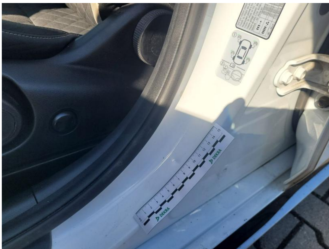
Fot. 46 Słupek środkowy L - zdjęcie pogładowe 2