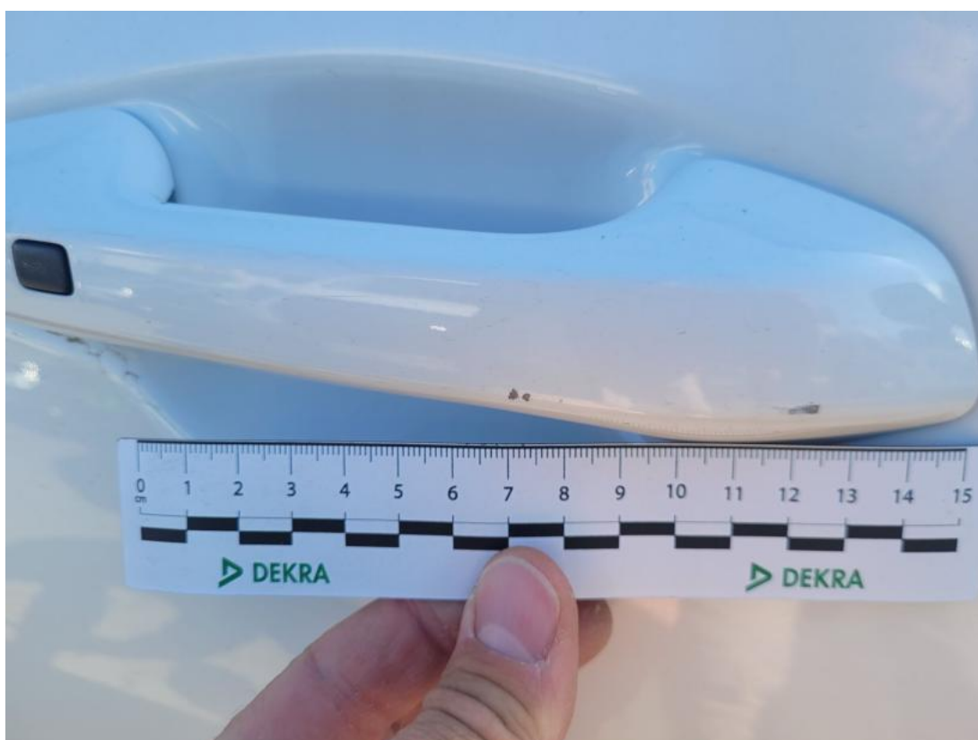
Fot. 40 Klamka drzwi prz P - Rysa/odprysk 1