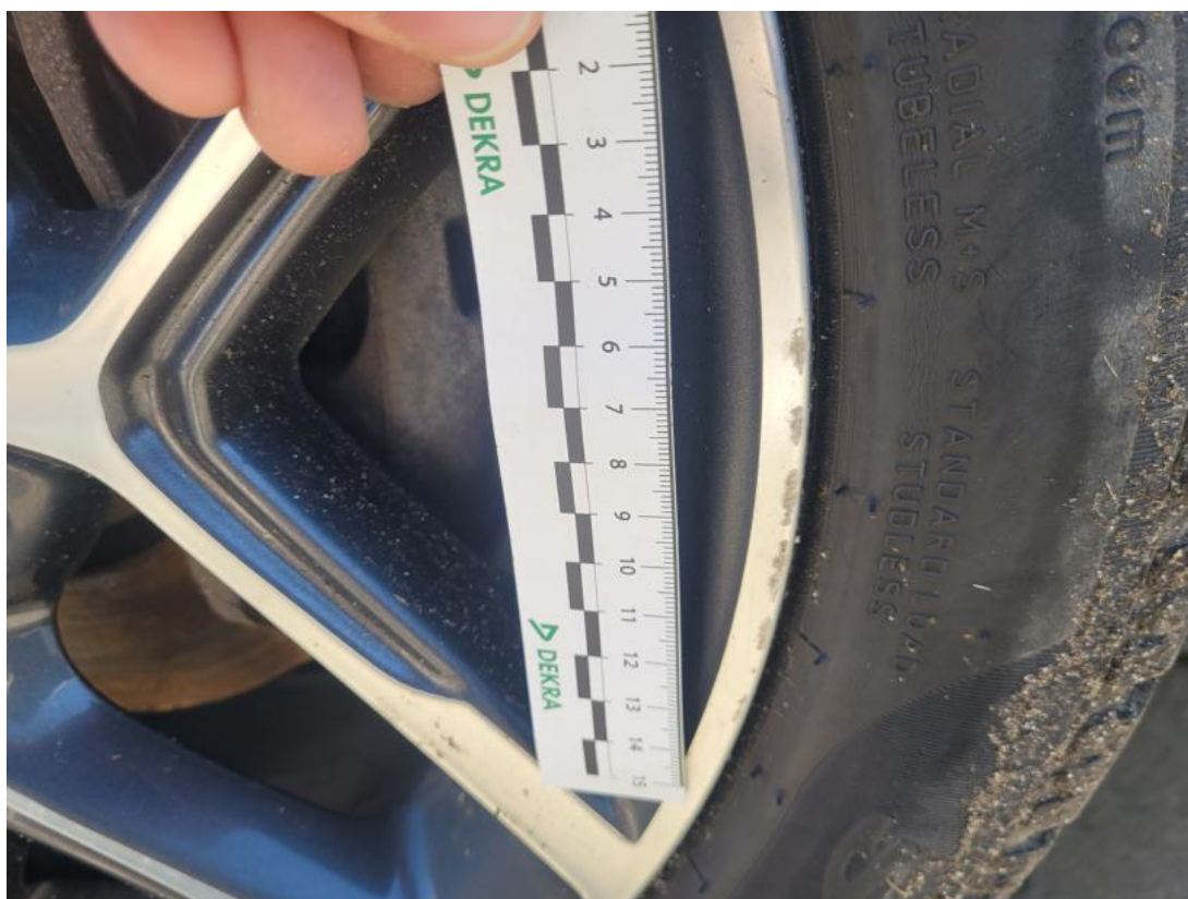
Fot. 38 Felga aluminiowa przednia P - Rysa/odprysk 1