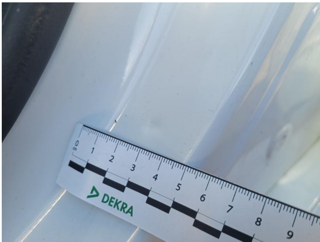
Fot. 47 Słupek środkowy L - Wgniecenie/odkształcenie 1