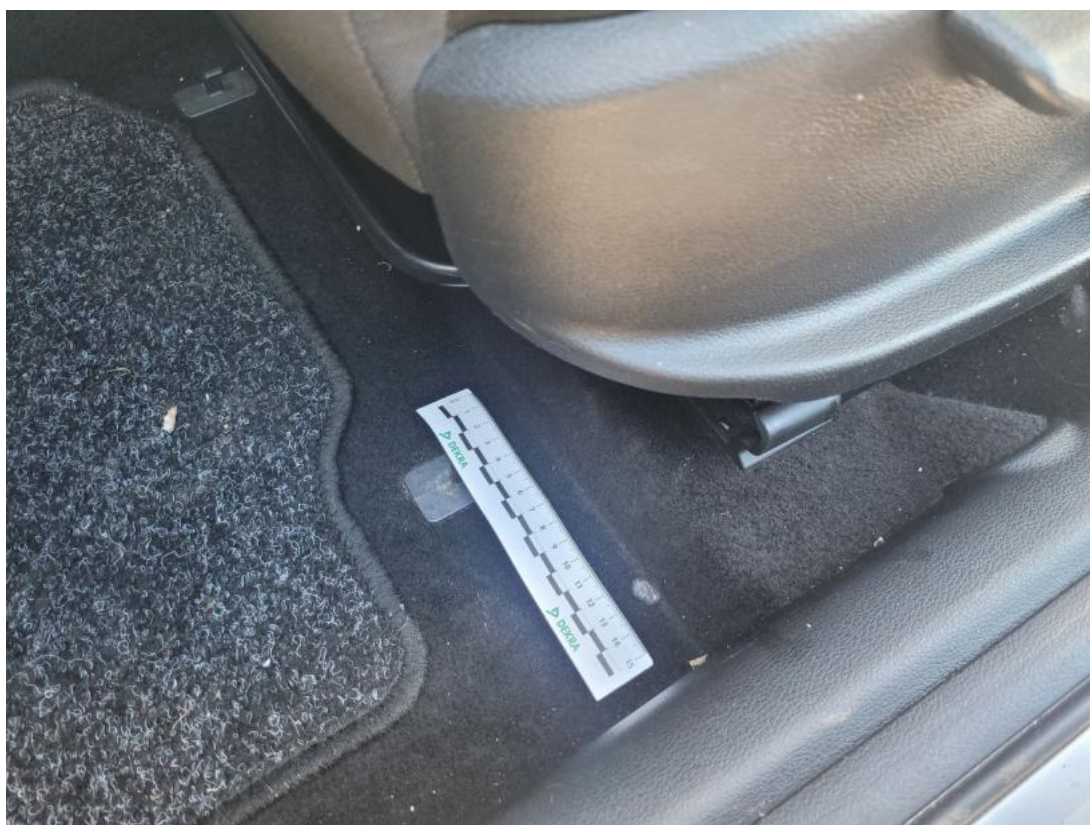
Fot. 48 Wykładzina podłogi - zdjęcie poglądowe 2