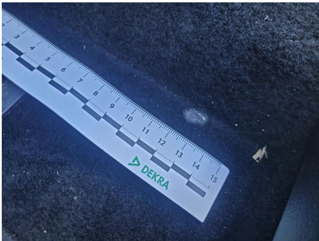
Fot. 49 Wykładzina podłogi - Inne 1