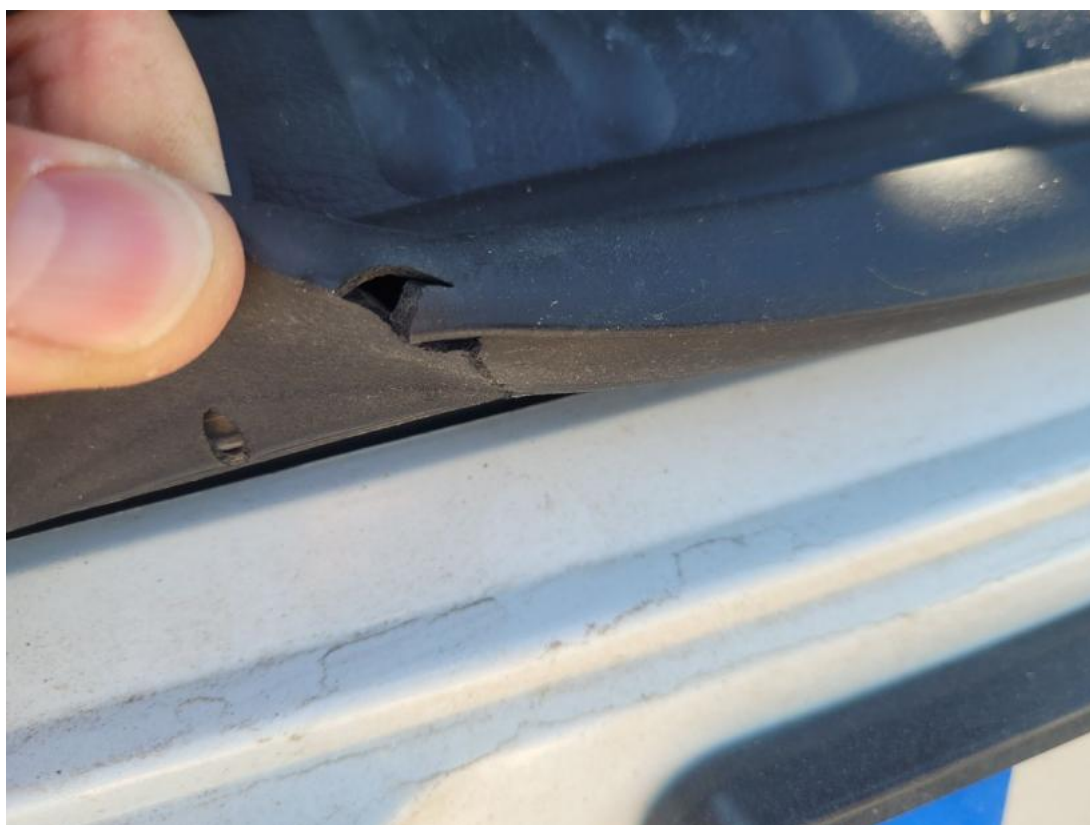
Fot. 50 Uszczelka pokrywy tylnej - zdjęcie poglądowe 2