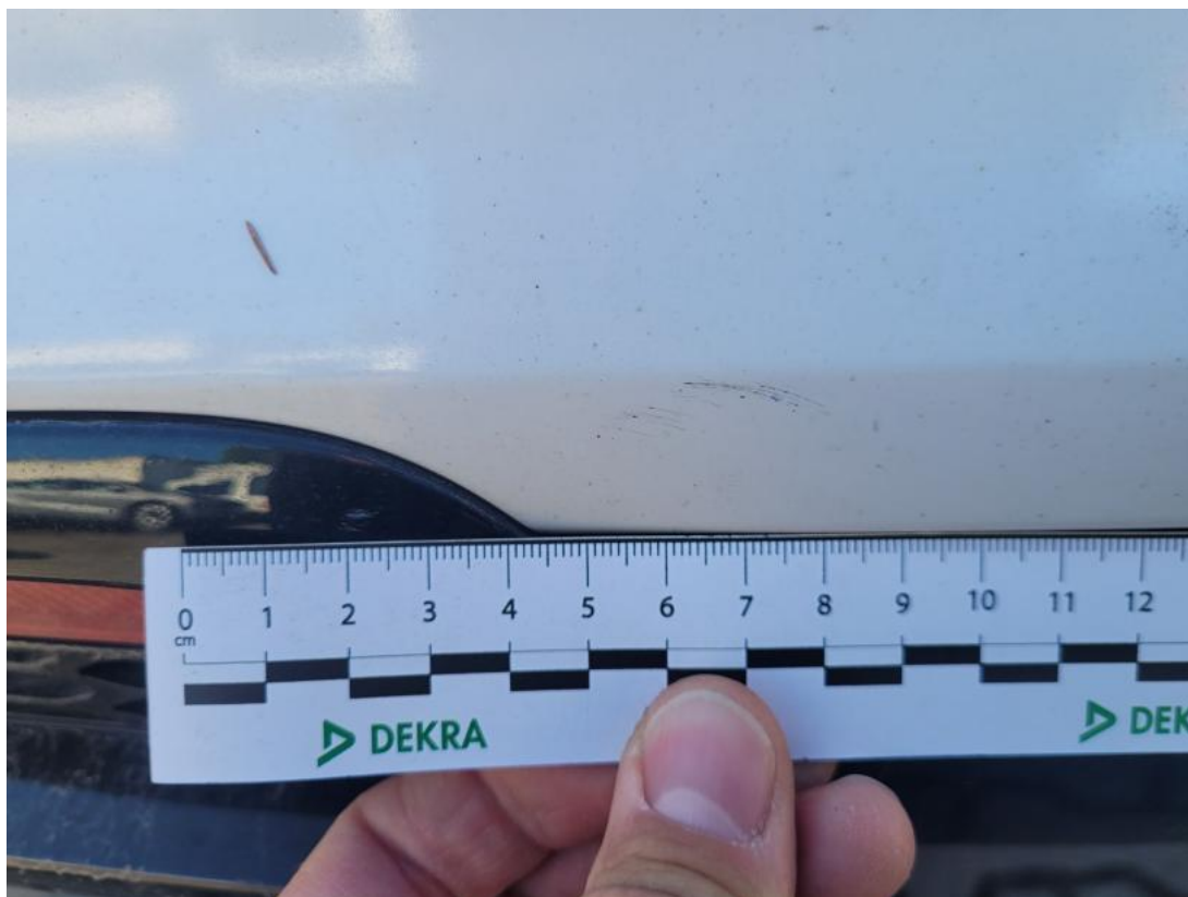
Fot. 45 Zderzak tylny - Rysa/odprysk 1