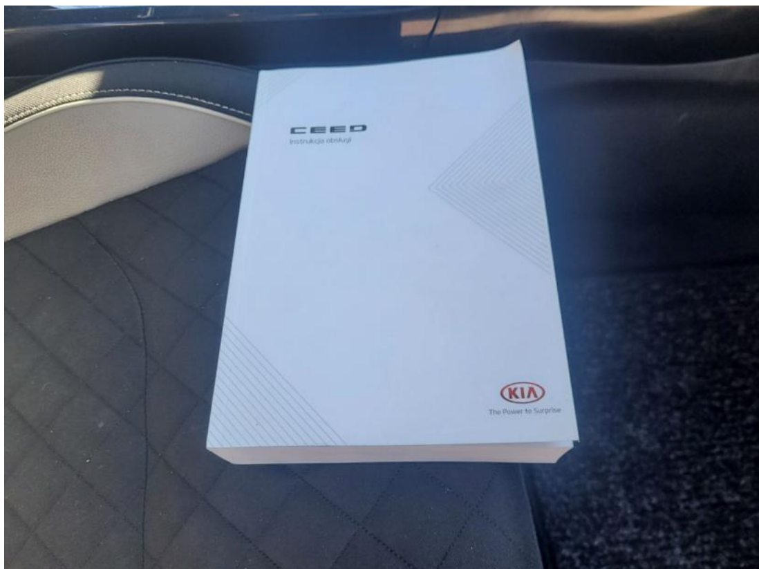
Fot. 36 Instrukcje