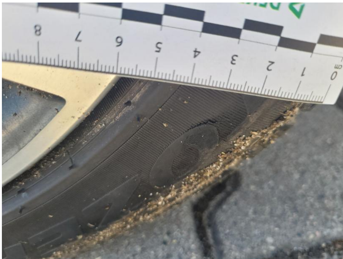
Fot. 39 Opona przednia P - Pęknięcie/rozerwanie 1