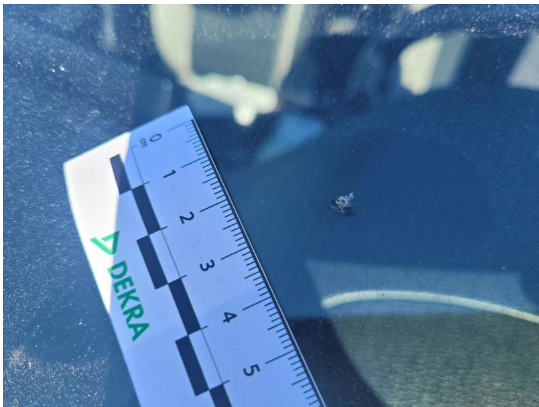
Fot. 37 Szyba czołowa - Rysa/odprysk 1