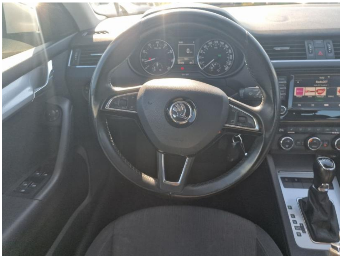
Fot. 21 Kierownica (na wprost)