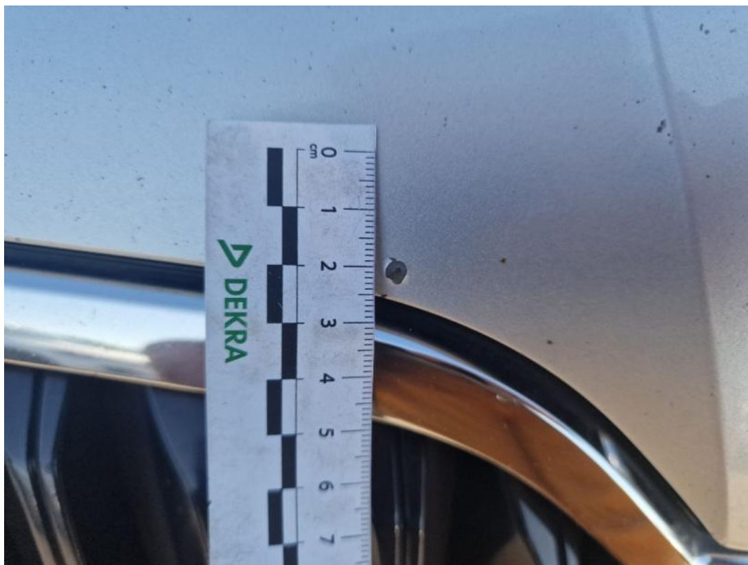
Fot. 41 Pokrywa komory silnika() - Rysa/odprysk 3