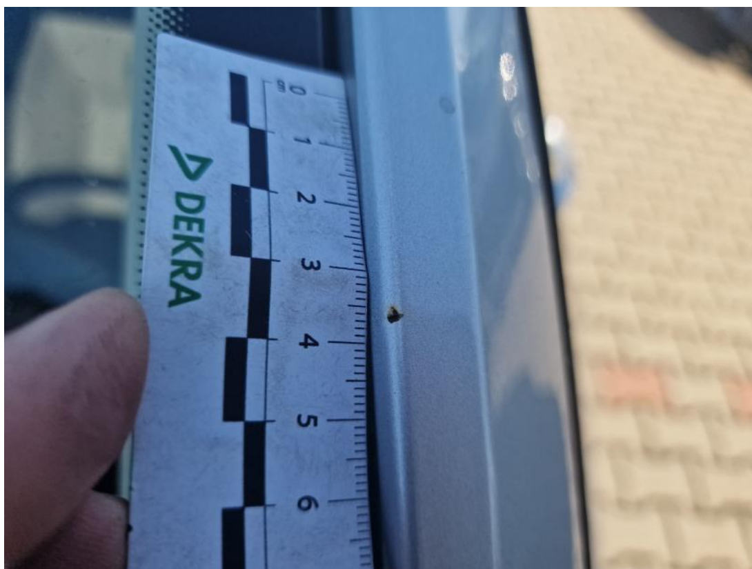
Fot. 50 Słupek przedni P - zdjęcie pogładowe 1