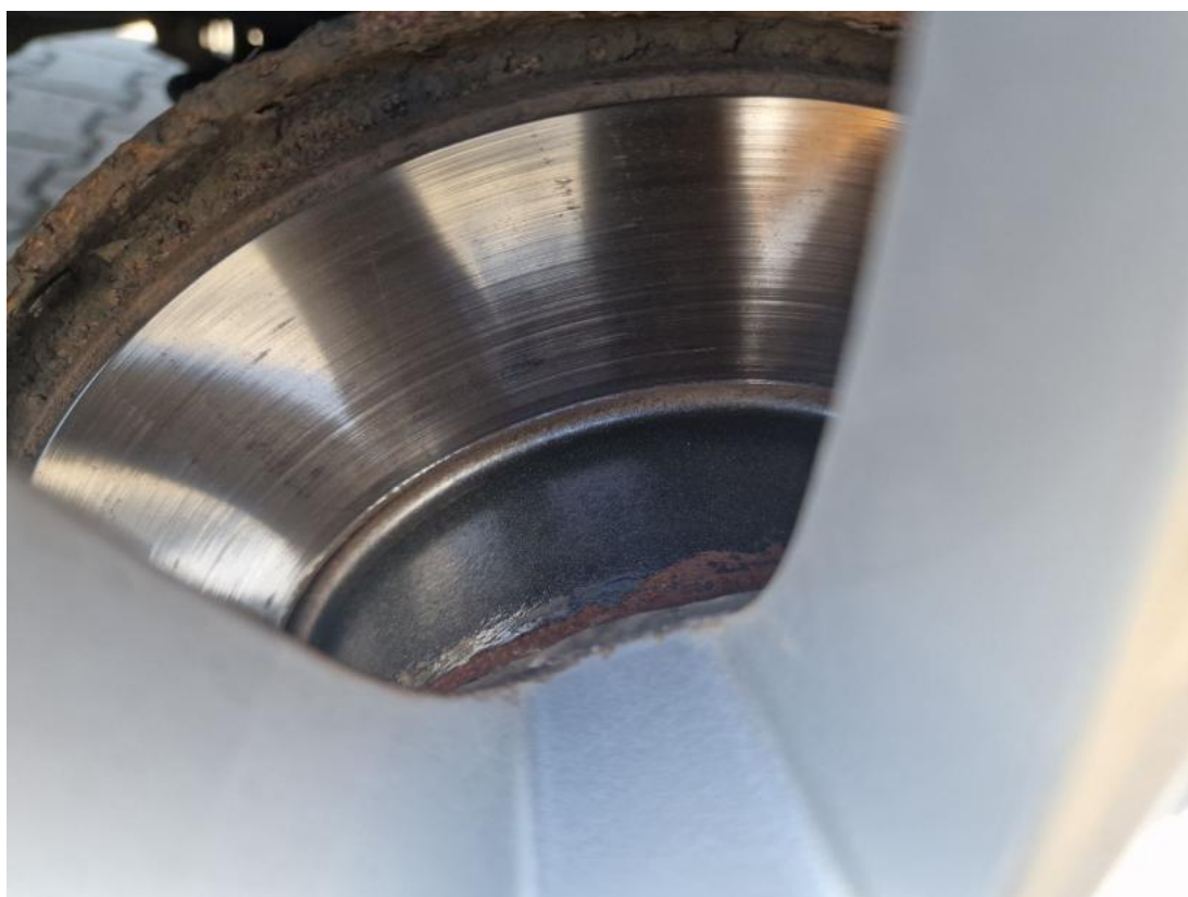
Fot. 30 Tarcza hamulcowa tylna prawa