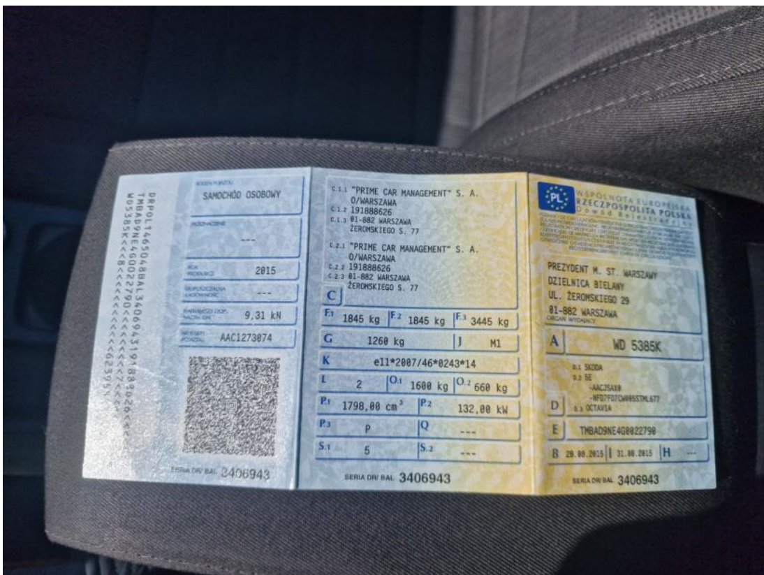
Fot. 32 Dowód rej. Str. 1