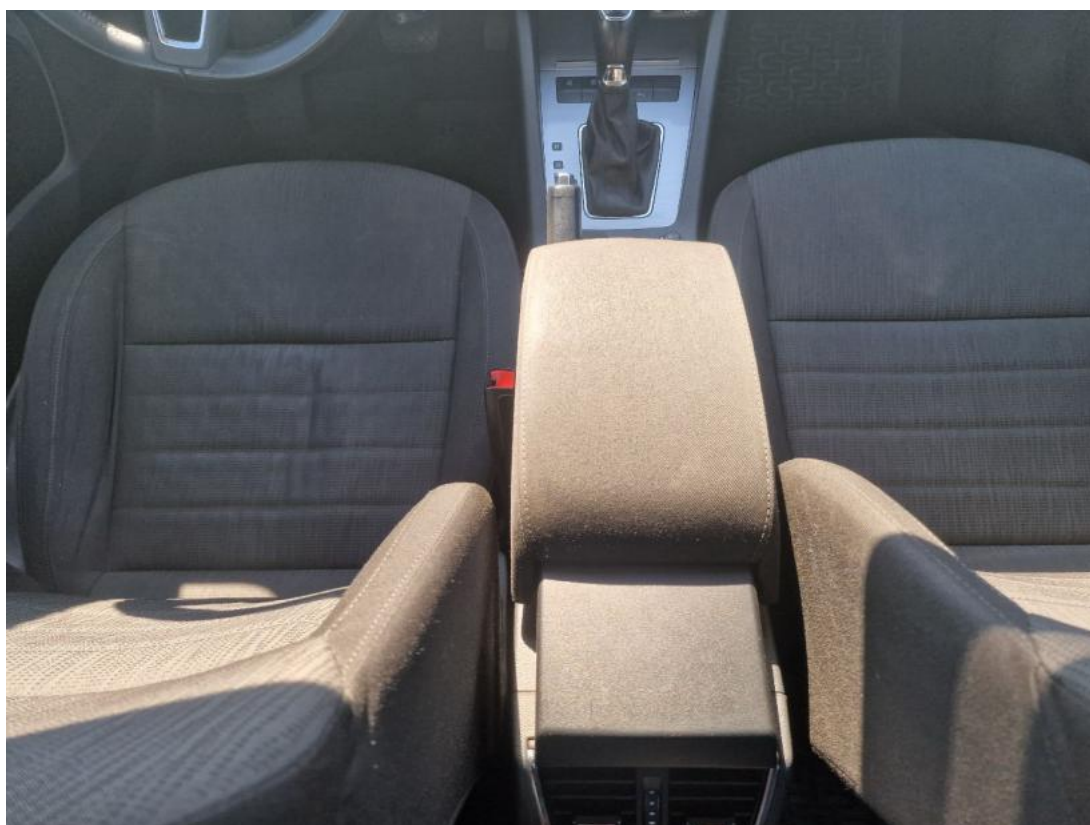
Fot. 20 Tunel środkowy