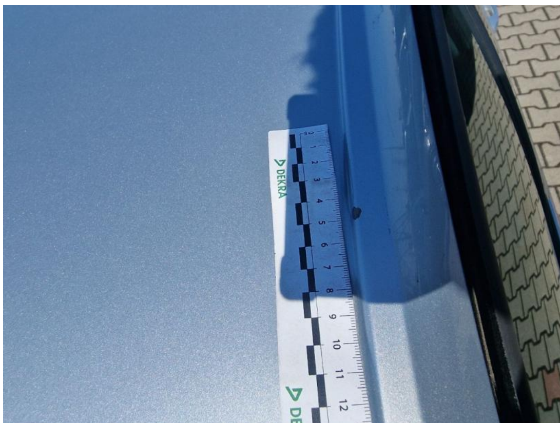
Fot. 53 Słupek przedni P - Inne 2