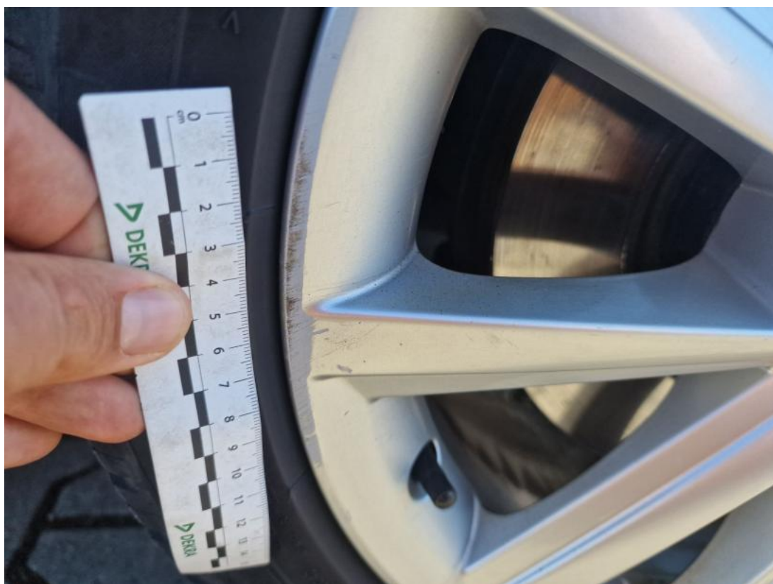
Fot. 46 Felga aluminiowa przednia P - zdjęcie poglądowe 1