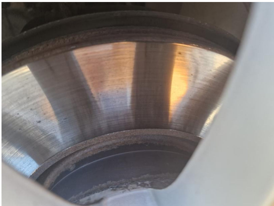
Fot. 29 Tarcza hamulcowa przednia prawa