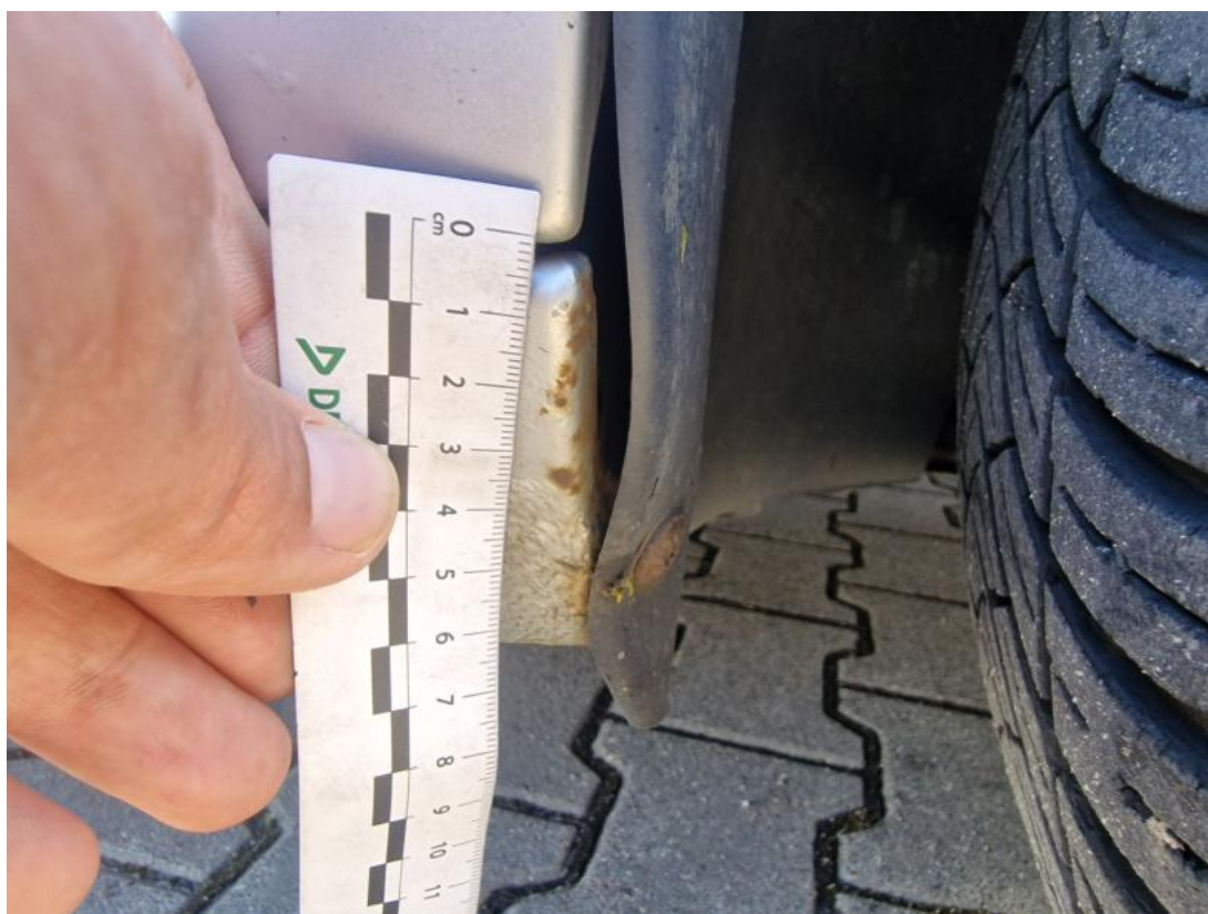
Fot. 48 Próg P - zdjęcie pogładowe 1