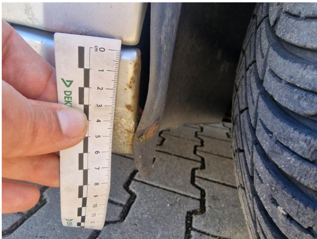
Fot. 49 Próg P - Inne 1