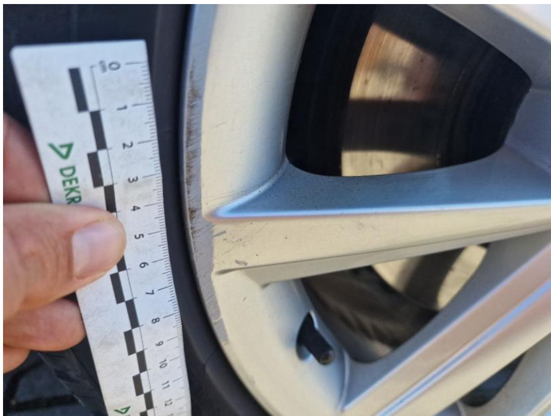
Fot. 47 Felga aluminiowa przednia P - Rysa/odprysk 1