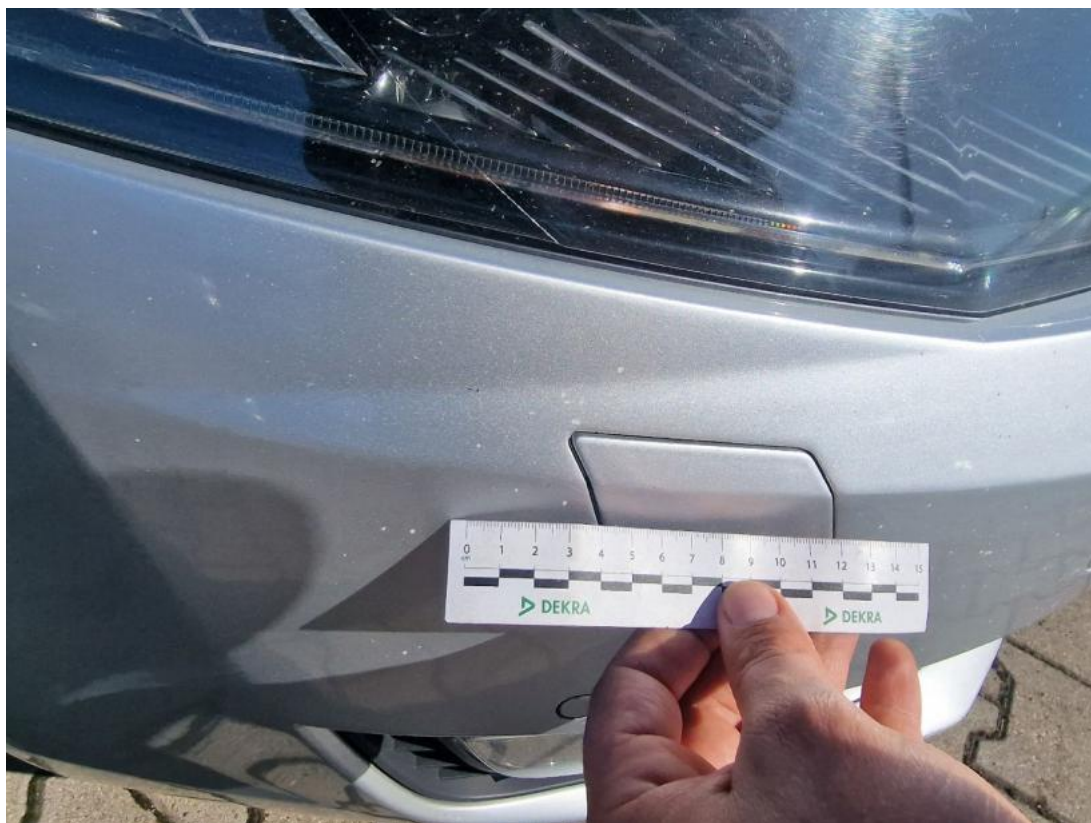
Fot. 45 Zderzak - Rysa/odprysk 1