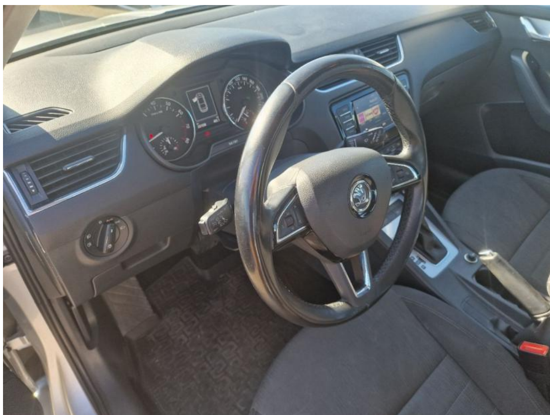
Fot. 22 Kierownica z lewej strony