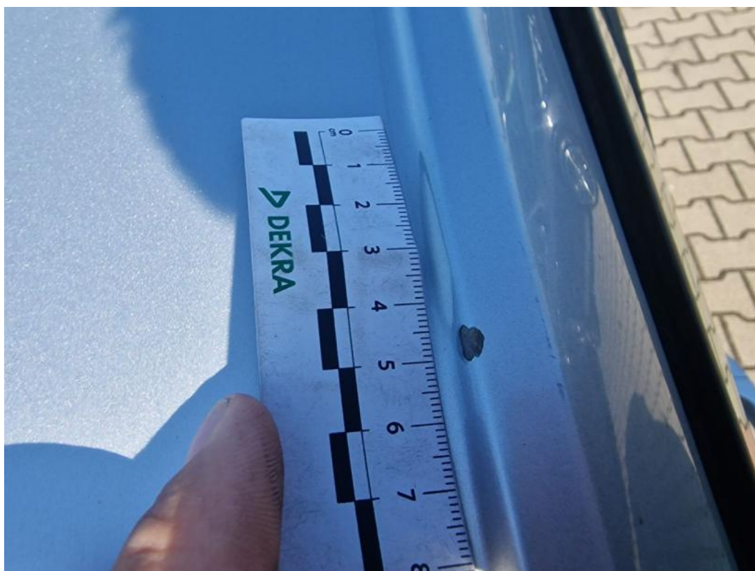
Fot. 54 Słupek przedni P() - Inne 3