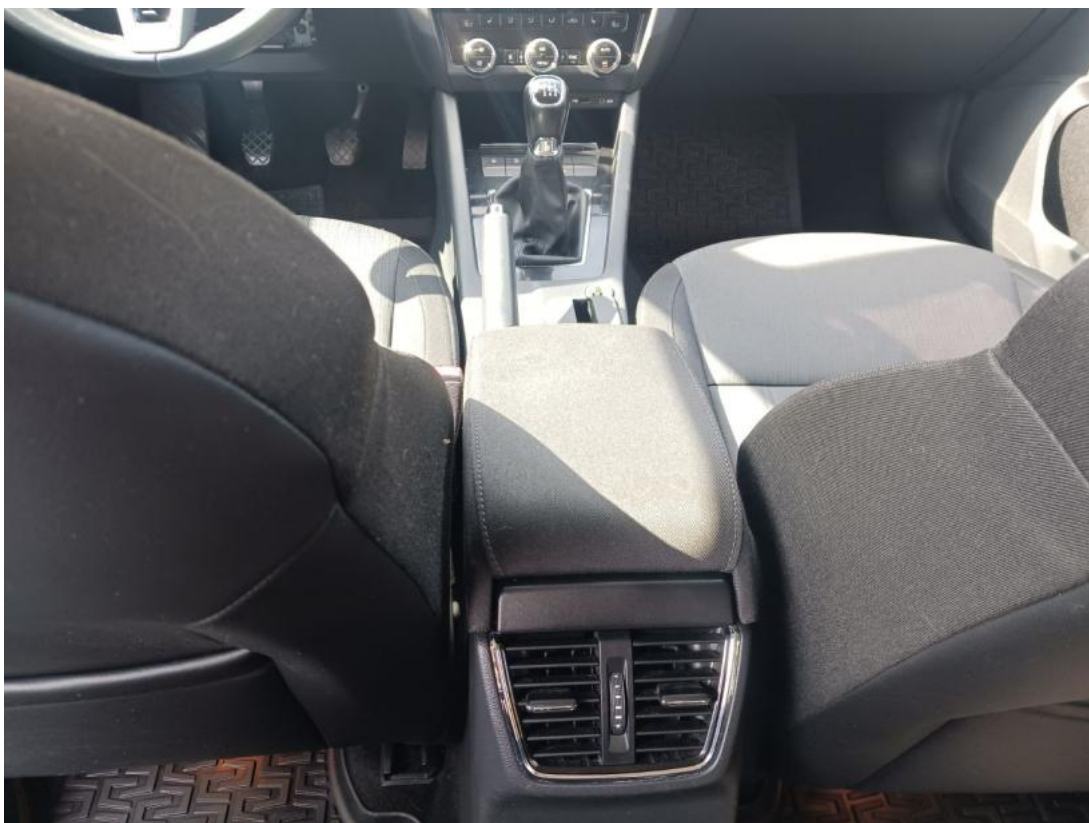
Fot. 21 Tunel środkowy