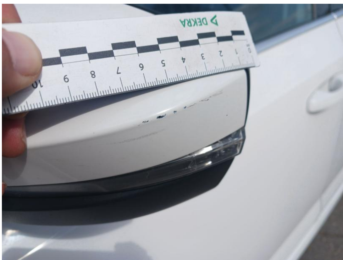
Fot. 50 Obudowa lusterka zew L - Rysa/odprysk 1