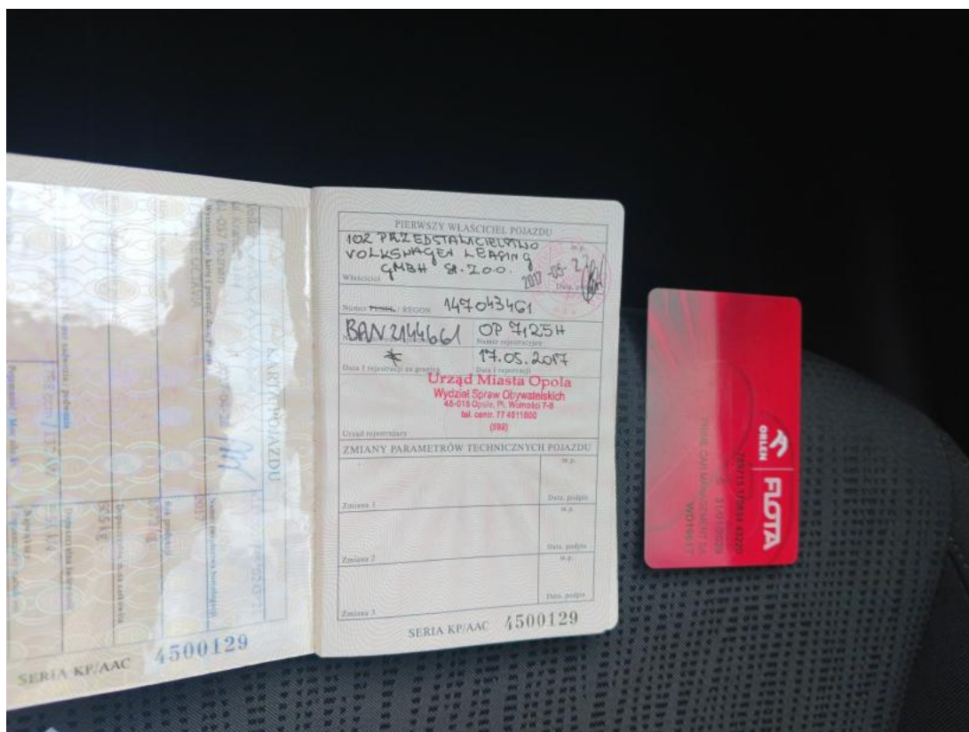
Fot. 34 Otwarta karta pojazdu