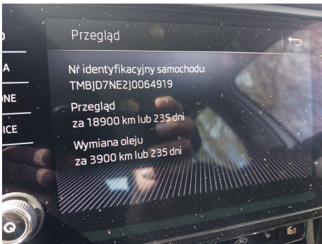
Fot. 16 Zestaw wskaźników - serwis