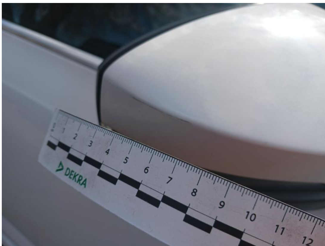
Fot. 42 Obudowa lusterka zew P - Rysa/odprysk 1