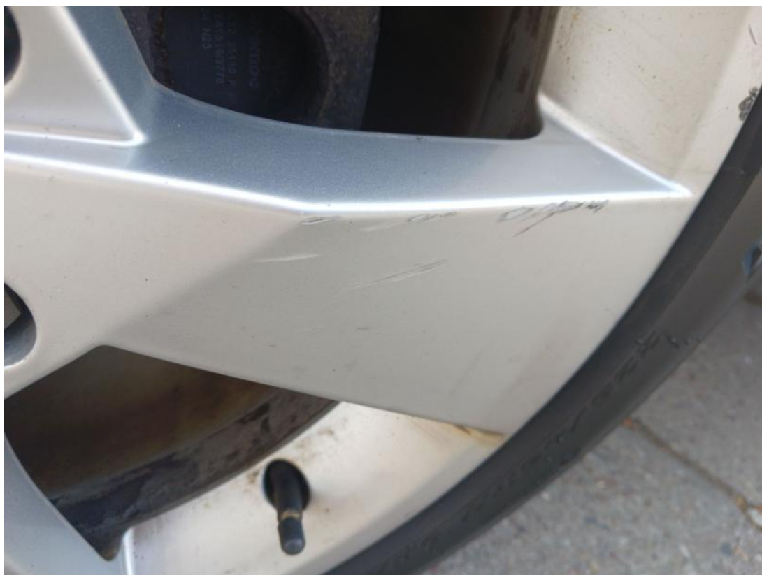
Fot. 45 Felga aluminiowa tylna P - Rysa/odprysk 1