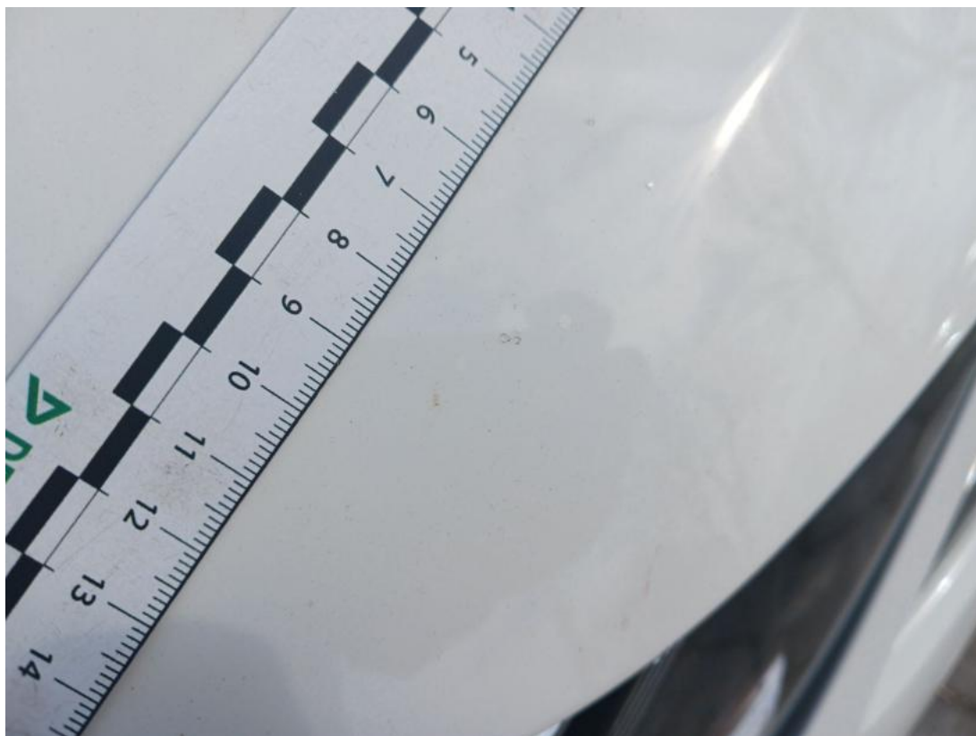
Fot. 39 Pokrywa komory silnika() - Rysa/odprysk 3