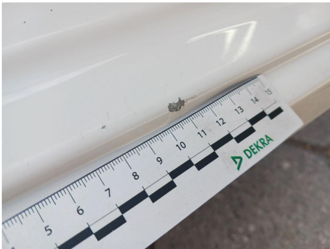
Fot. 43 Próg P - Rysa/odprysk 1