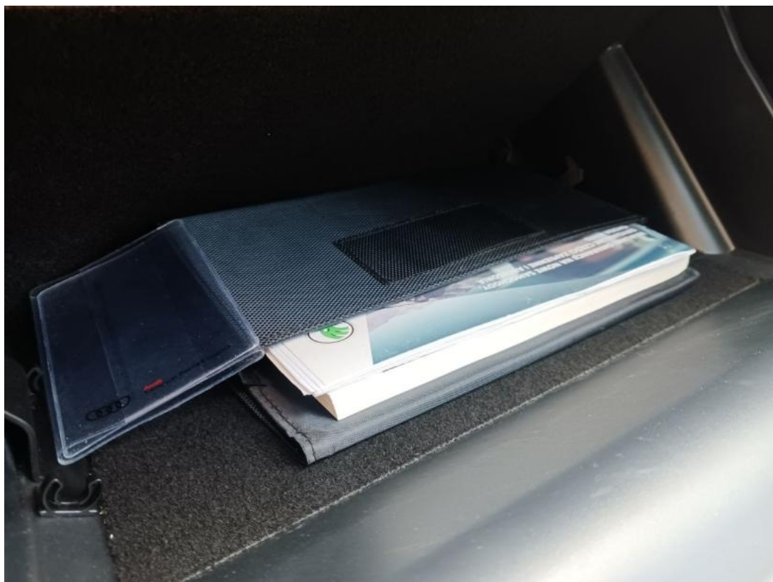
Fot. 35 Instrukcje