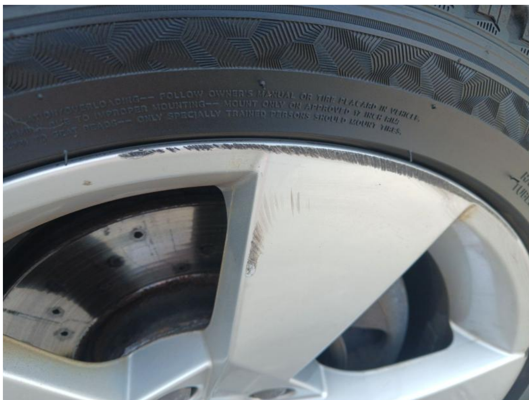
Fot. 40 Felga aluminiowa przednia P - Rysa/odprysk 1