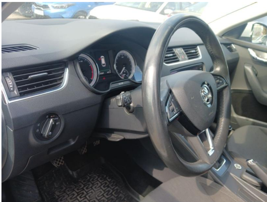
Fot. 23 Kierownica z lewej strony