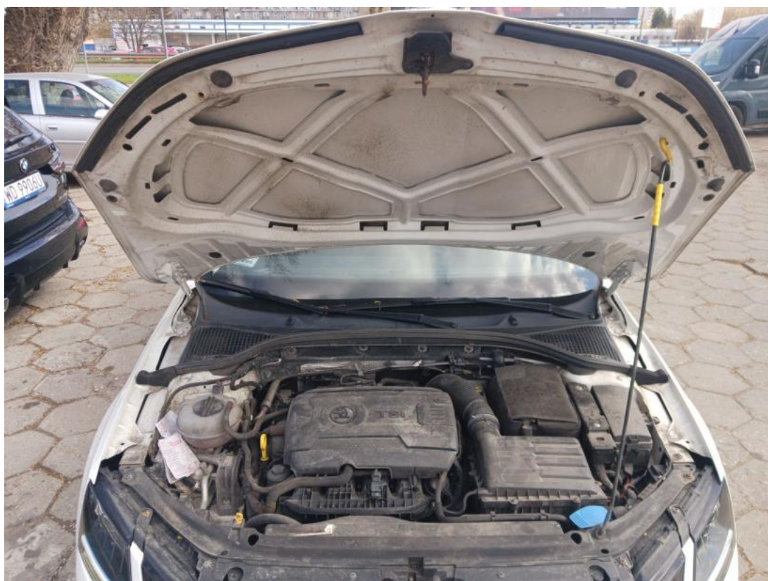
Fot. 24 Komora silnika