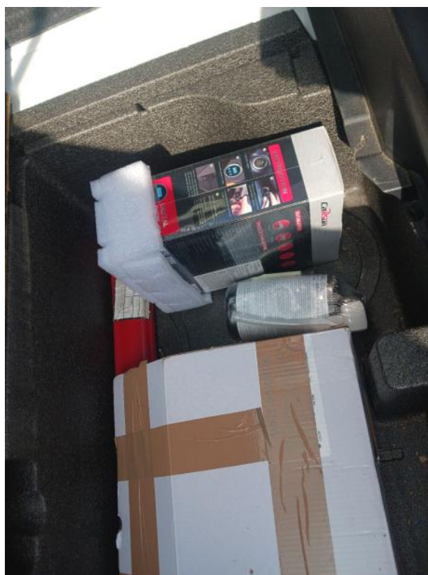
Fot. 36 Zestaw naprawczy koła