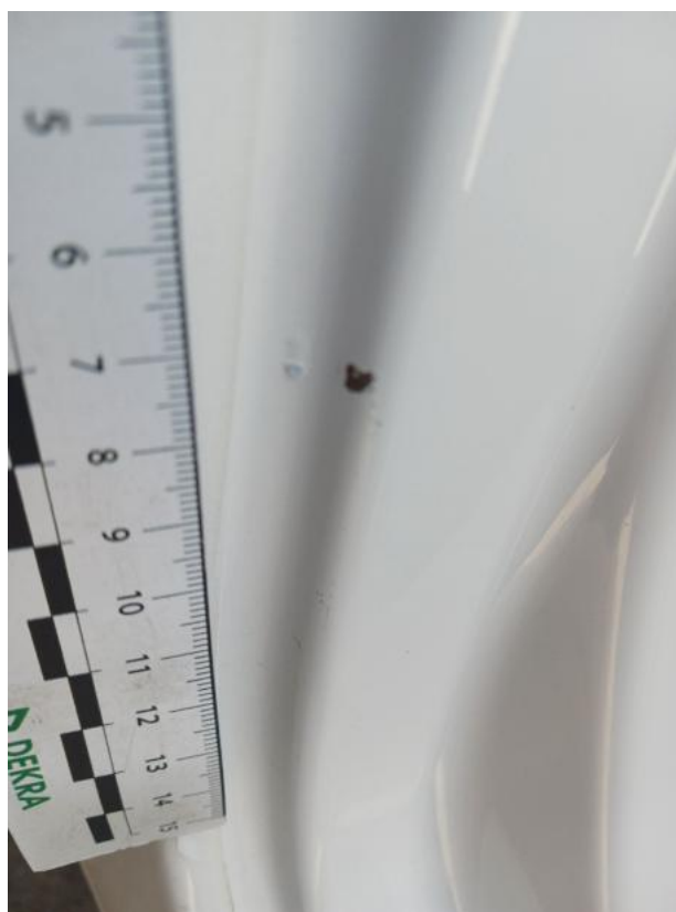
Fot. 44 Próg P - Rysa/odprysk 2