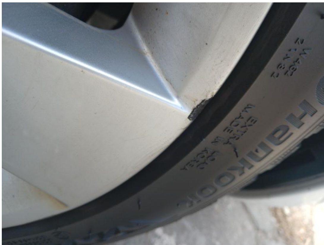
Fot. 41 Felga aluminiowa przednia P - Rysa/odprysk 2