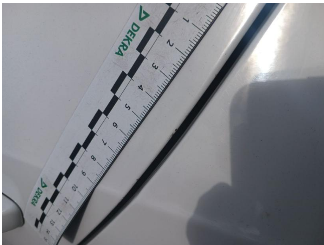
Fot. 49 Drzwi tylne L - Rysa/odprysk 1