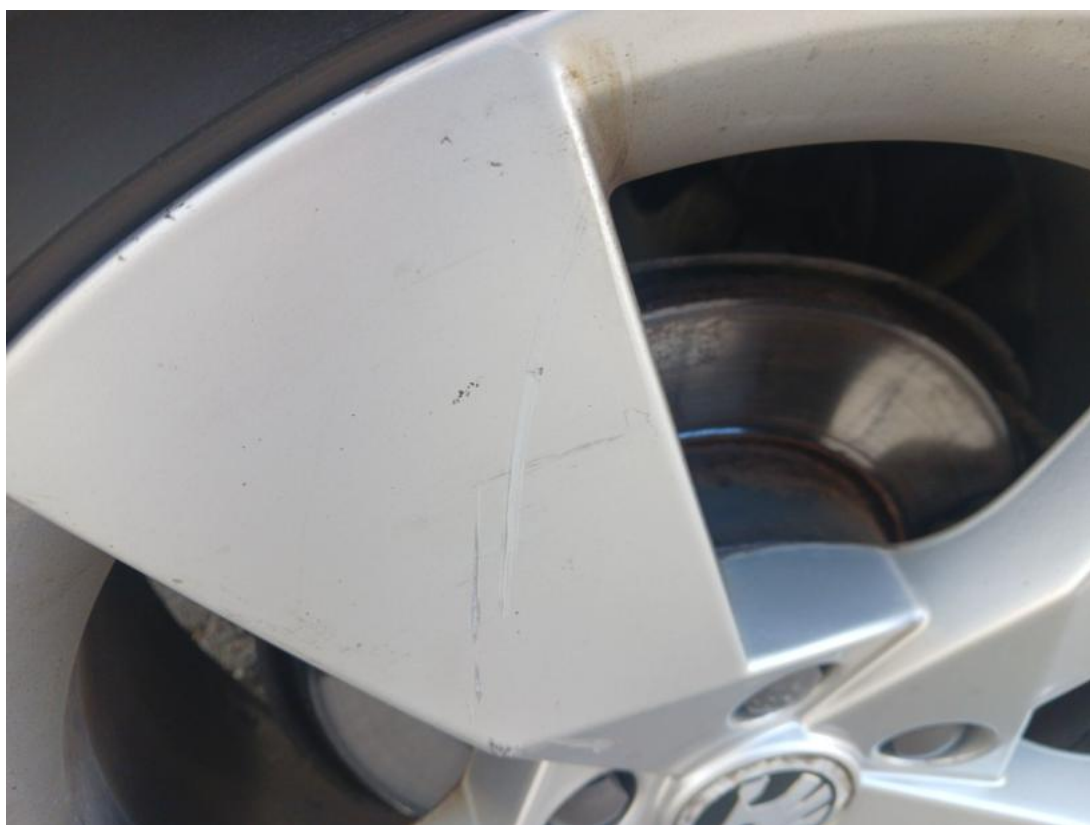
Fot. 46 Felga aluminiowa tylna P - Rysa/odprysk 2