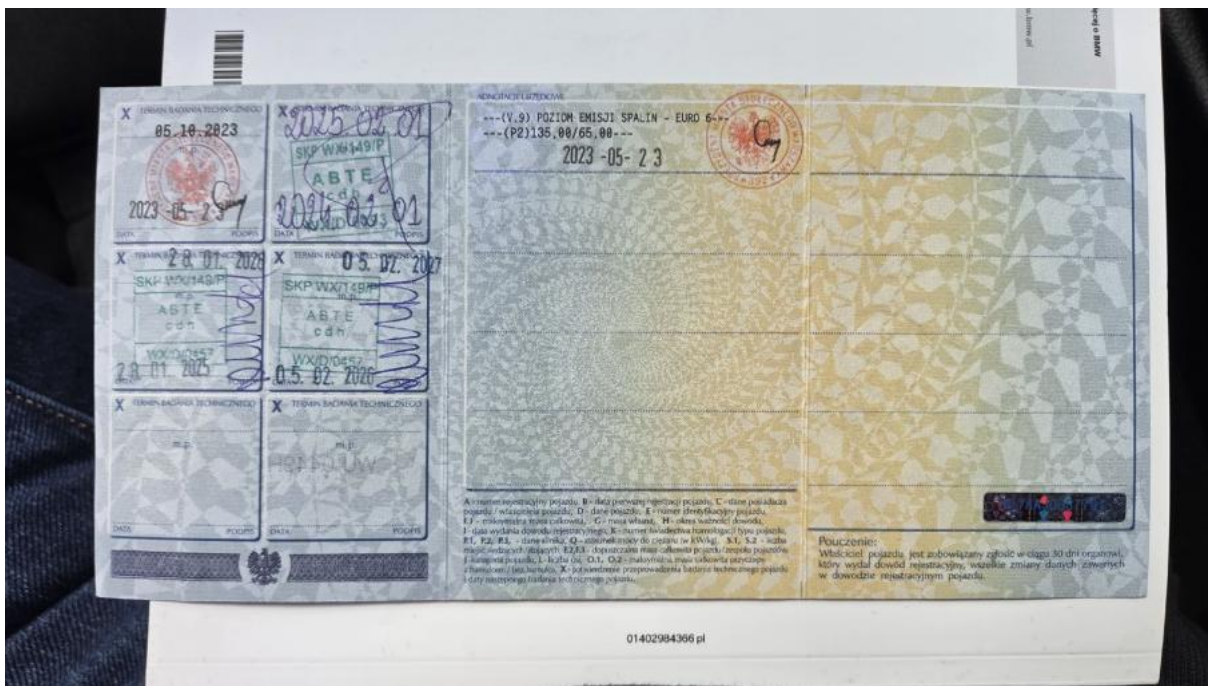
Fot. 33 Dowód rej. str. 2