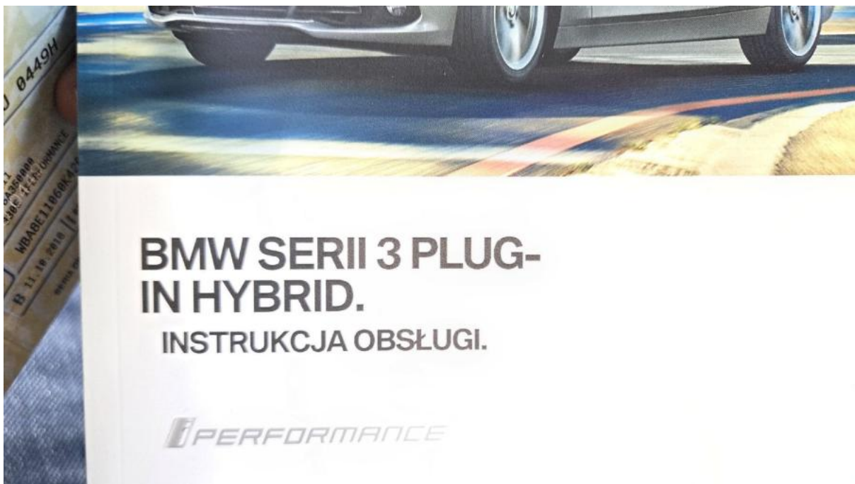
Fot. 34 Instrukcje