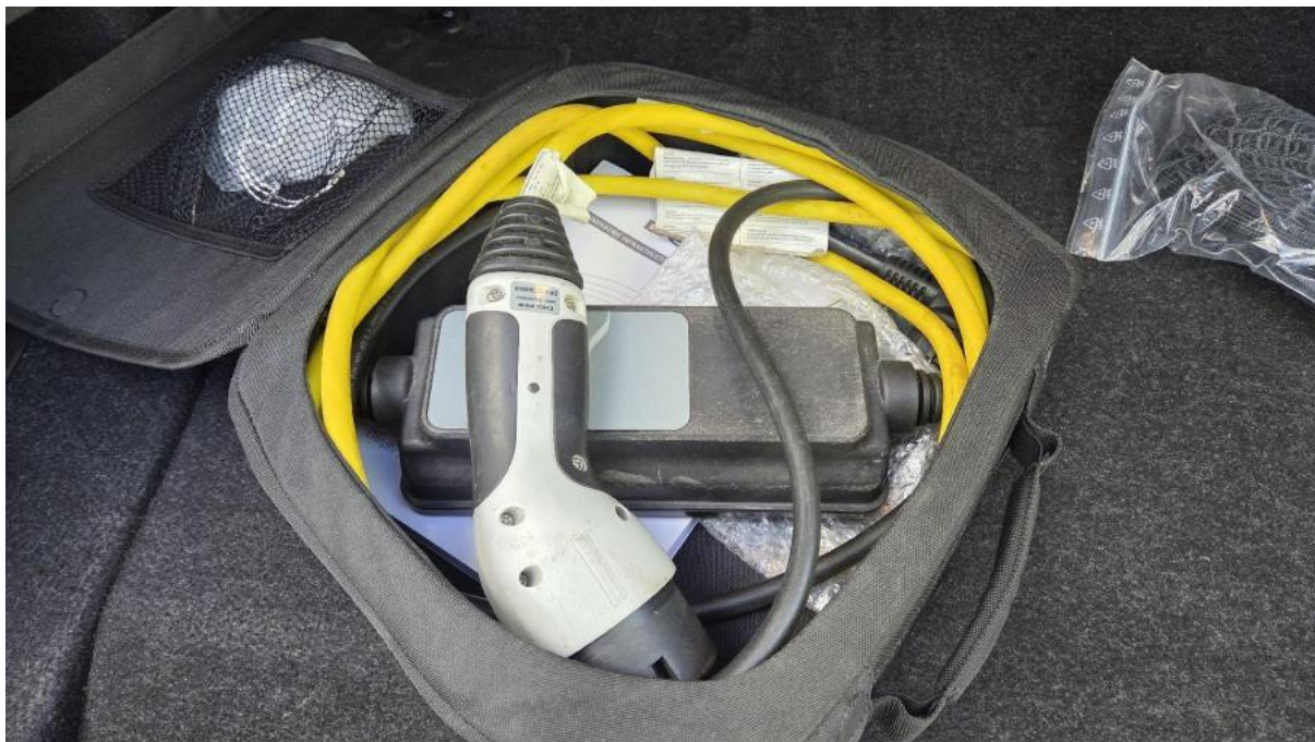
Fot. 36 Zdjęcie do protokołu