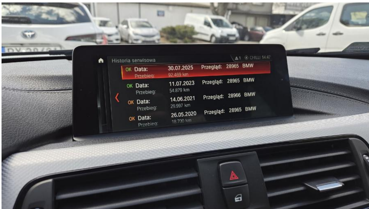
Fot. 16 Zestaw wskaźników - serwis