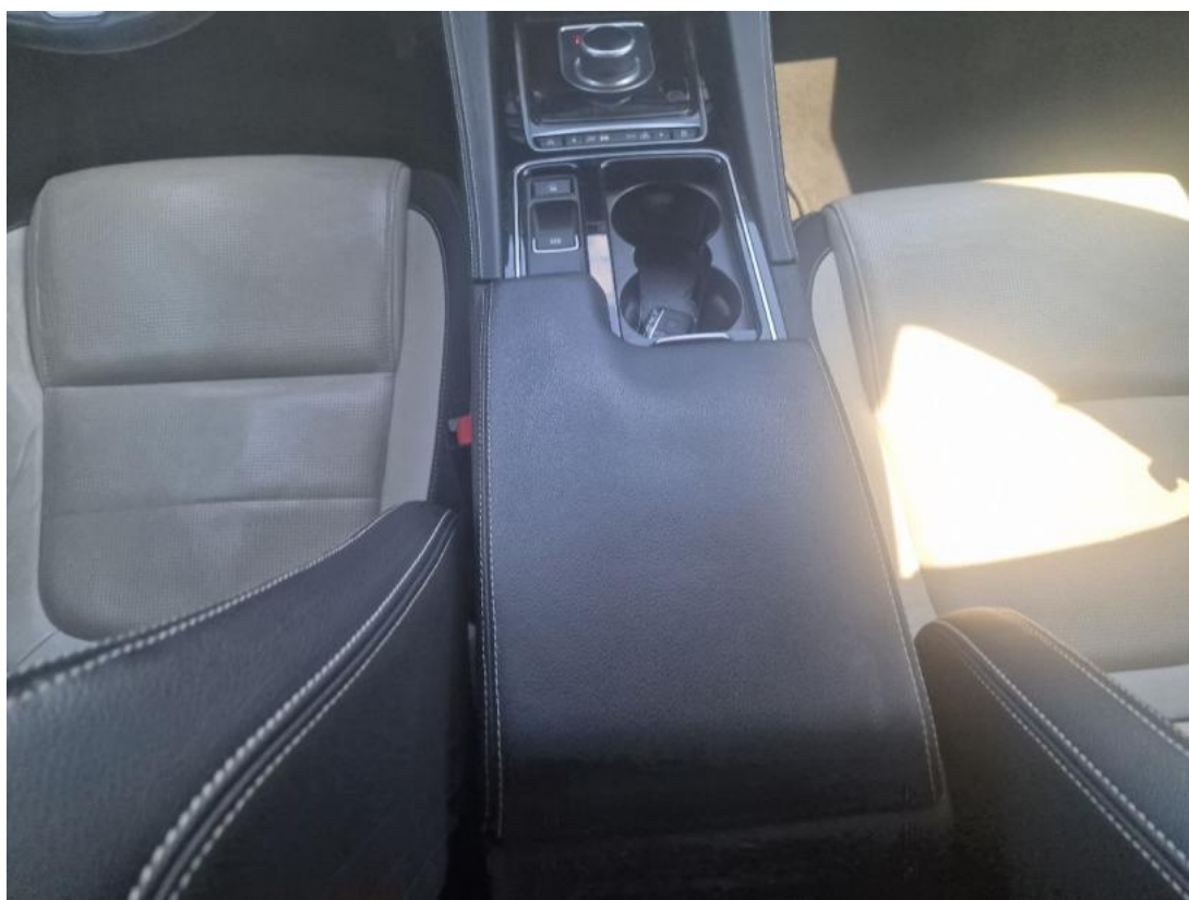
Fot. 20 Tunel środkowy