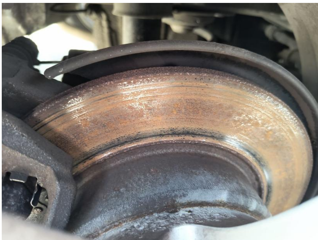
Fot. 30 Tarcza hamulcowa tylna prawa