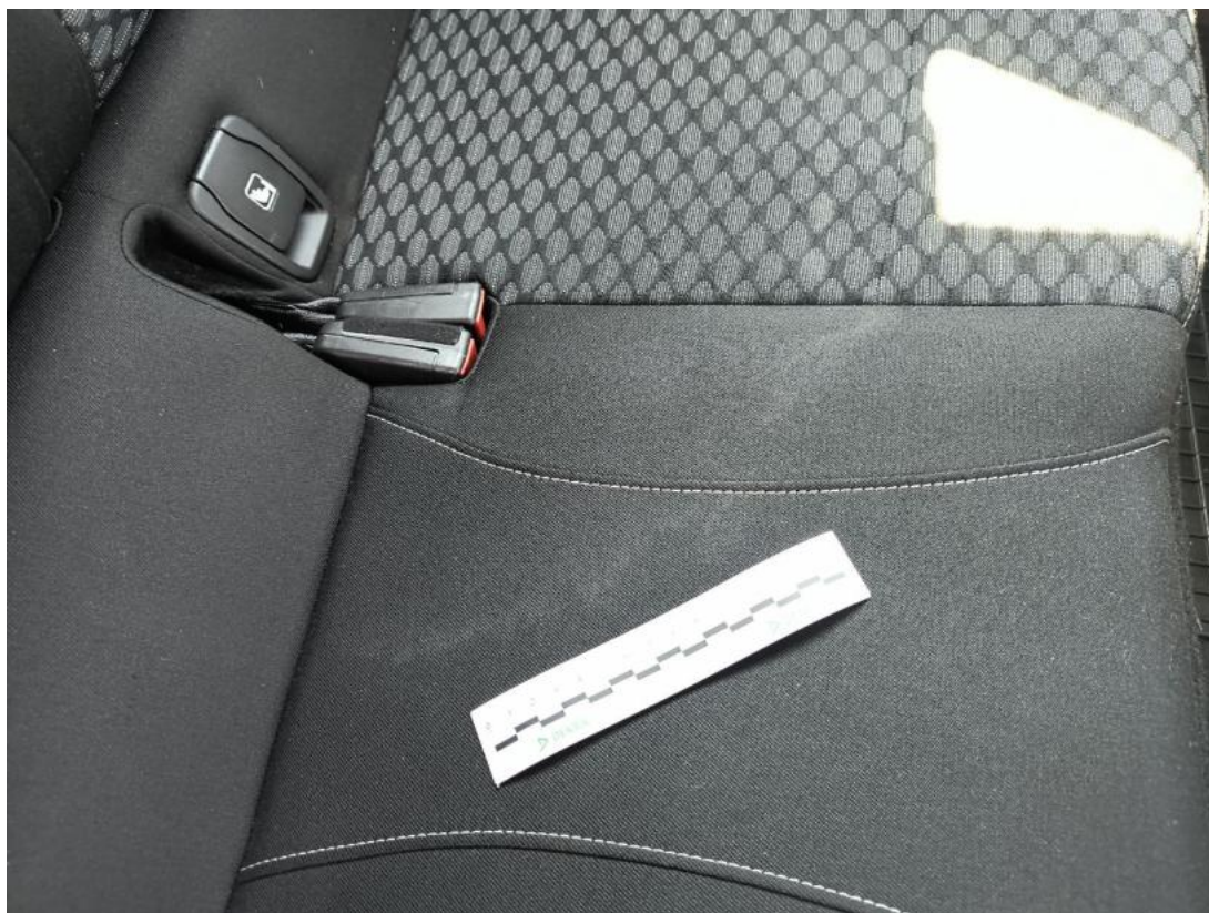
Fot. 53 Kanapa tyl. - Inne 1