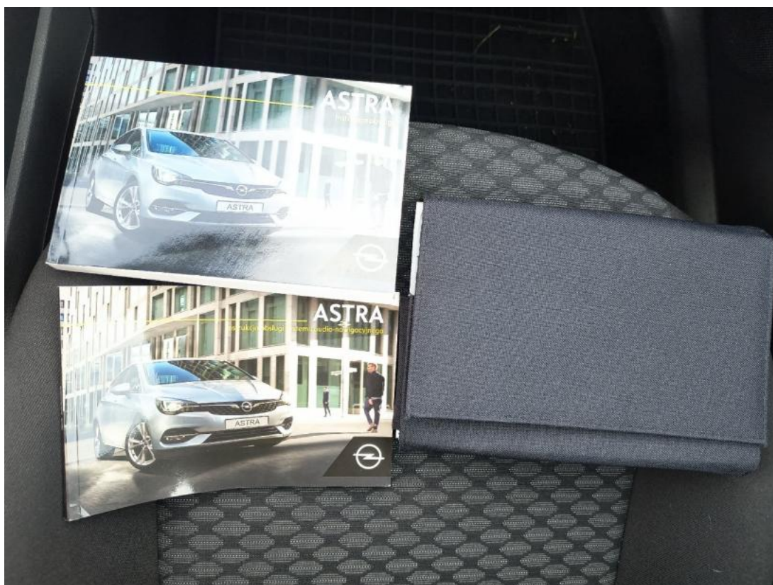
Fot. 14 Instrukcje