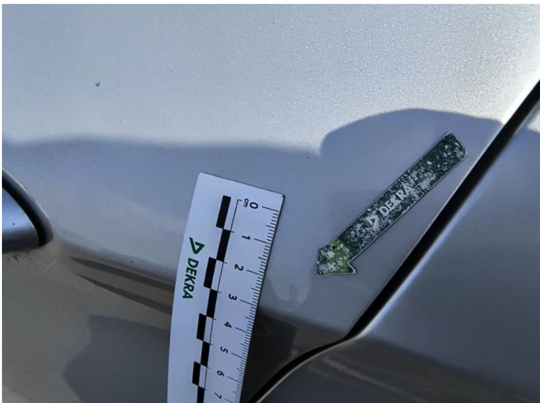
Fot. 47 Drzwi tylne L - Wgniecenie/odkształcenie 1