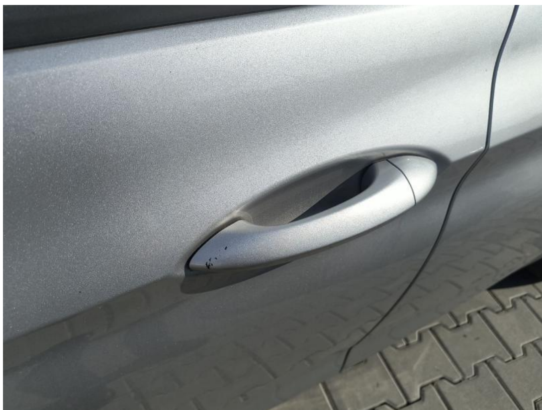
Fot. 48 Klamka drzwi prz L - zdjęcie poglądowe 1