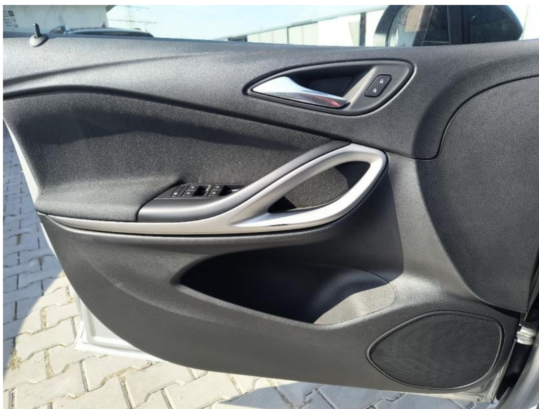
Fot. 54 Tapicerka drzwi przednich L - zdjęcie poglądowe 1