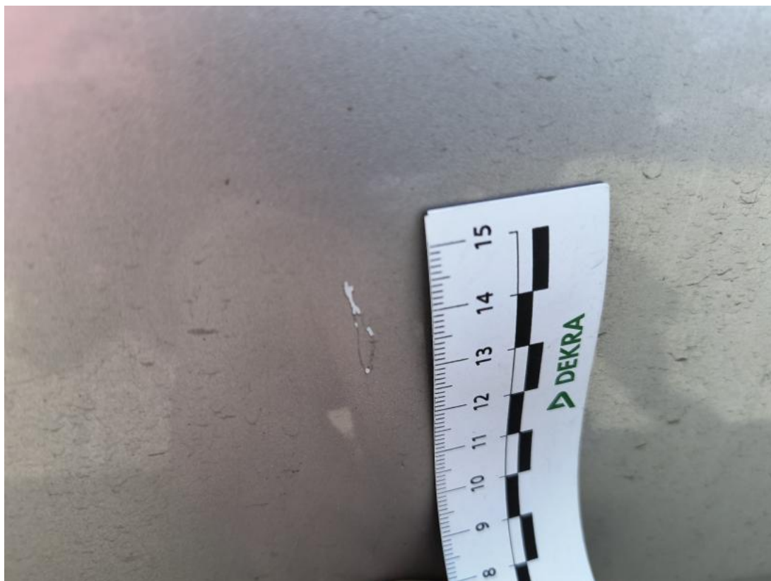
Fot. 39 Drzwi przednie P - Rysa/odprysk 1