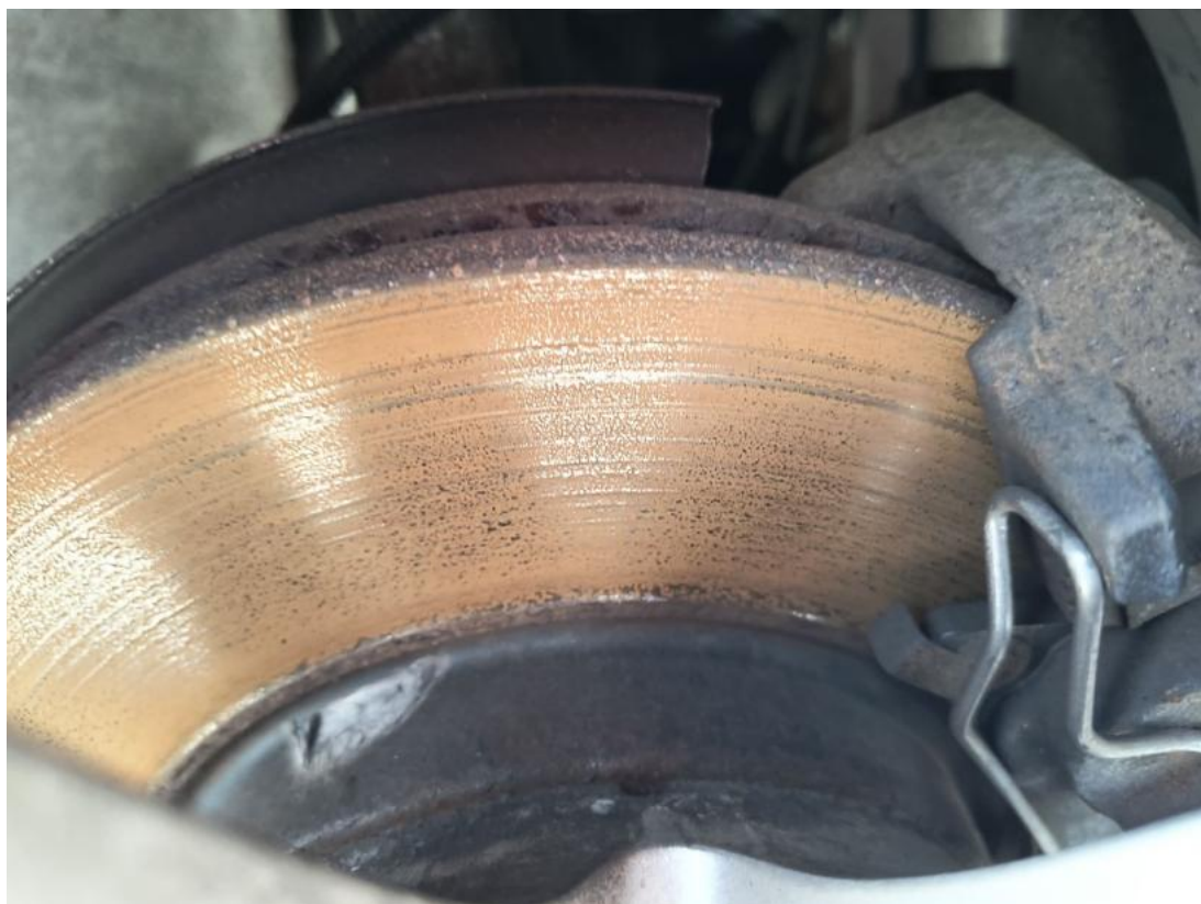
Fot. 29 Tarcza hamulcowa przednia prawa