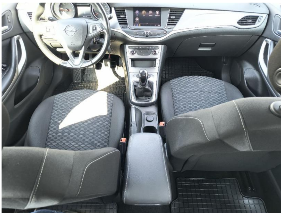
Fot. 20 Tunel środkowy