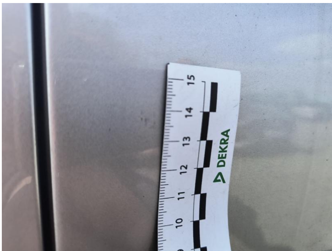
Fot. 40 Drzwi przednie P - Rysa/odprysk 2