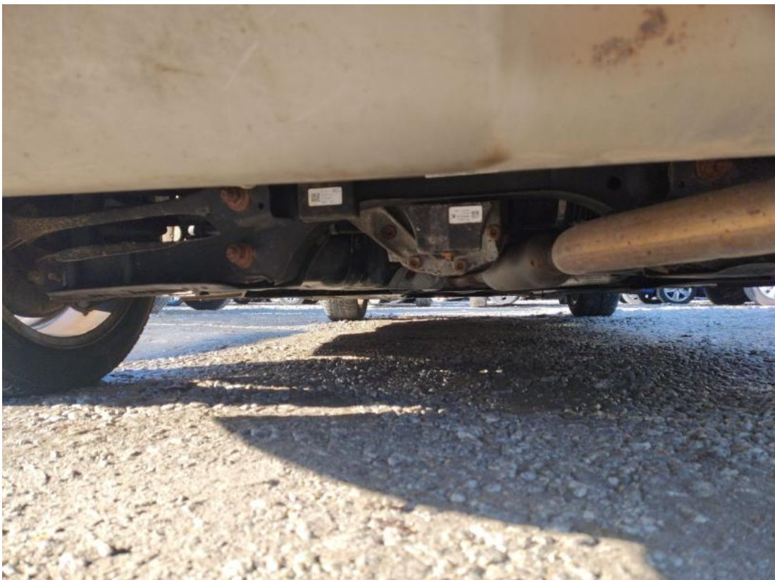
Fot. 28 Spód pojazdu tył