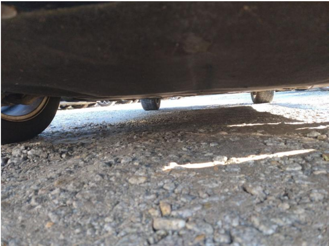
Fot. 27 Spód pojazdu przód