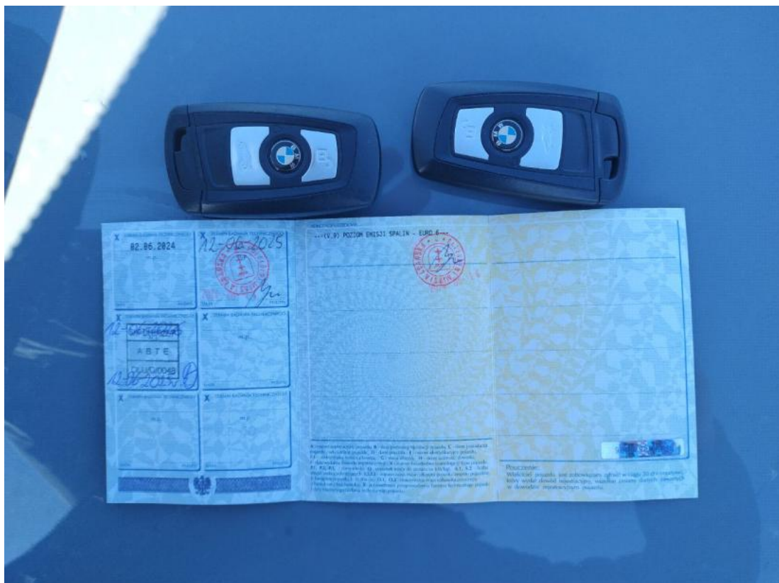
Fot. 34 Dow. Rej. Str.2 i klucze