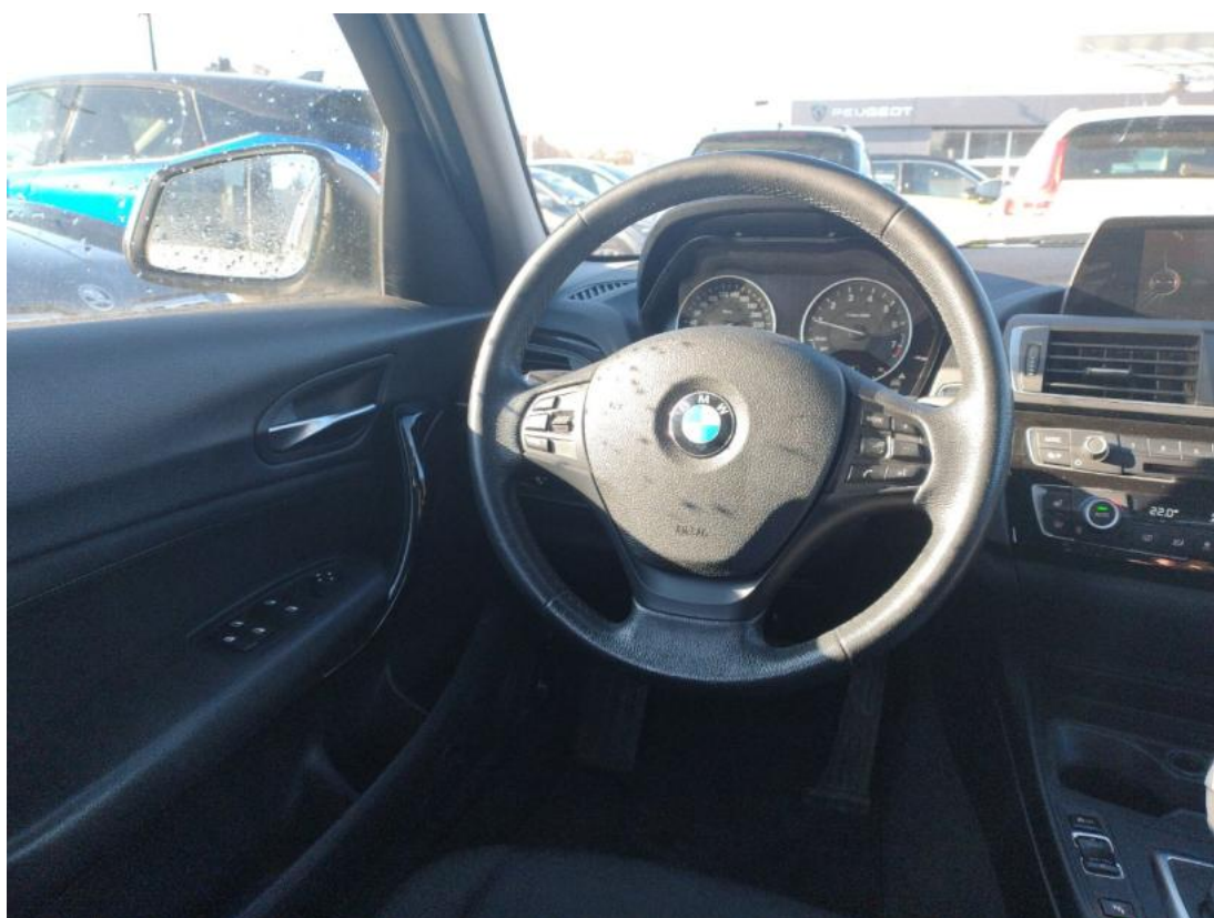
Fot. 22 Kierownica (na wprost)