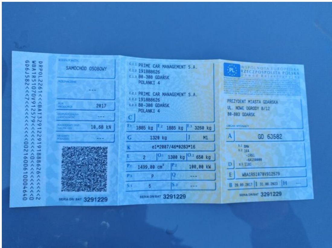
Fot. 33 Dowód rej. Str. 1