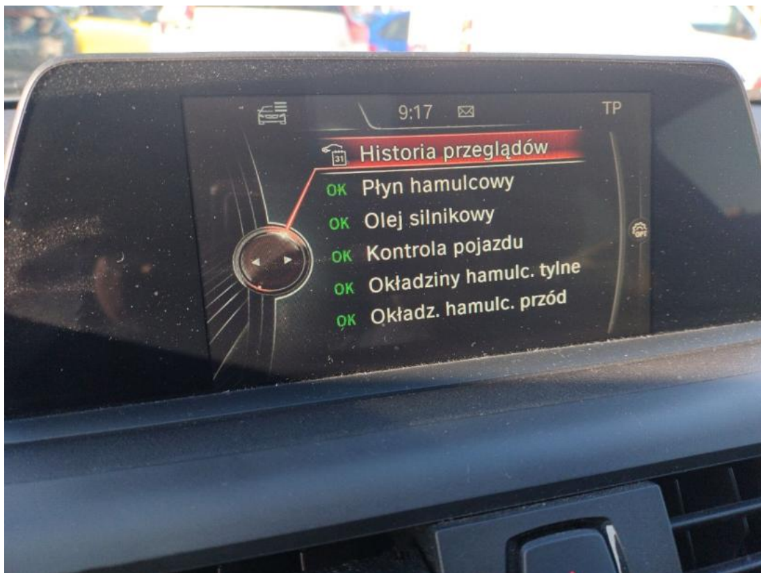
Fot. 37 serwis