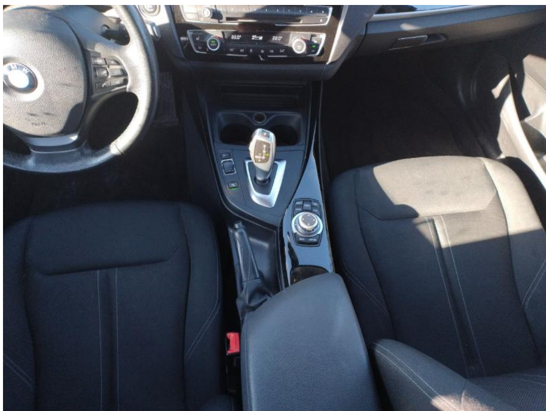
Fot. 21 Tunel środkowy