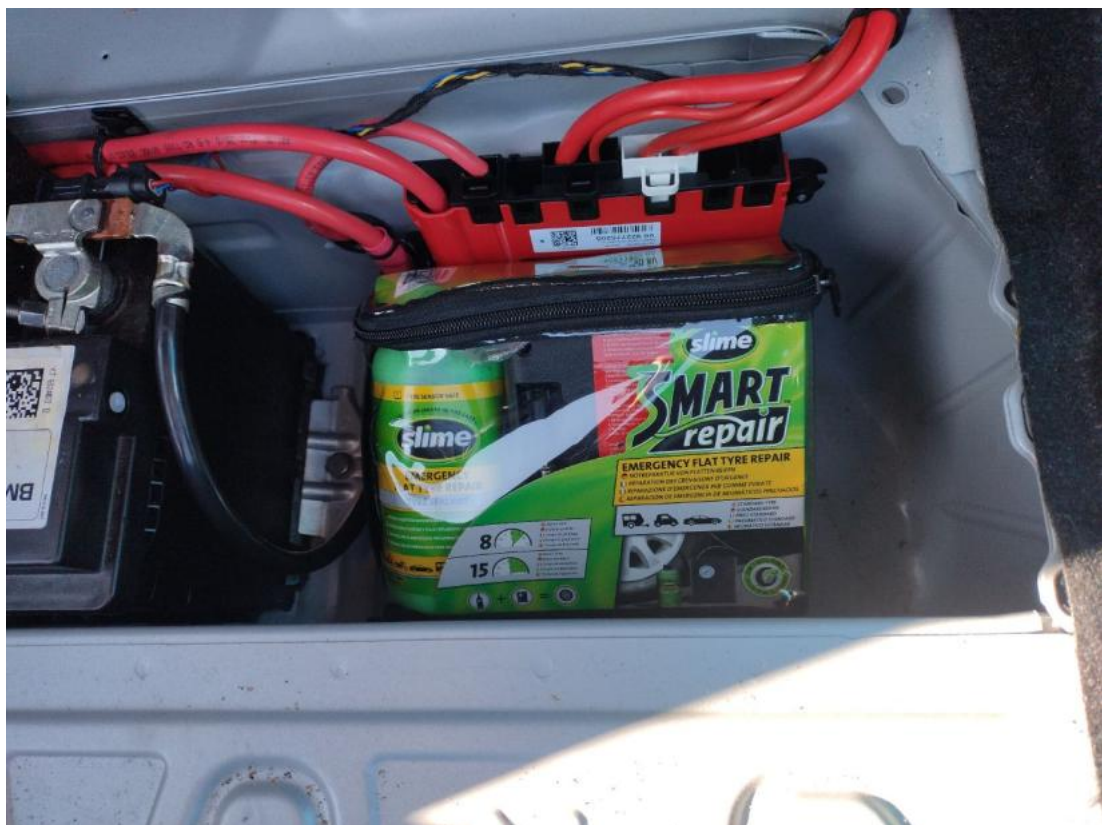
Fot. 36 Zestaw naprawczy koła