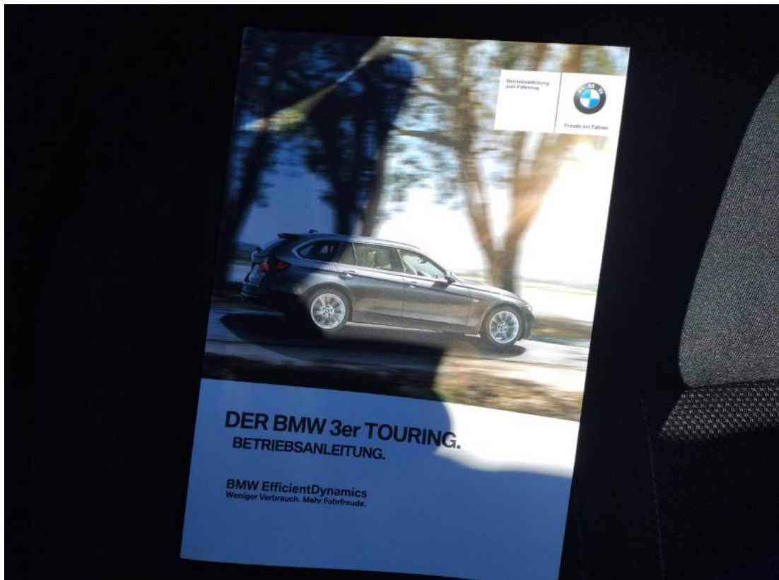
Fot. 35 Instrukcje