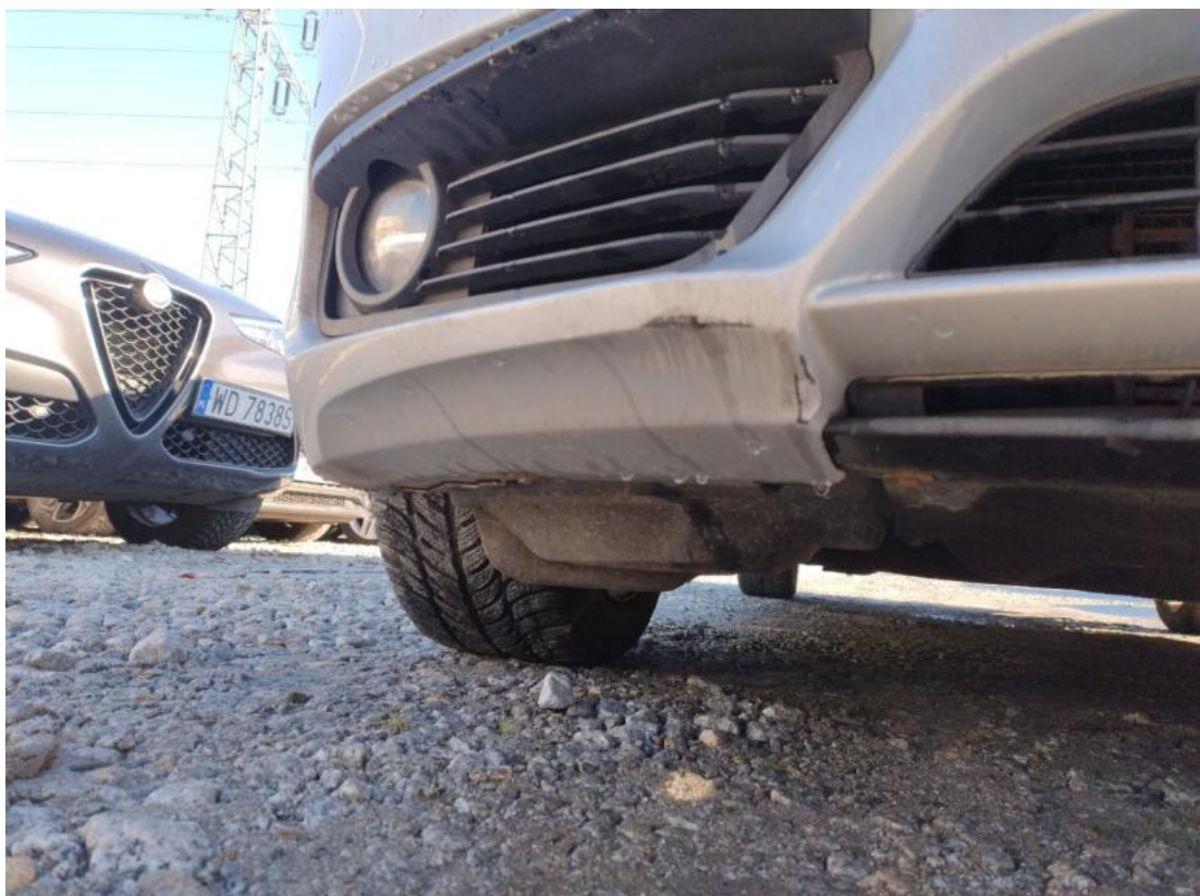
Fot. 40 Zderzak - zdjęcie poglądowe 1