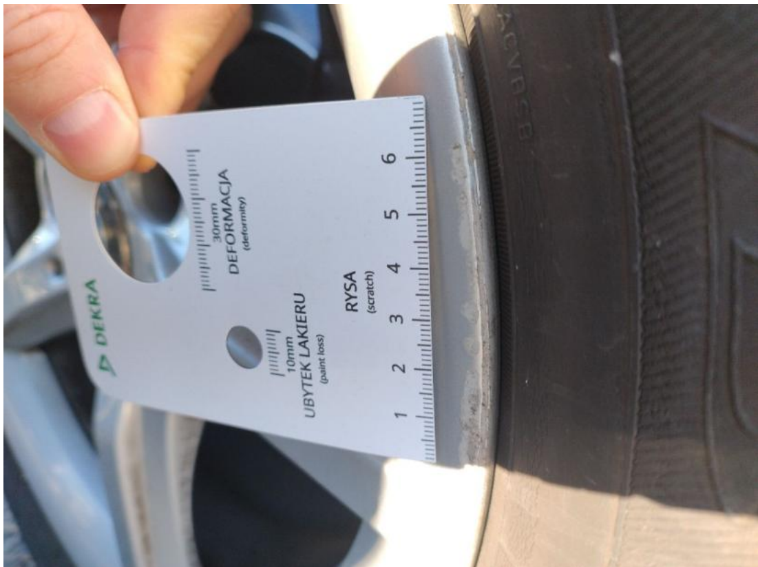
Fot. 45 Felga Aluminiowa przednia L - zdjęcie poglądowe 2