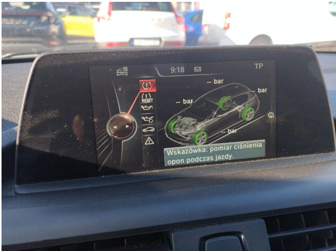
Fot. 39 cd