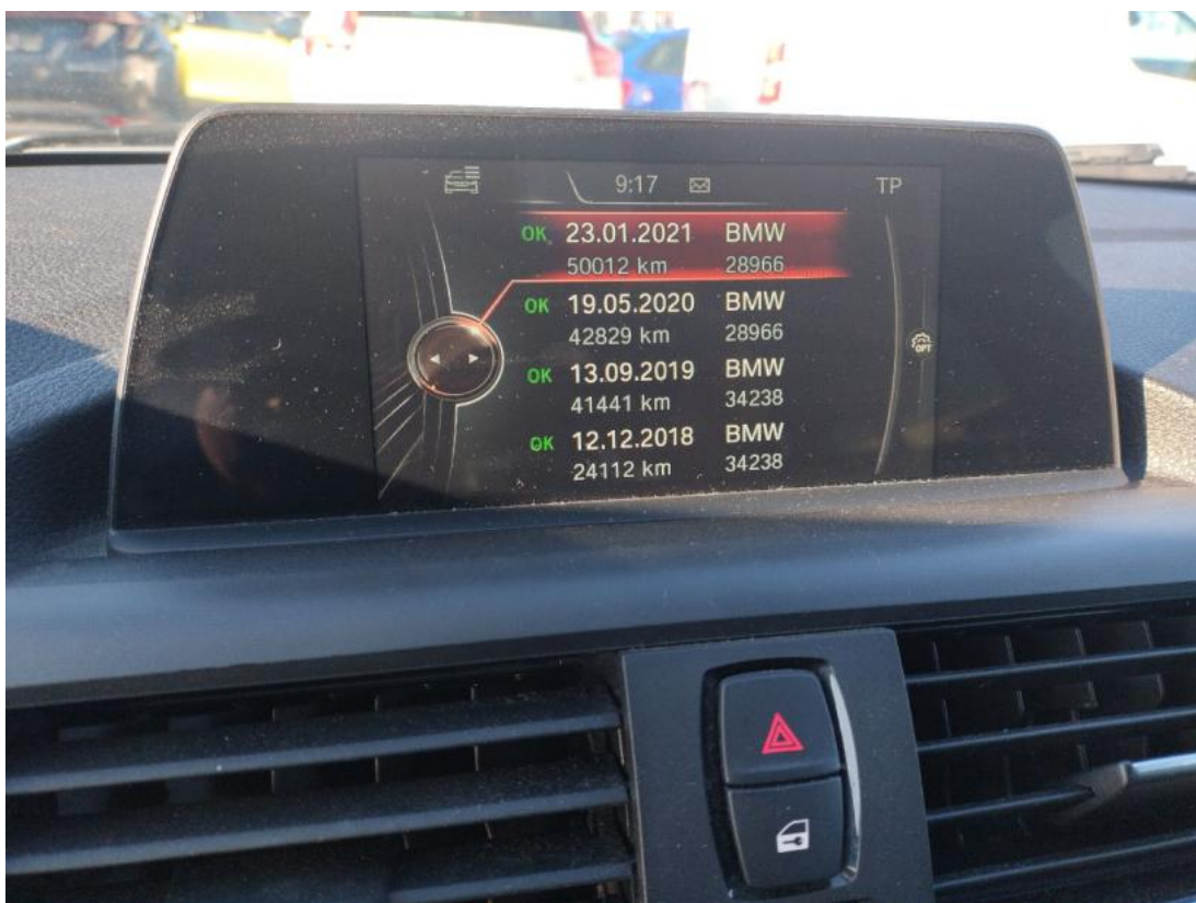
Fot. 16 Zestaw wskaźników - serwis