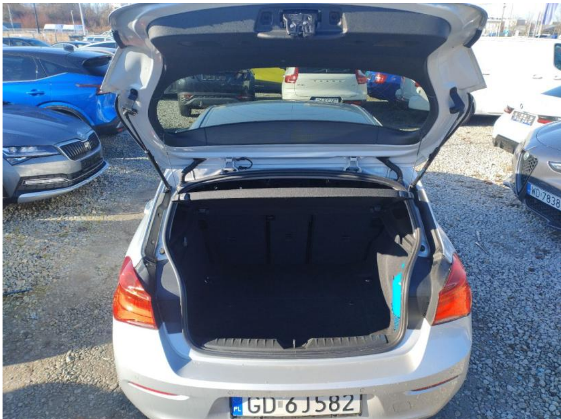
Fot. 25 Bagażnik