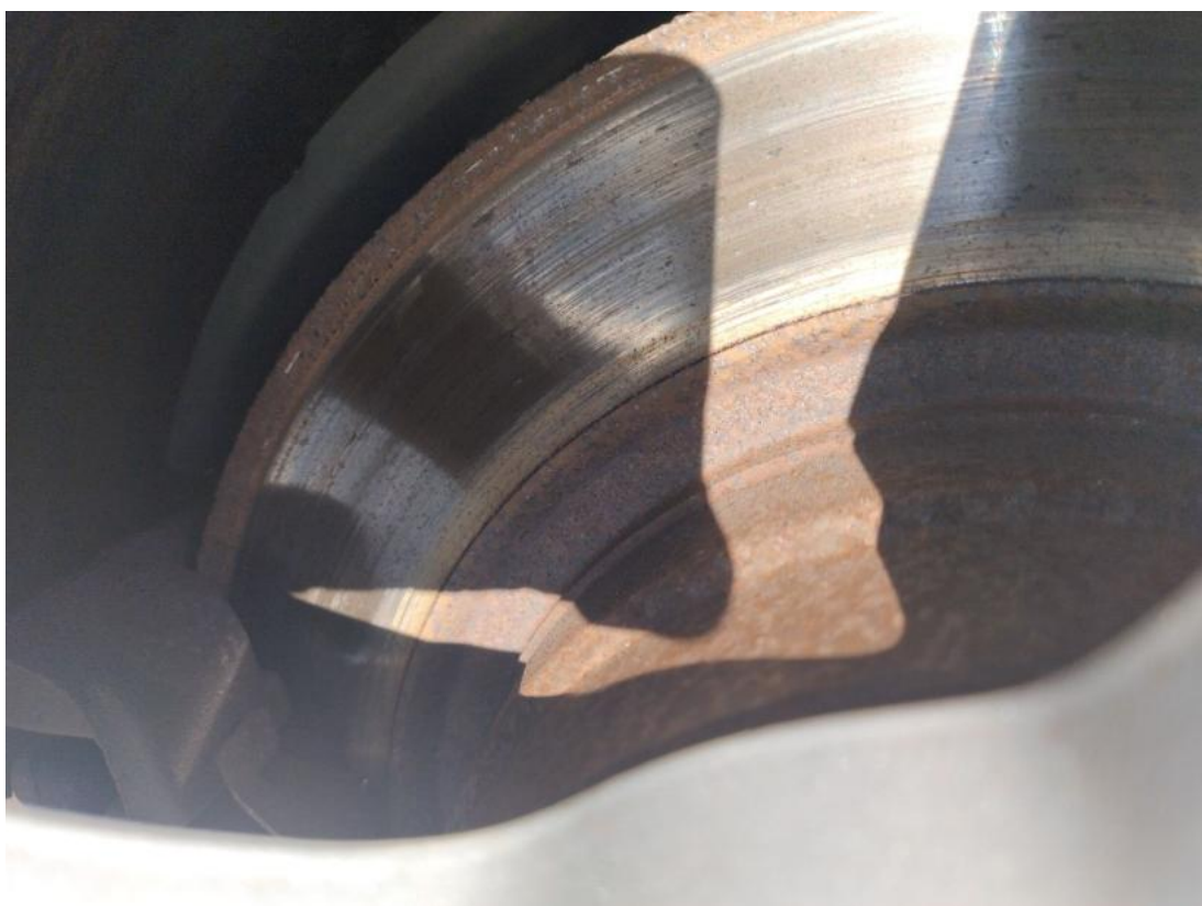
Fot. 32 Tarcza hamulcowa tylna lewa