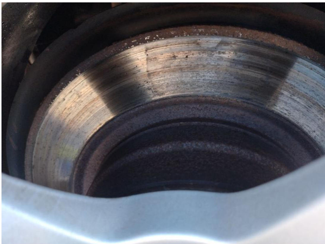
Fot. 31 Tarcza hamulcowa tylna prawa