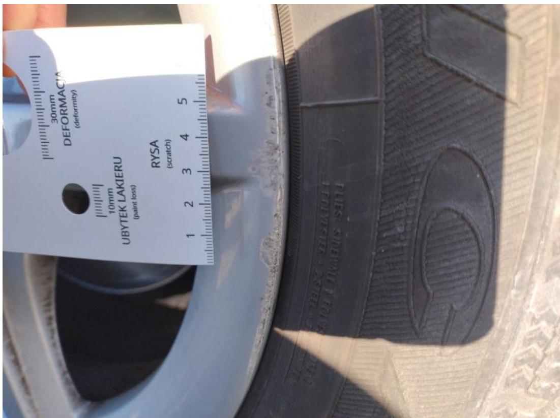
Fot. 46 Felga Aluminiowa przednia L - Wgniecenie/odkształcenie 1