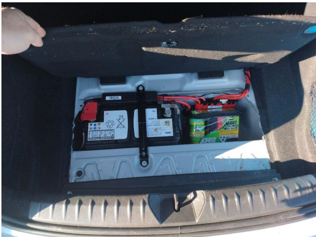
Fot. 26 Koło zapasowe