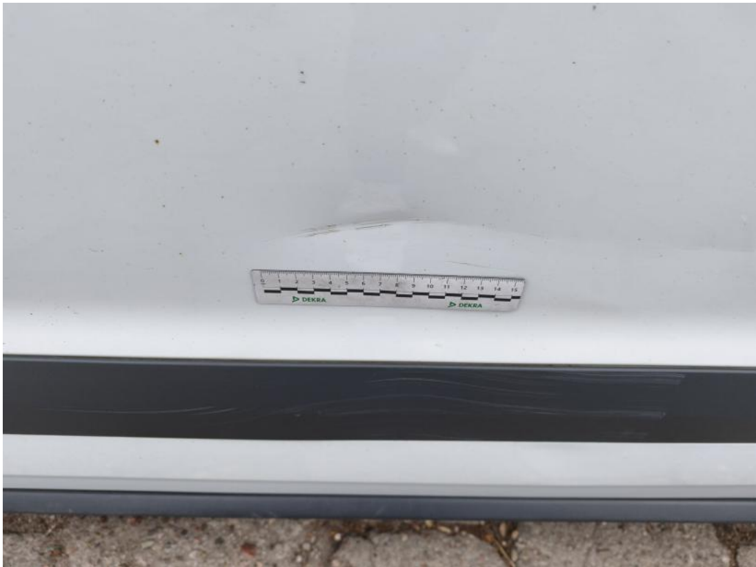
Fot. 67 Drzwi przed L - Wgniecenie/odkształcenie 1