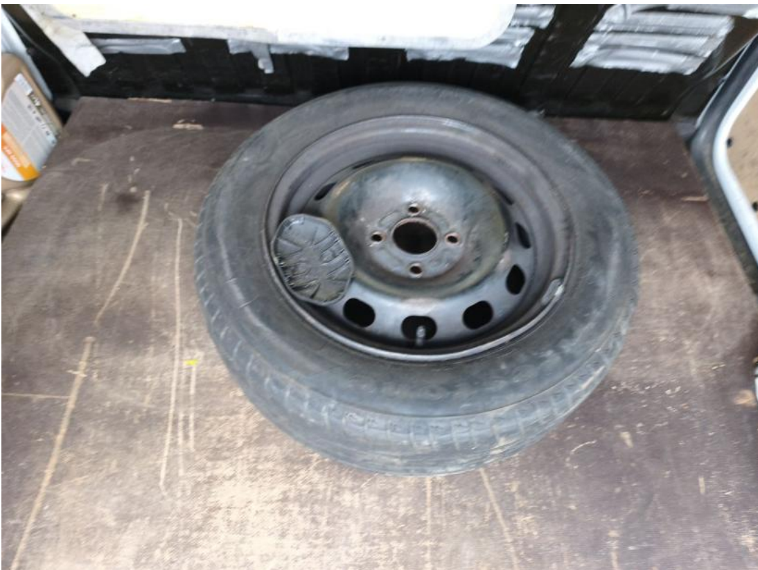
Fot. 26 Koło zapasowe