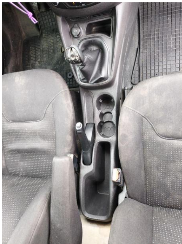
Fot. 21 Tunel środkowy