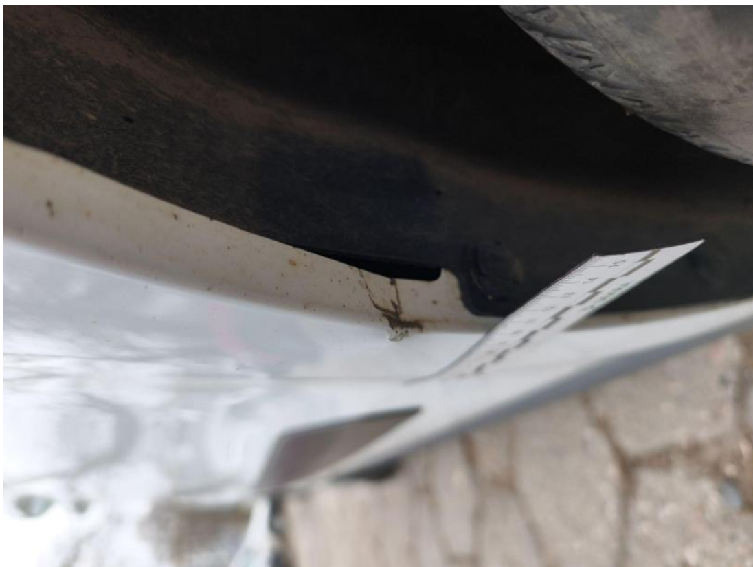
Fot. 44 Błotnik przedni P - zdjęcie pogładowe 2