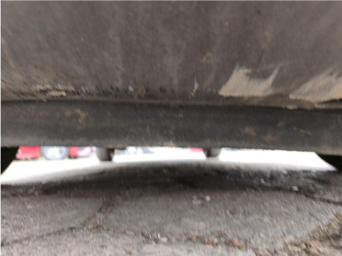
Fot. 27 Spód pojazdu przód