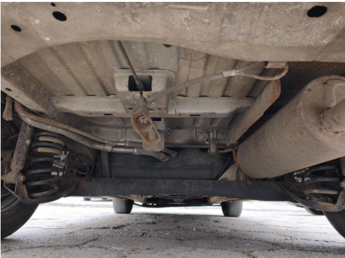
Fot. 28 Spód pojazdu tył