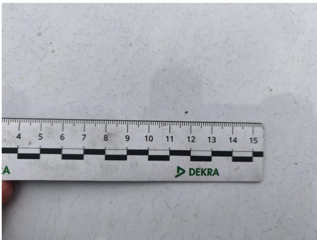
Fot. 36 Pokrywa komory silnika - Rysa/odprysk 1