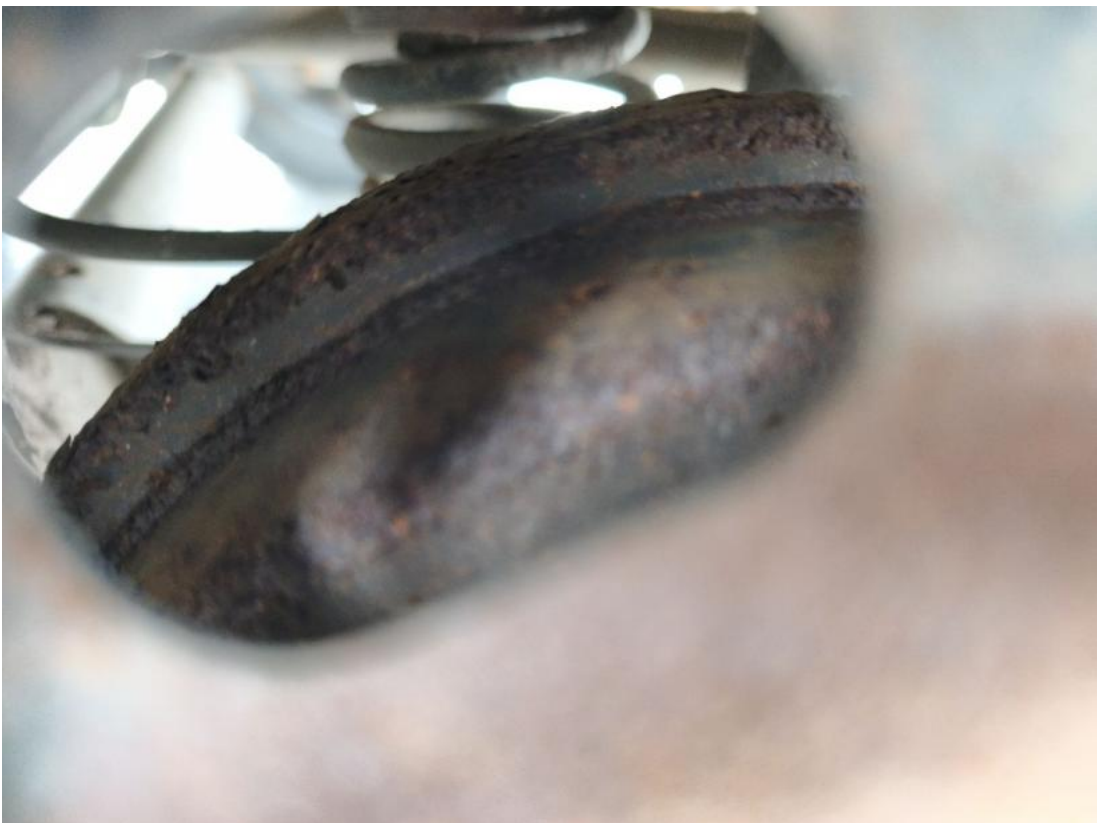
Fot. 32 Tarcza hamulcowa tylna lewa