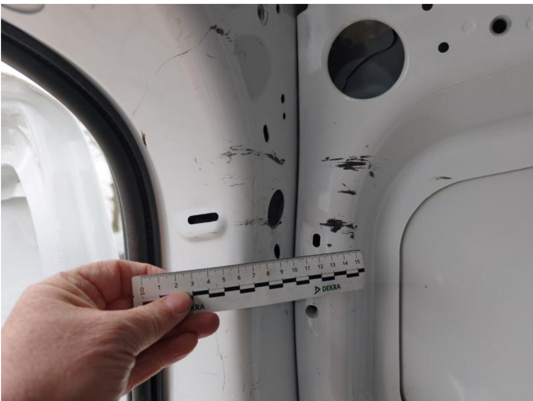
Fot. 84 Ściana lewa - zdjęcie poglądowe 1