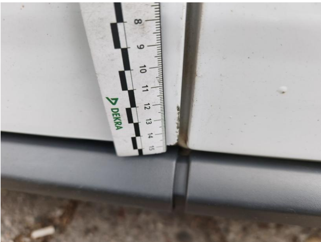
Fot. 66 Drzwi przed L() - Rysa/odprysk 3