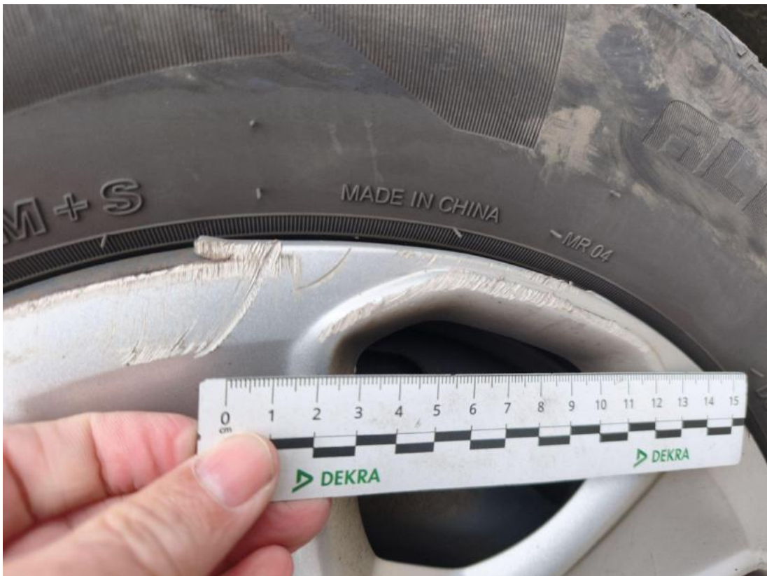
Fot. 47 Kołpak przedni P() - Rysa/odprysk 3