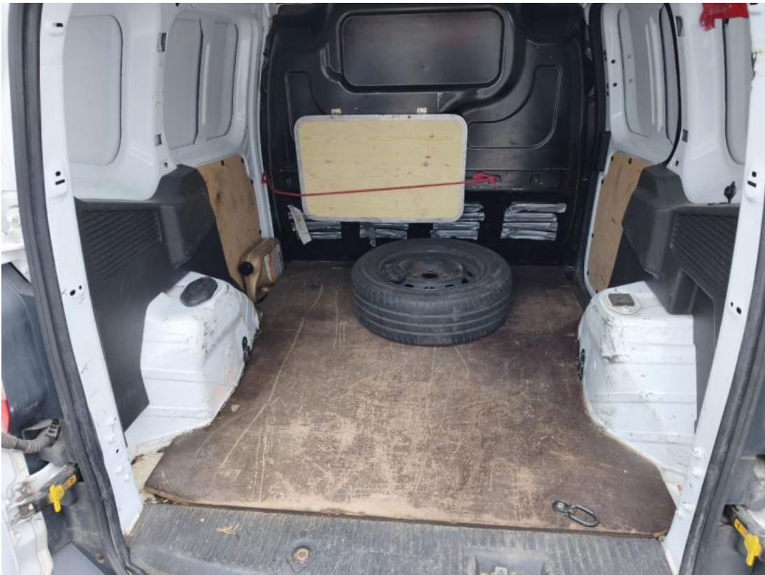
Fot. 25 Bagażnik