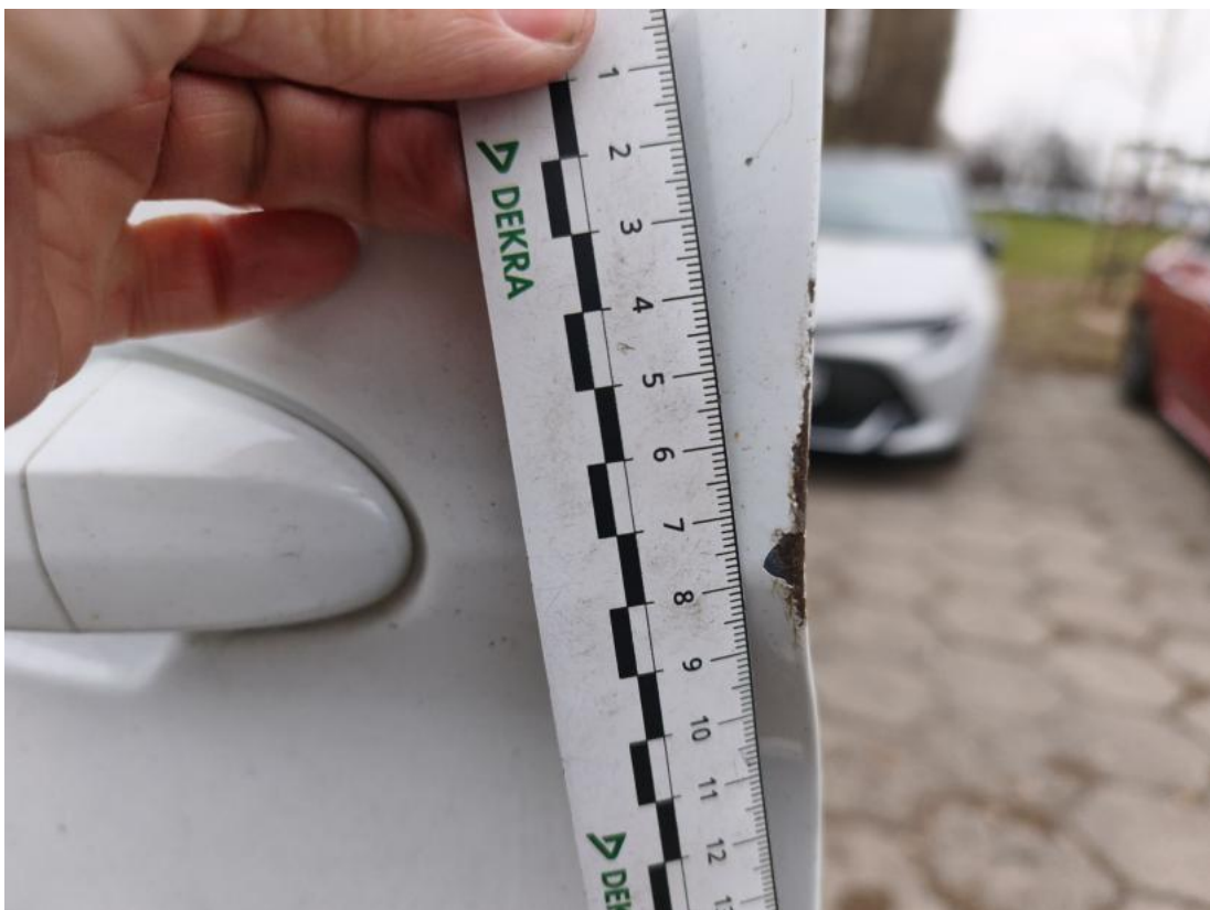
Fot. 72 Drzwi tyłu lewe - Rysa/odprysk 1