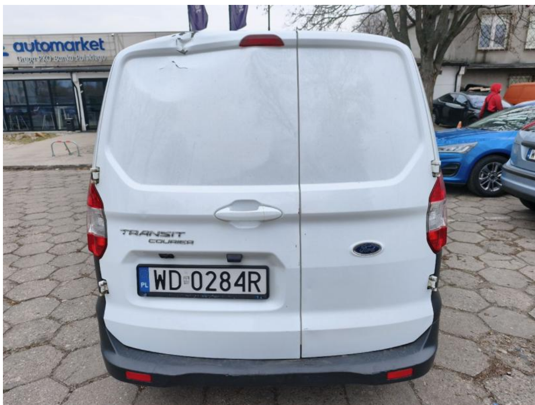
Fot. 8 Tyt