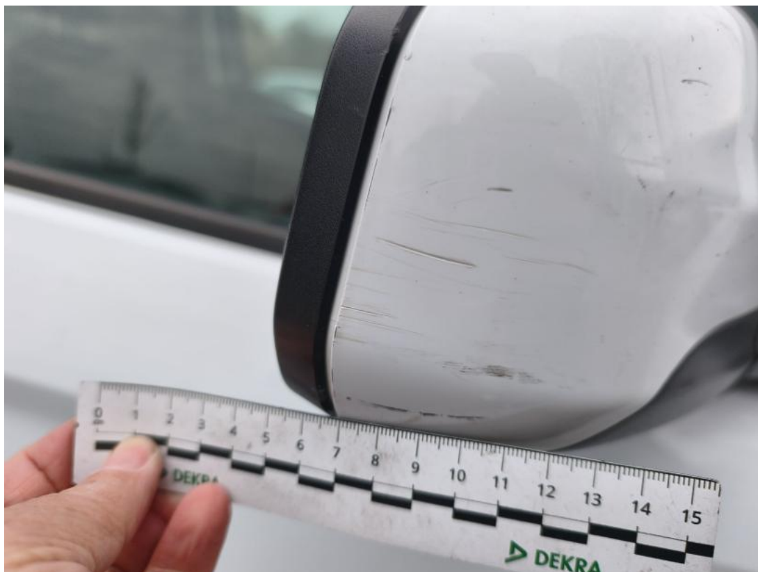
Fot. 49 Obudowa lusterka zew P - Rysa/odprysk 1