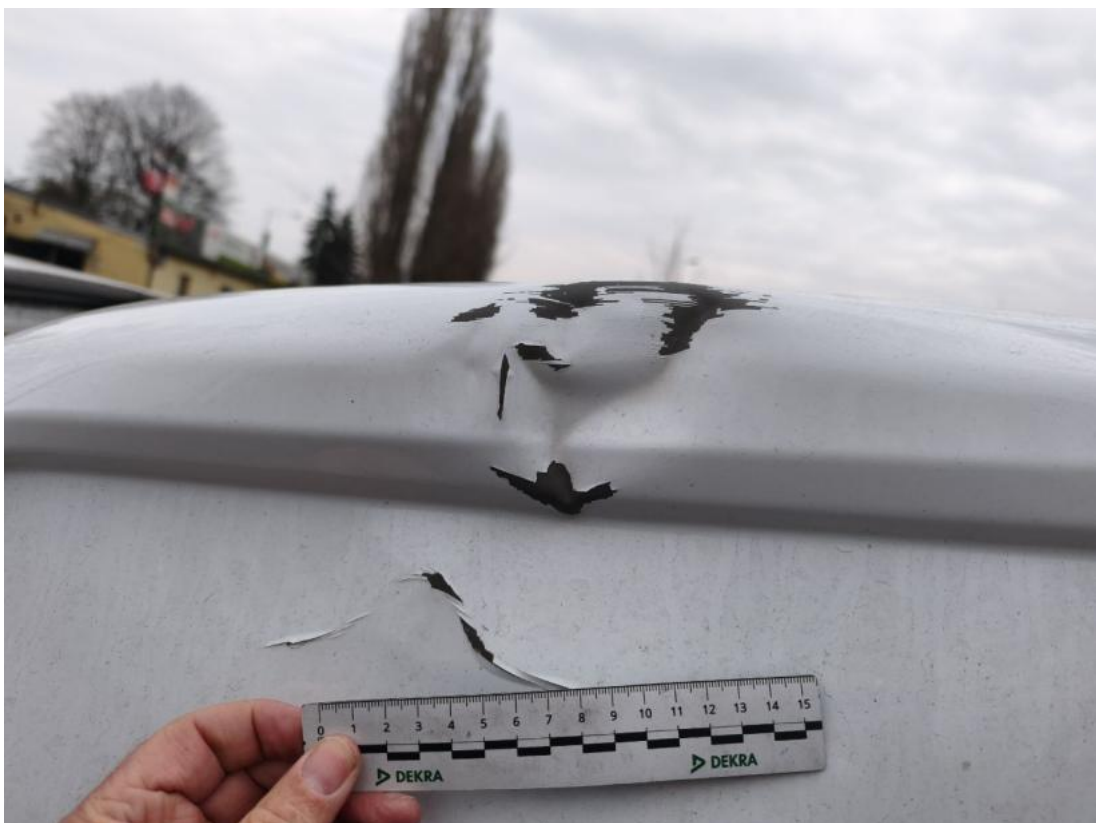
Fot. 76 Drzwi tyłu lewe() - Wgniecenie/odkształcenie 3