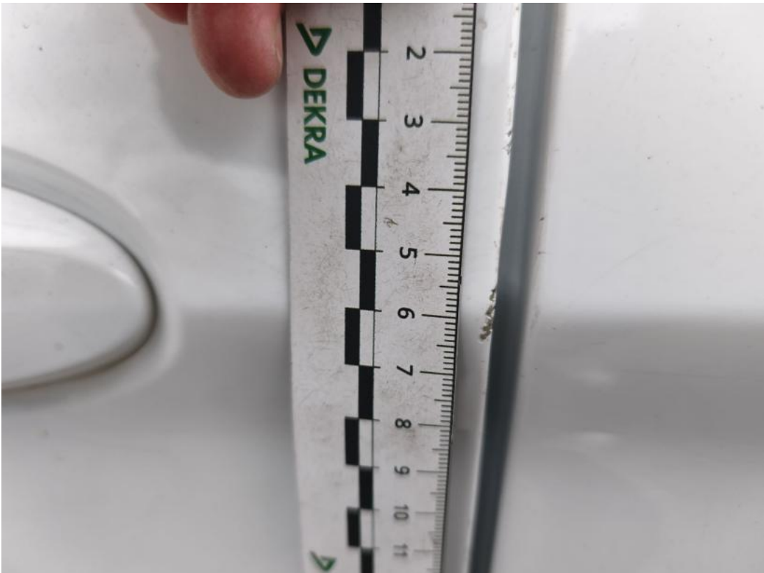
Fot. 65 Drzwi przed L - Rysa/odprysk 1