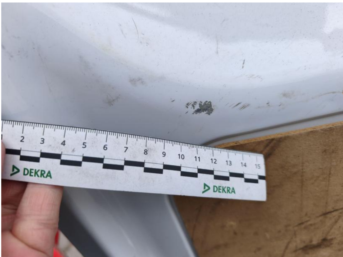
Fot. 78 Drzwi tyłu prawe - zdjęcie poglądowe 2