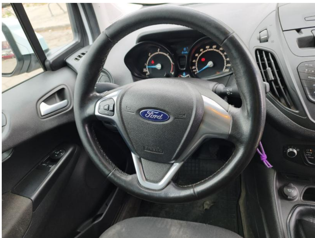
Fot. 22 Kierownica (na wprost)