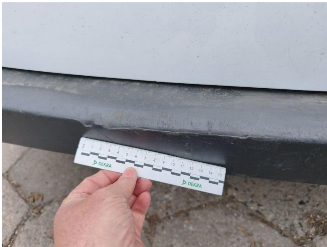
Fot. 55 Zderzak tylny() - Rysa/odprysk 3