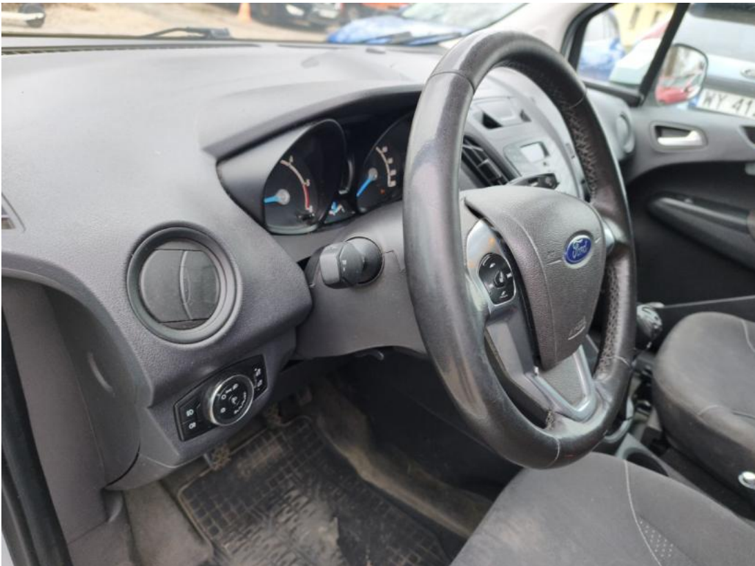
Fot. 23 Kierownica z lewej strony