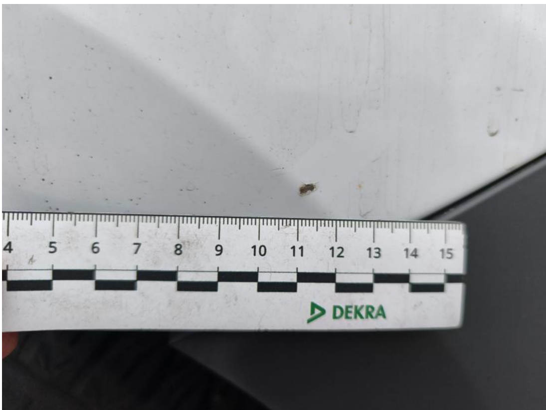
Fot. 58 Błotnik tylny L / Ściana boczna L - Rysa/odprysk 1