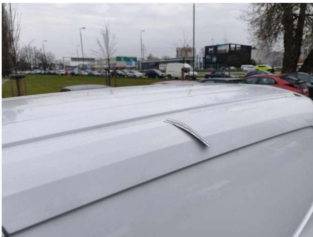
Fot. 56 Rama dachu L - zdjęcie poglądowe 2