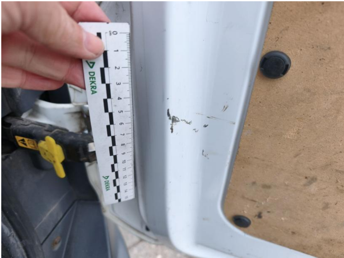
Fot. 77 Drzwi tyłu prawe - zdjęcie poglądowe 1