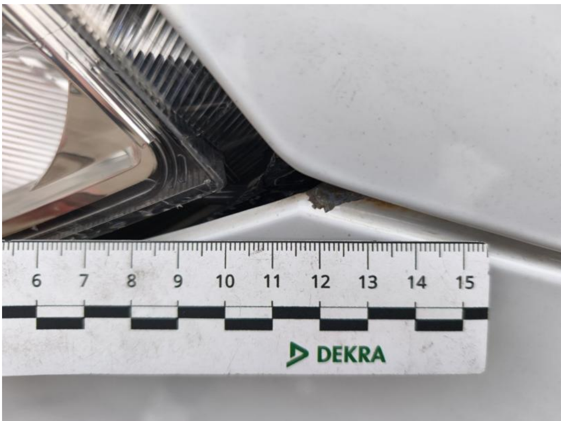
Fot. 68 Błotnik przedni L - Rysa/odprysk 1