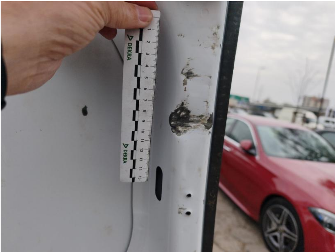
Fot. 83 Drzwi tyłu prawe() - Wgniecenie/odkształcenie 3