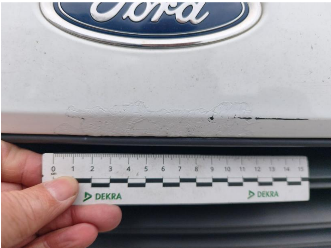
Fot. 42 Zderzak() - Rysa/odprysk 3