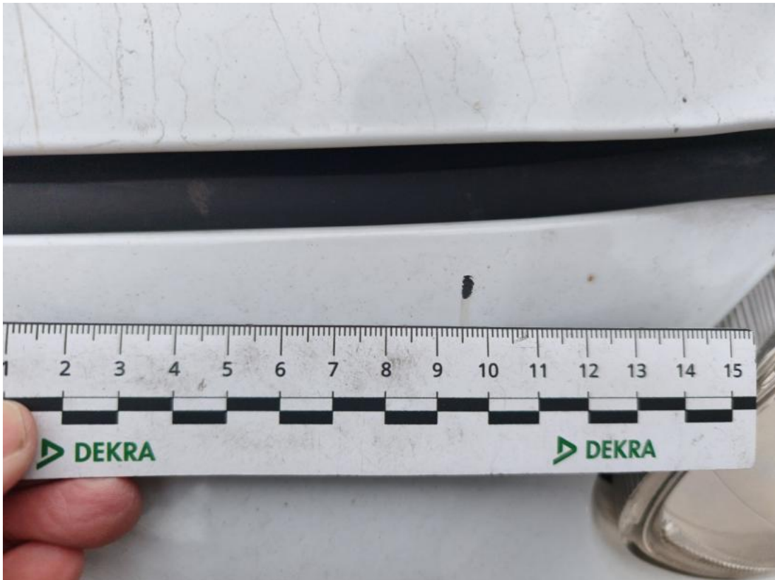
Fot. 41 Zderzak - Rysa/odprysk 1