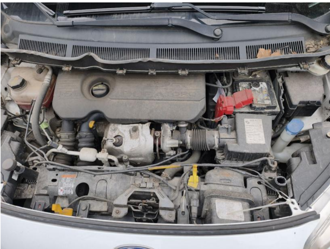
Fot. 24 Komora silnika