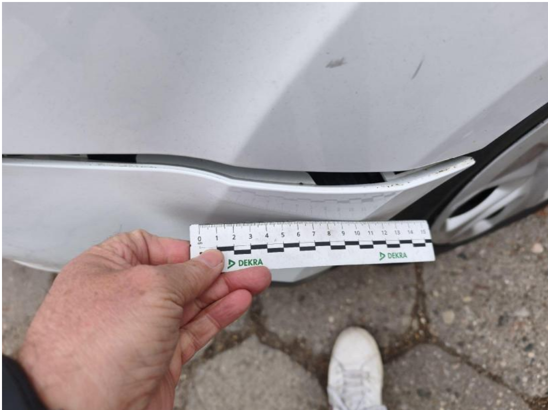
Fot. 43 Zderzak - Inne 1