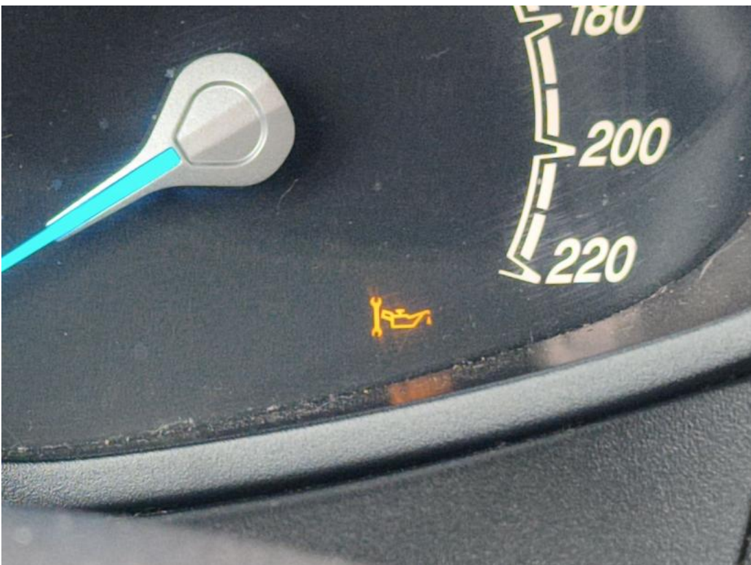
Fot. 16 Zestaw wskaźników - serwis