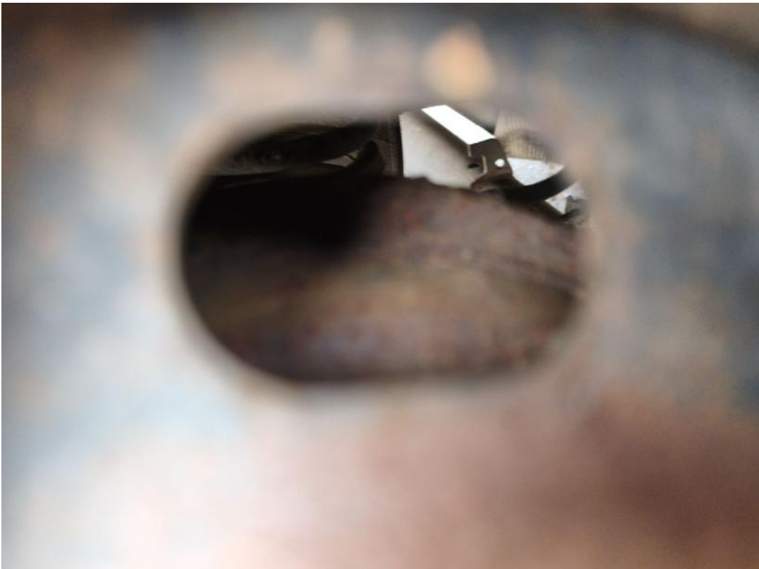
Fot. 31 Tarcza hamulcowa tylna prawa