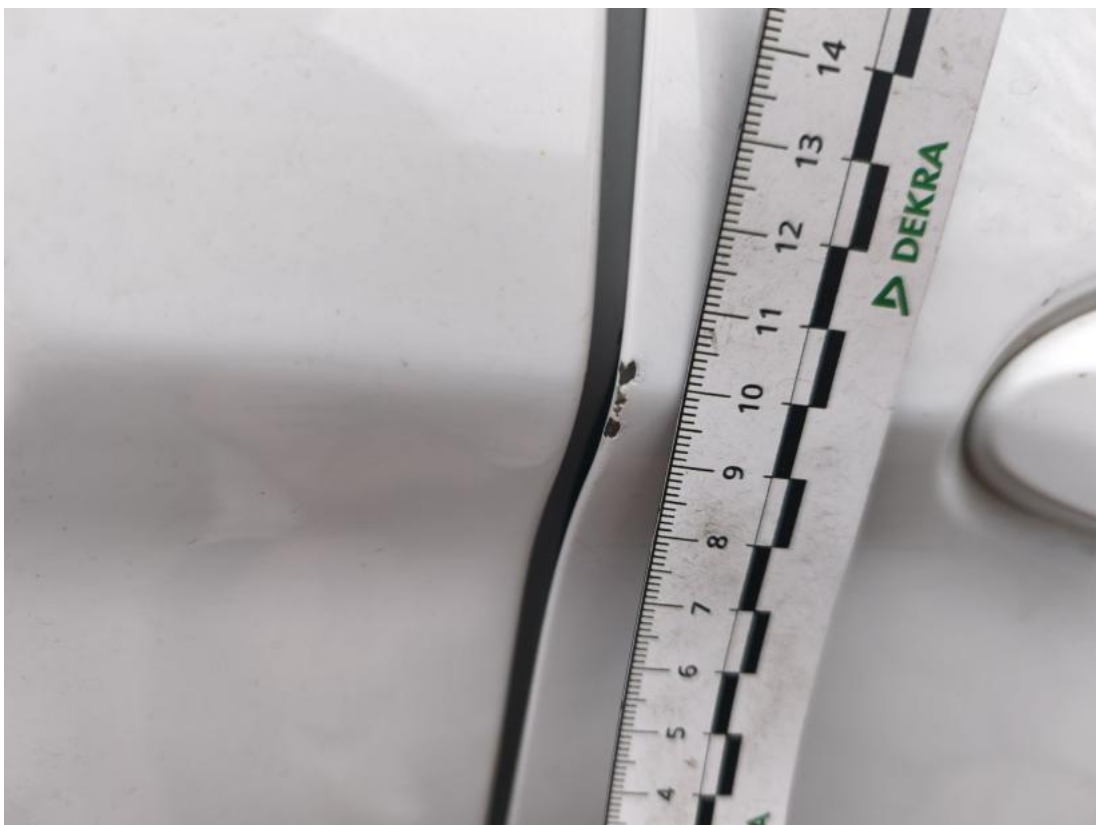
Fot. 48 Drzwi przednie P - Rysa/odprysk 1