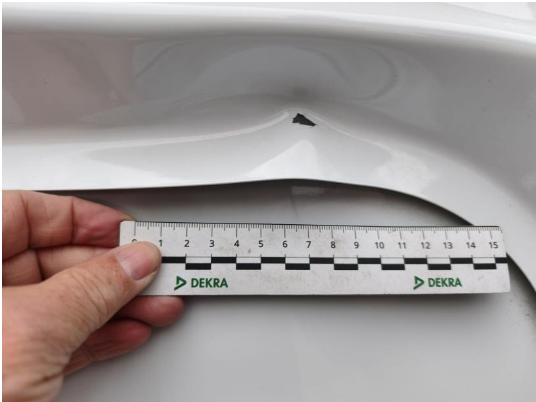
Fot. 75 Drzwi tyłu lewe - Wgniecenie/odkształcenie 1