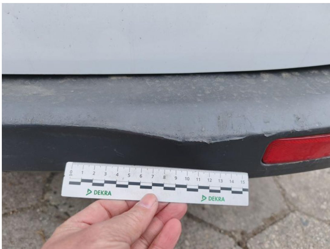
Fot. 53 Zderzak tylny - Rysa/odprysk 1