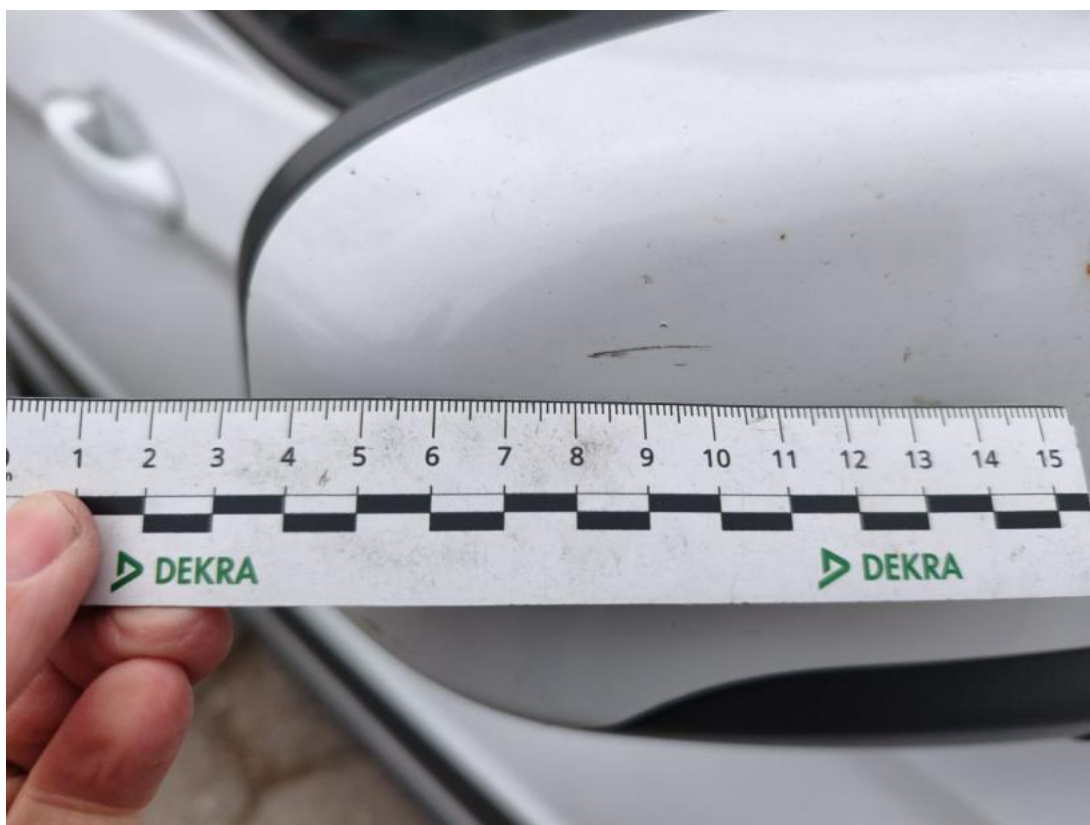
Fot. 50 Obudowa lusterka zew P() - Rysa/odprysk 3