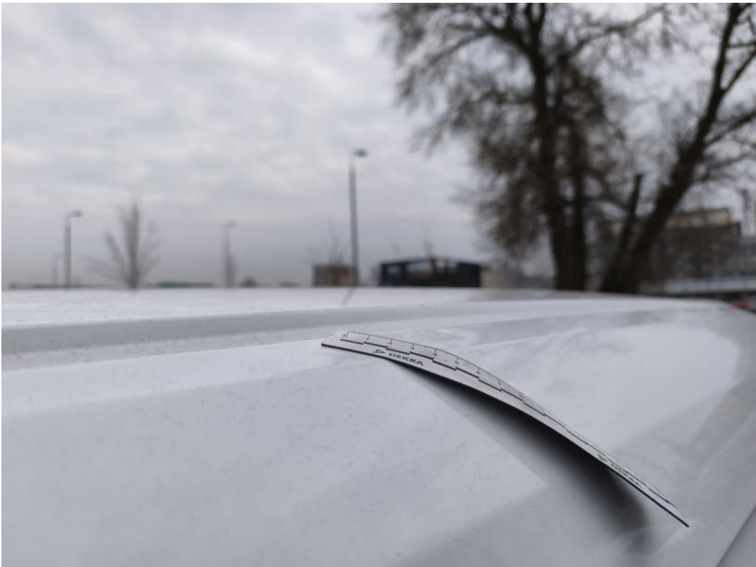
Fot. 57 Rama dachu L - Wgniecenie/odkształcenie 1