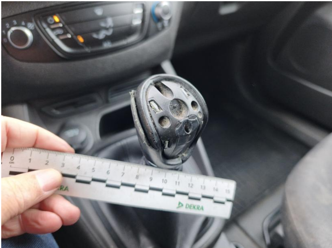
Fot. 71 Gałka dźwigni zmiany biegów - Pęknięcie/rozerwanie 1