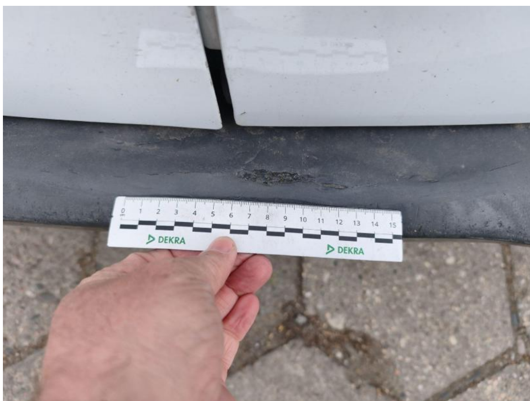
Fot. 54 Zderzak tylny - Rysa/odprysk 2