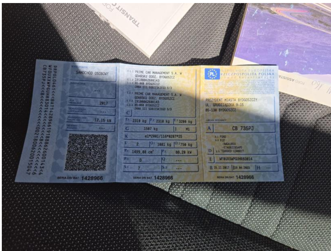
Fot. 34 Dow. rej. tym. Str. 1