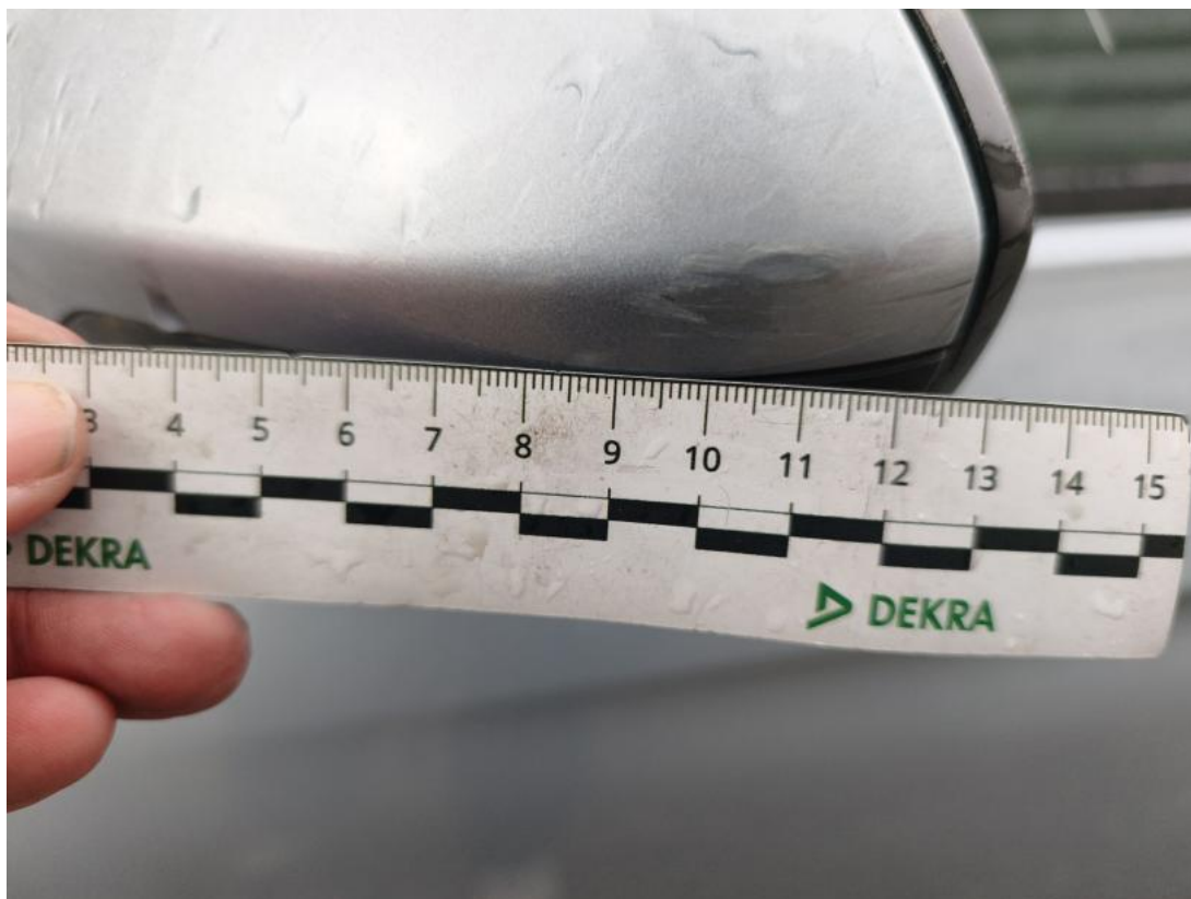
Fot. 51 Obudowa lusterka zew L - Rysa/odprysk 1