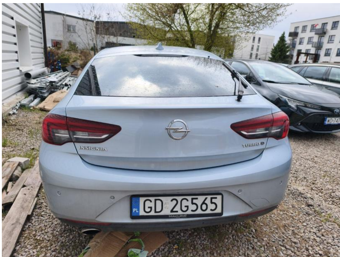
Fot. 8 Tyt