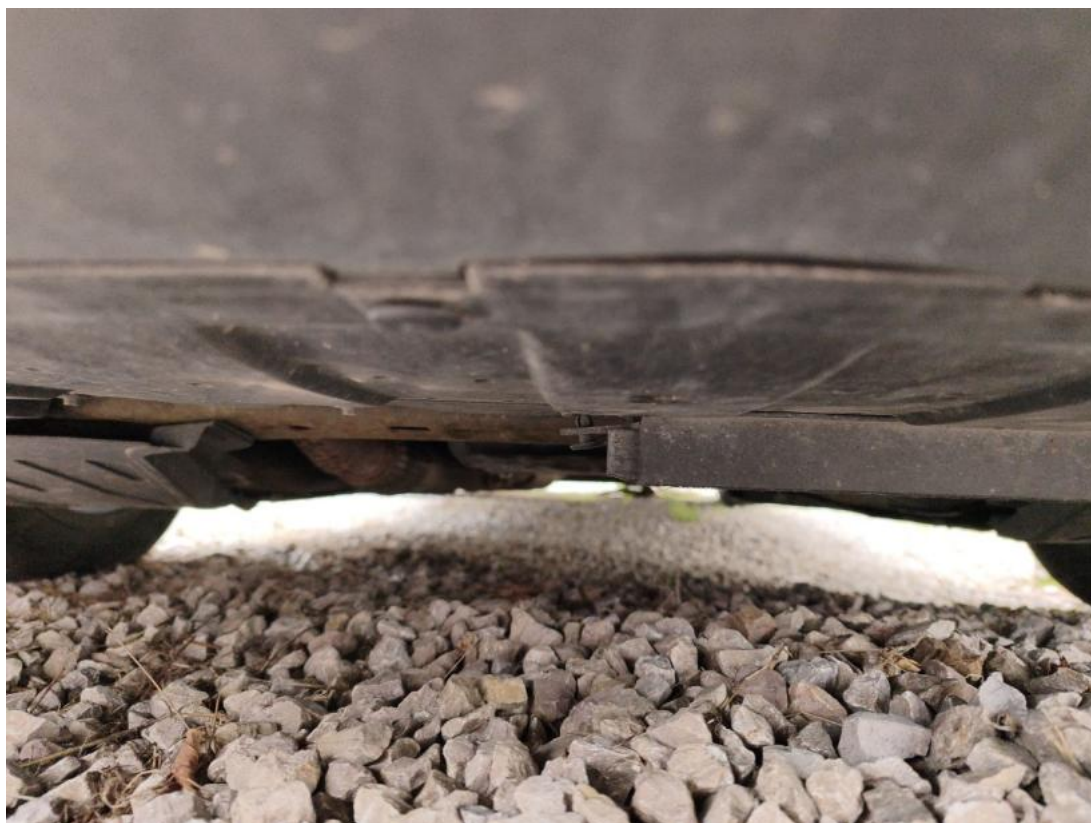
Fot. 27 Spód pojazdu przód