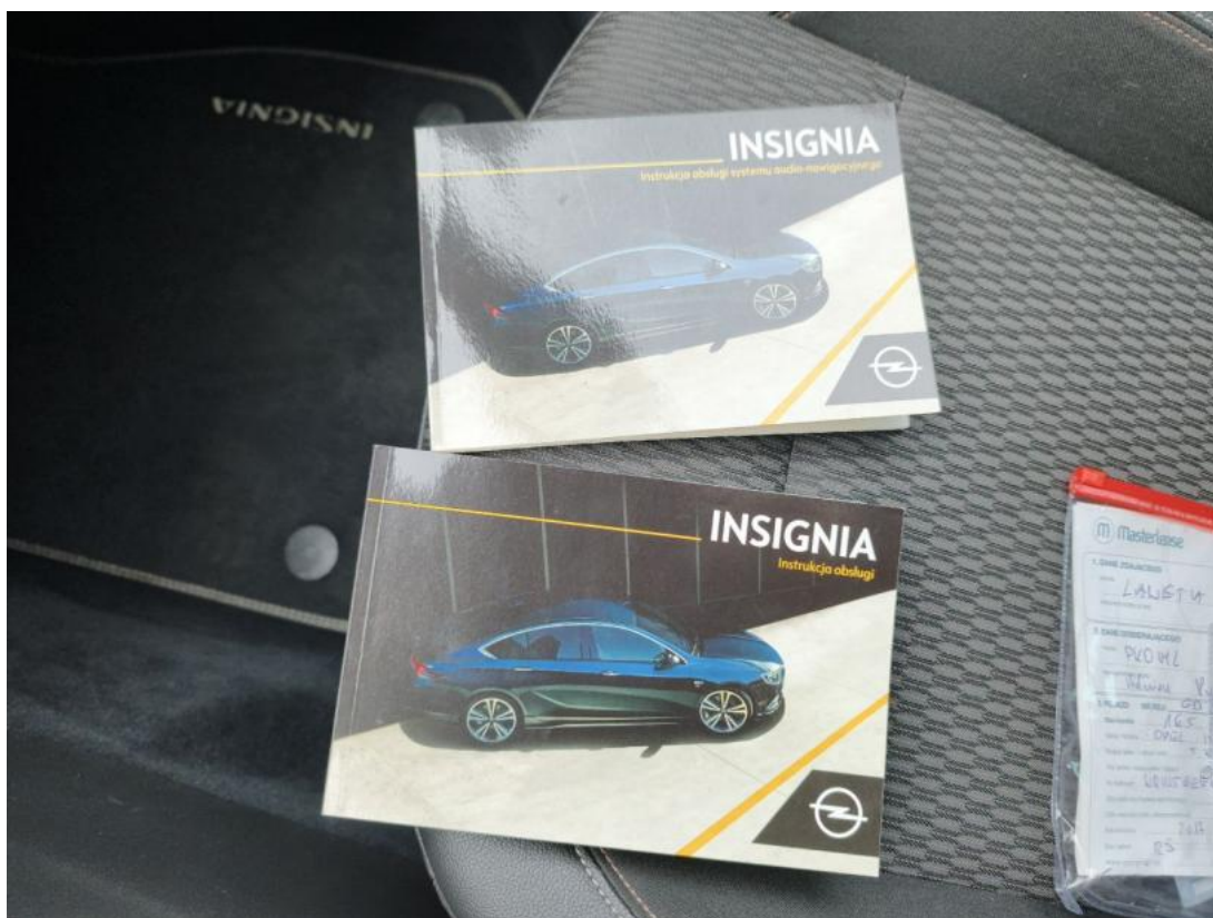
Fot. 37 Instrukcje