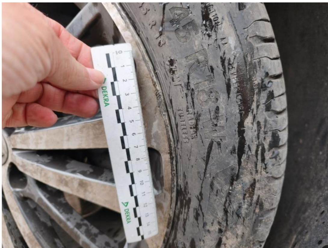
Fot. 45 Felga aluminiowa przednia P() - Rysa/odprysk 3