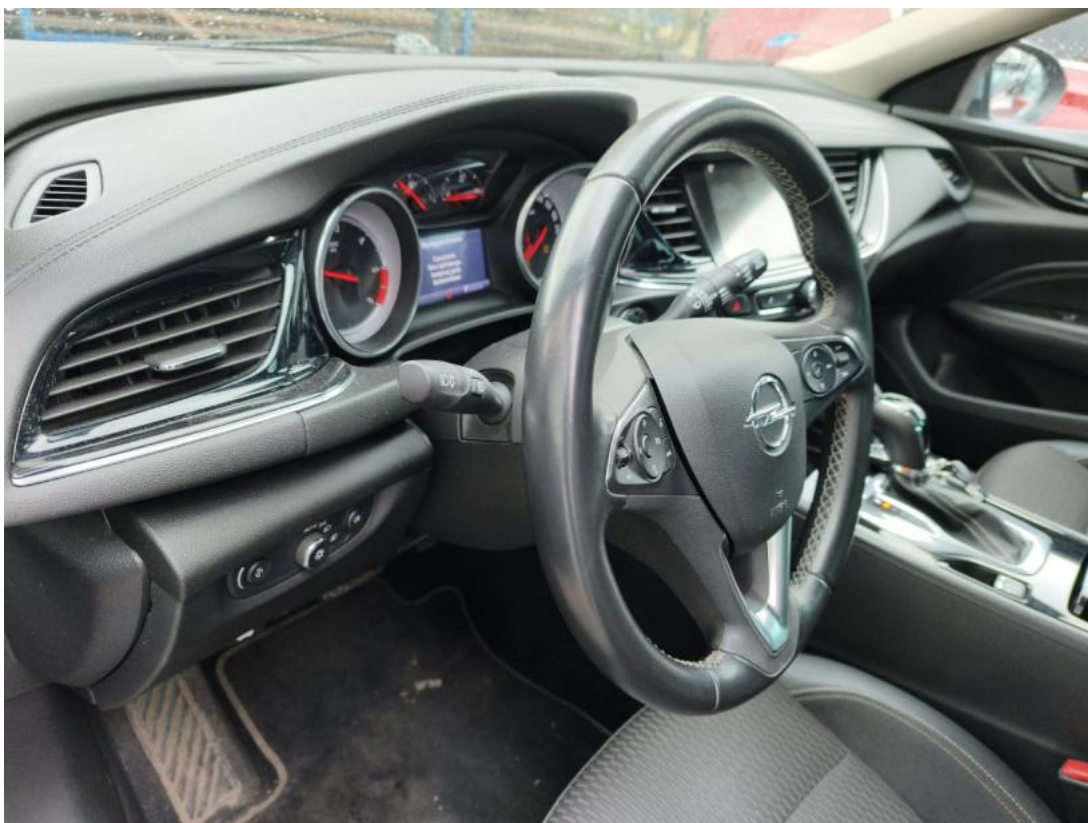
Fot. 23 Kierownica z lewej strony