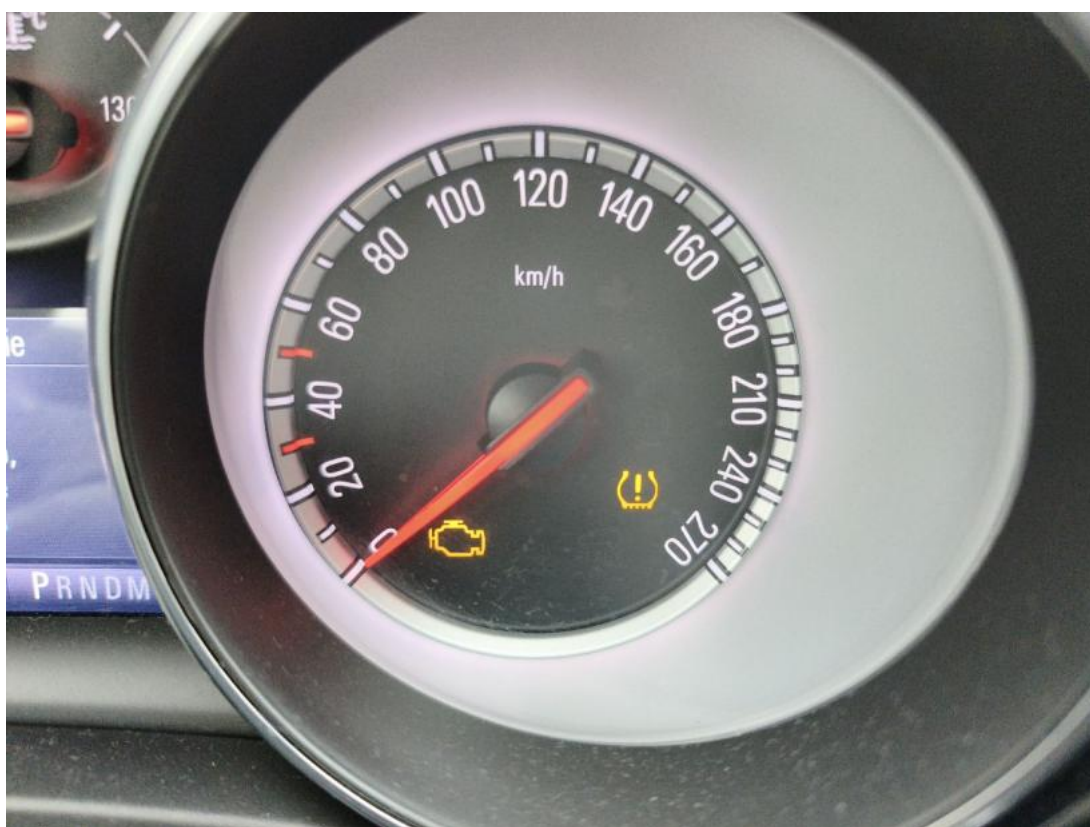
Fot. 38 kontrolka