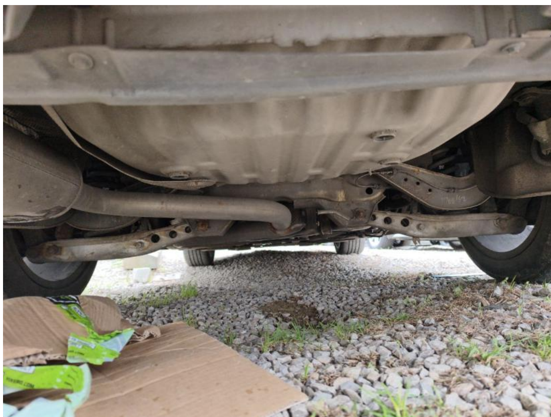
Fot. 28 Spód pojazdu tył