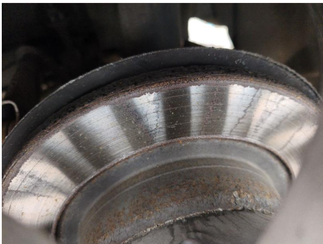
Fot. 32 Tarcza hamulcowa tylna lewa