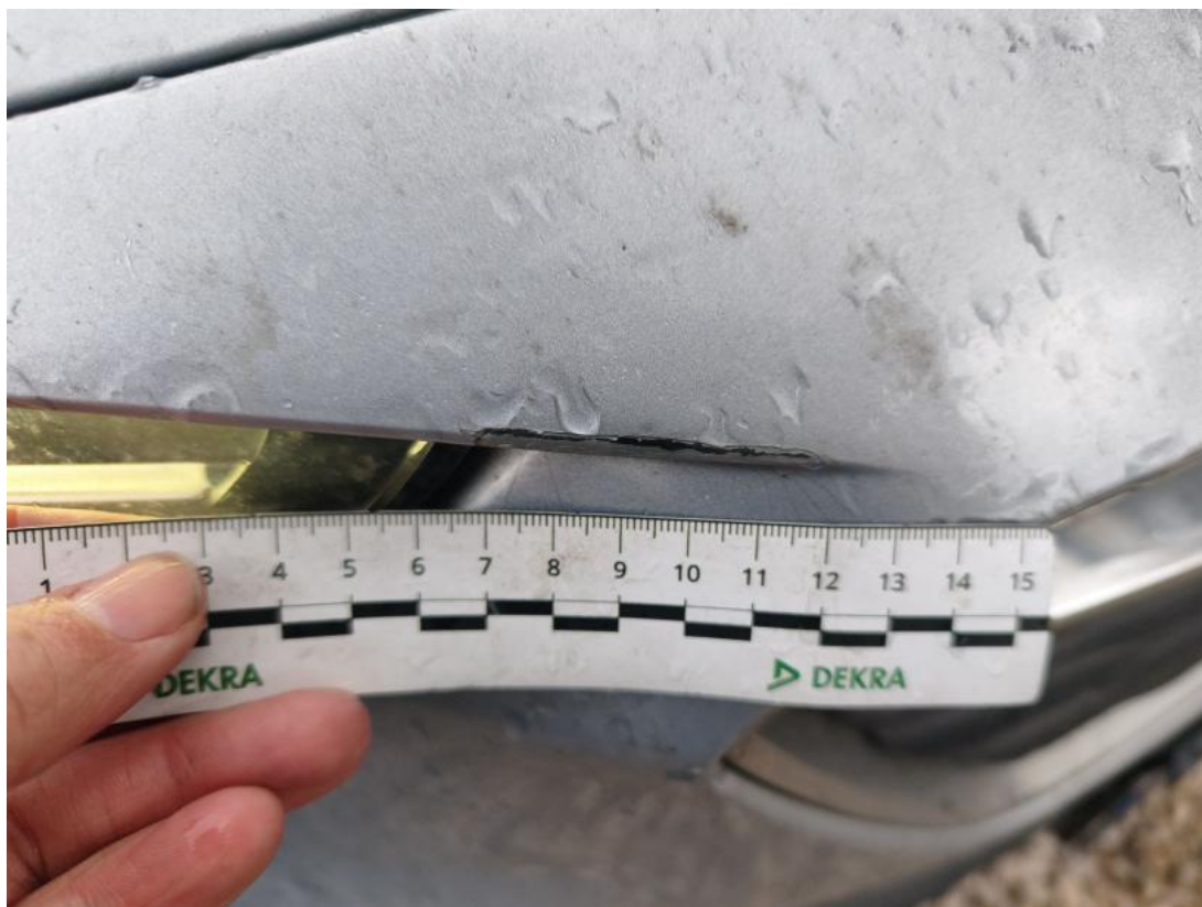
Fot. 43 Zderzak - Rysa/odprysk 1