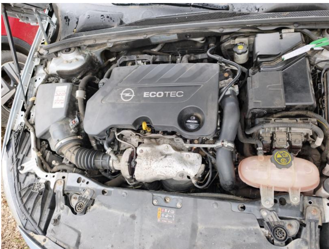
Fot. 24 Komora silnika