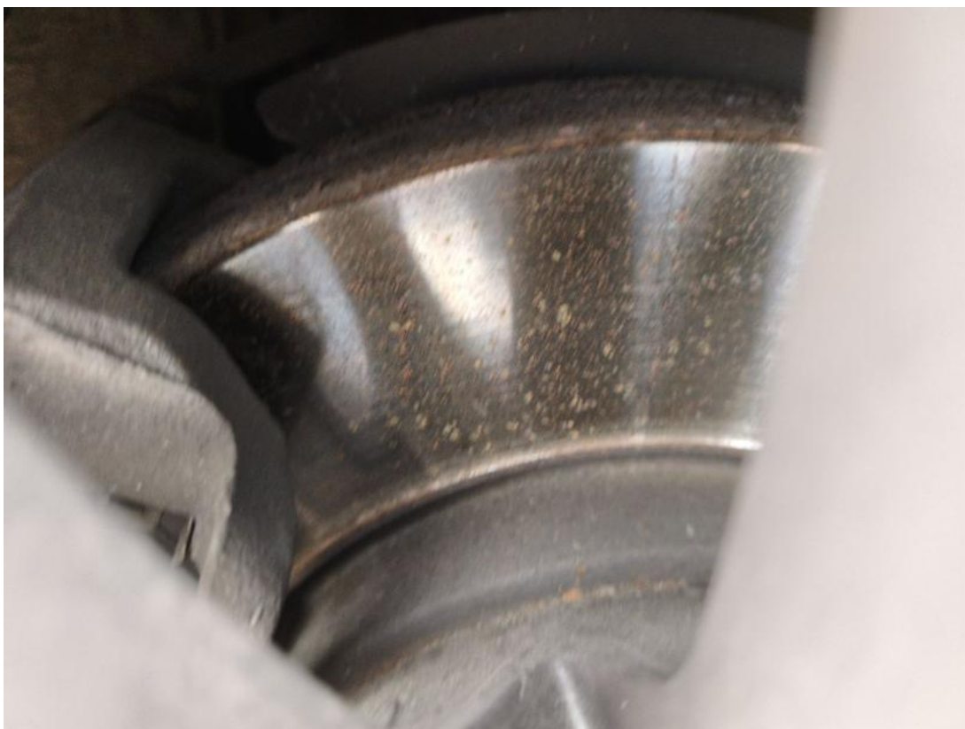
Fot. 29 Tarcza hamulcowa przednia lewa