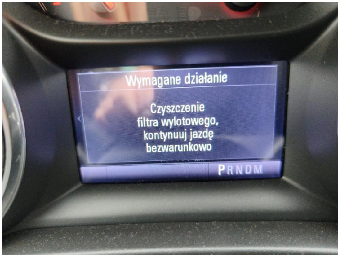
Fot. 39 komunikat