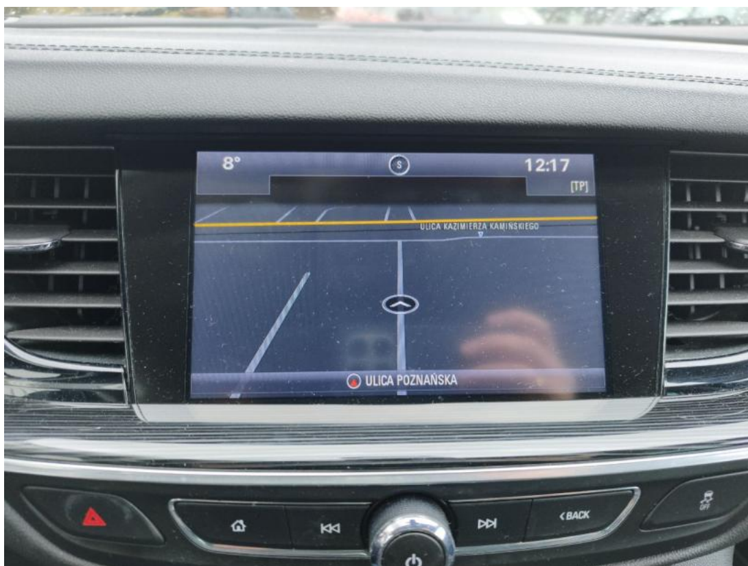
Fot. 40 nawigacja