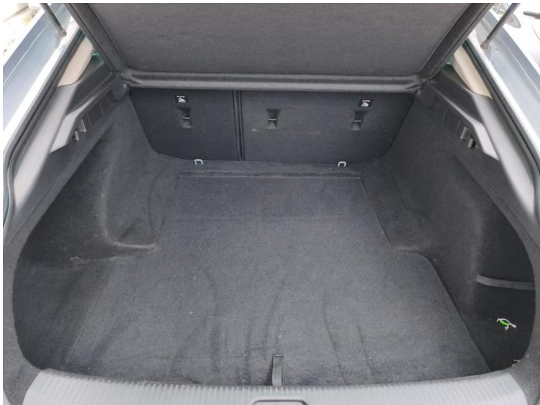
Fot. 25 Bagażnik