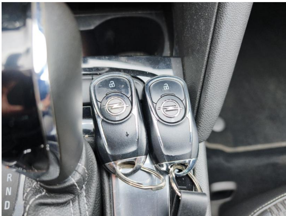
Fot. 41 klucze