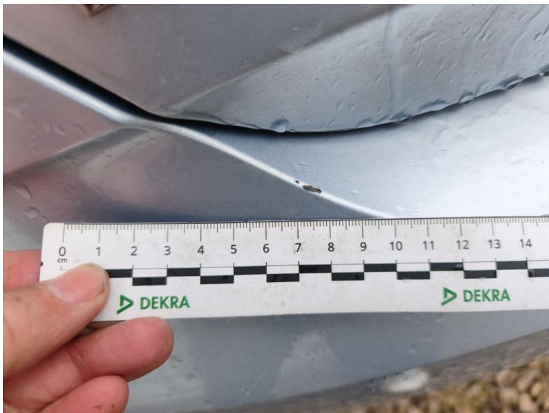
Fot. 47 Zderzak tylny - Rysa/odprysk 2