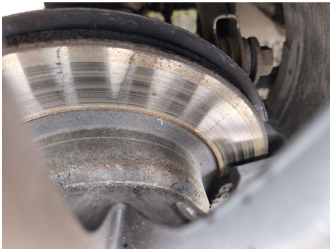
Fot. 31 Tarcza hamulcowa tylna prawa