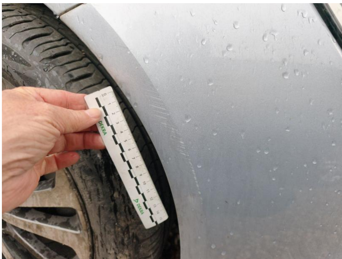
Fot. 42 Zderzak - zdjęcie poglądowe 1