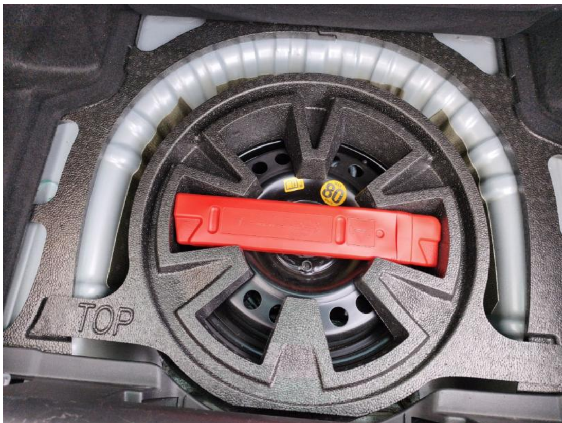
Fot. 26 Koło zapasowe