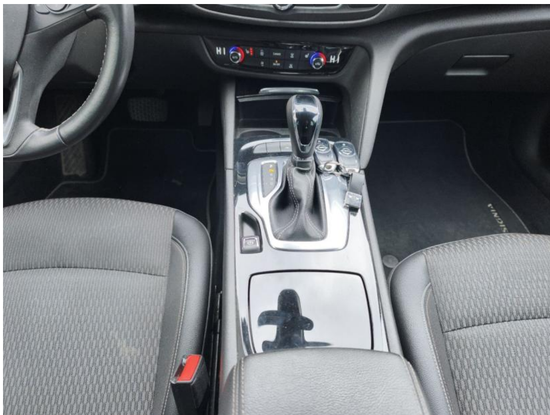
Fot. 21 Tunel środkowy