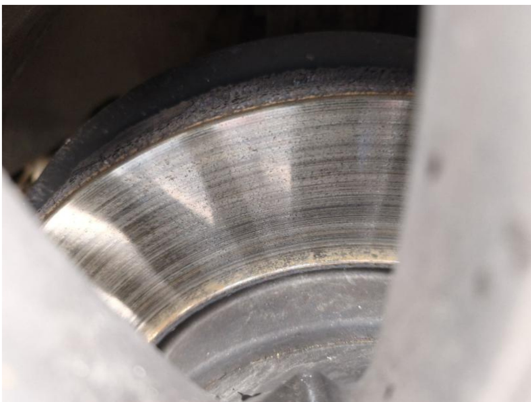
Fot. 30 Tarcza hamulcowa przednia prawa