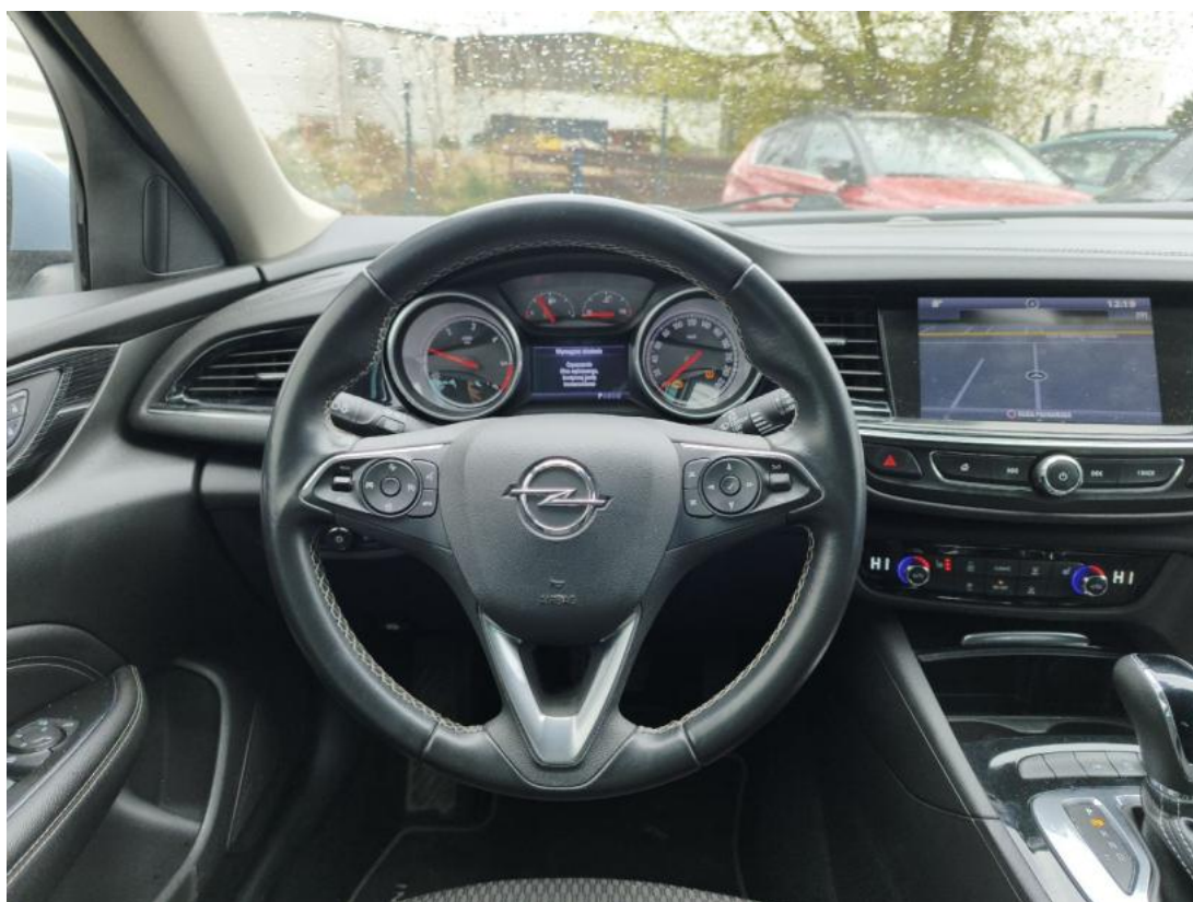
Fot. 22 Kierownica (na wprost)