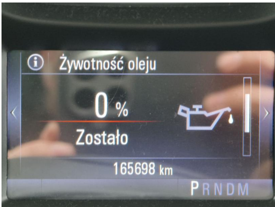
Fot. 16 Zestaw wskaźników - serwis