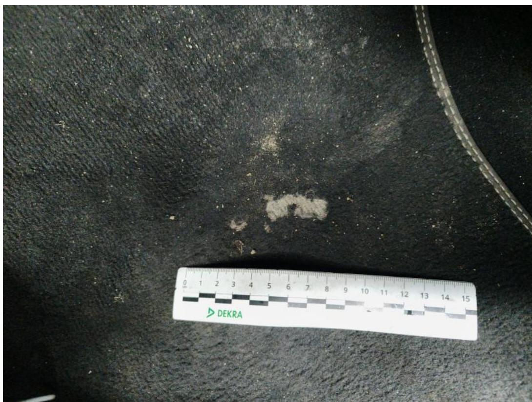
Fot. 52 Dywanik prze L - Pęknięcie/rozerwanie 1