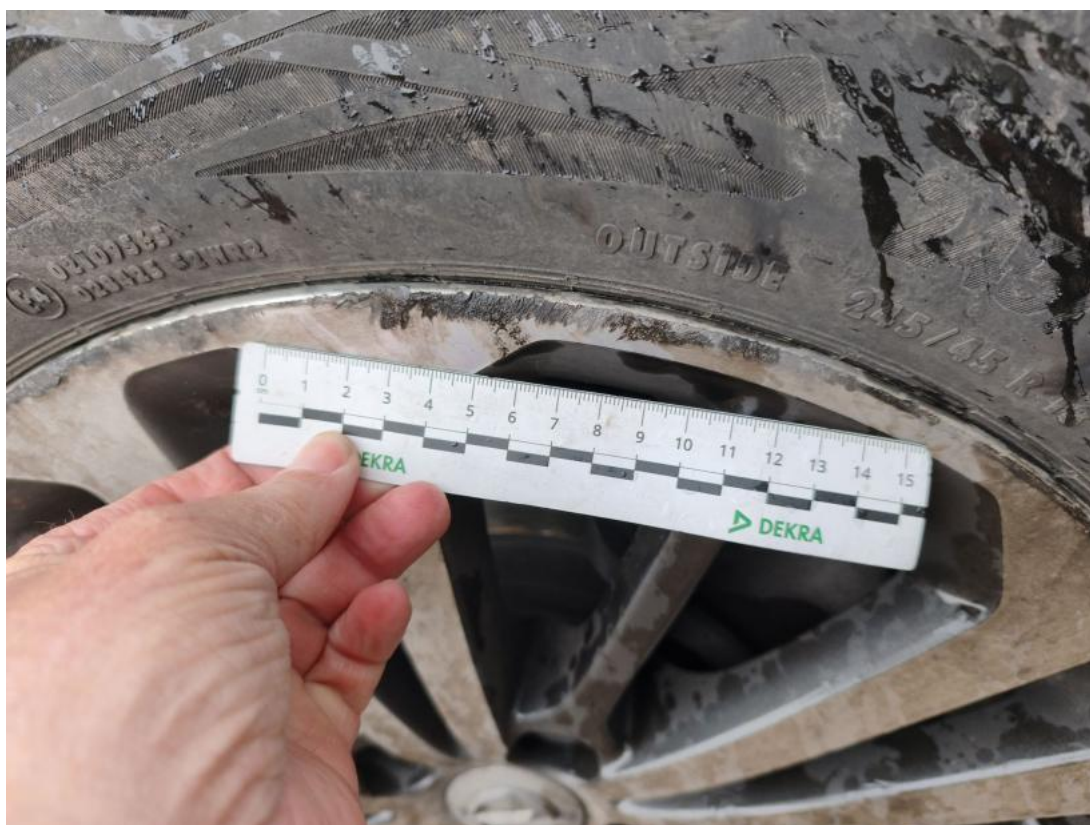
Fot. 44 Felga aluminiowa przednia P - Rysa/odprysk 1