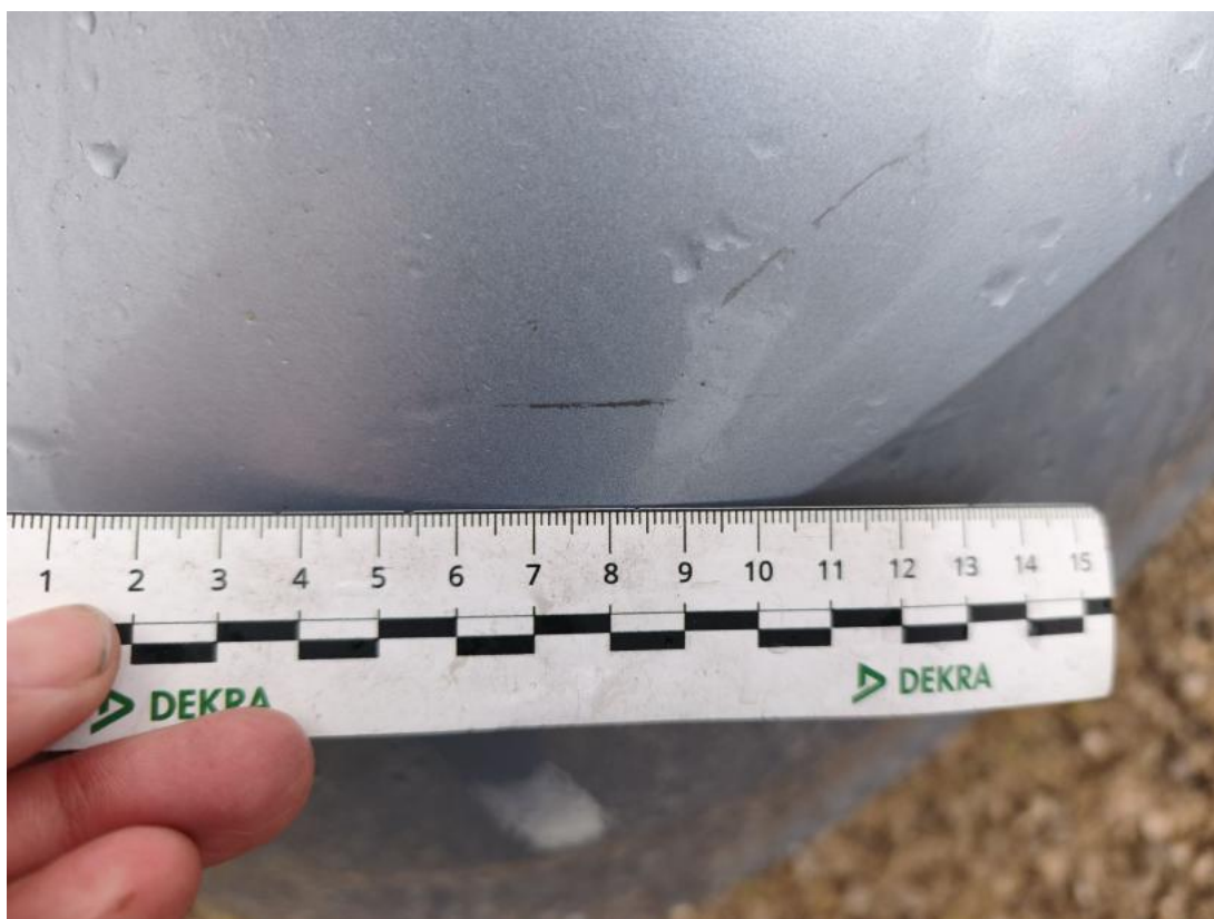
Fot. 46 Zderzak tylny - Rysa/odprysk 1