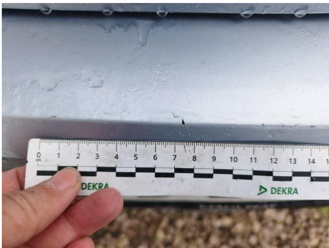
Fot. 48 Zderzak tylny() - Rysa/odprysk 3