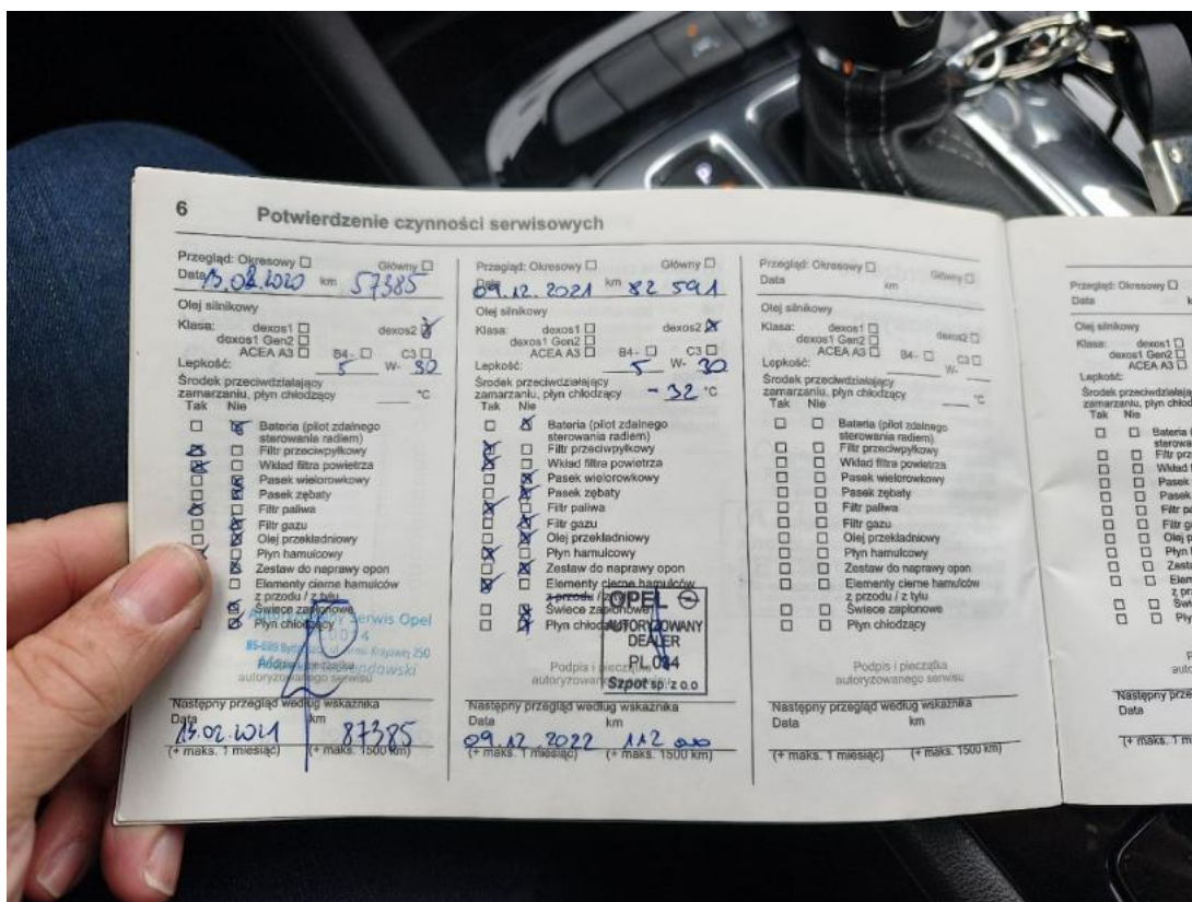
Fot. 36 Książka serwisowa – ostatni przegląd