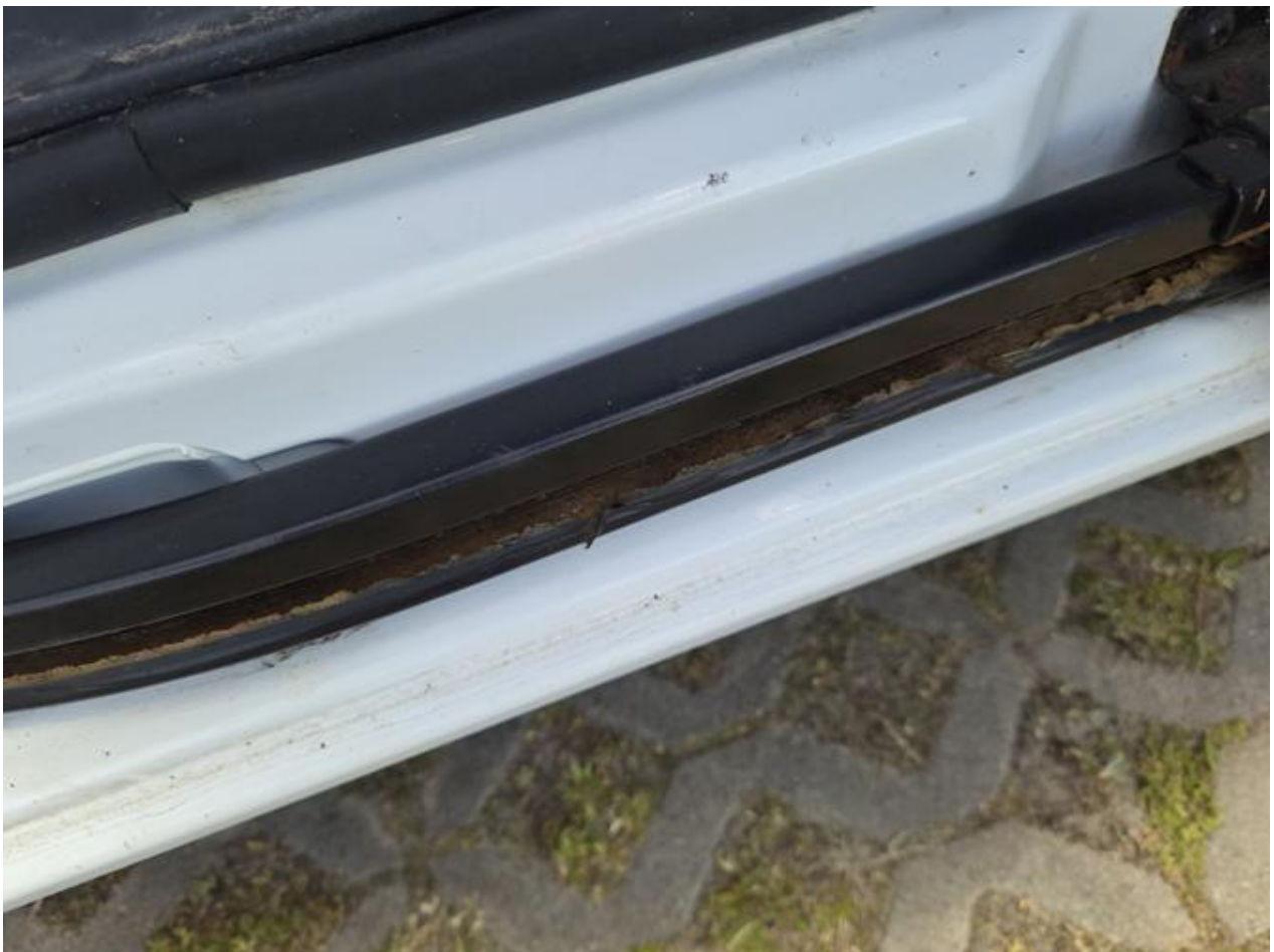
Fot. nr 86