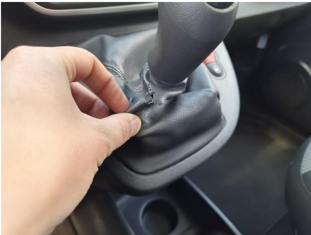
Fot. nr 94

Dokument wystawiony elektronicznie, waminy bez podpisu