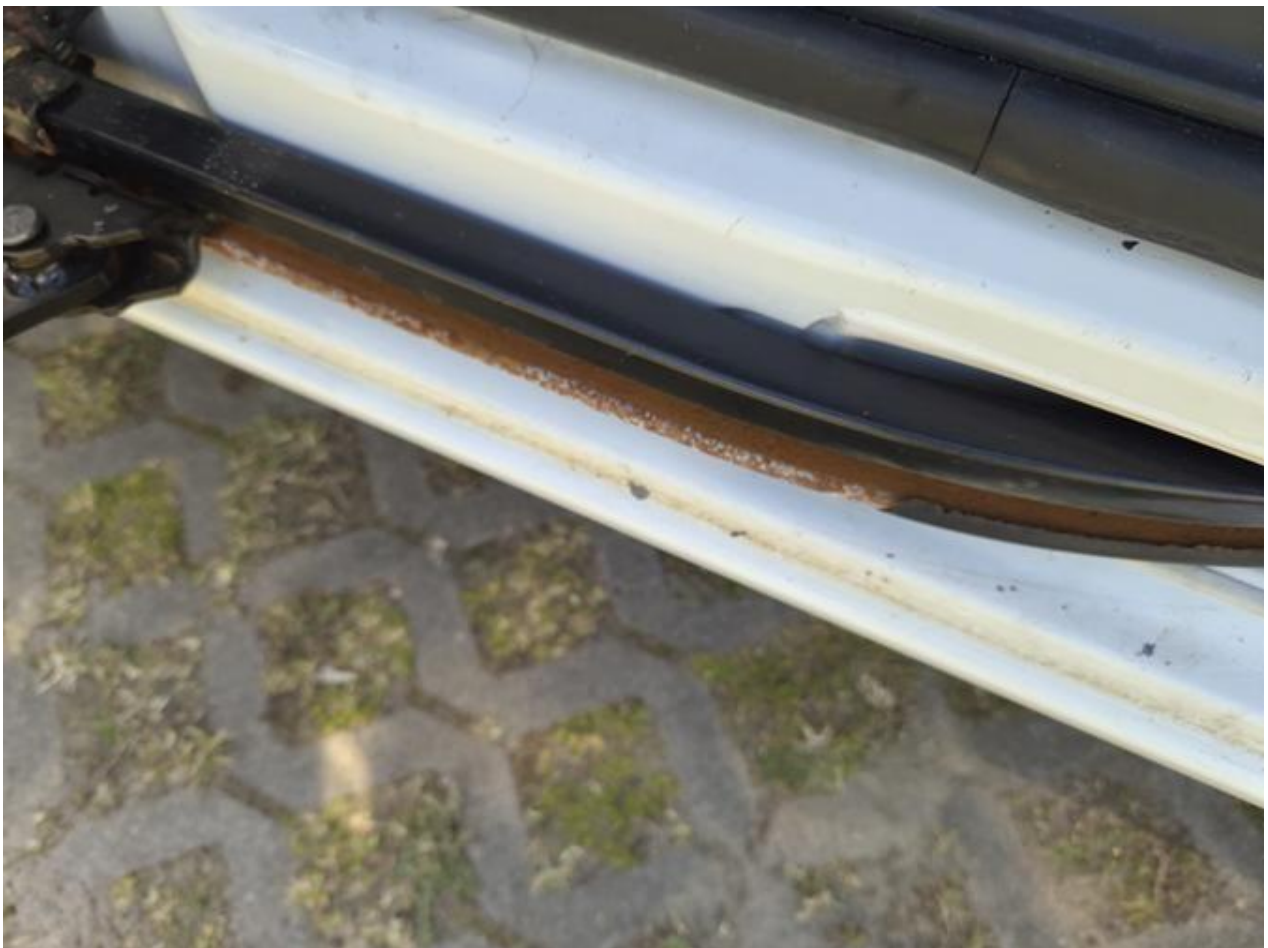
Fot. nr 92