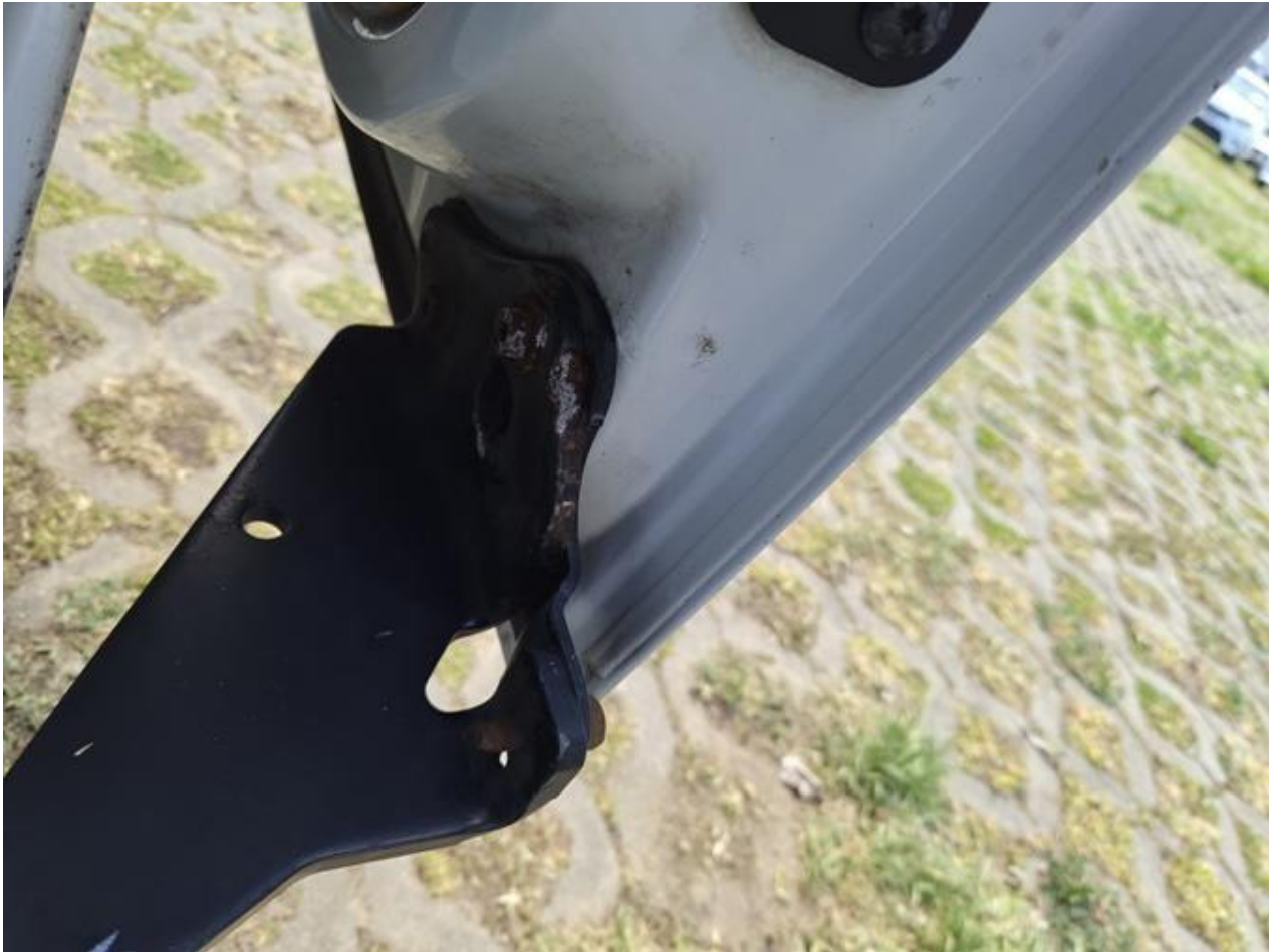
Fot. nr 87