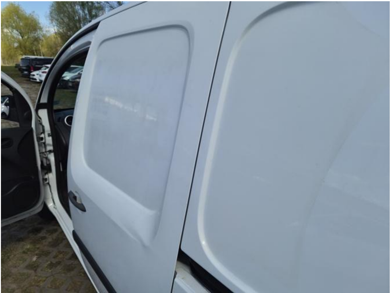
Fot. nr 89