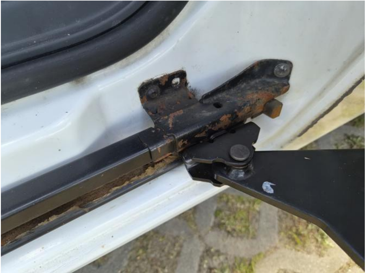
Fot. nr 85