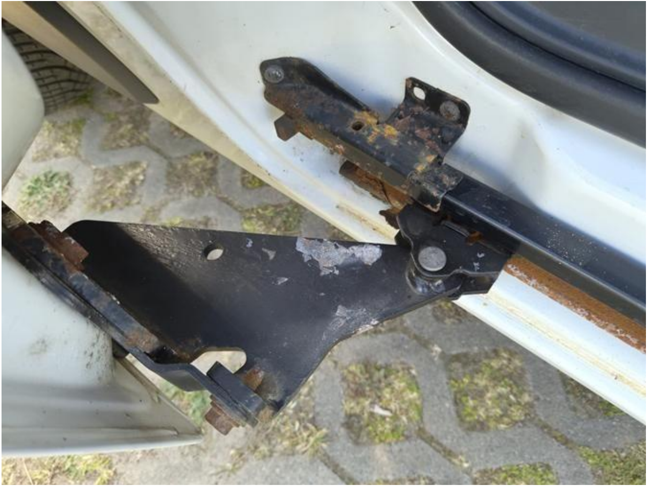
Fot. nr 91