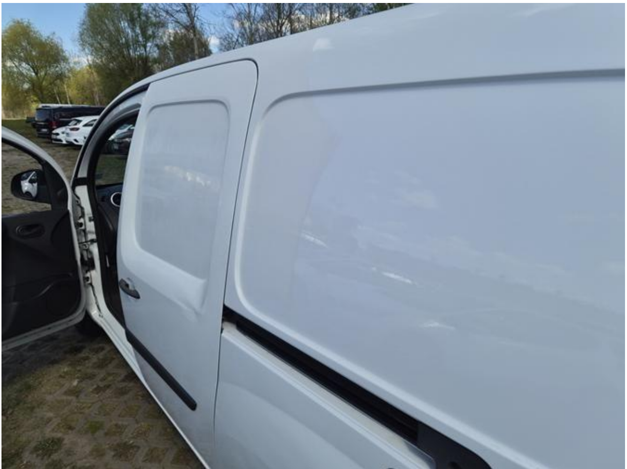
Fot. nr 88