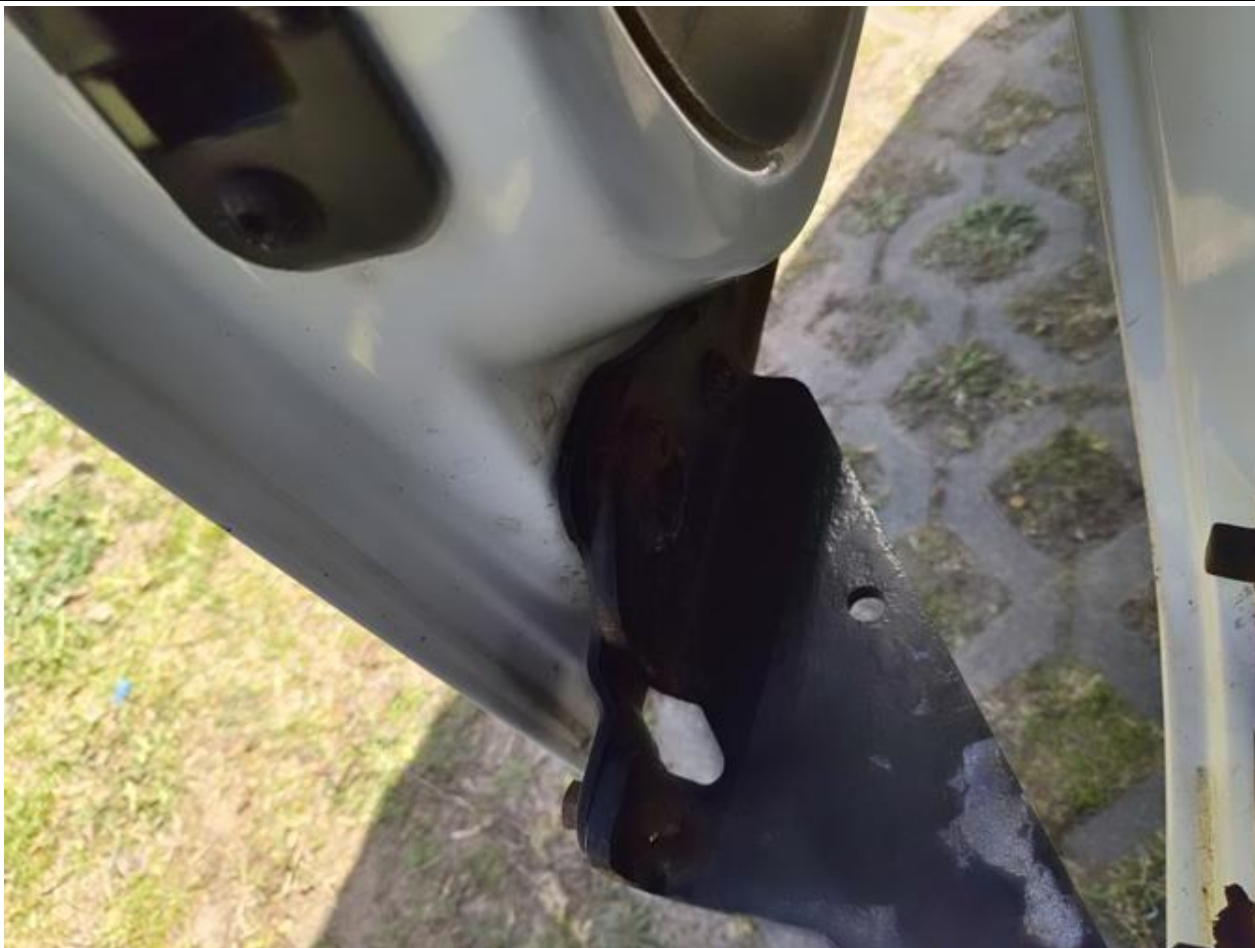
Fot. nr 93