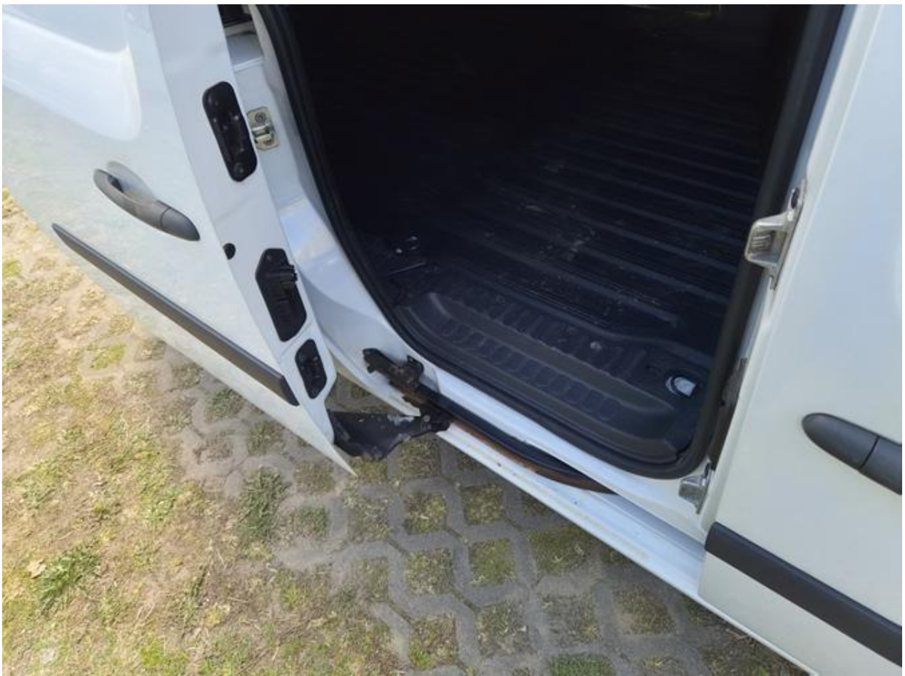
Fot. nr 90