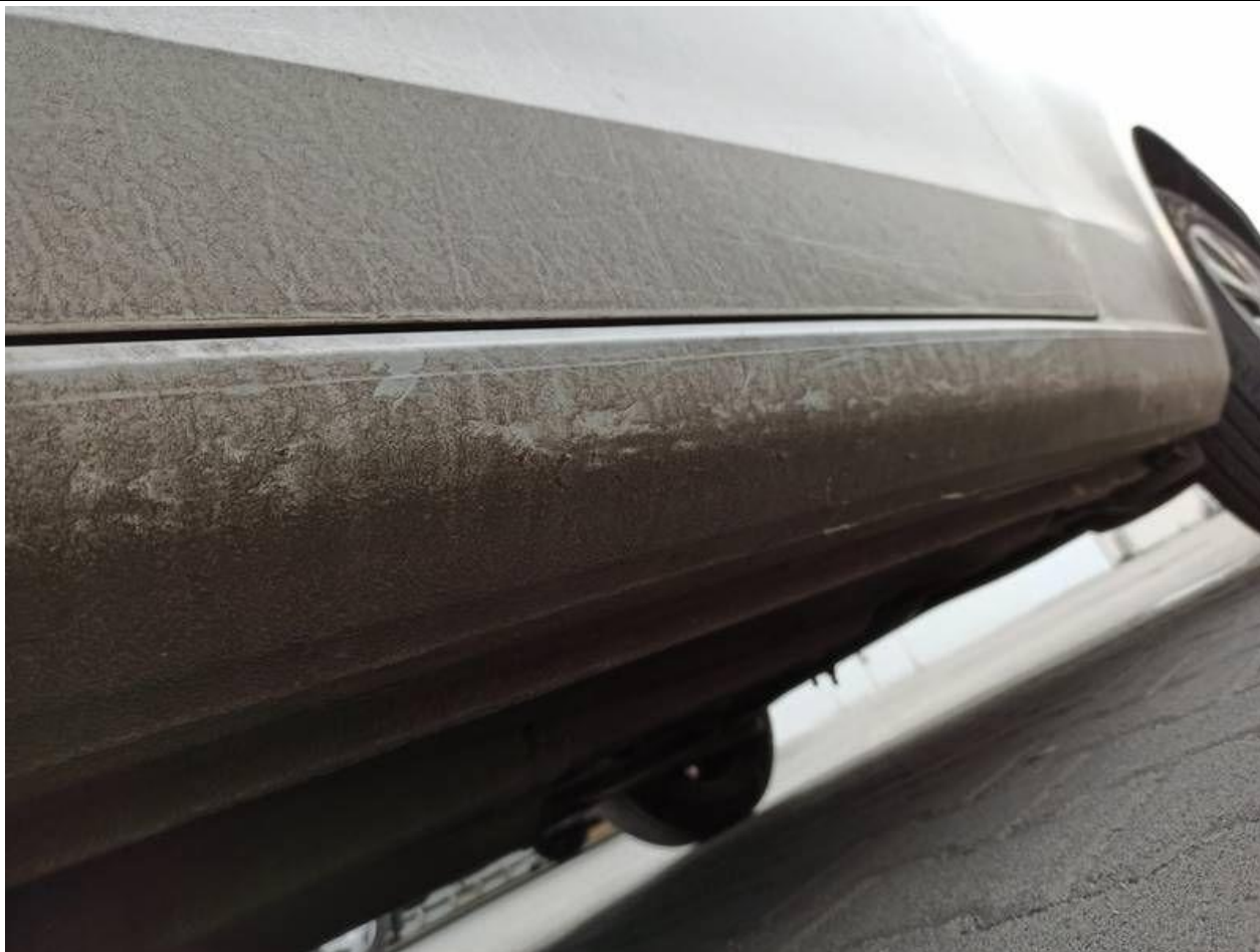
Fot. nr 89