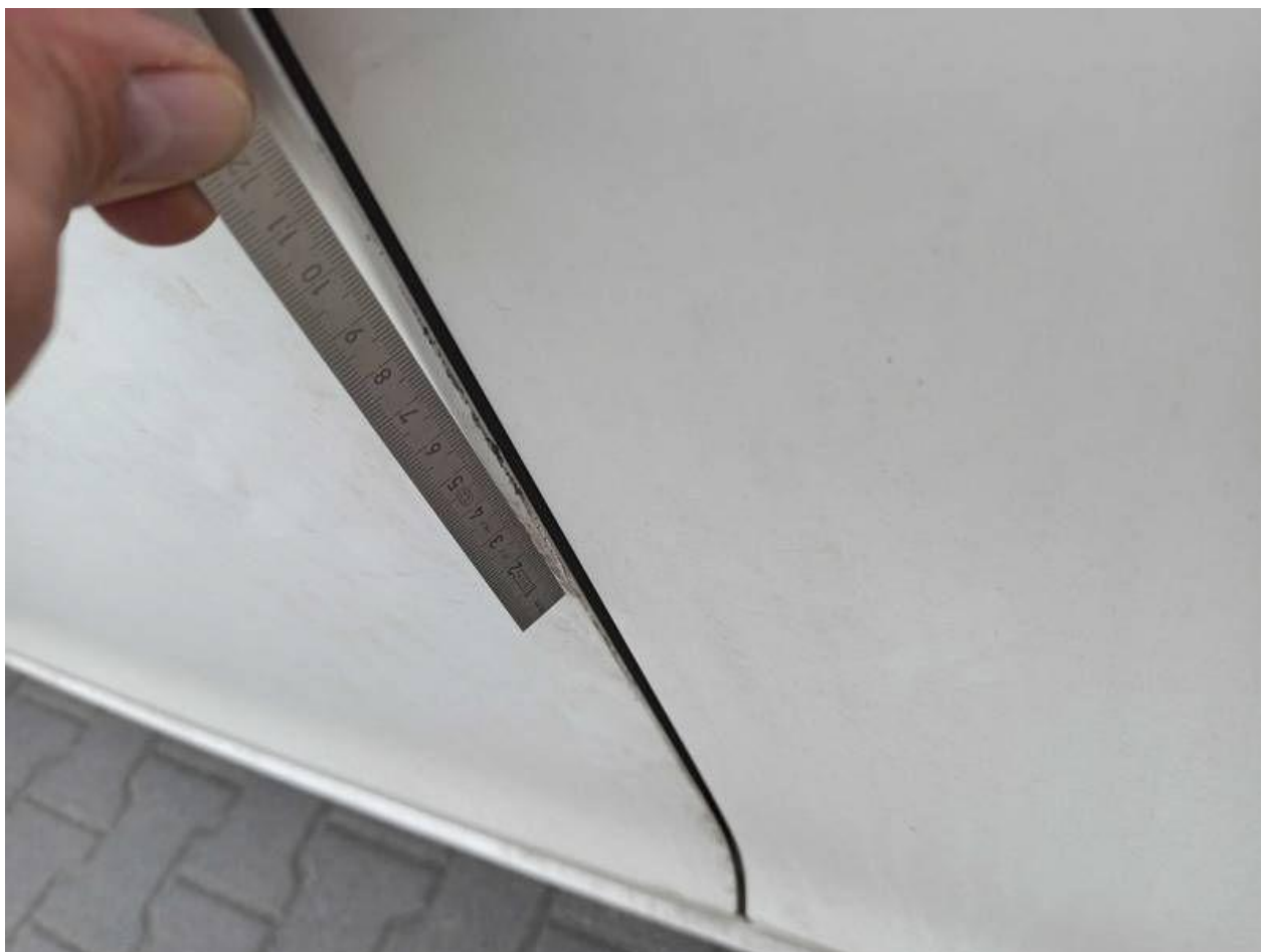
Fot. nr 82