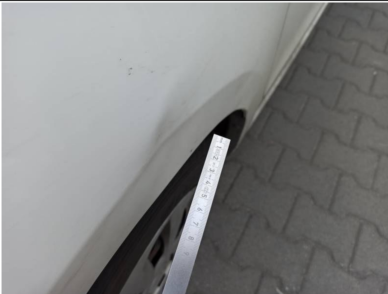
Fot. nr 91

Dokument wystawiony elektronicznie, wamy bez podpisu