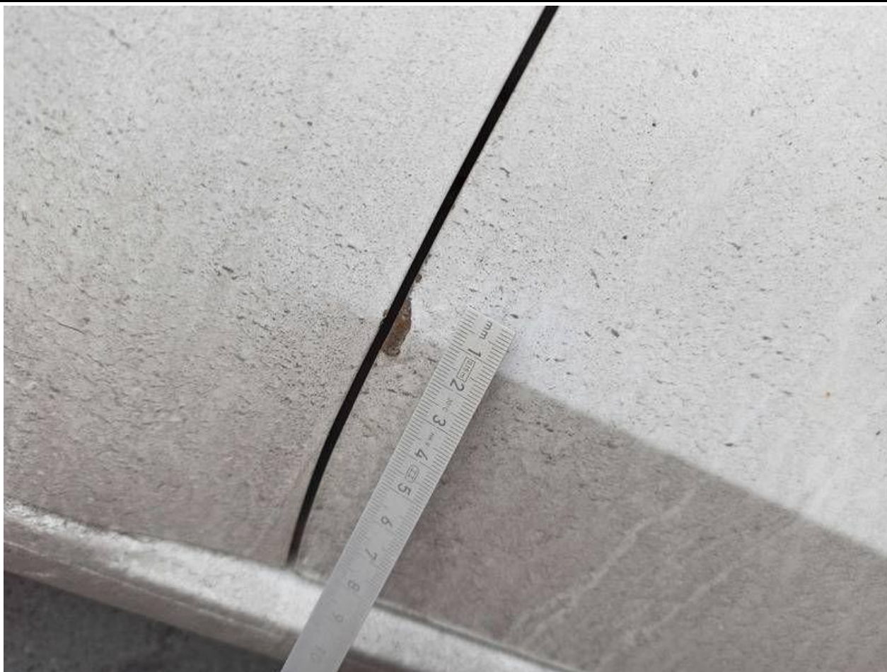
Fot. nr 85