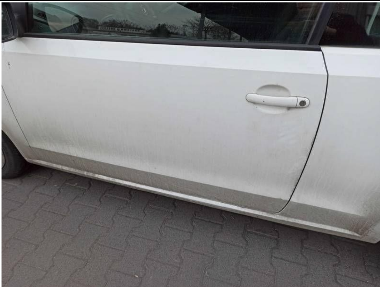
Fot. nr 81