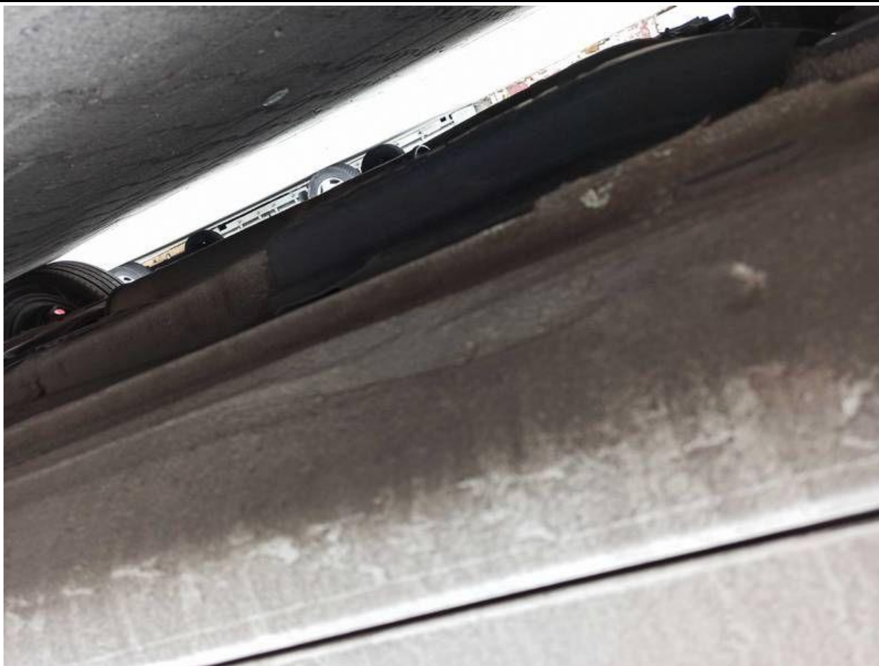
Fot. nr 87