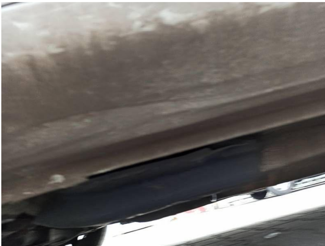
Fot. nr 88