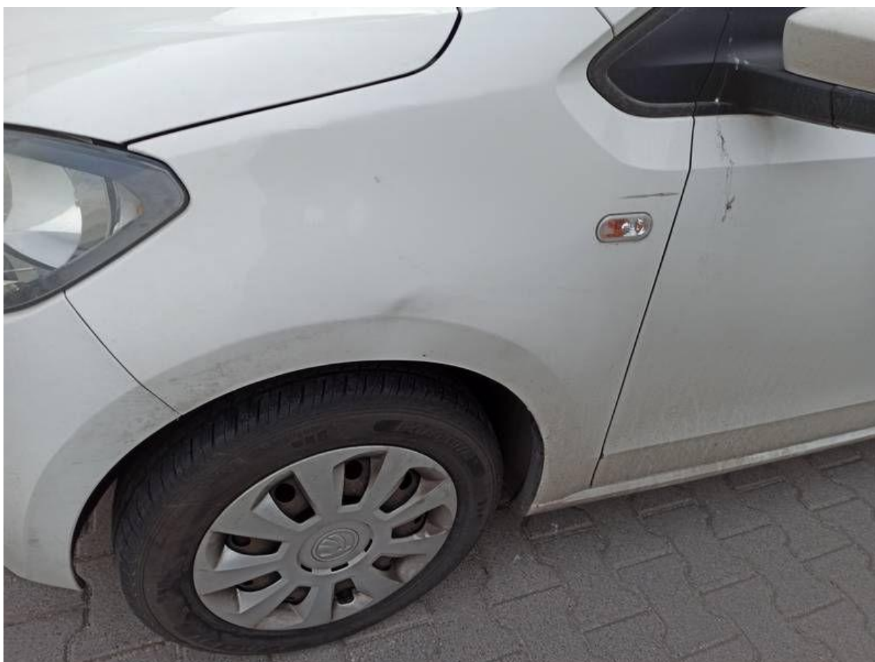
Fot. nr 90