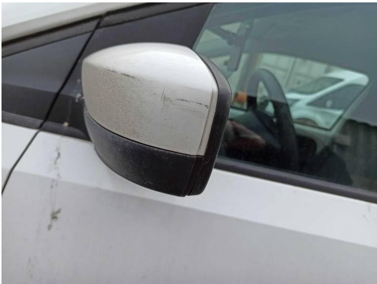
Fot. nr 84