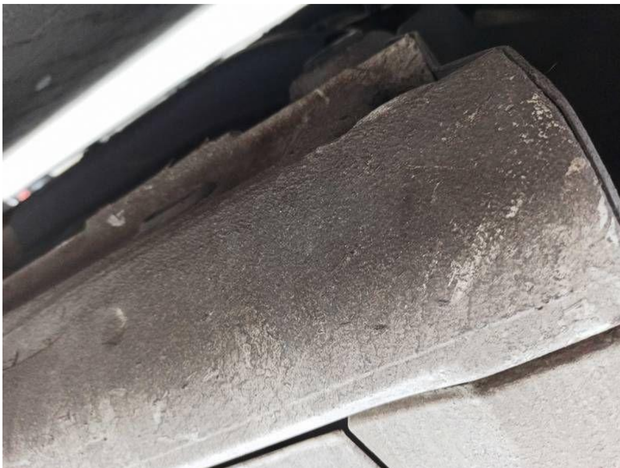
Fot. nr 86