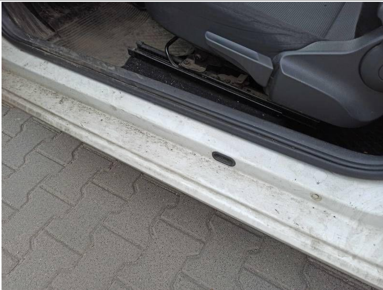
Fot. nr 83