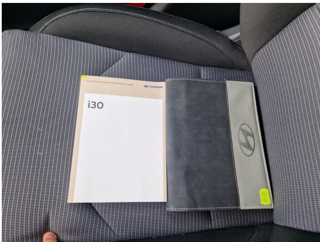
Fot. 34 Instrukcje