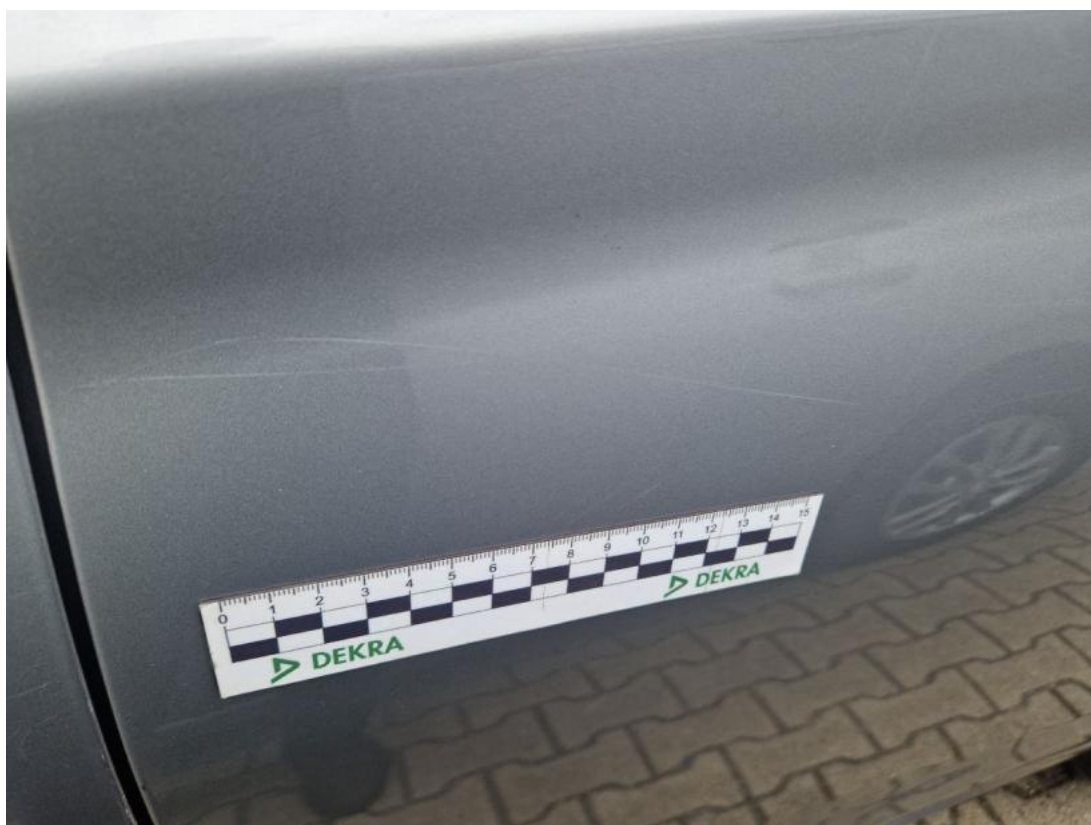
Fot. 59 Drzwi tylne L() - Rysa/odprysk 3