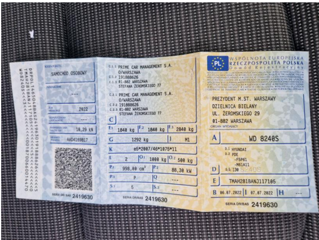
Fot. 32 Dowód rej. Str. 1