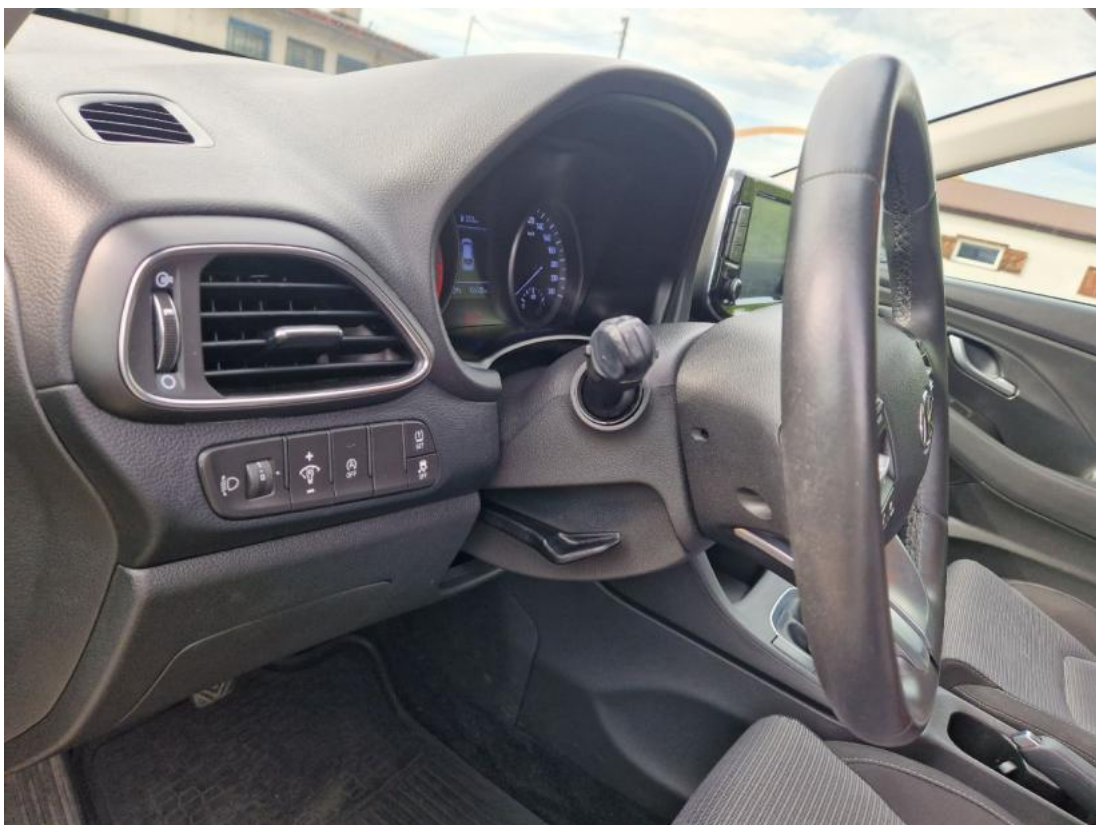
Fot. 22 Kierownica z lewej strony