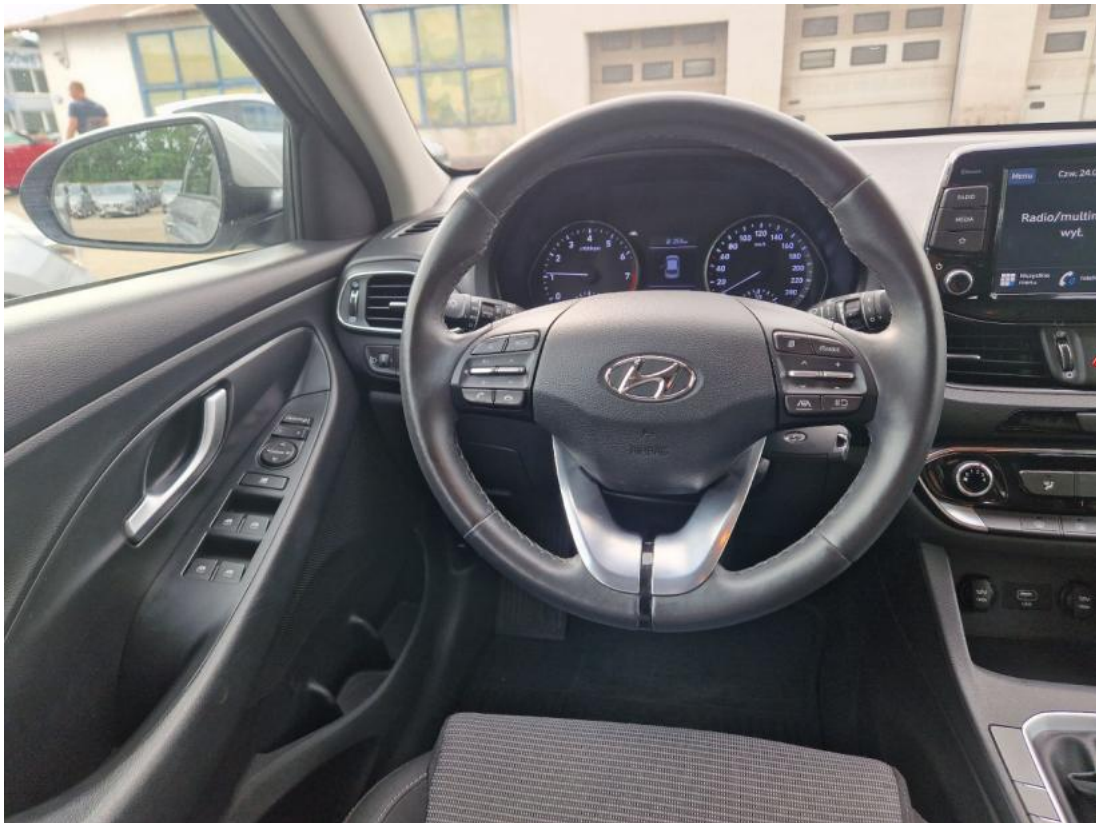
Fot. 21 Kierownica (na wprost)