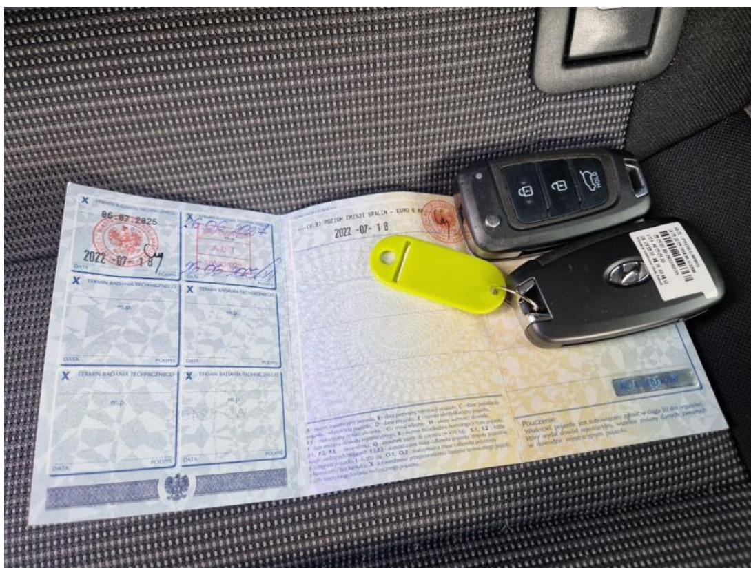
Fot. 33 Dow. Rej. Str.2 i klucze