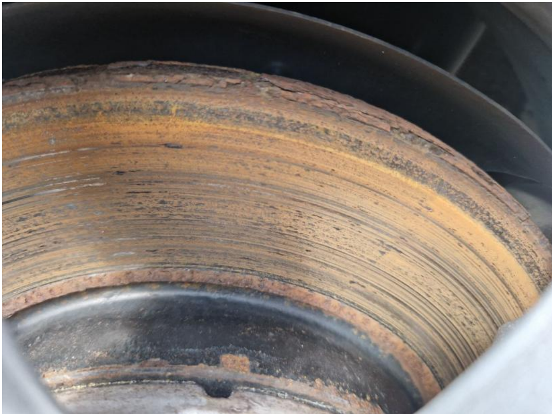
Fot. 31 Tarcza hamulcowa tylna lewa