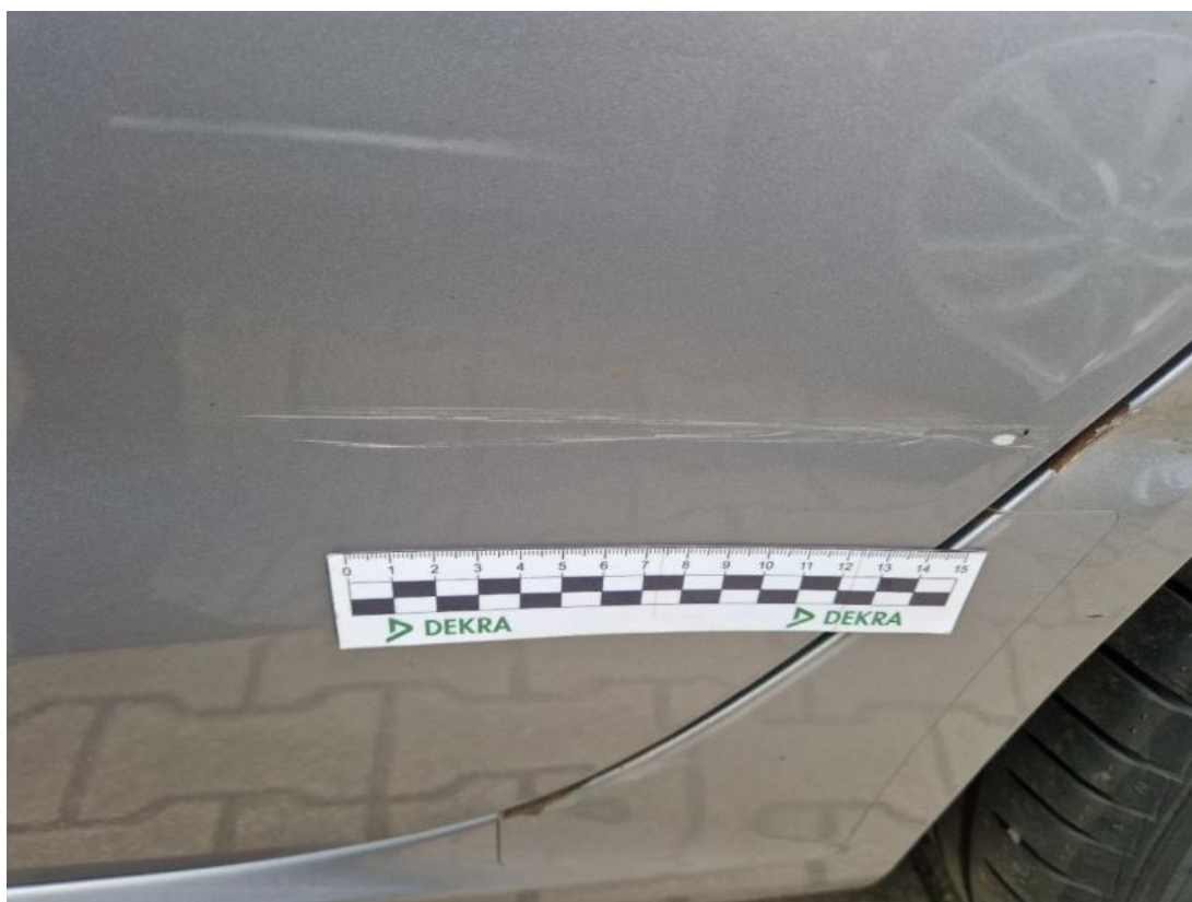
Fot. 60 Drzwi tylne L - Wgniecenie/odkształcenie 1