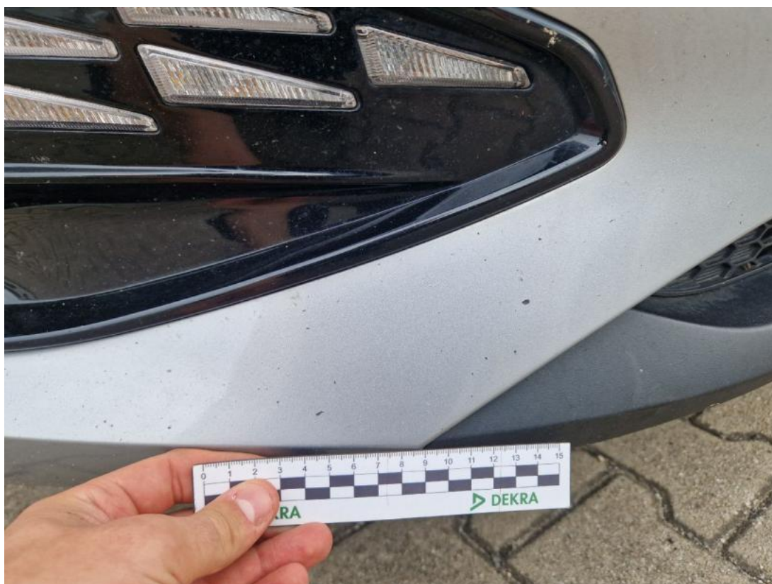
Fot. 38 Zderzak - Rysa/odprysk 2