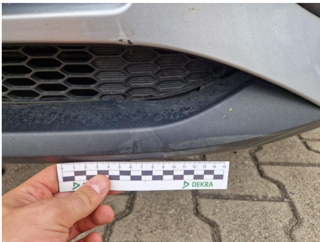
Fot. 37 Zderzak - Rysa/odprysk 1