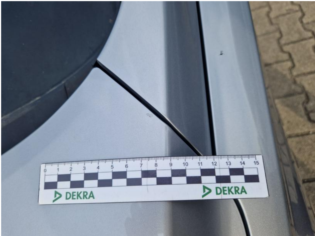
Fot. 39 Pokrywa komory silnika - Rysa/odprysk 1