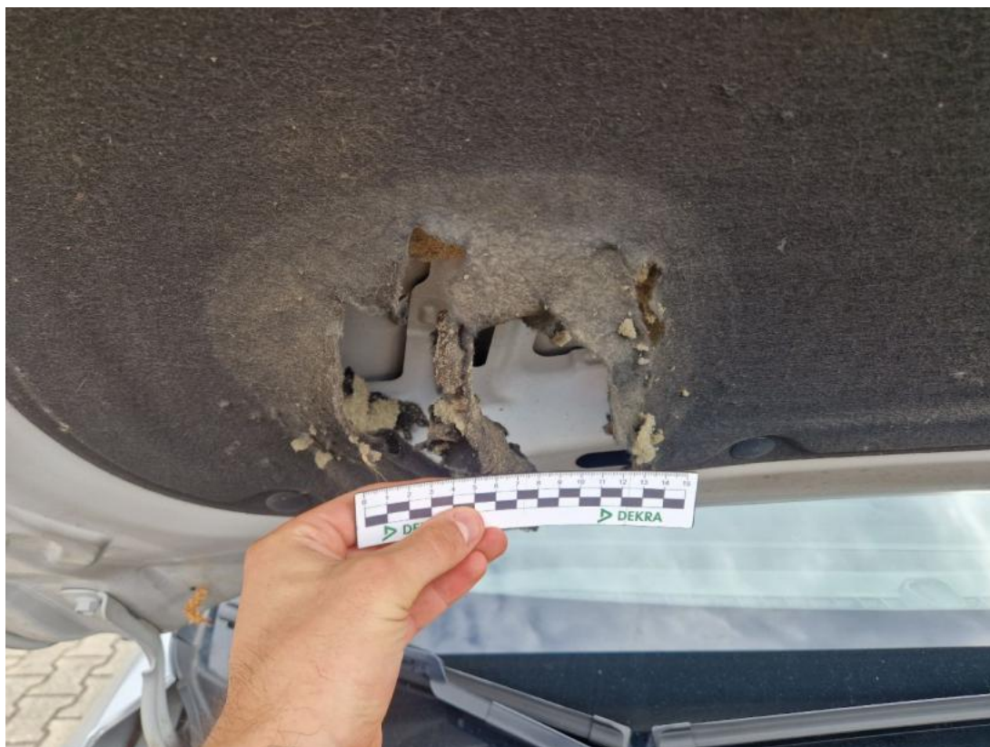
Fot. 43 Wykładzina pokrywy komory silnika - Pęknięcie/rozerwanie 1