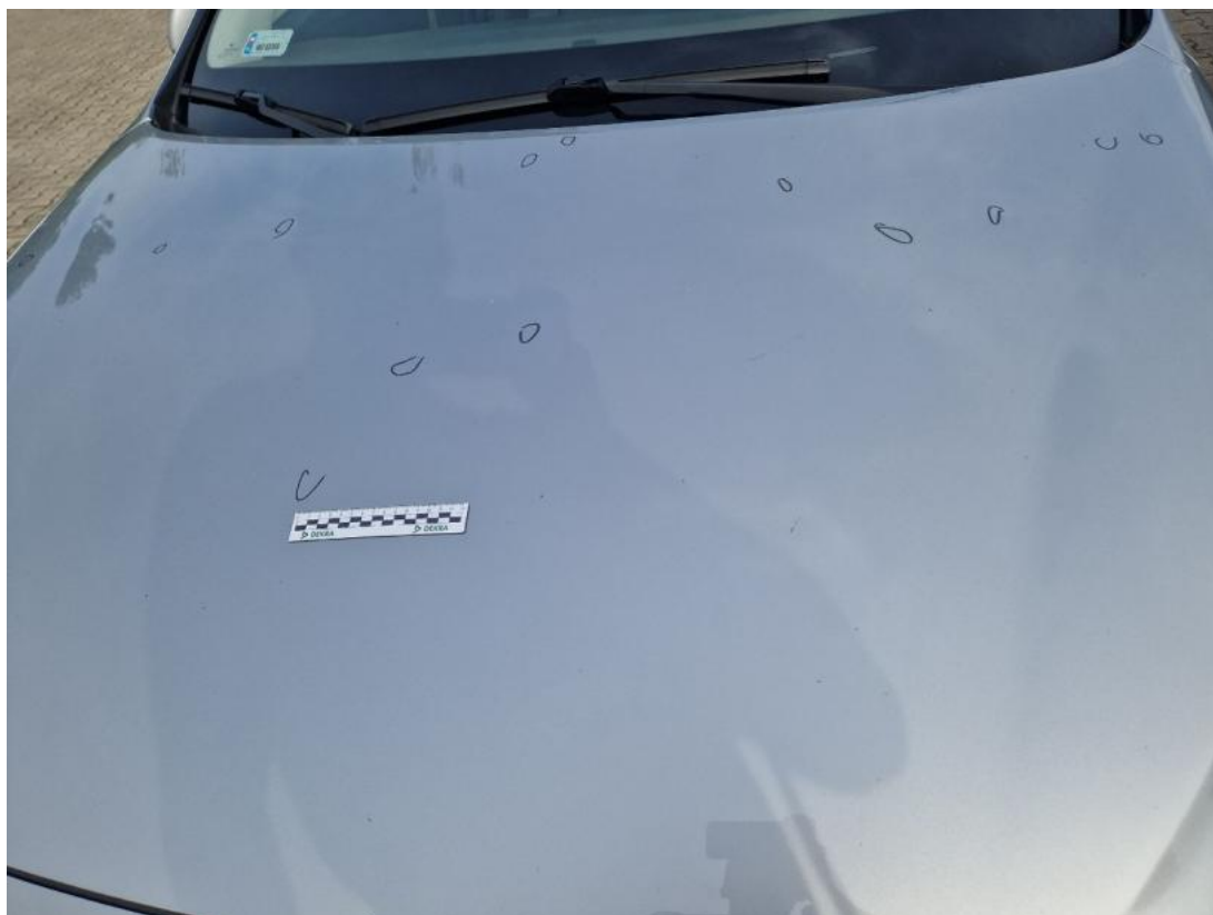
Fot. 41 Pokrywa komory silnika() - Wgniecenie/odkształcenie 3