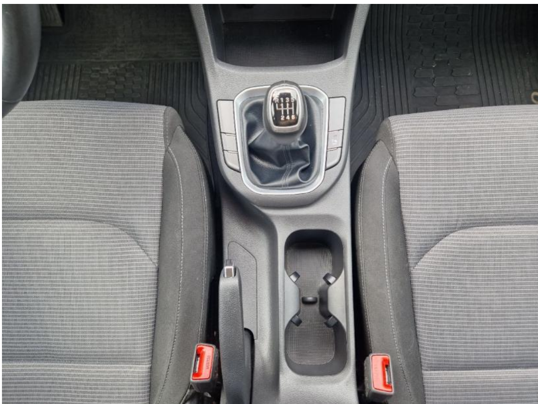
Fot. 20 Tunel środkowy