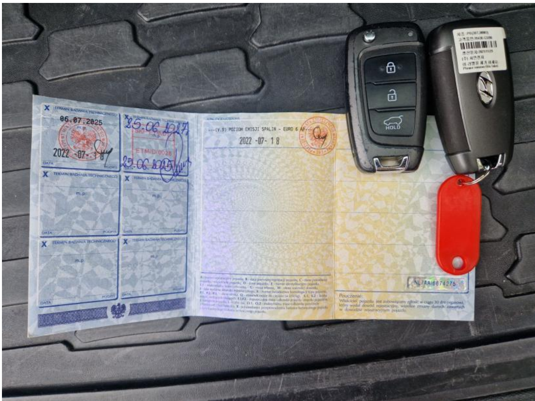
Fot. 33 Dow. Rej. Str.2 i klucze