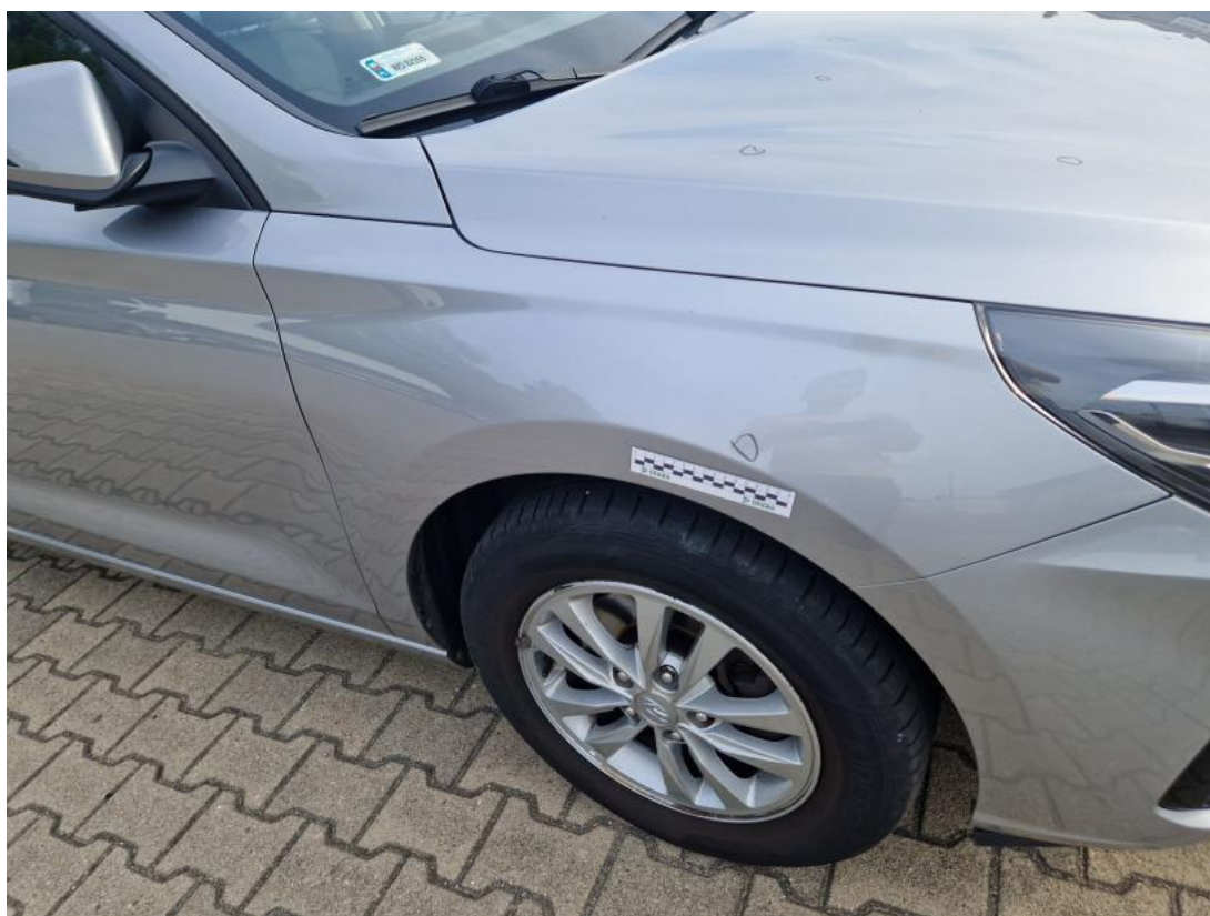
Fot. 44 Błotnik przedni P - zdjęcie pogładowe 1