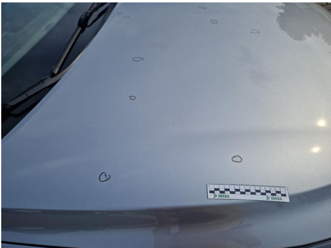
Fot. 40 Pokrywa komory silnika - Wgniecenie/odkształcenie 1