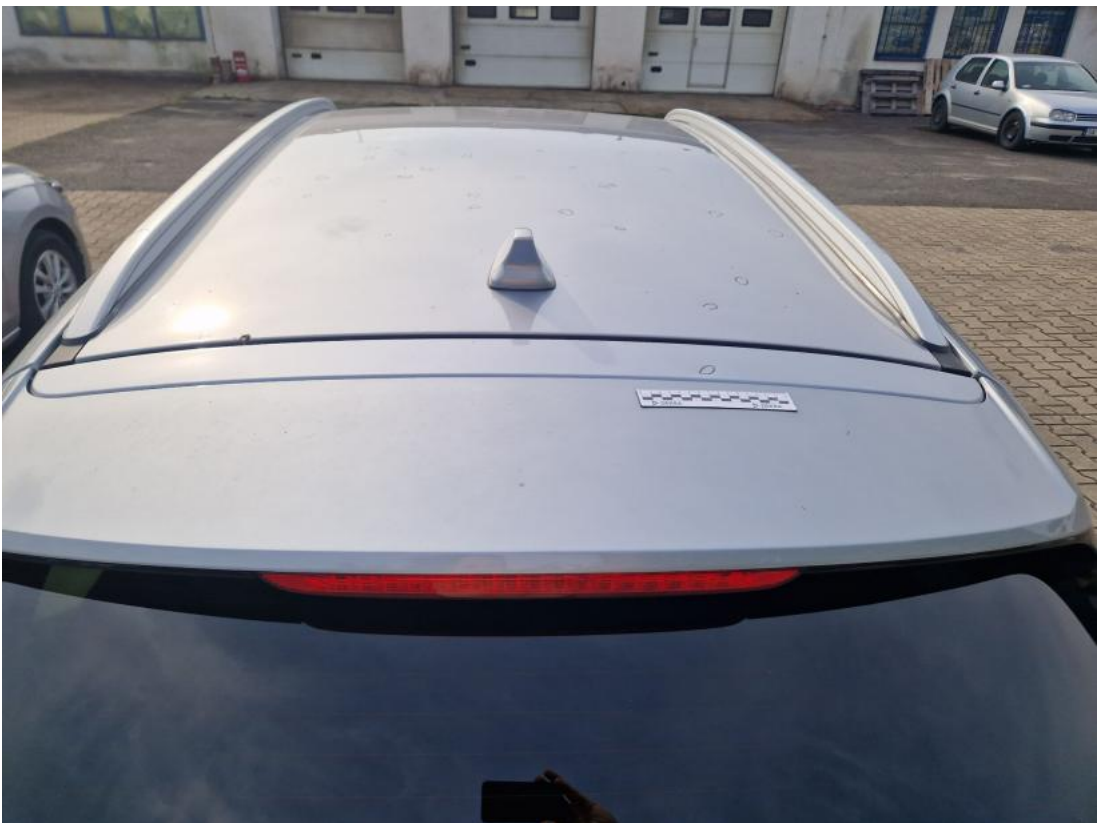
Fot. 46 Pokrywy bagażnika - zdjęcie poglądowe 1