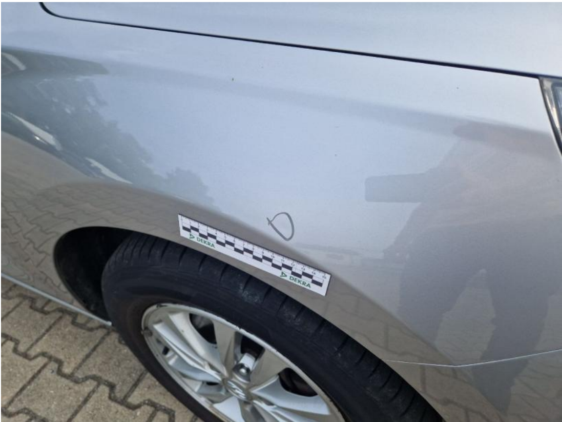
Fot. 45 Błotnik przedni P - Wgniecenie/odkształcenie 1