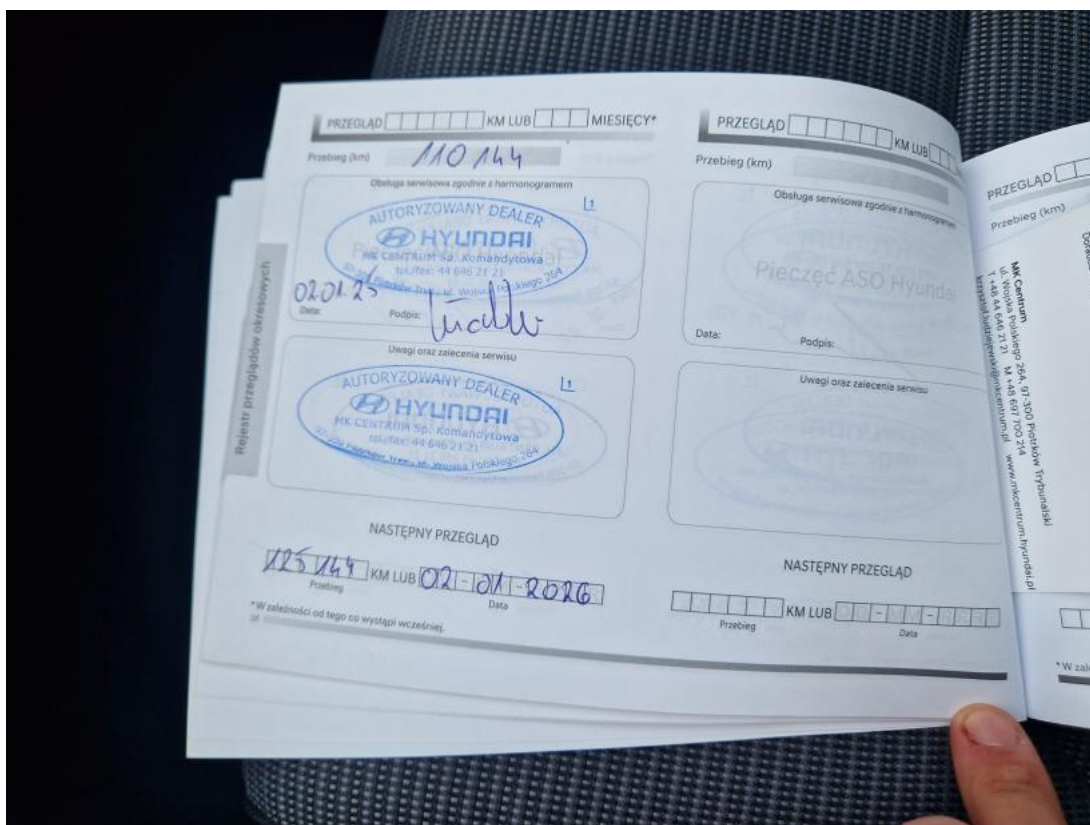
Fot. 35 Książka serwisowa – ostatni przegląd