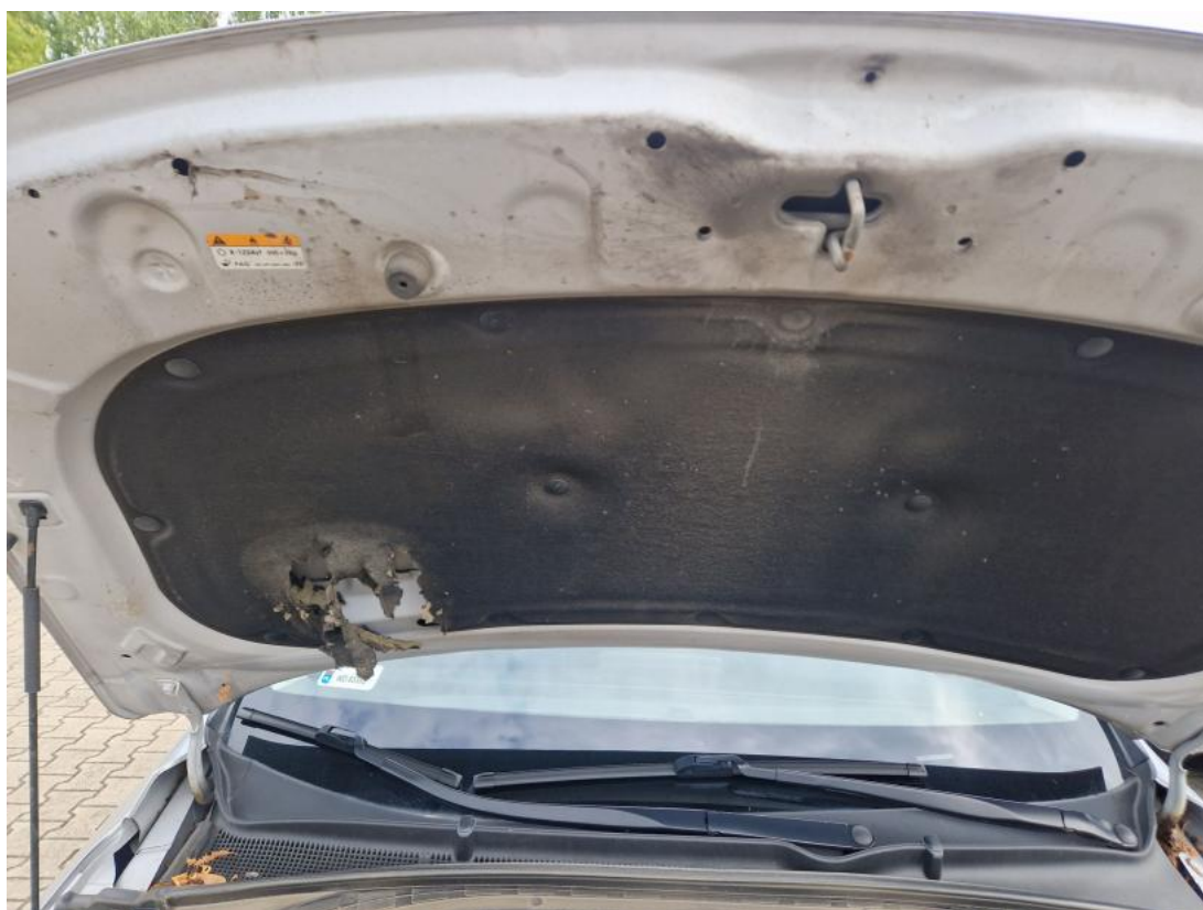
Fot. 42 Wykładzina pokrywy komory silnika - zdjęcie poglądowe 1