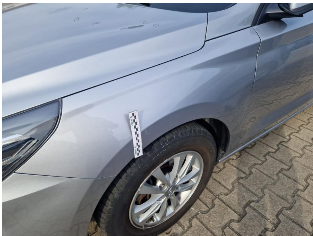
Fot. 56 Błotnik przedni L - zdjęcie poglądowe 1