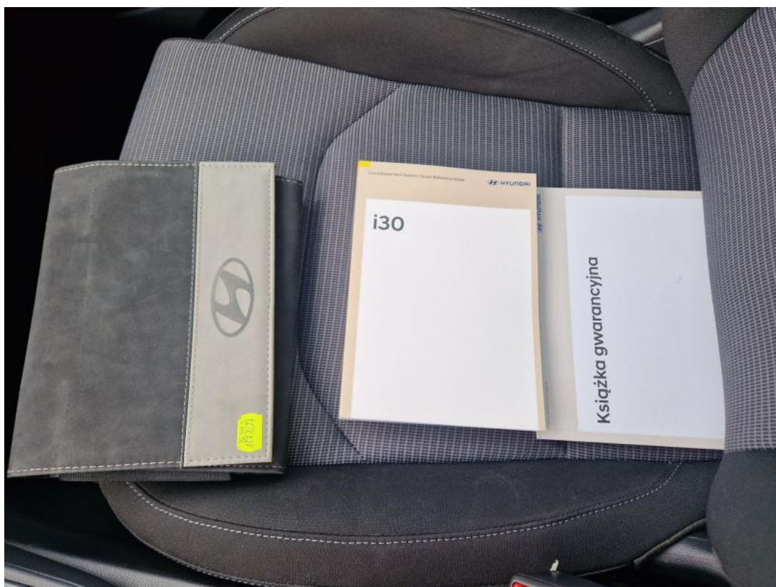
Fot. 36 Instrukcje