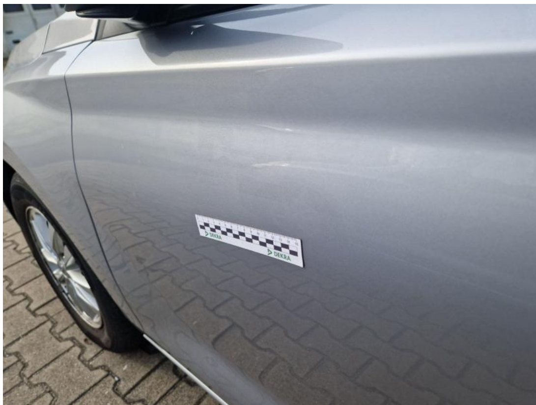
Fot. 55 Drzwi przed L - Inne 1