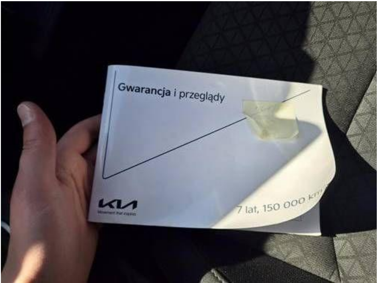
Fot. nr 87

Dokument wystawiony elektronicznie, wa ny bez podpisu