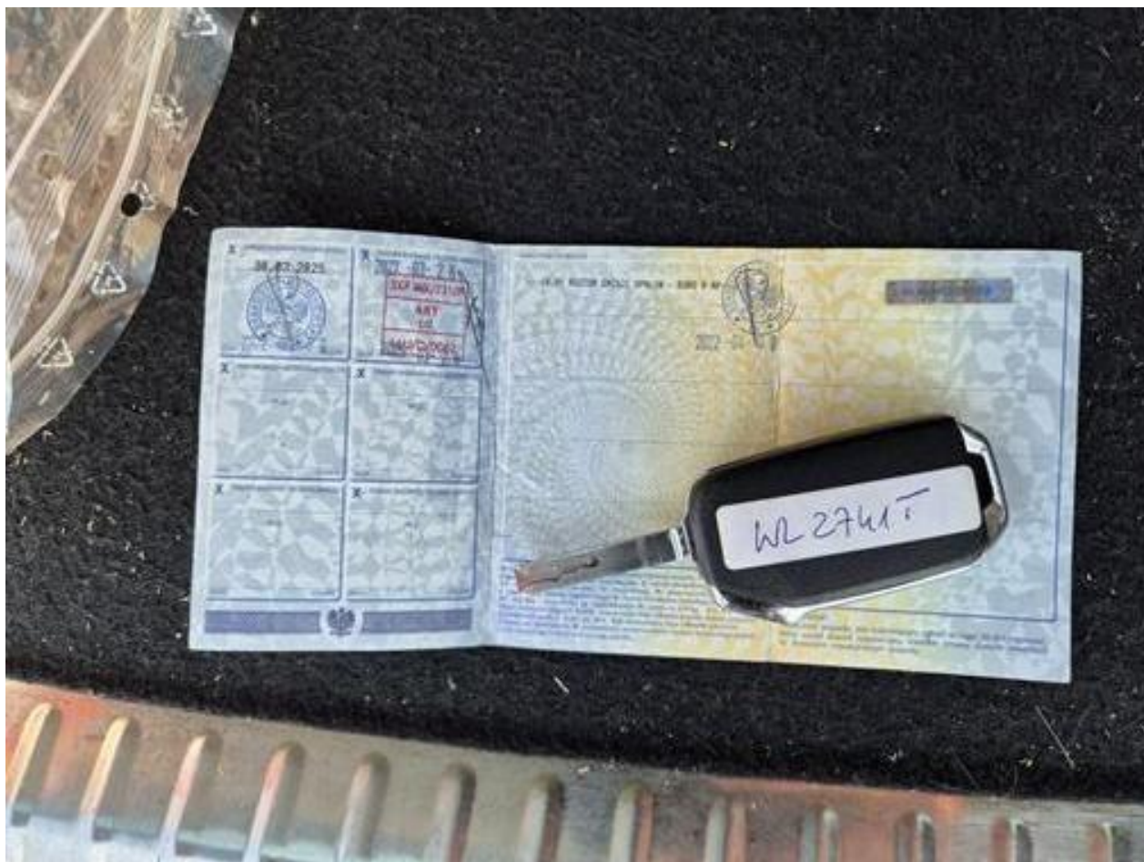
Fot. nr 86