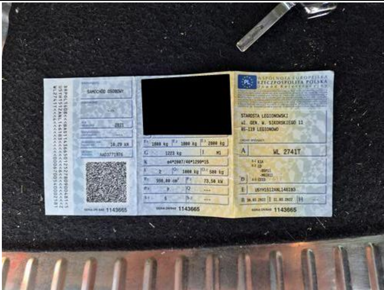
Fot. nr 85