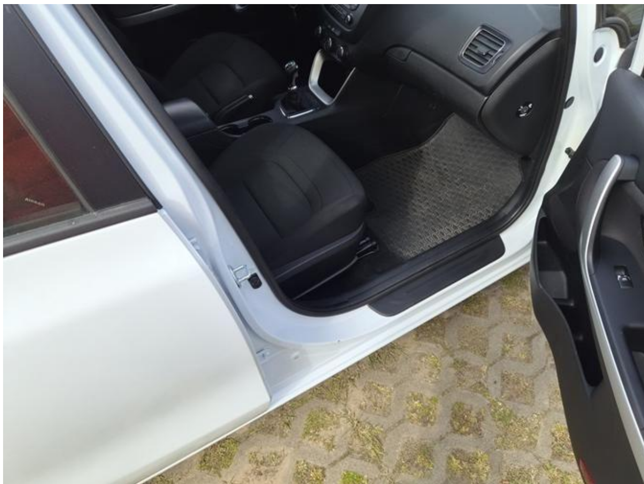
Fot. nr 108