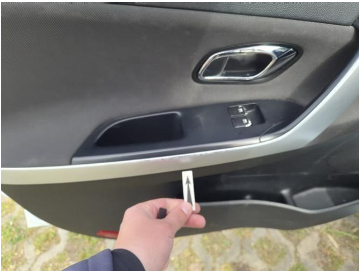
Fot. nr 96