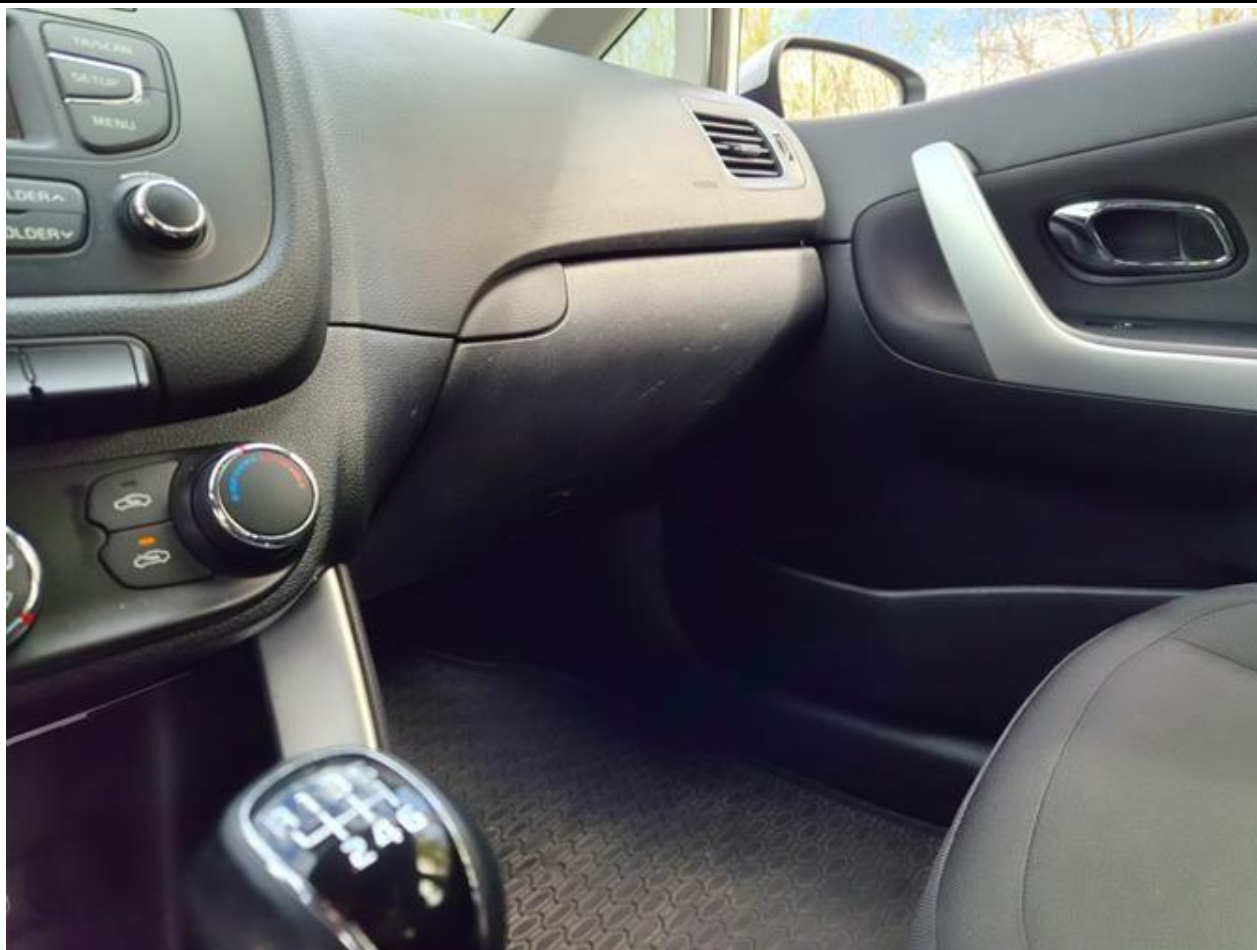
Fot. nr 101