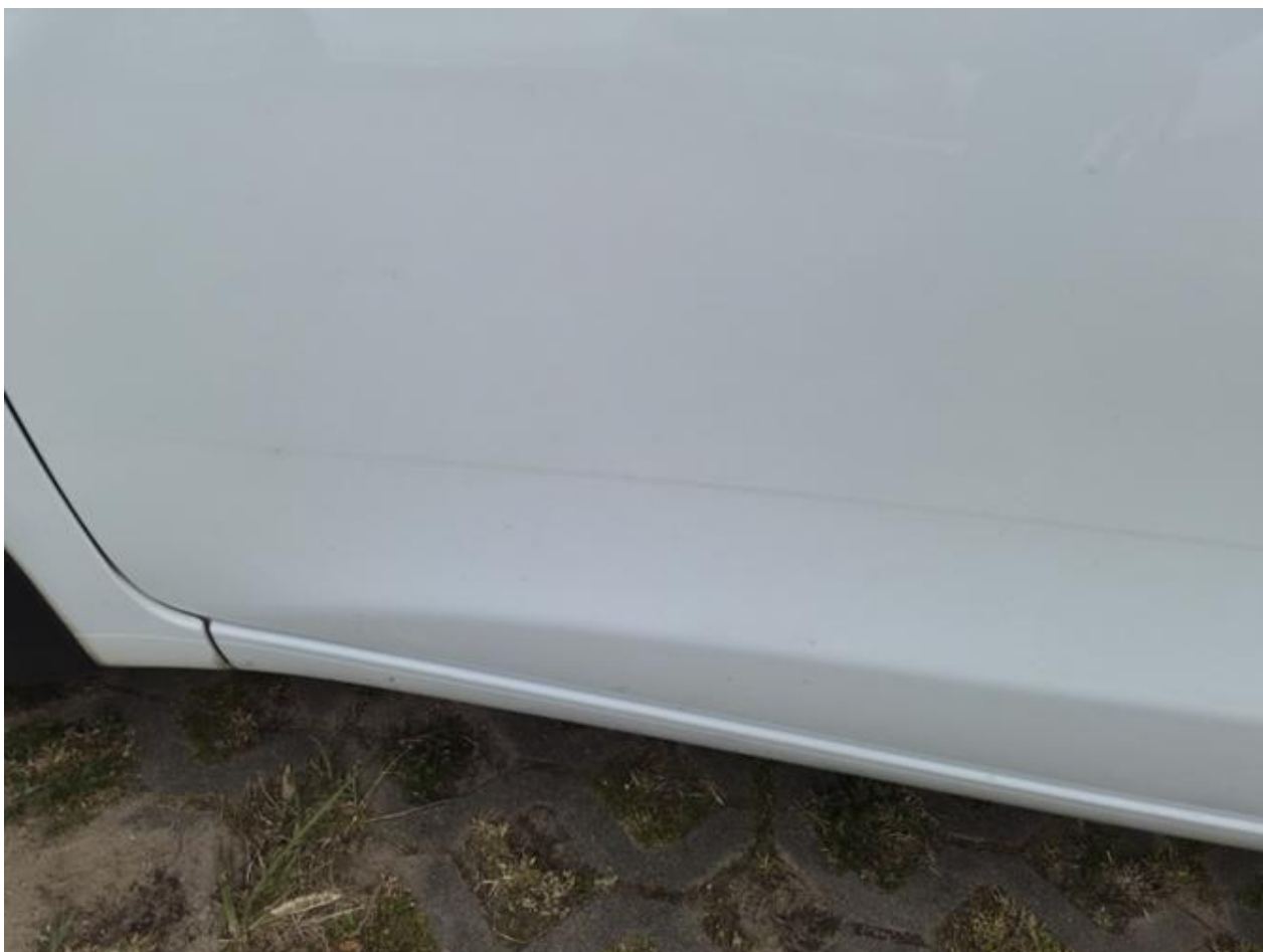
Fot. nr 92