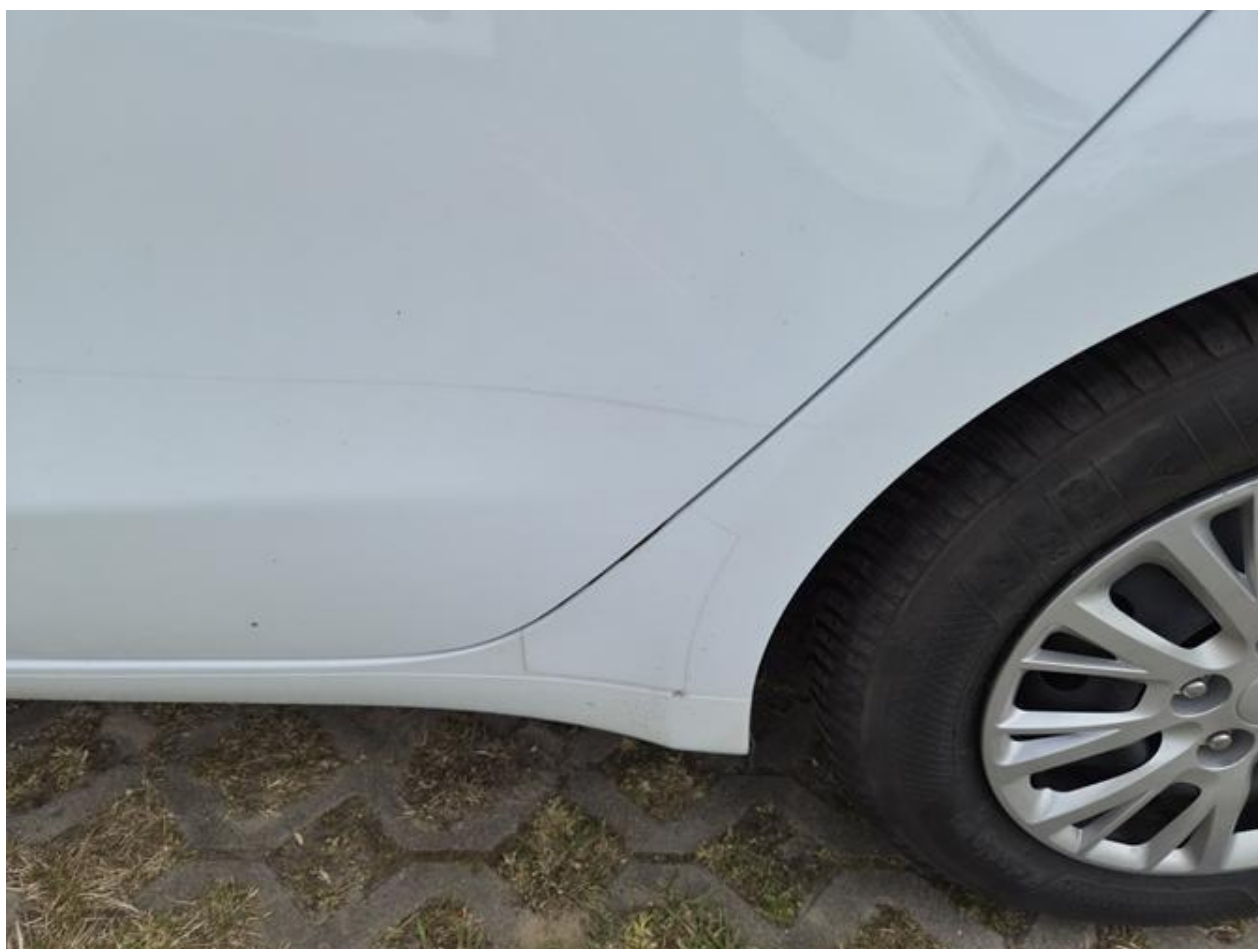
Fot. nr 86