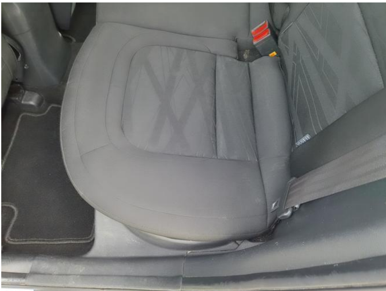
Fot. nr 104