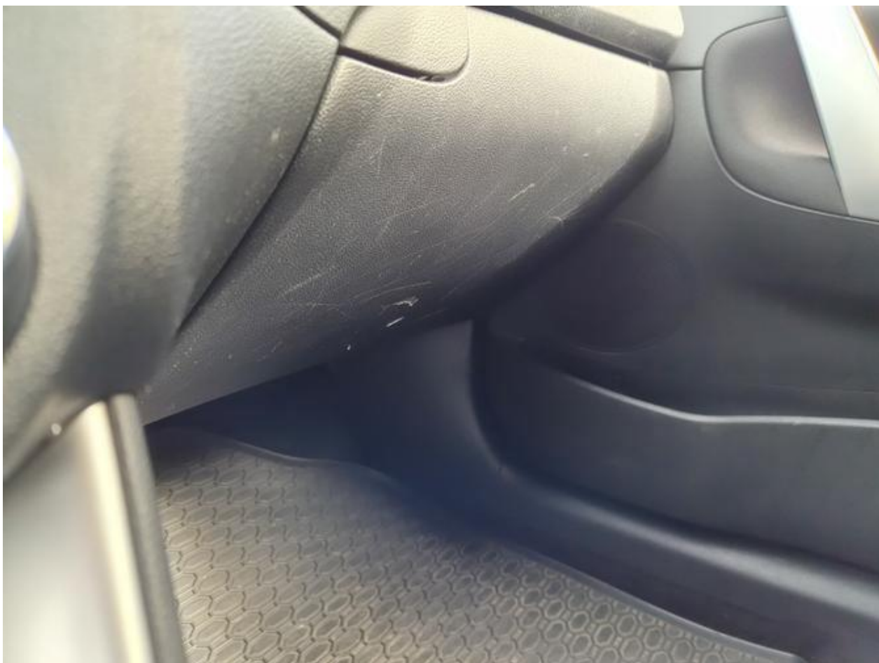
Fot. nr 100