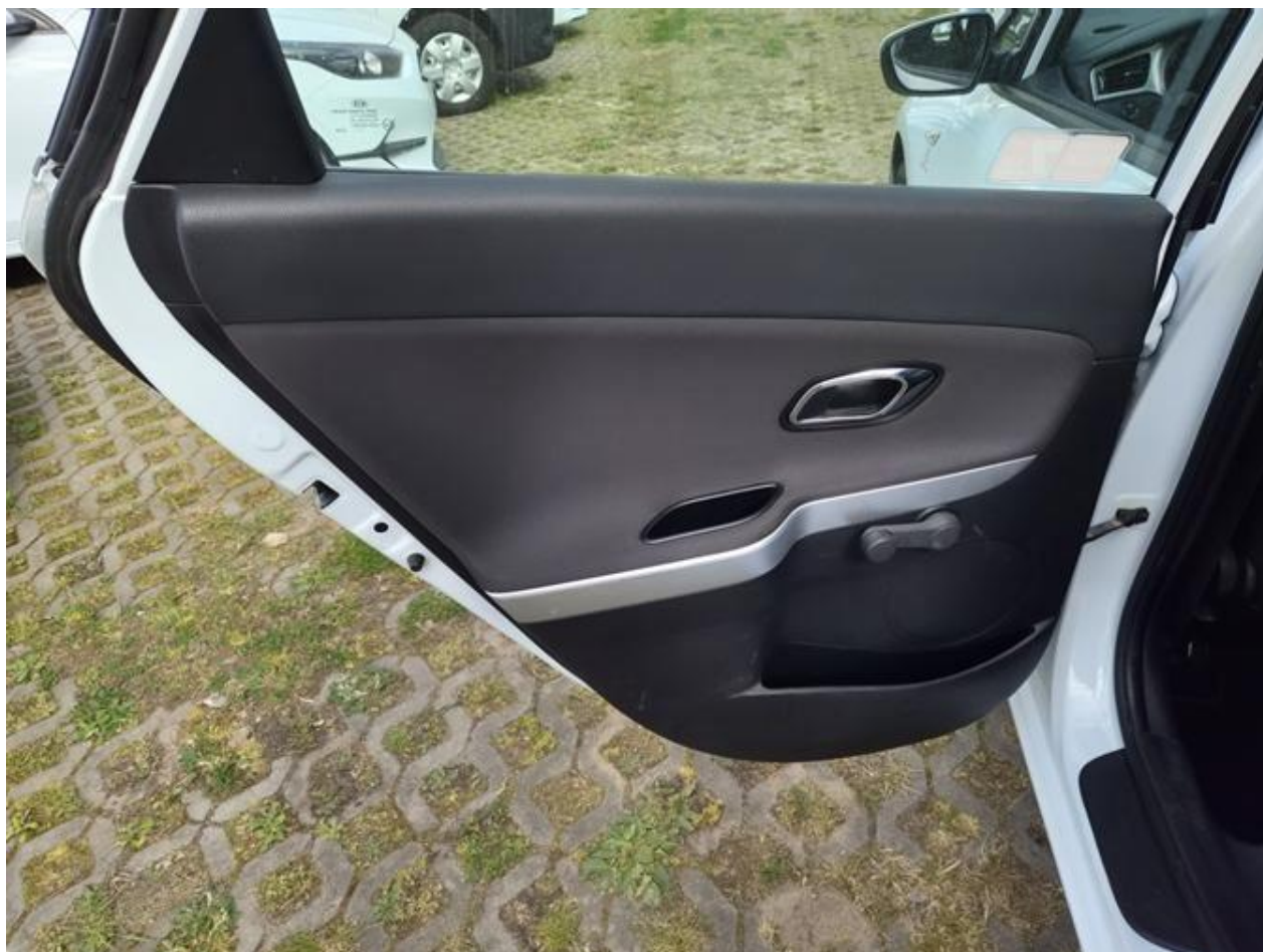
Fot. nr 102