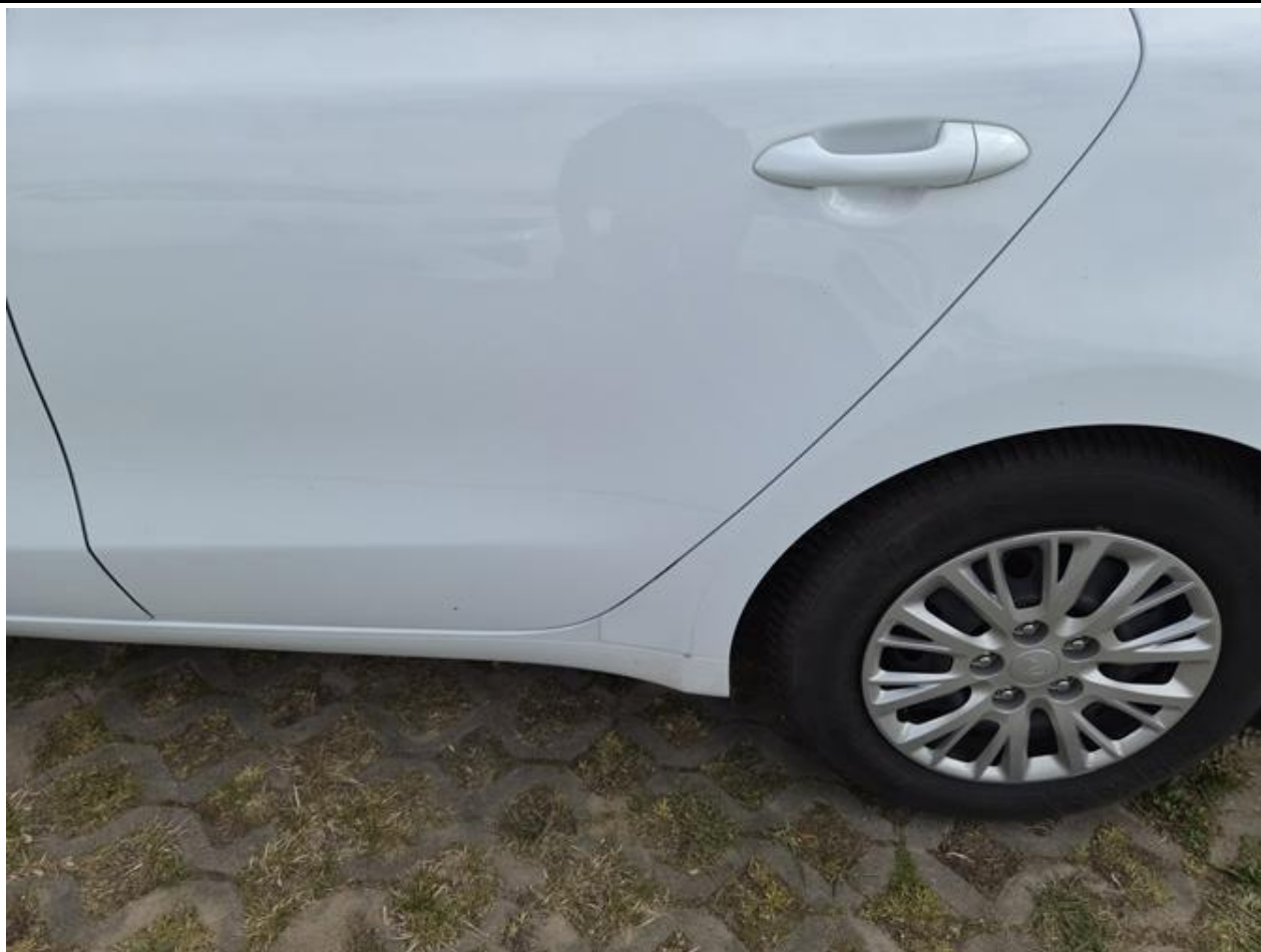
Fot. nr 85