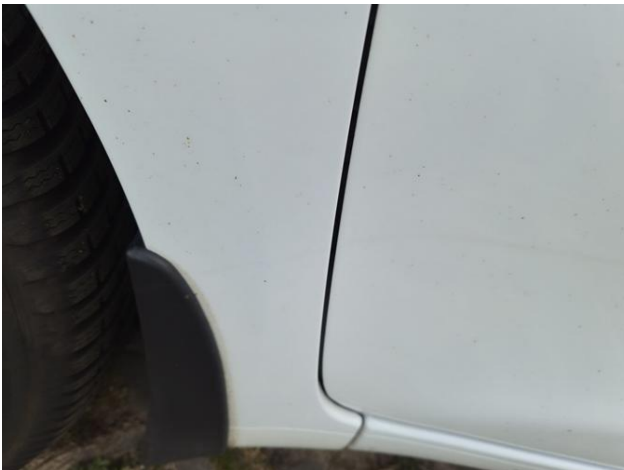
Fot. nr 94