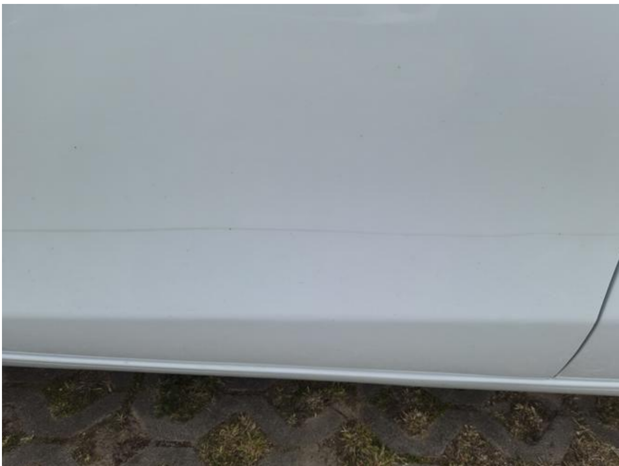
Fot. nr 90