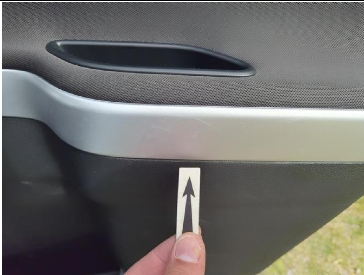
Fot. nr 107