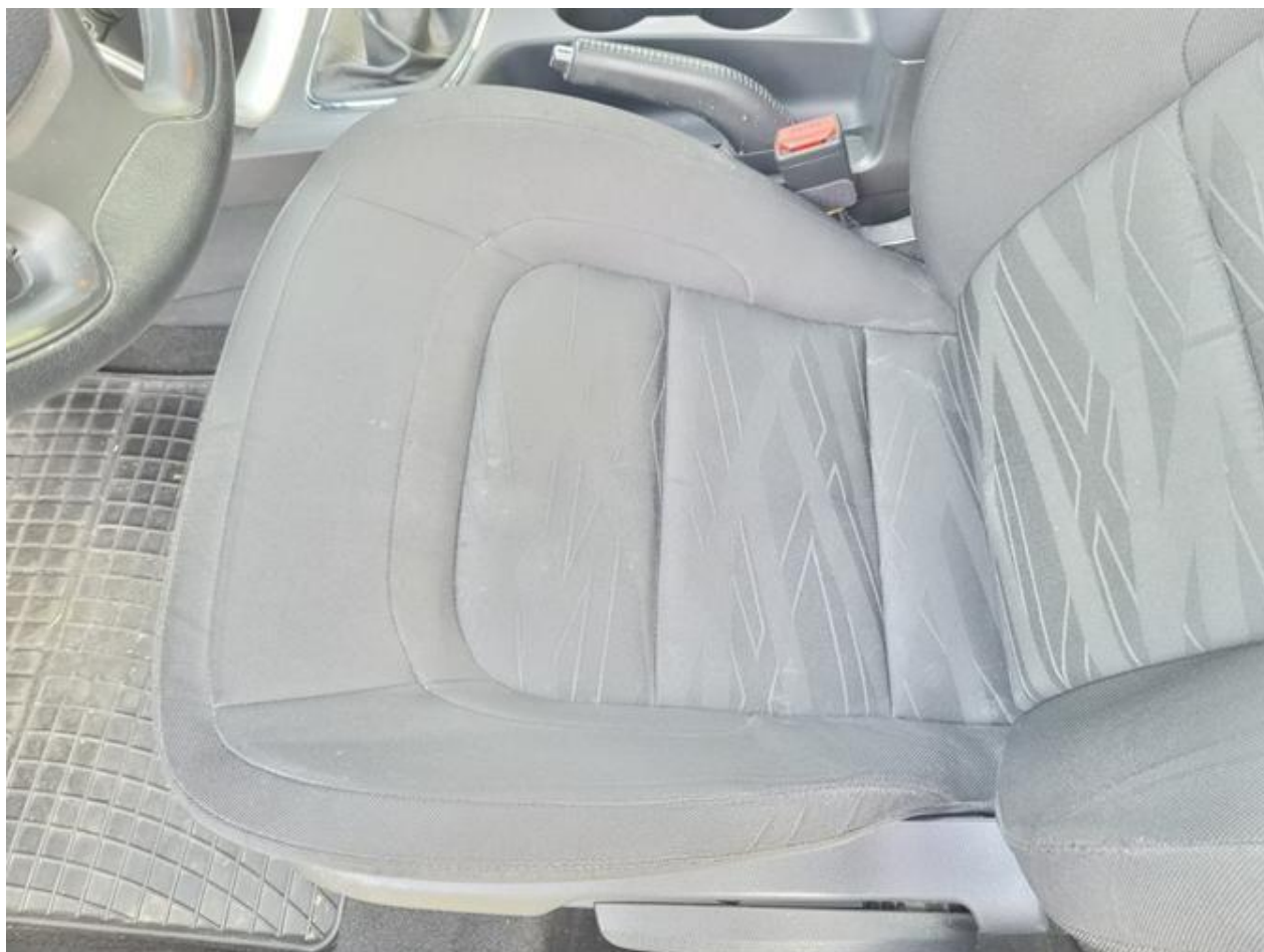
Fot. nr 98