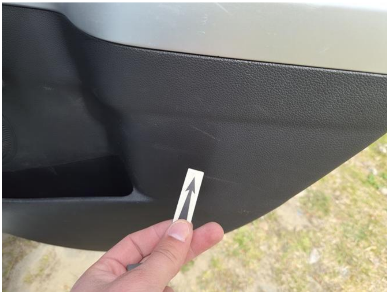
Fot. nr 106