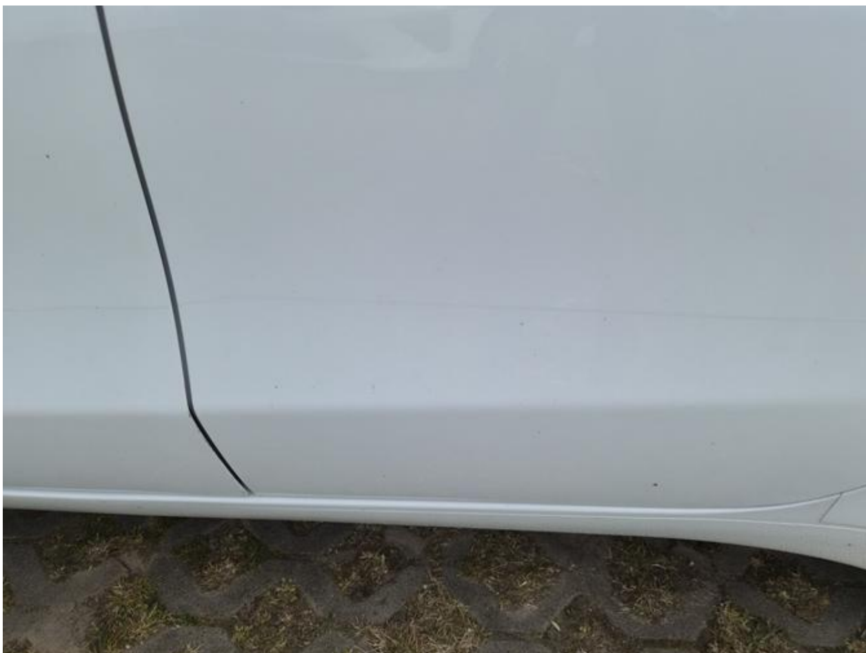
Fot. nr 88