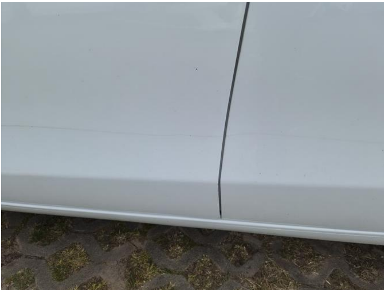
Fot. nr 89