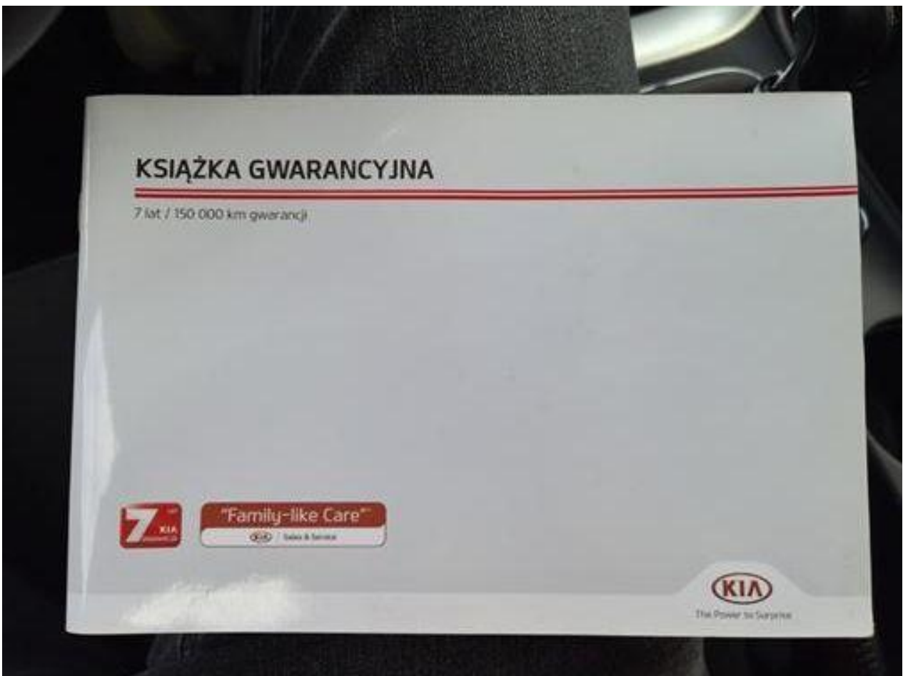
Fot. nr 112

Dokument wystawiony elektronicznie, wa ny bez podpisu