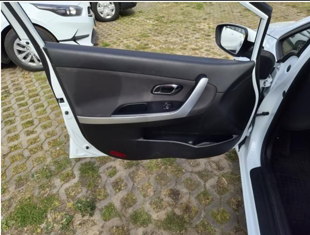
Fot. nr 95