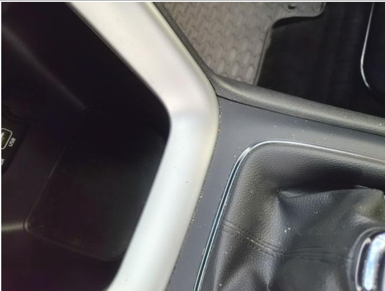
Fot. nr 99