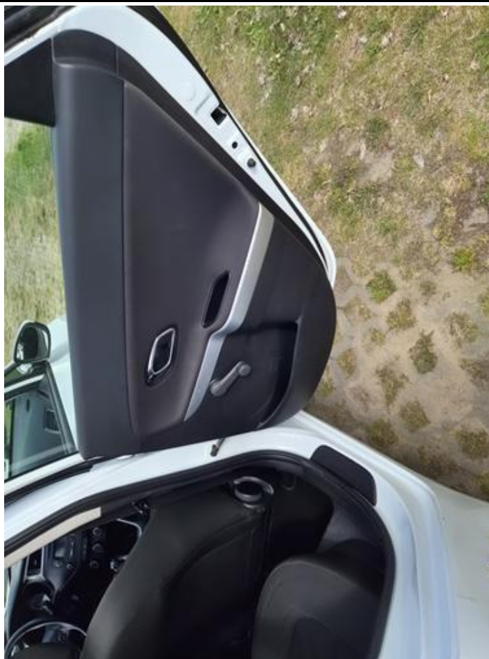
Fot. nr 105