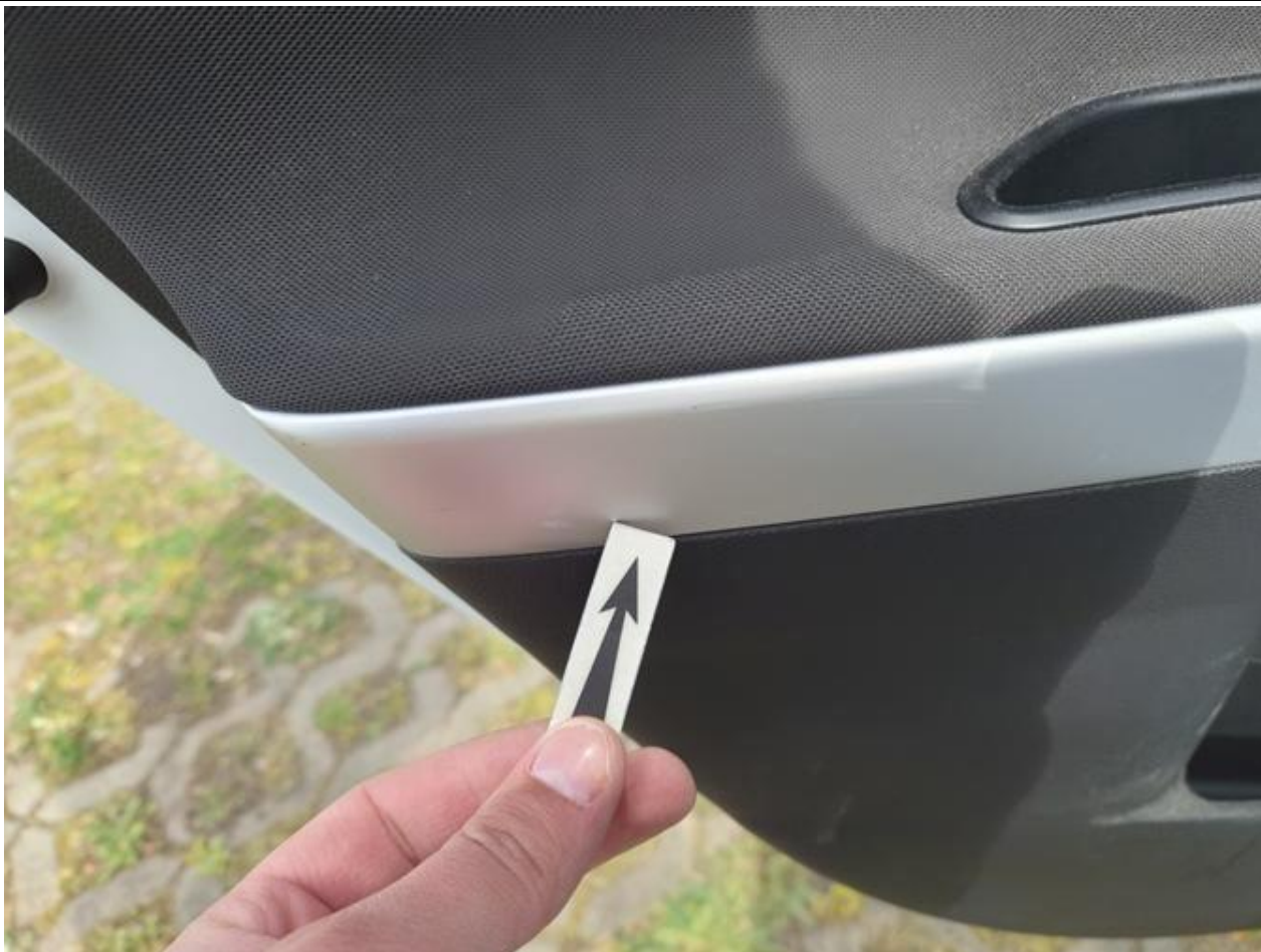
Fot. nr 103