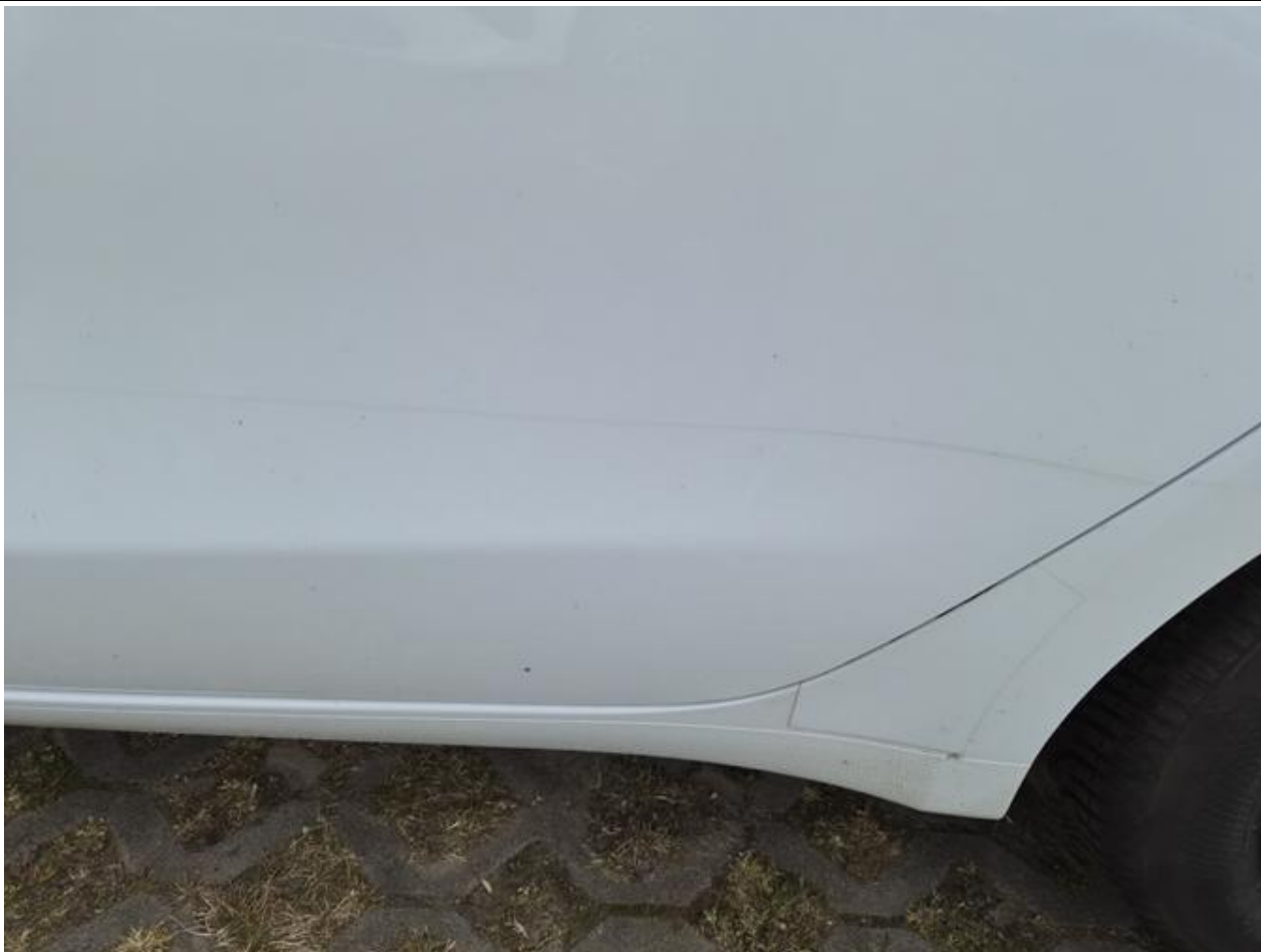
Fot. nr 87