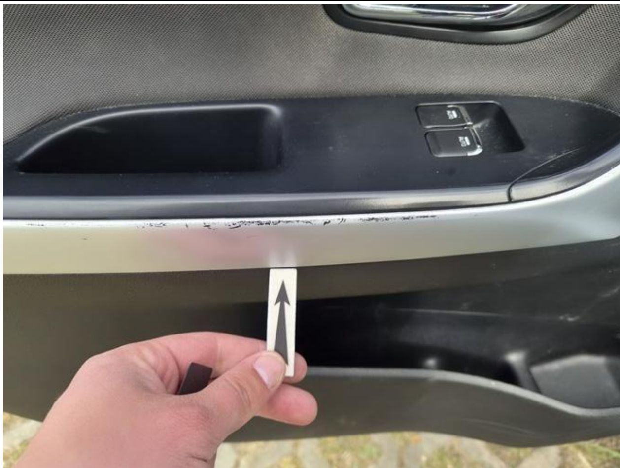
Fot. nr 97