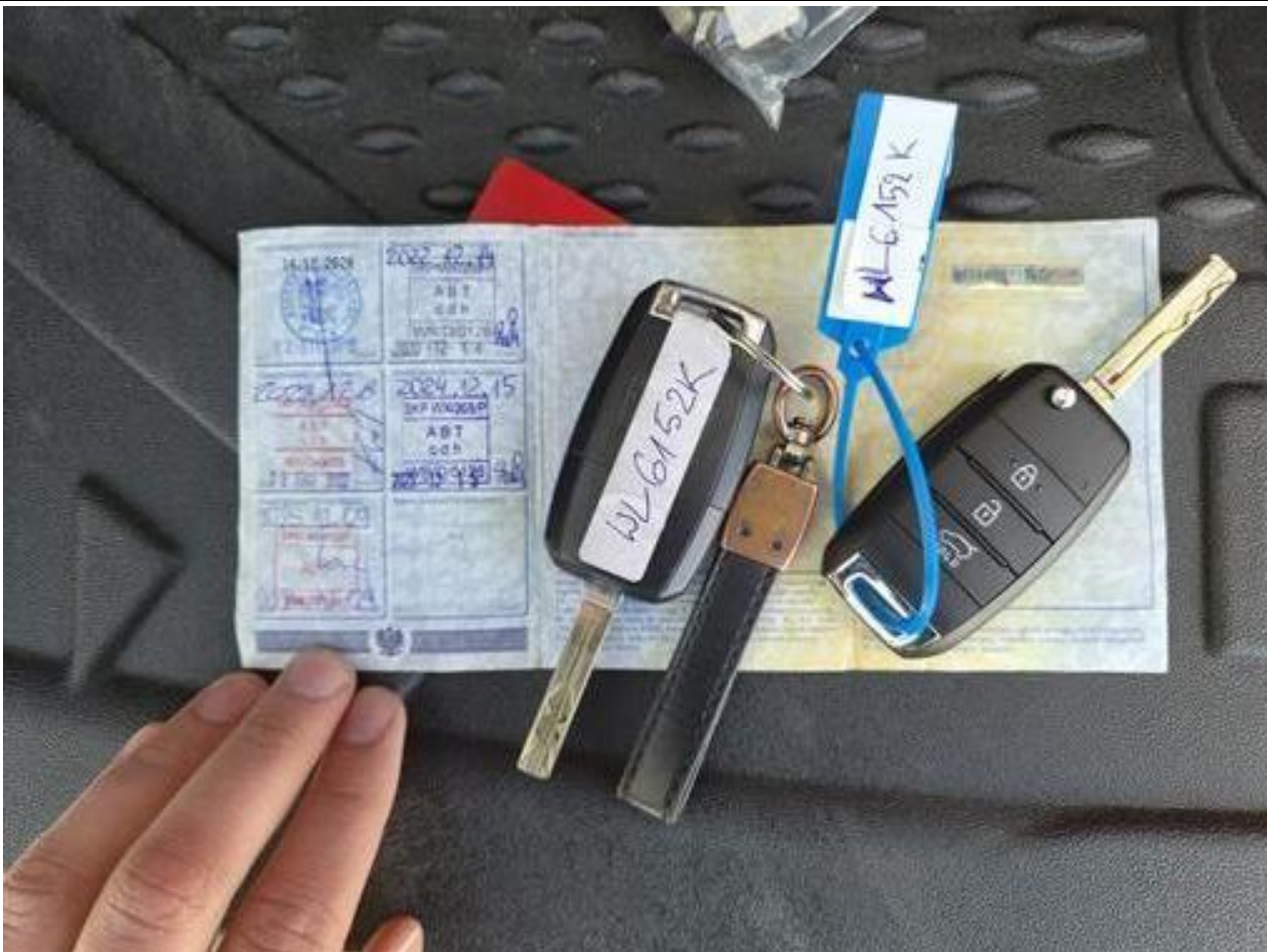
Fot. nr 111