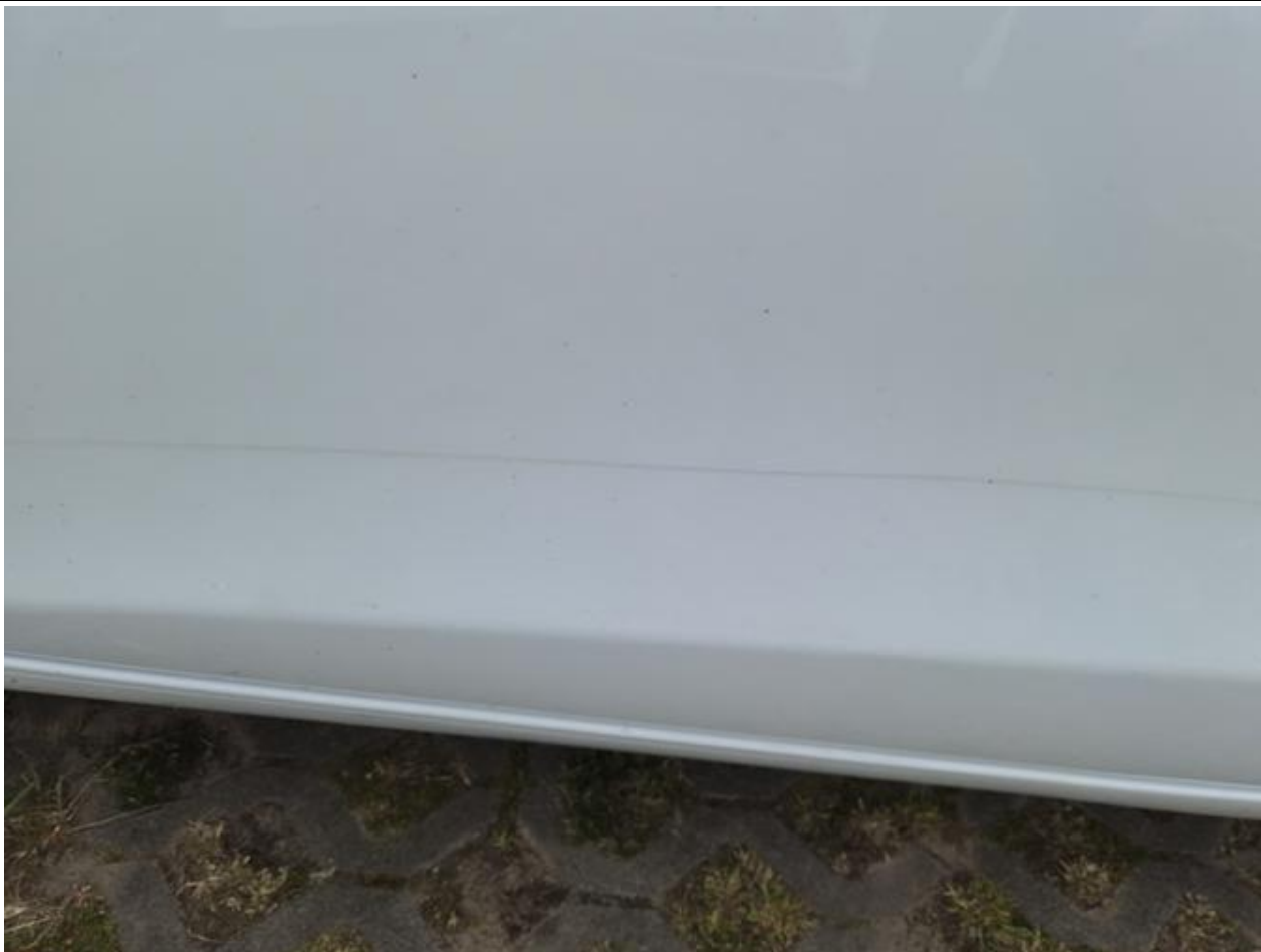
Fot. nr 91