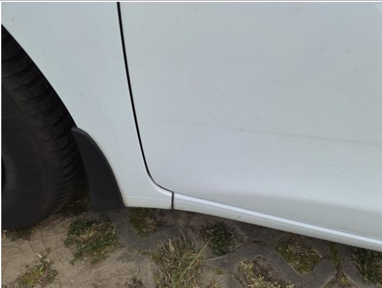
Fot. nr 93