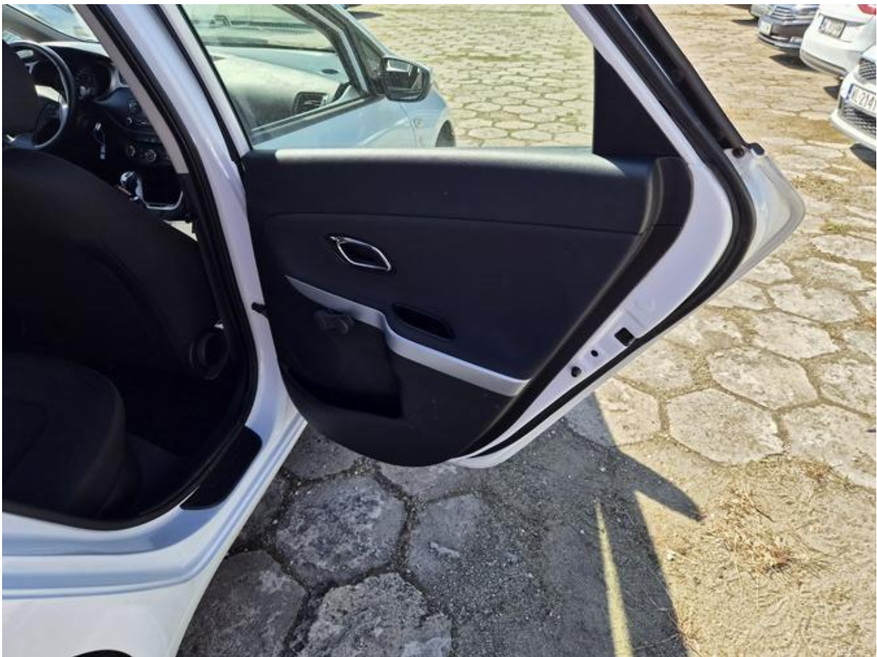
Fot. nr 82