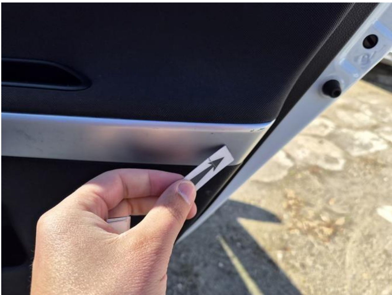
Fot. nr 84