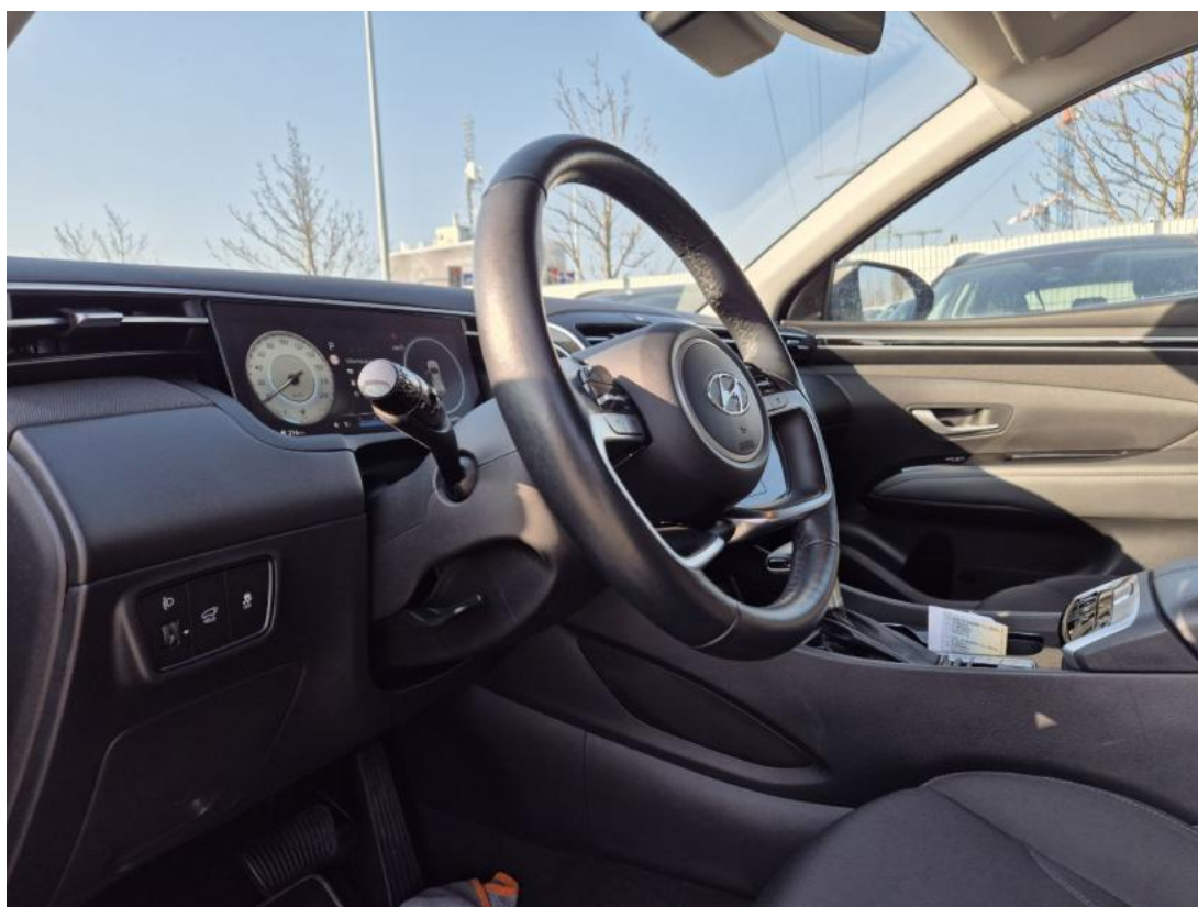
Fot. 22 Kierownica z lewej strony