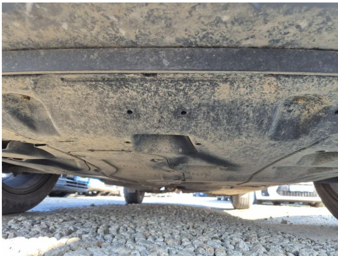
Fot. 25 Spód pojazdu przód