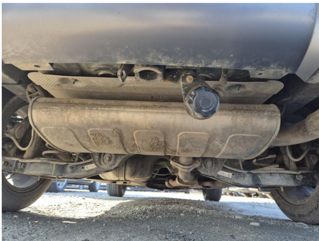
Fot. 26 Spód pojazdu tył