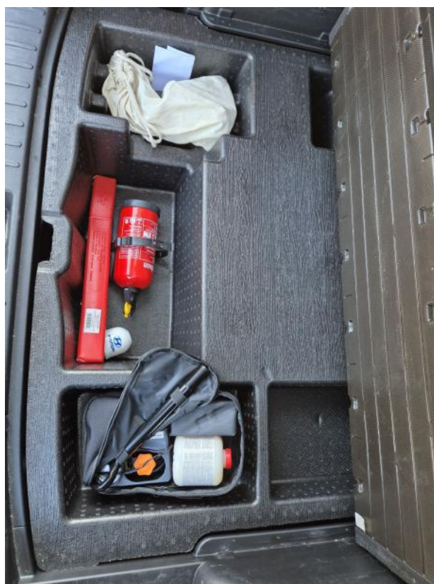
Fot. 36 Zestaw naprawczy koła