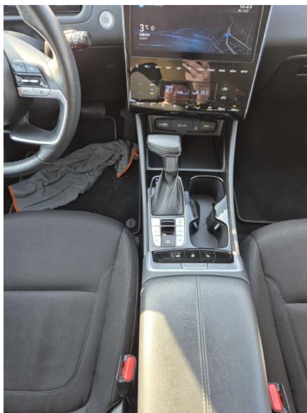
Fot. 20 Tuneł środkowy