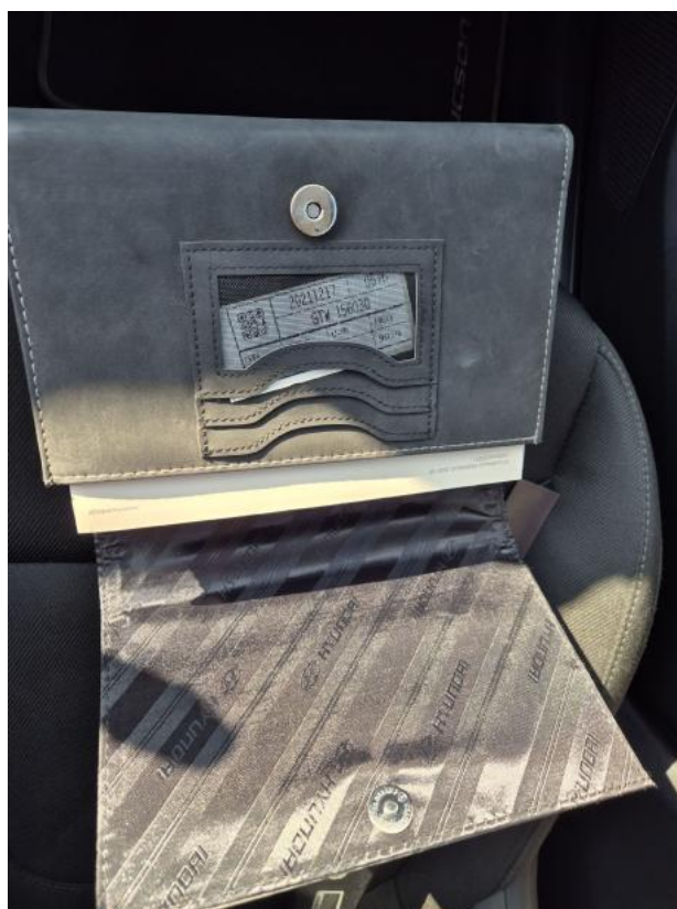
Fot. 35 Instrukcje