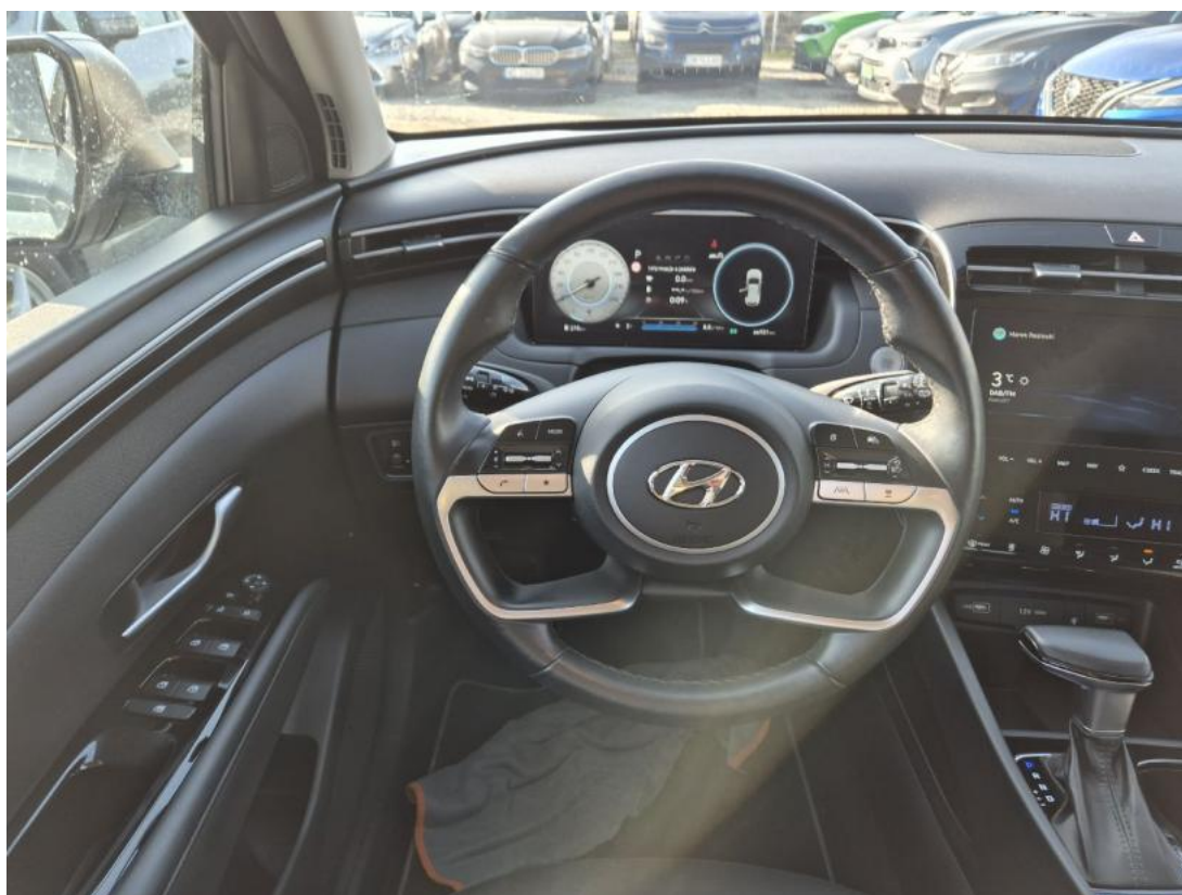
Fot. 21 Kierownica (na wprost)