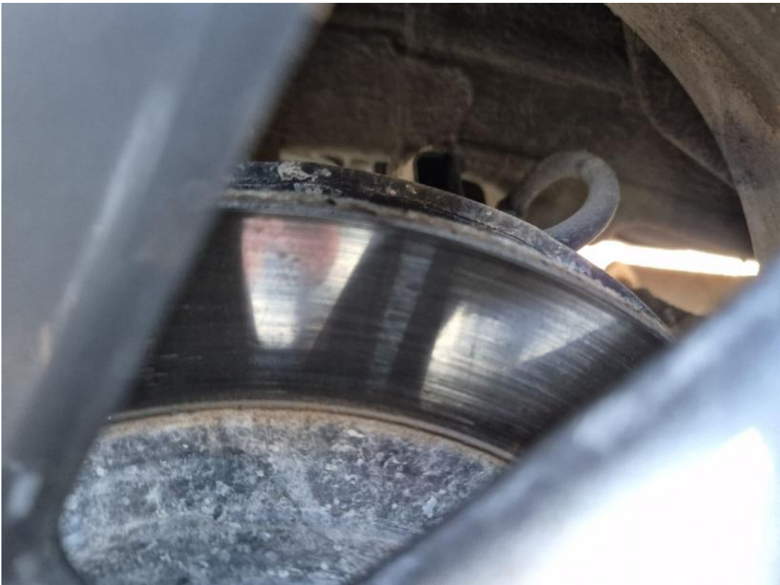
Fot. 29 Tarcza hamulcowa tylna prawa