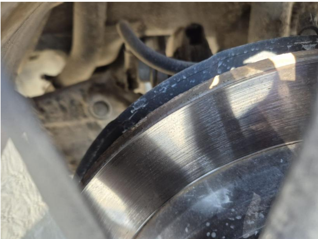
Fot. 30 Tarcza hamulcowa tylna lewa