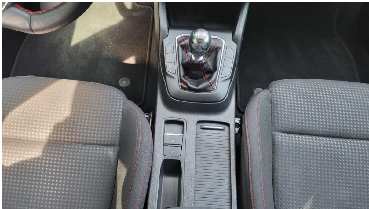
Fot. 20 Tuneł środkowy