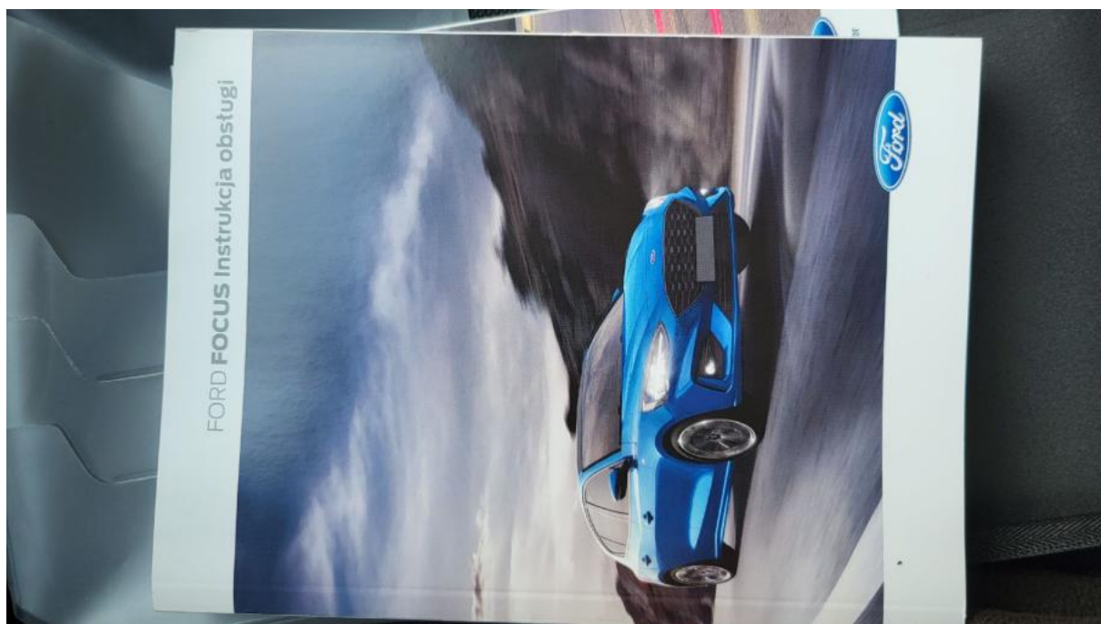
Fot. 31 Instrukcje