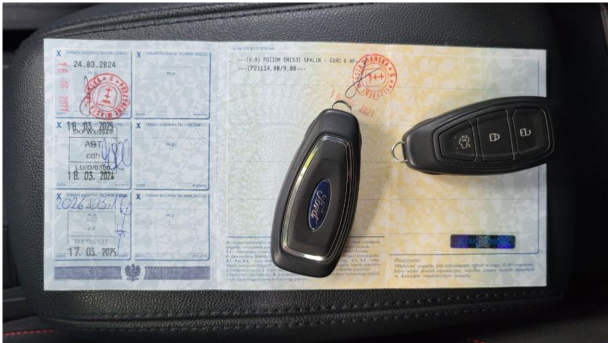
Fot. 29 Dow. Rej. Str.2 i klucze