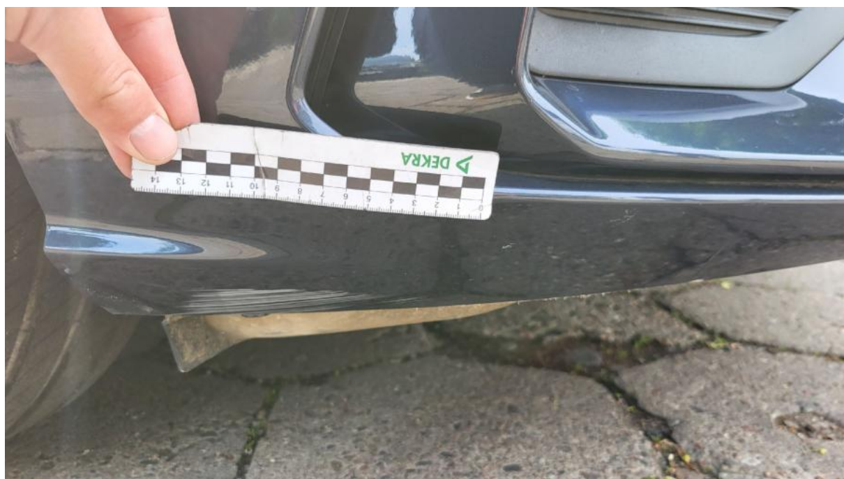
Fot. 32 Zderzak - Rysa/odprysk 1