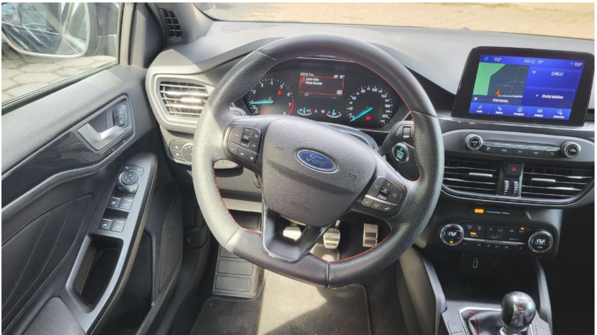
Fot. 22 Kierownica z lewej strony