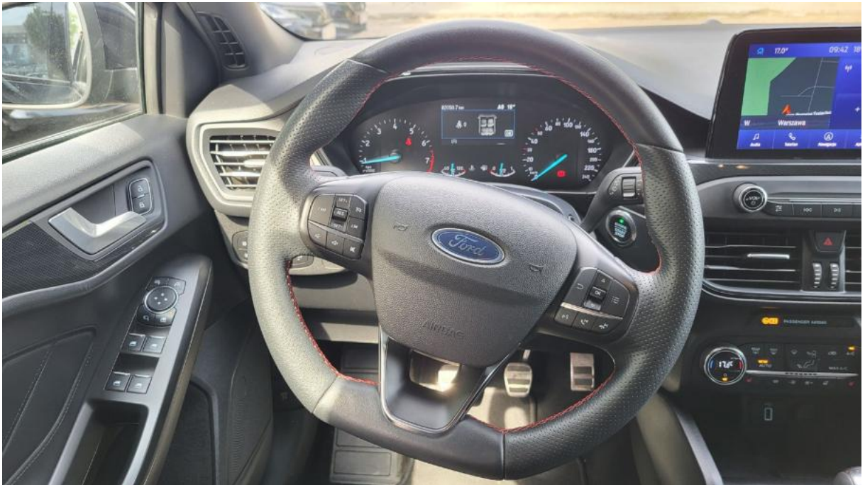
Fot. 21 Kierownica (na wprost)