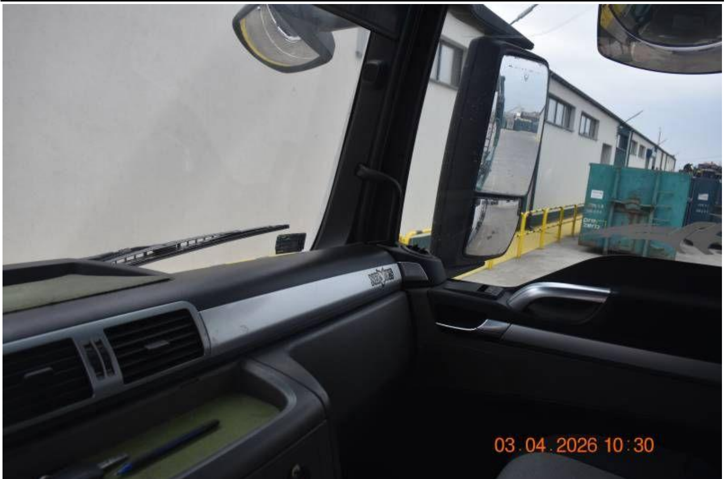
Fot. nr 83