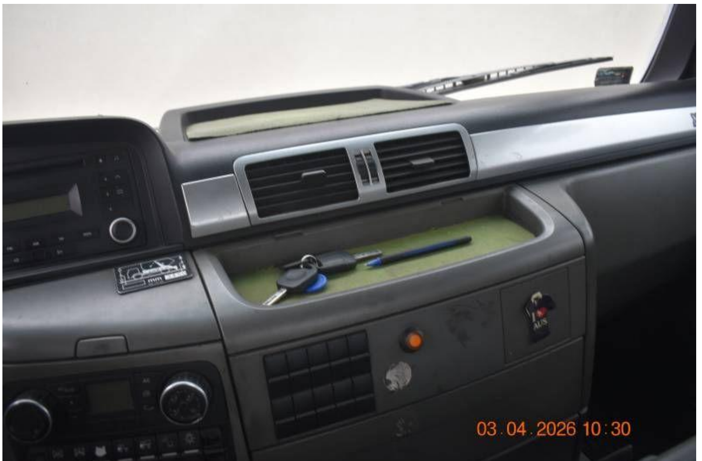
Fot. nr 84