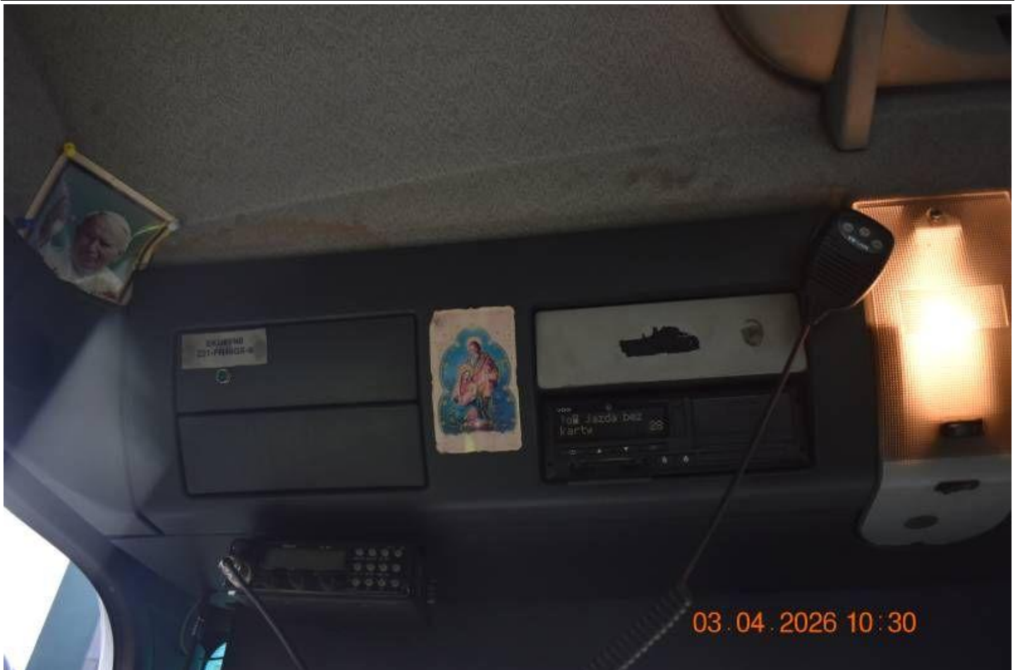
Fot. nr 81