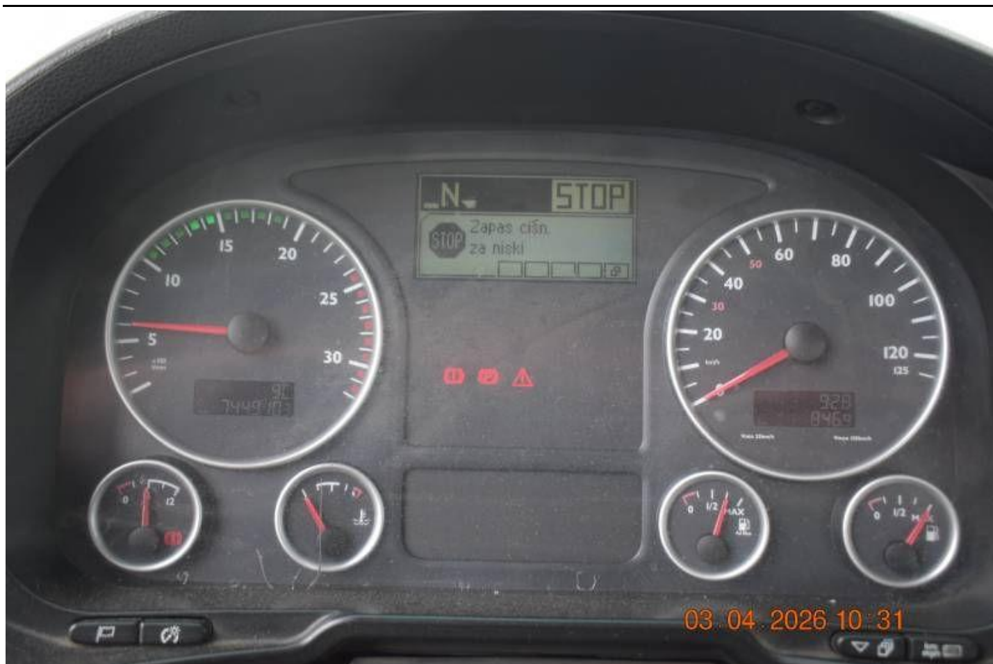
Fot. nr 87