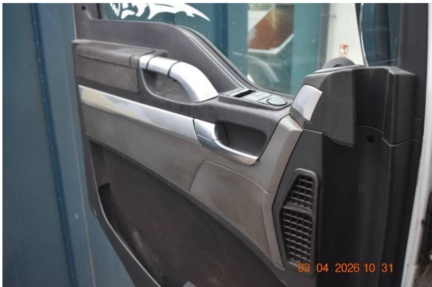
Fot. nr 88