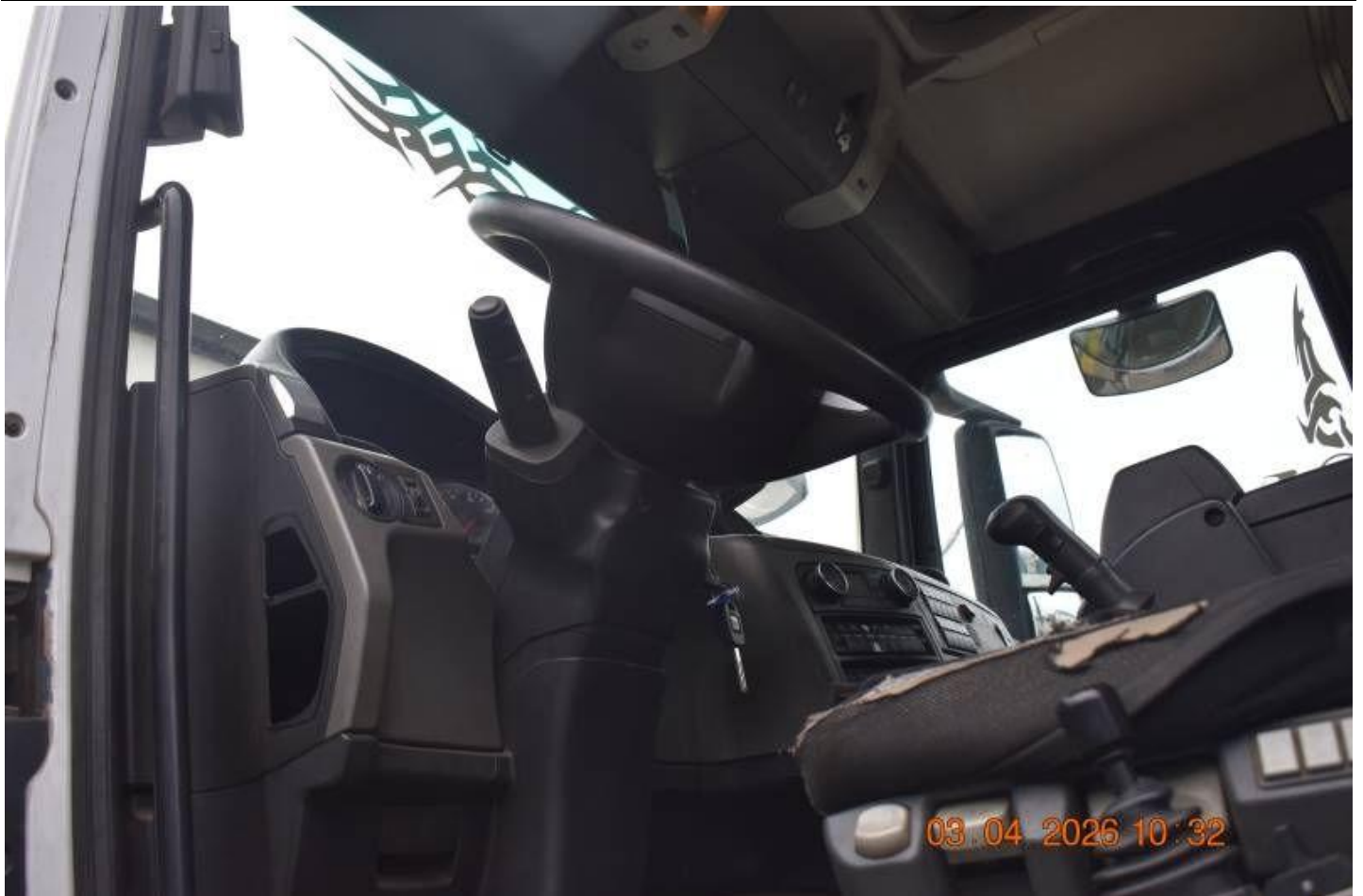
Fot. nr 93