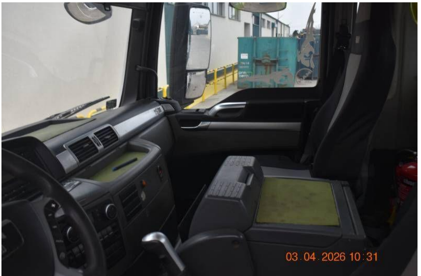
Fot. nr 92