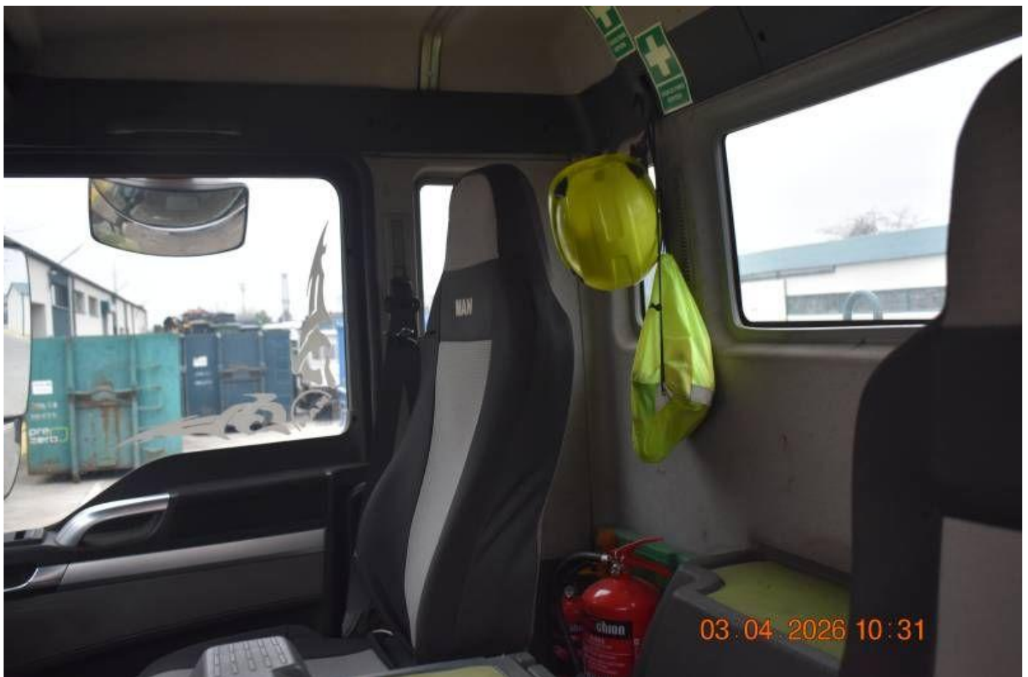
Fot. nr 90