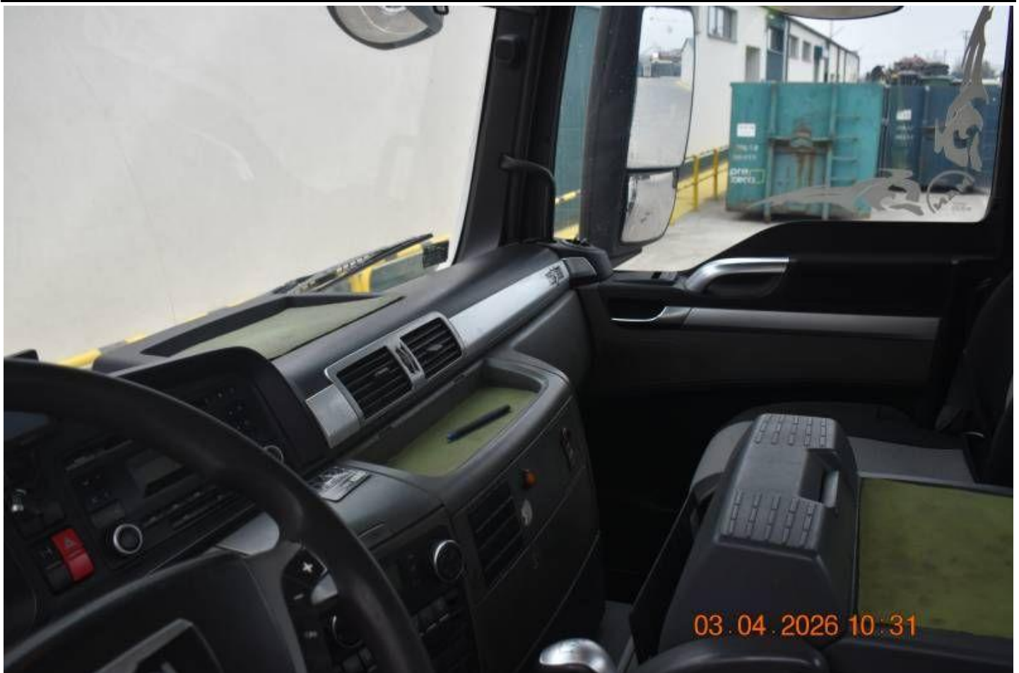
Fot. nr 89