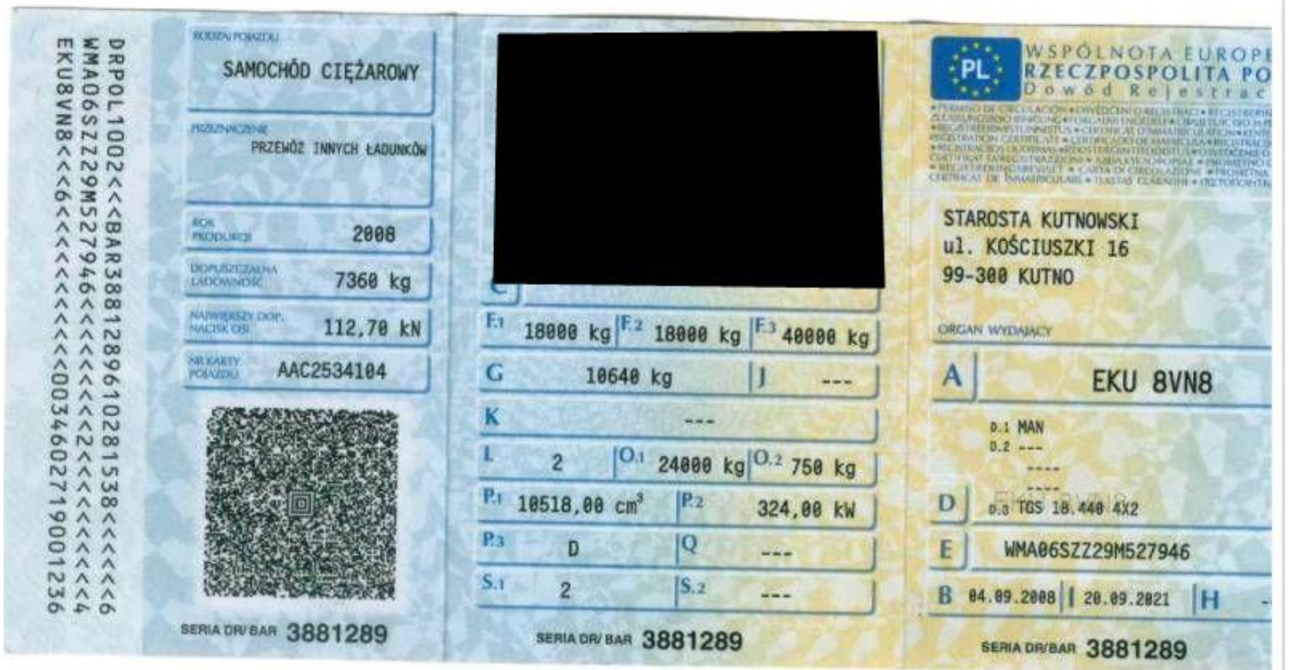
Fot. nr 94