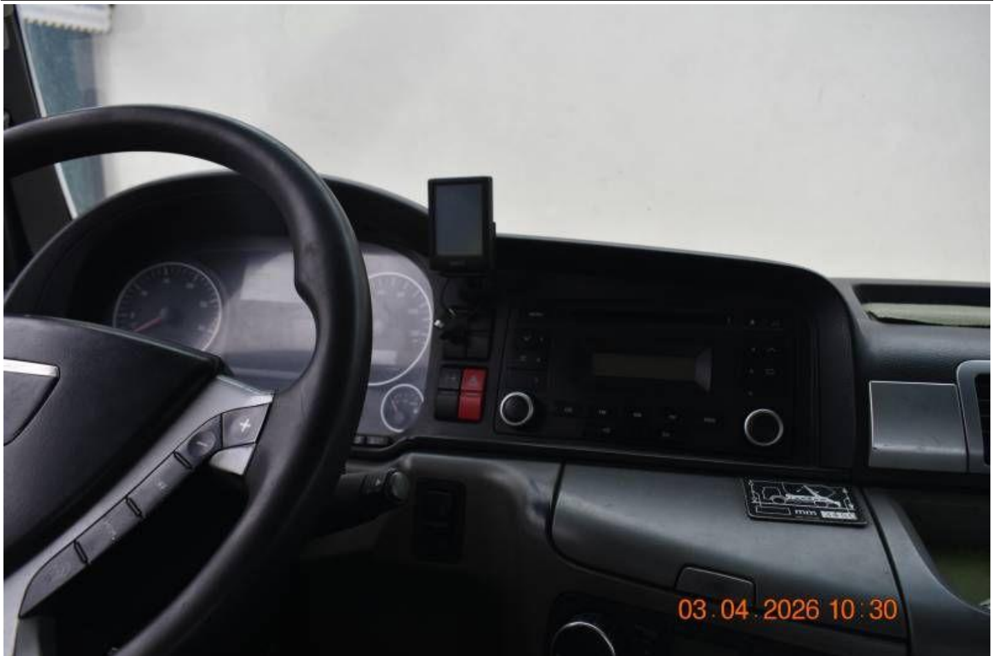
Fot. nr 85