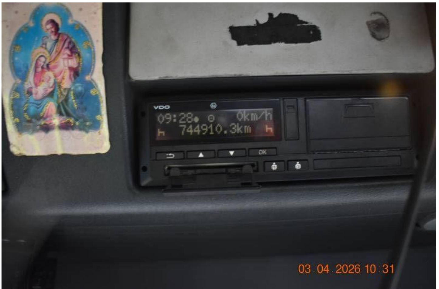
Fot. nr 86