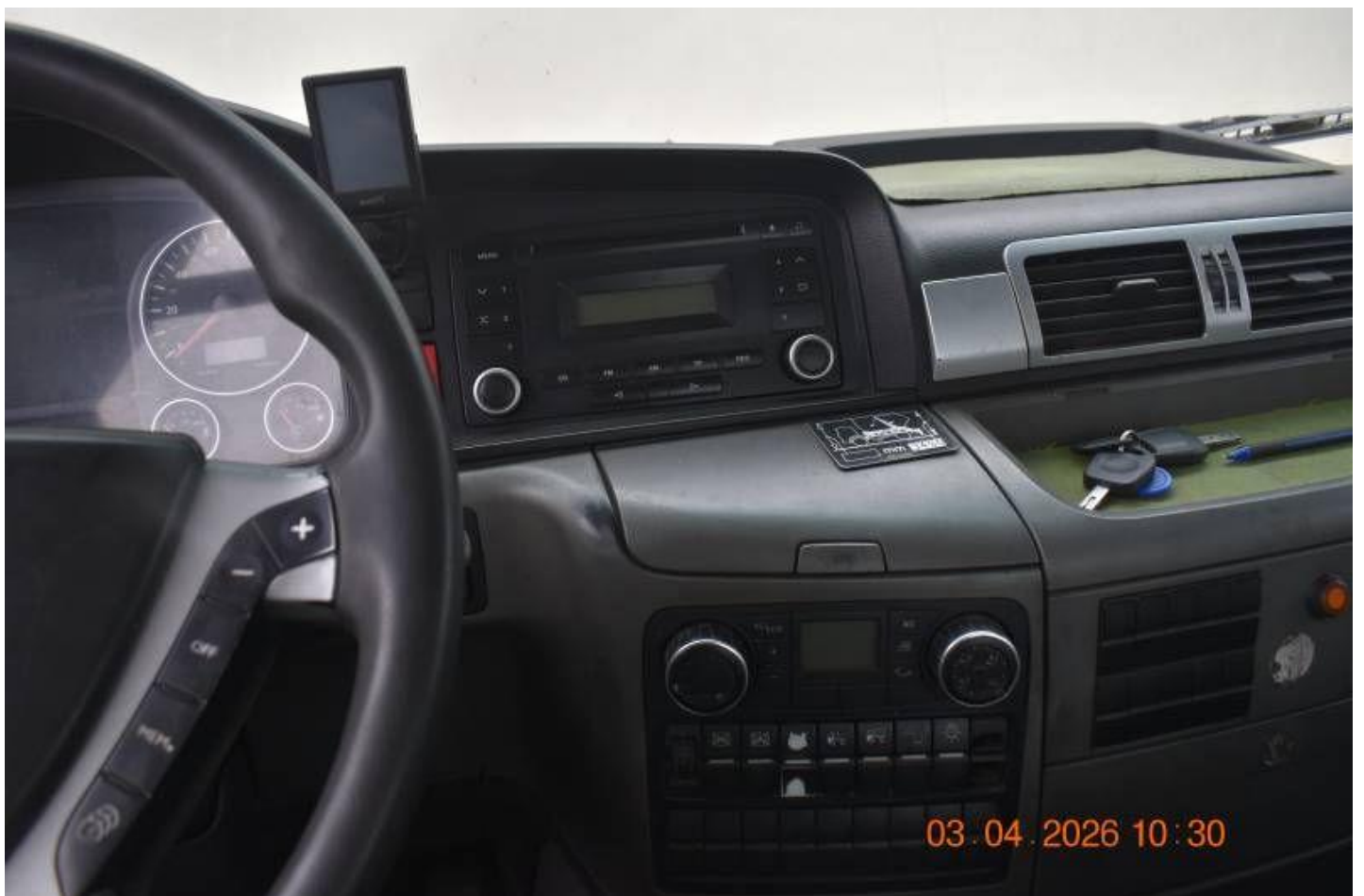
Fot. nr 82