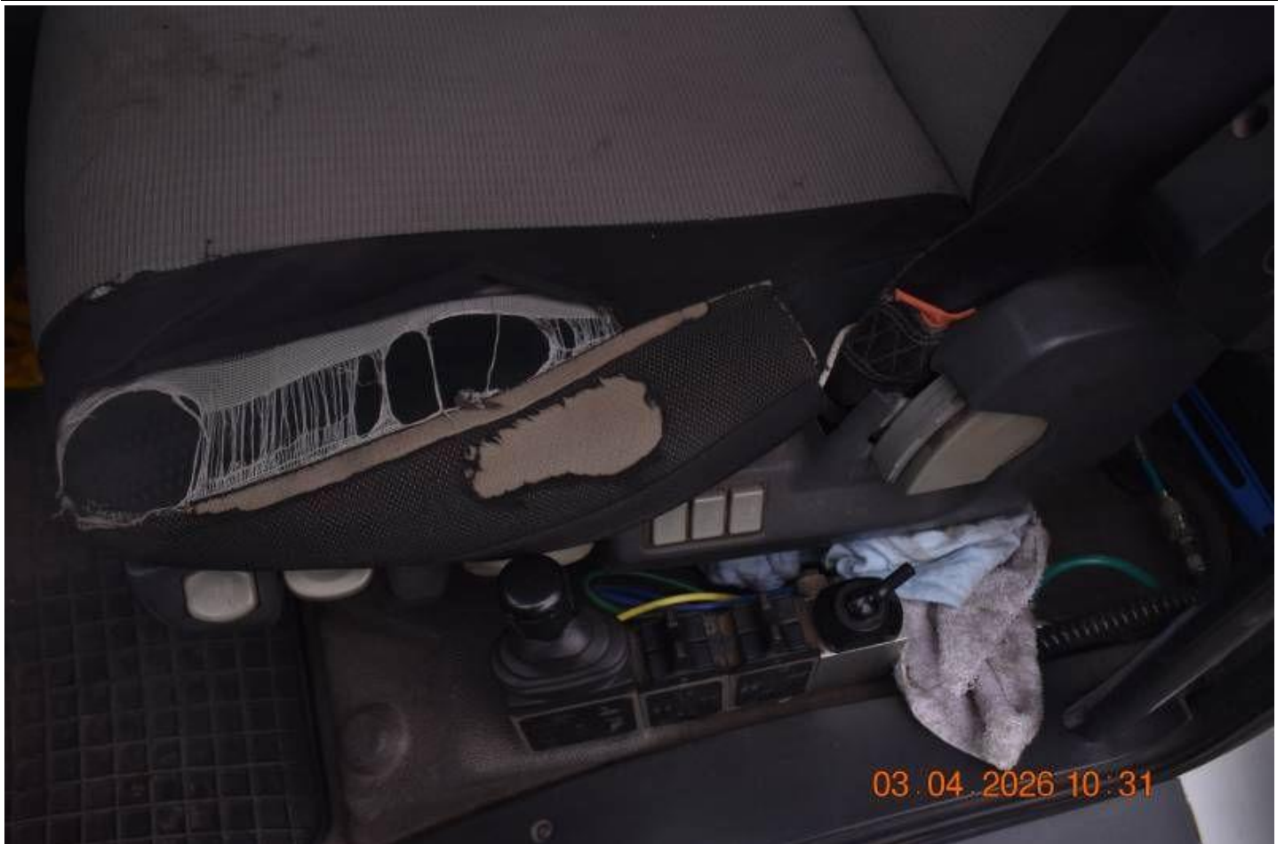
Fot. nr 91