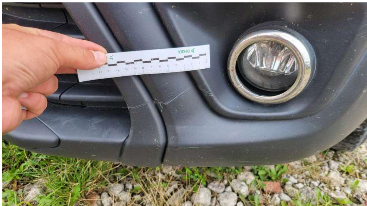
Fot. 32 Zderzak - Rysa/odprysk 1