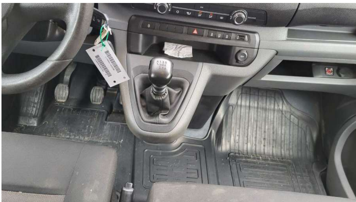
Fot. 20 Tuneł środkowy