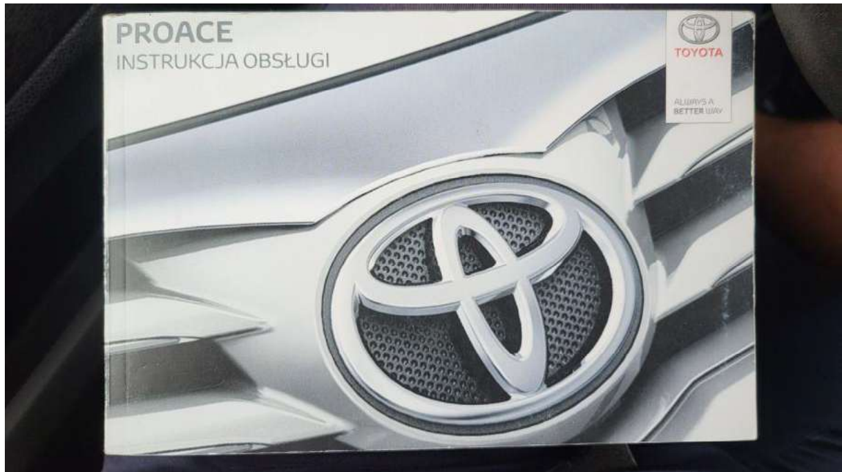
Fot. 31 Instrukcje