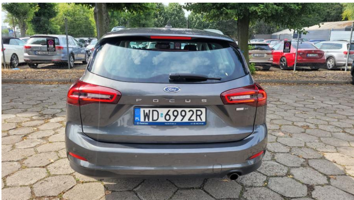
Fot. 8 Tyt