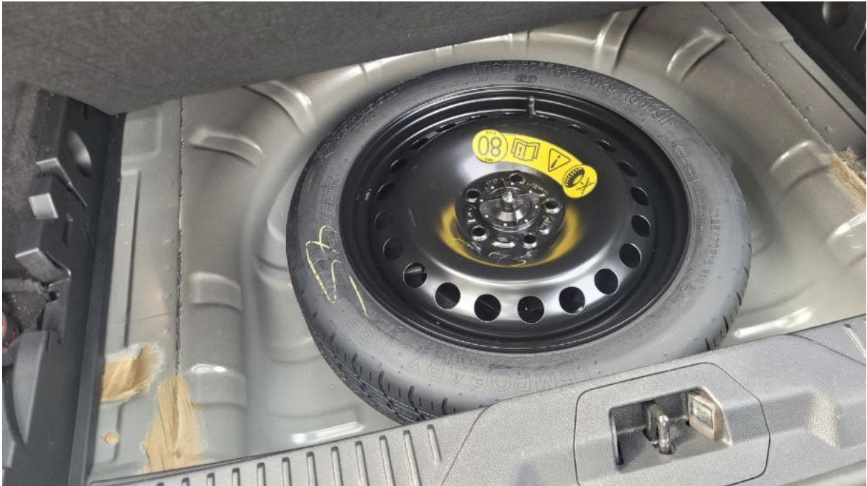
Fot. 25 Koło zapasowe