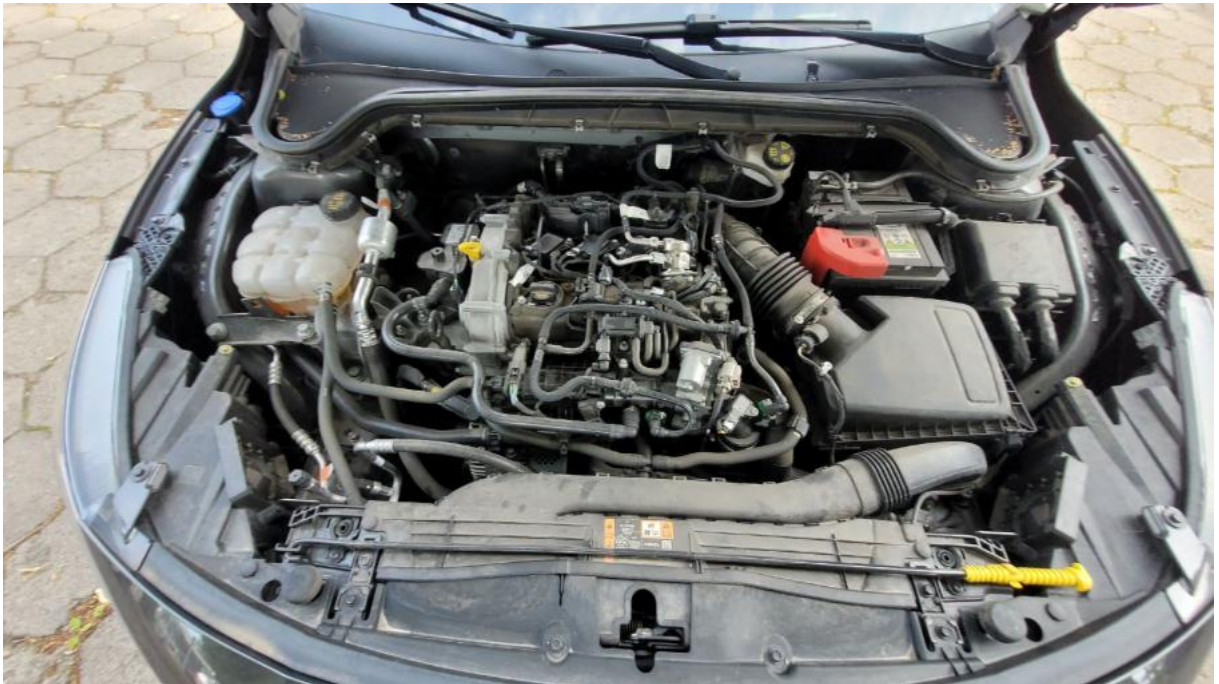
Fot. 23 Komora silnika