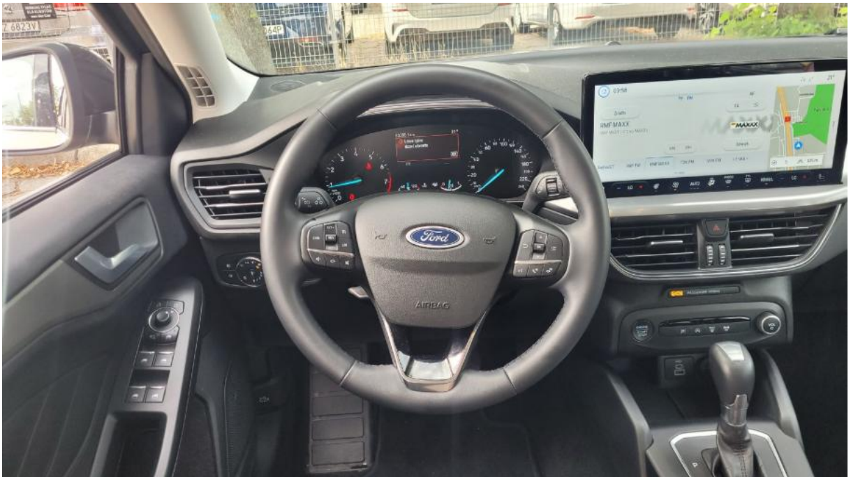
Fot. 21 Kierownica (na wprost)