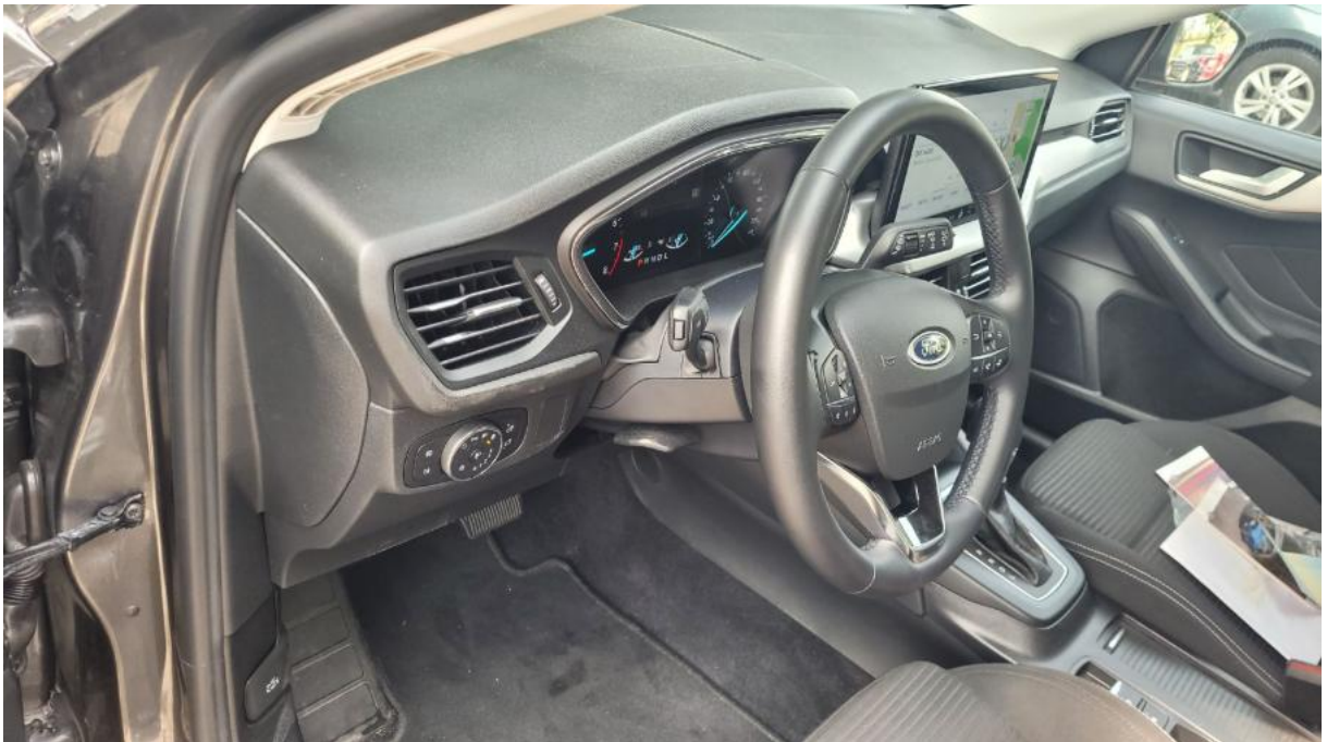
Fot. 22 Kierownica z lewej strony