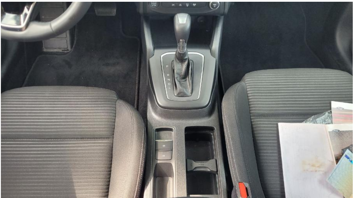
Fot. 20 Tunel środkowy