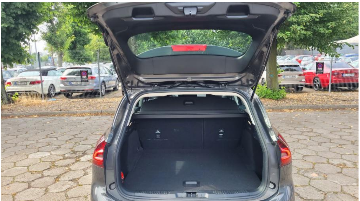
Fot. 24 Bagażnik