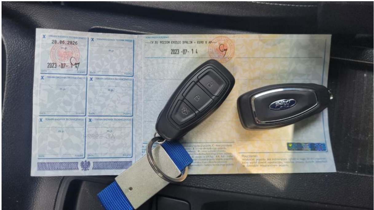
Fot. 29 Dow. Rej. Str.2 i klucze