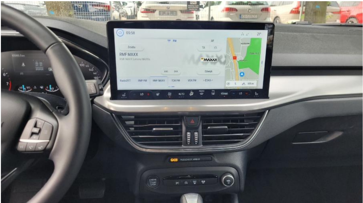
Fot. 19 Konsola środkowa