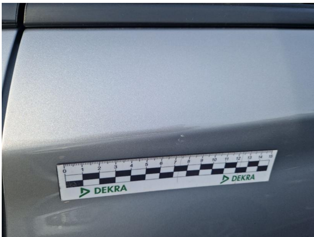
Fot. 67 Drzwi tylne L - Rysa/odprysk 1