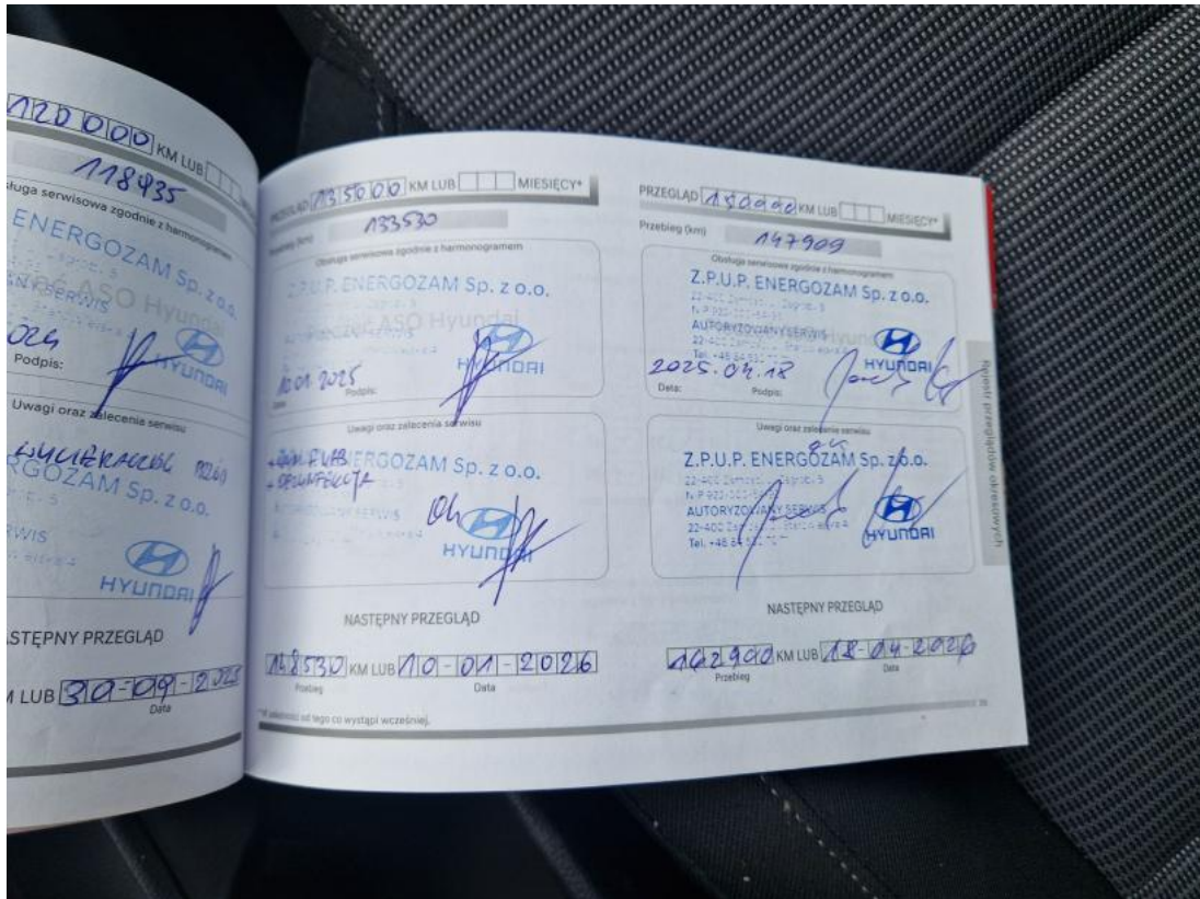
Fot. 35 Książka serwisowa – ostatni przegląd