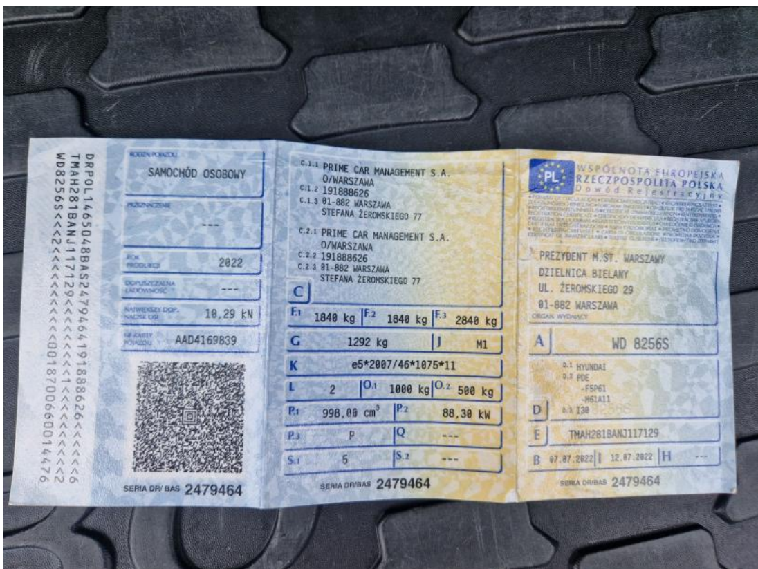
Fot. 32 Dowód rej. Str. 1