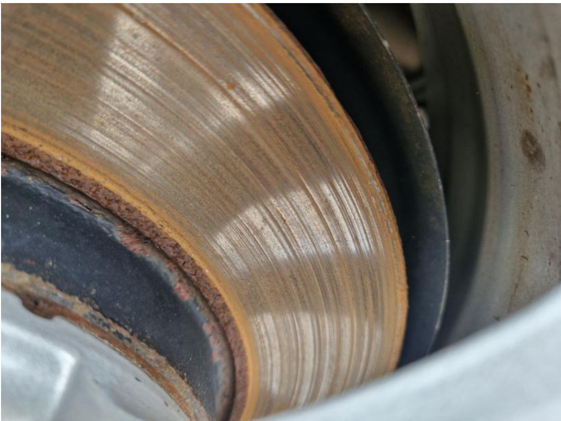
Fot. 30 Tarcza hamulcowa tylna prawa