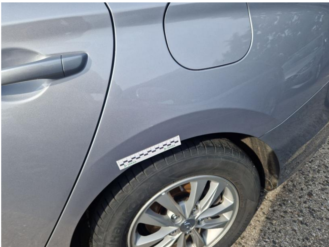
Fot. 62 Błotnik tylny L / Ściana boczna L - zdjęcie poglądowe 1