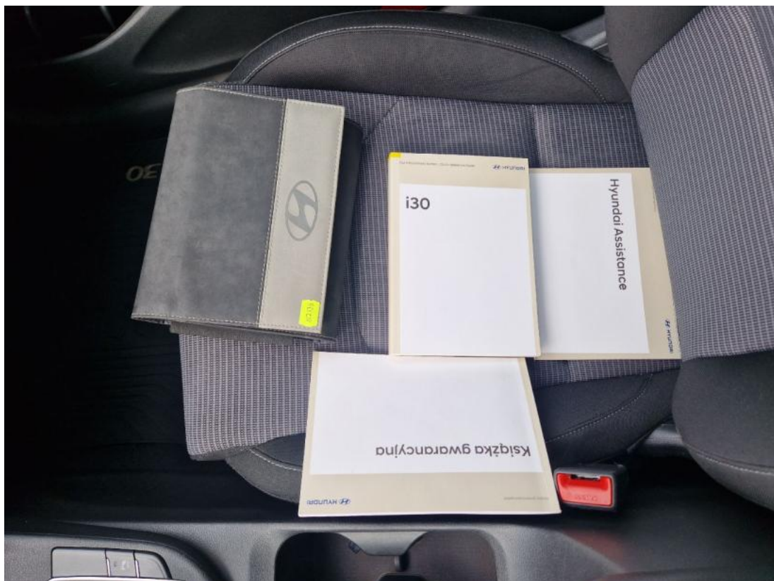
Fot. 36 Instrukcje