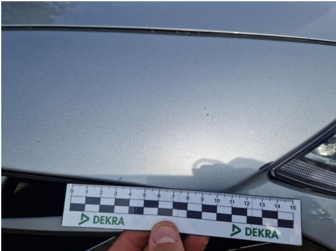
Fot. 43 Zderzak() - Rysa/odprysk 3