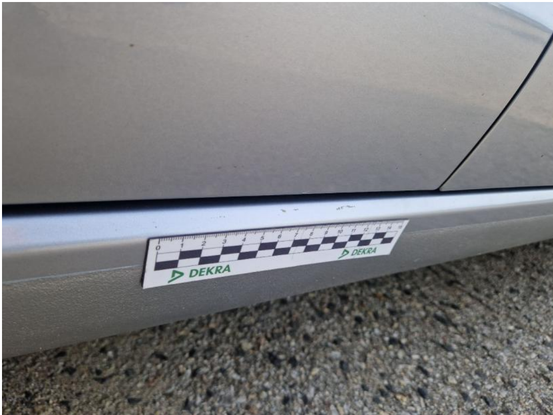
Fot. 49 Próg P - Rysa/odprysk 1