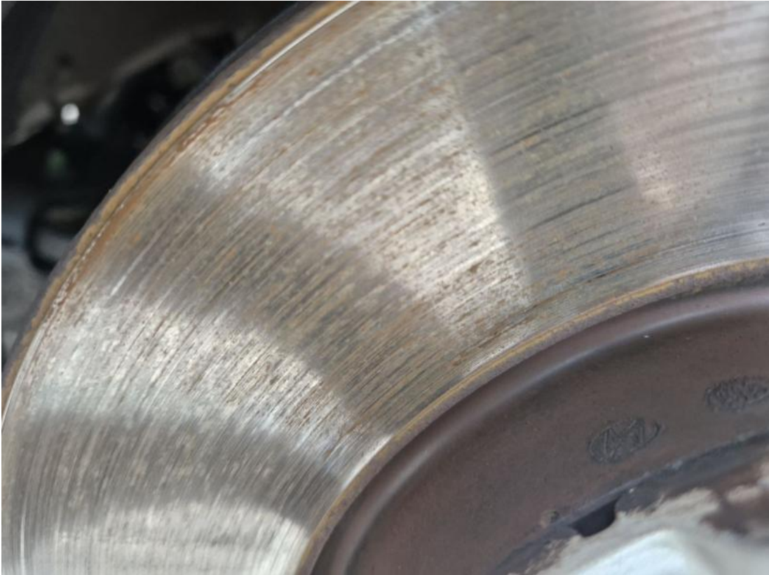
Fot. 29 Tarcza hamulcowa przednia prawa