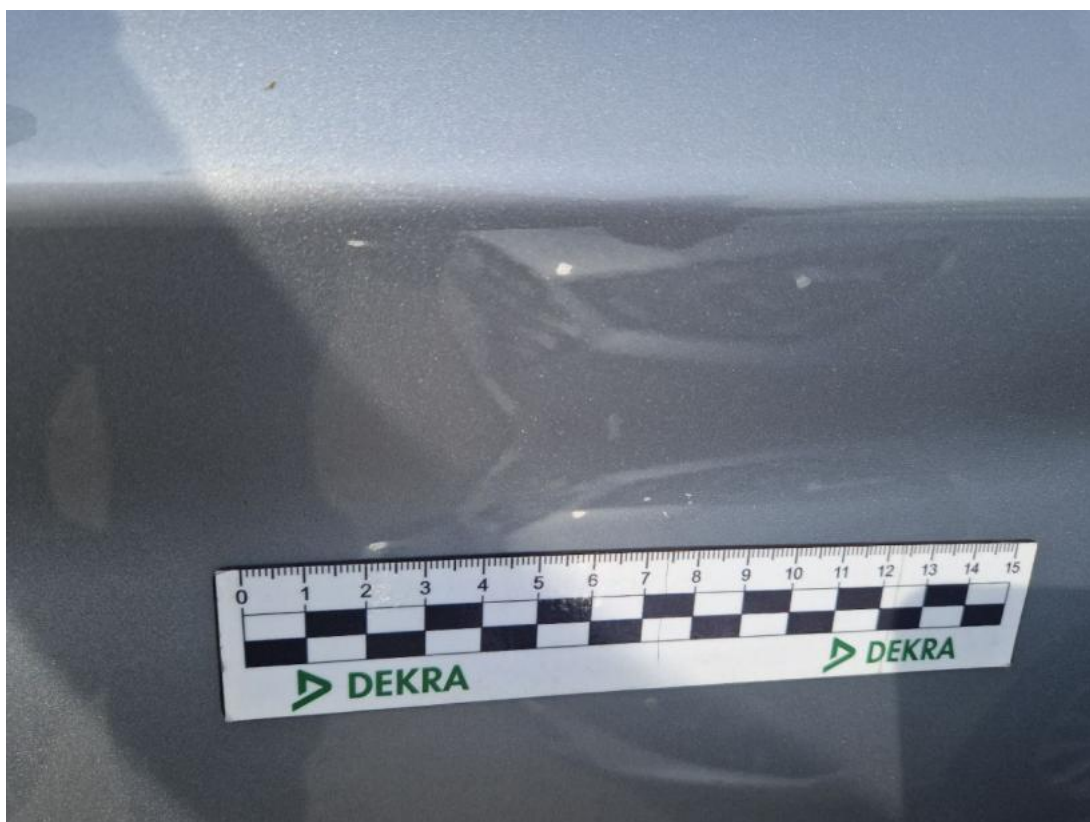
Fot. 65 Drzwi przed L - Rysa/odprysk 1