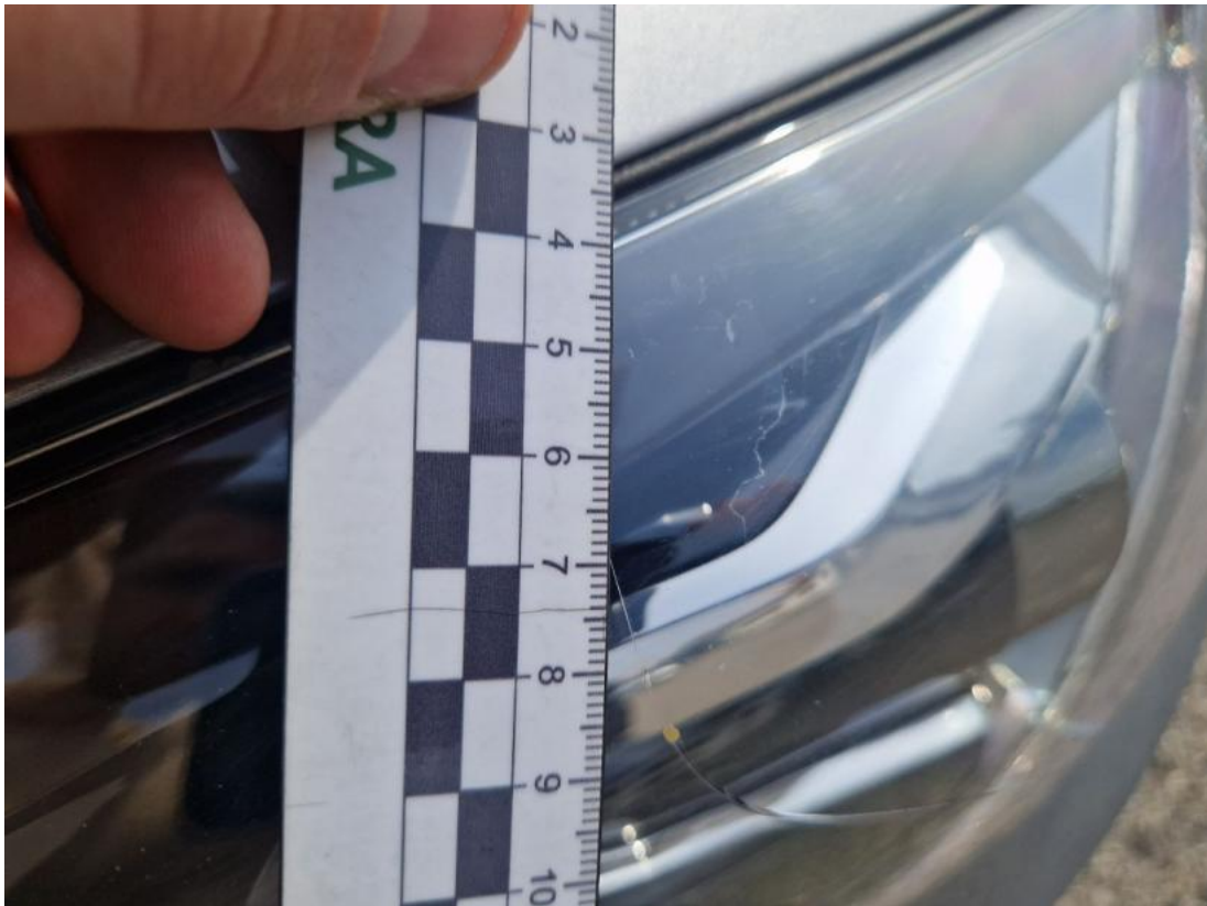
Fot. 45 Reflektor P - Inne 1