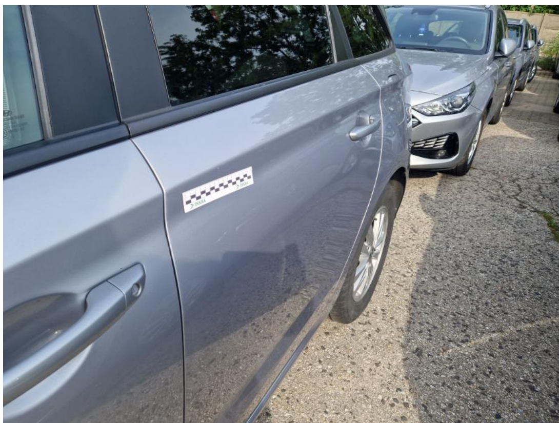
Fot. 66 Drzwi tylne L - zdjęcie poglądowe 1