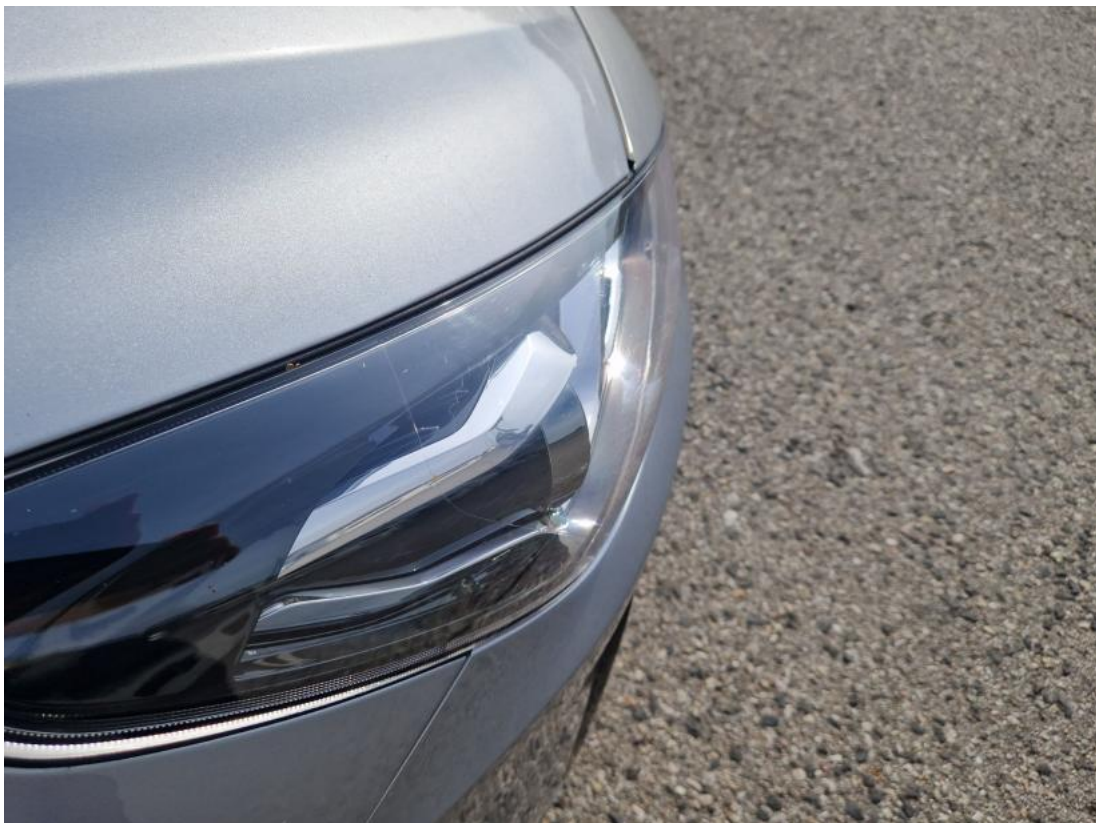
Fot. 44 Reflektor P - zdjęcie poglądowe 1