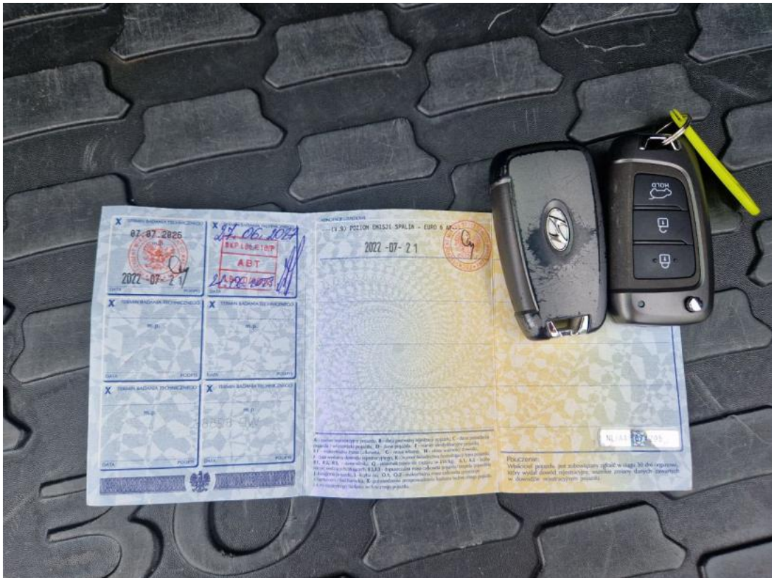
Fot. 33 Dow. Rej. Str.2 i klucze