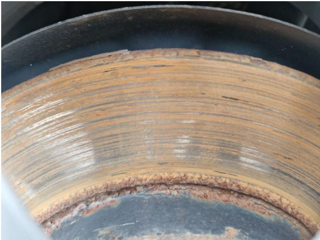
Fot. 31 Tarcza hamulcowa tylna lewa