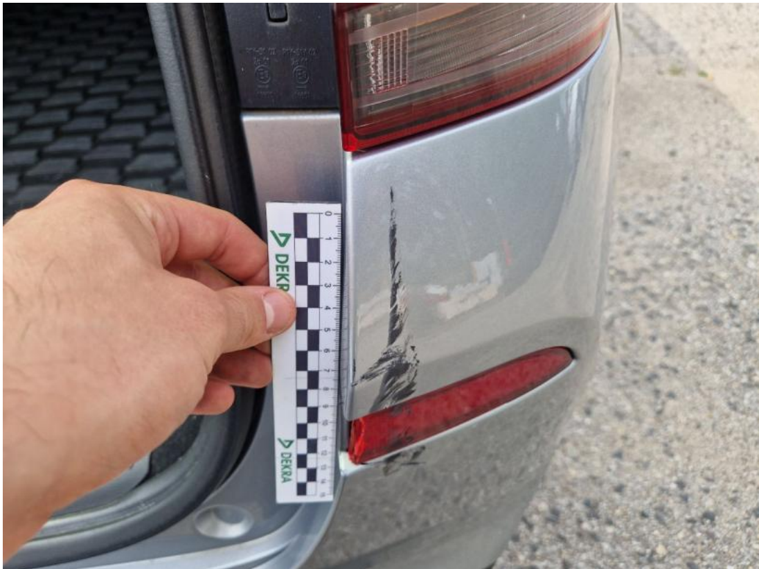
Fot. 61 Zderzak tylny() - Wgniecenie/odkształcenie 3