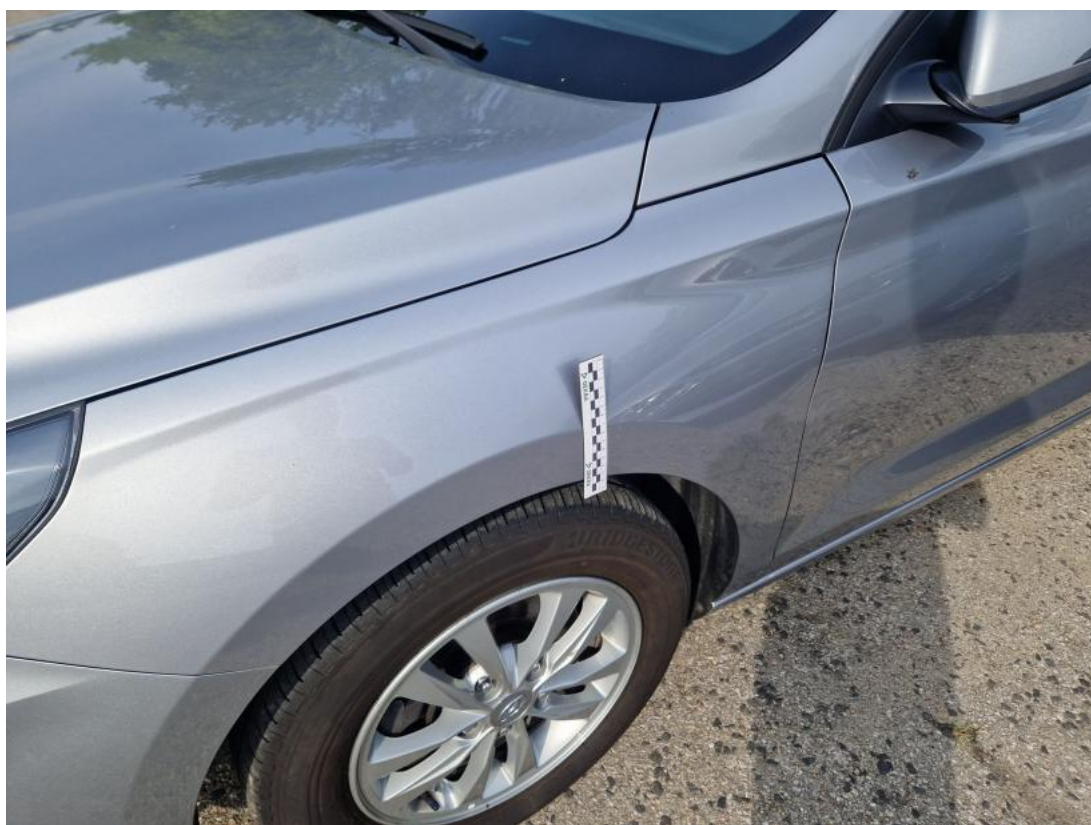
Fot. 68 Błotnik przedni L - zdjęcie poglądowe 1