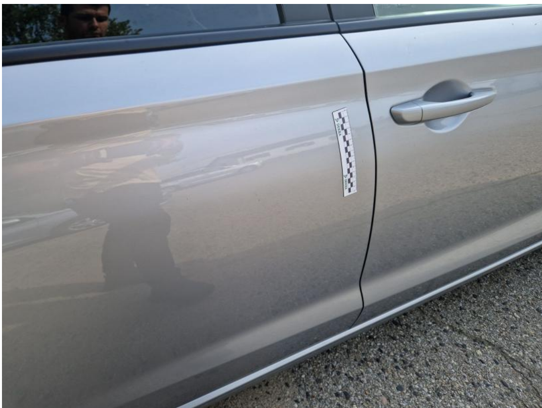
Fot. 46 Drzwi tylne P - zdjęcie poglądowe 1