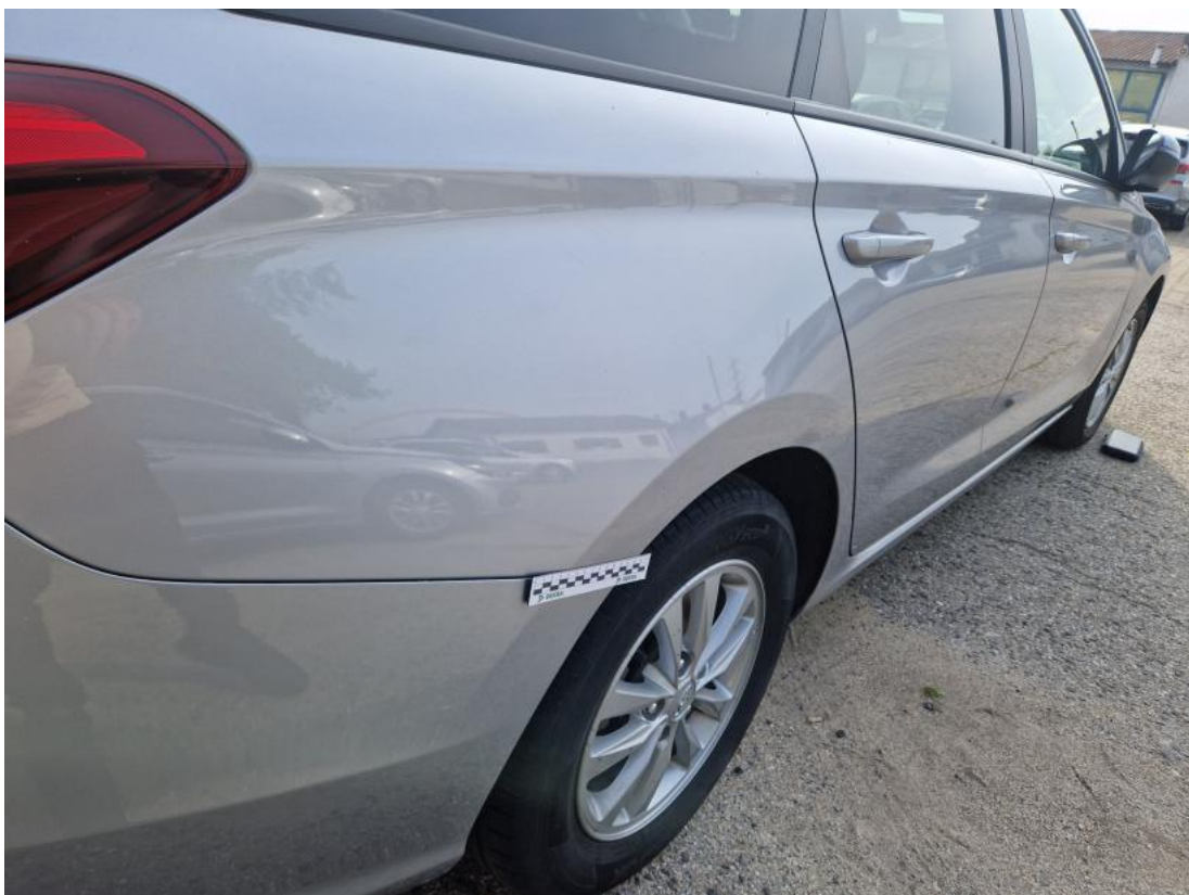
Fot. 50 Błotnik tylny P / Ściana boczna P - zdjęcie poglądowe 1