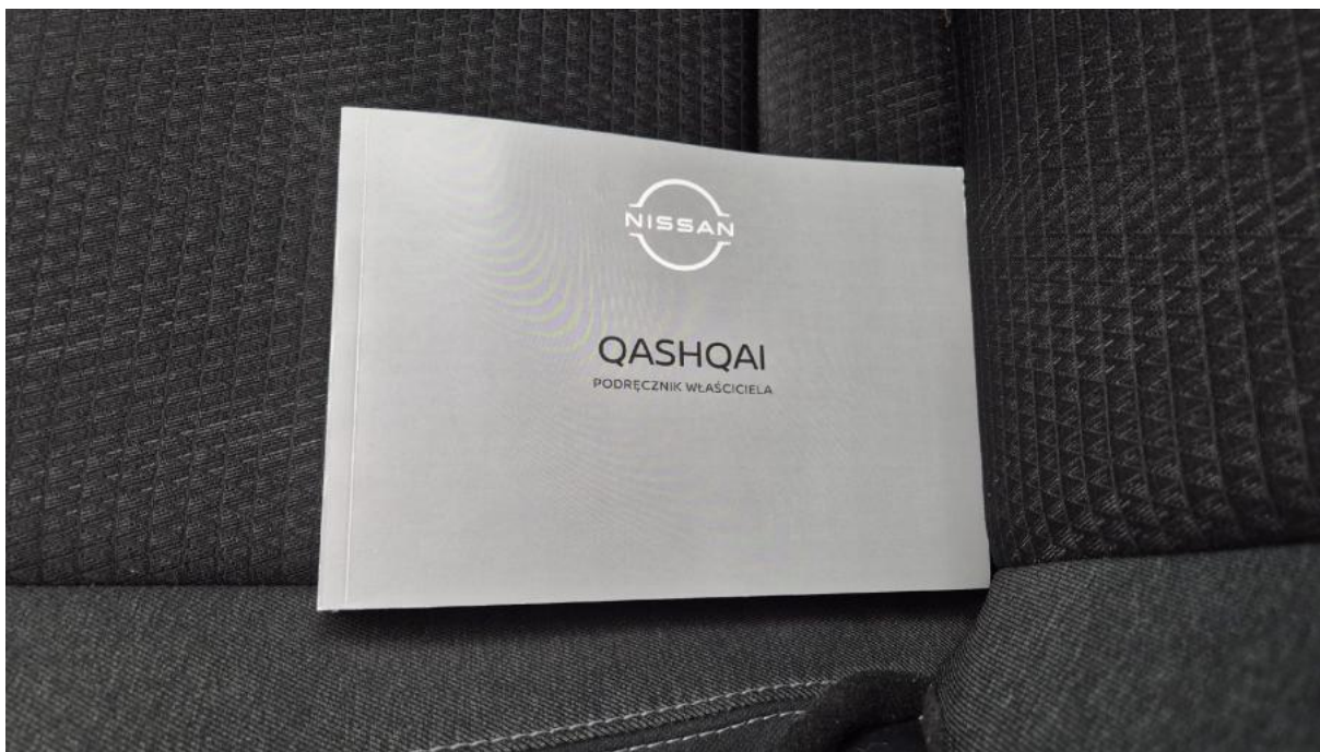
Fot. 34 Instrukcje