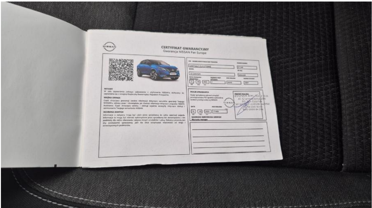
Fot. 32 Książka serwisowa – dane