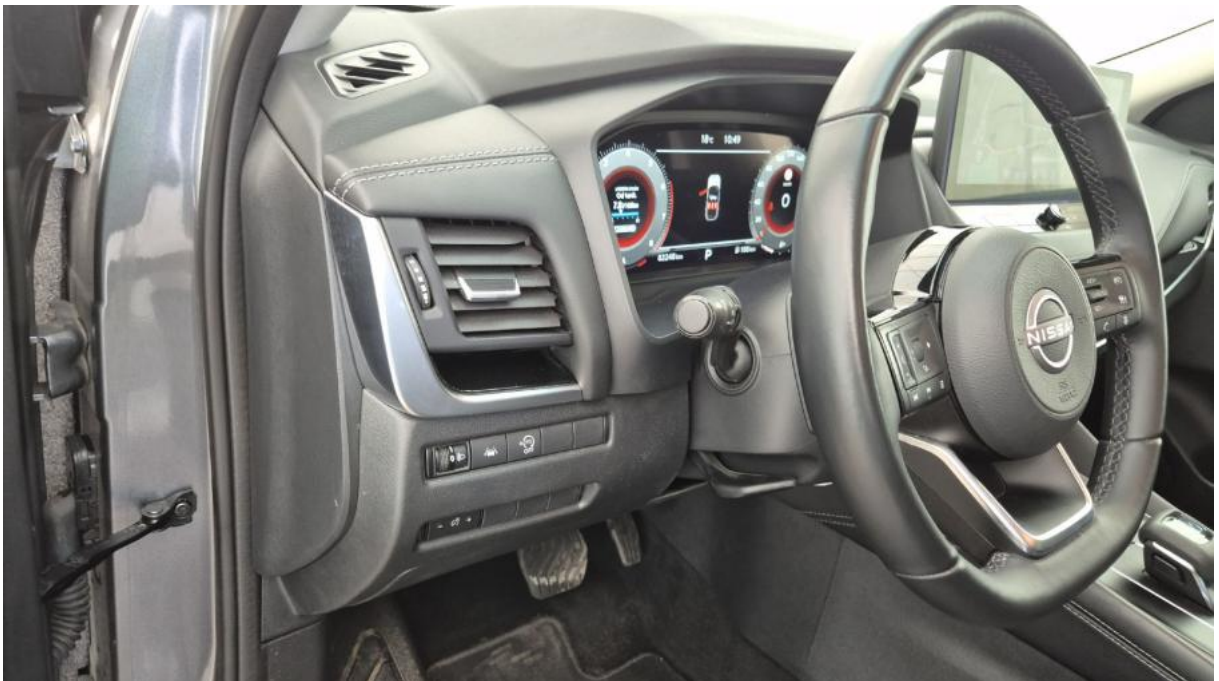
Fot. 22 Kierownica z lewej strony