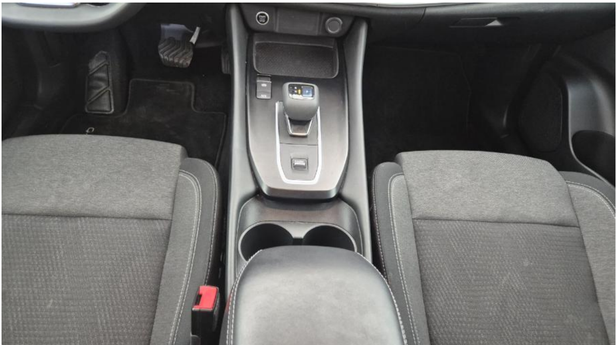
Fot. 20 Tunel środkowy