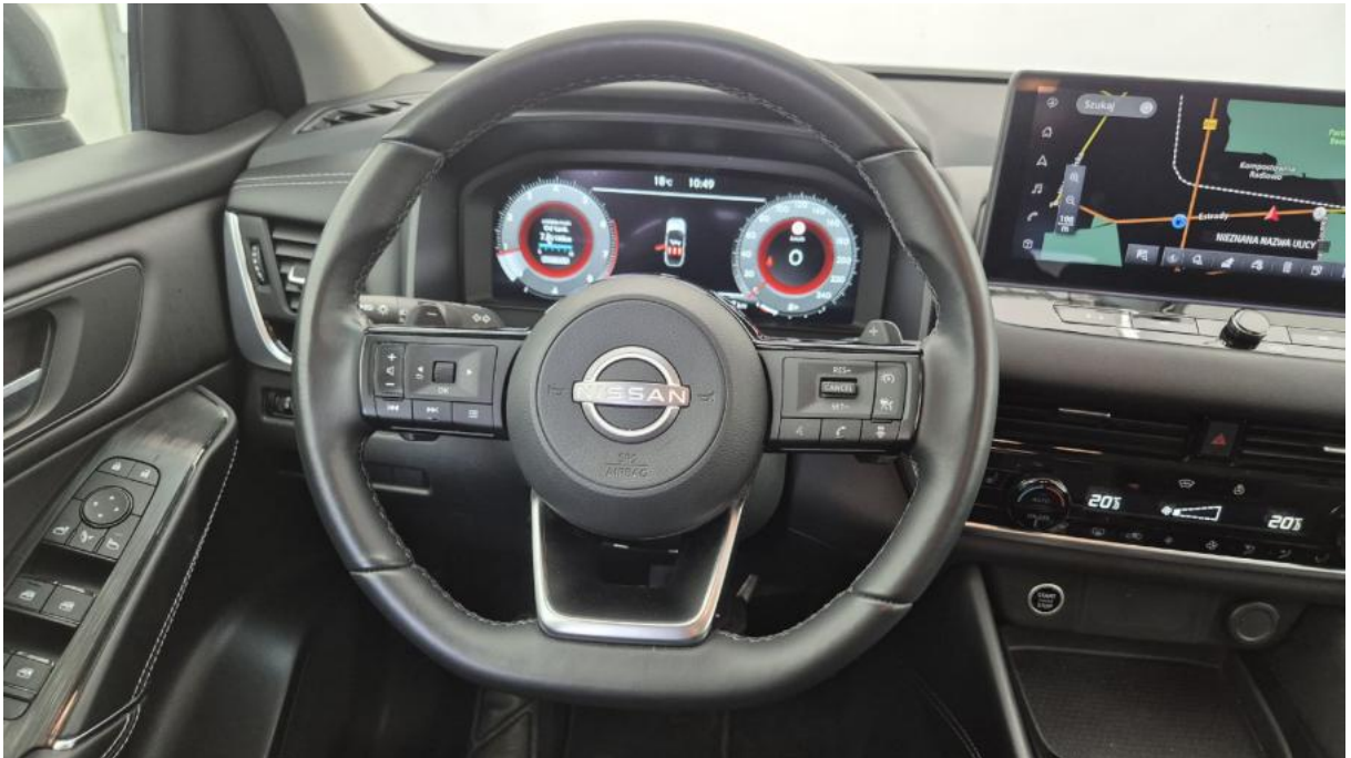
Fot. 21 Kierownica (na wprost)