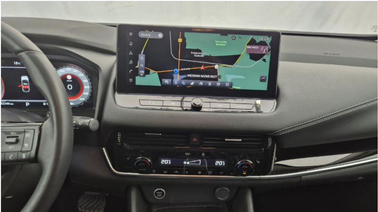
Fot. 19 Konsola środkowa