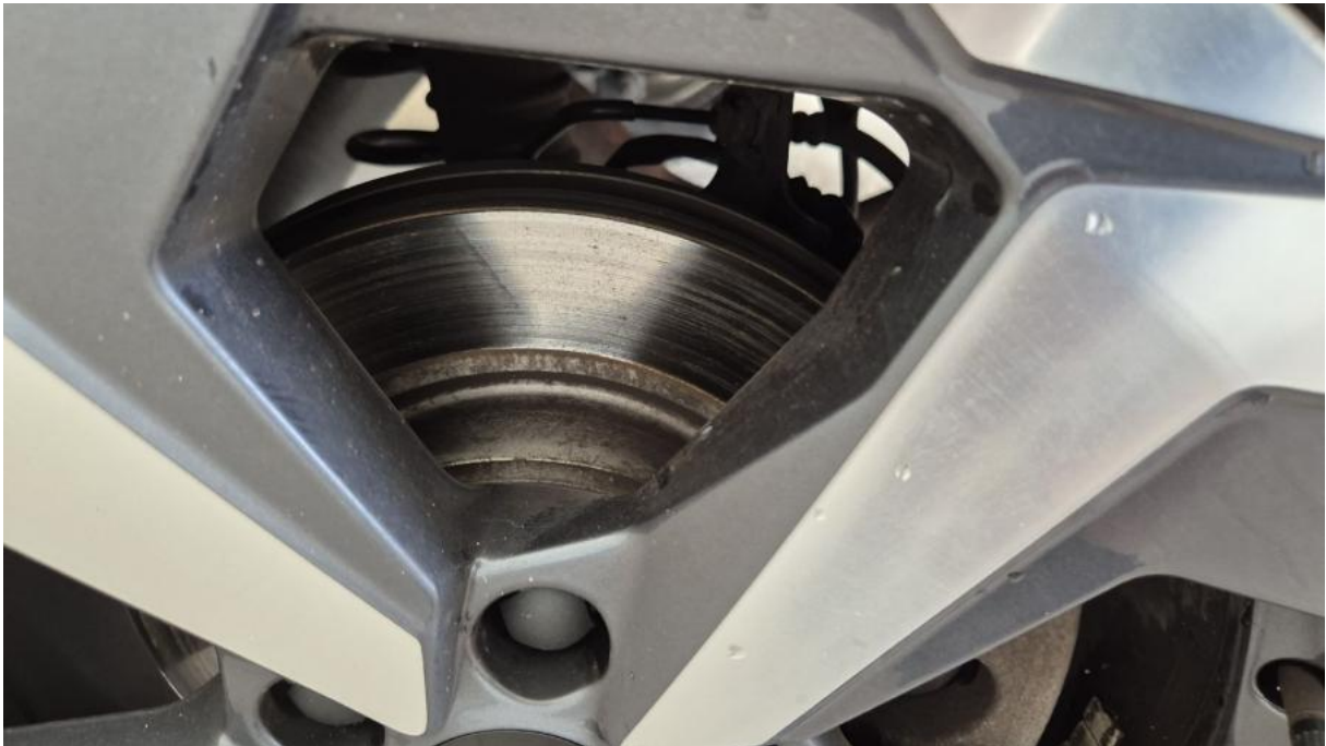
Fot. 31 Tarcza hamulcowa tylna lewa