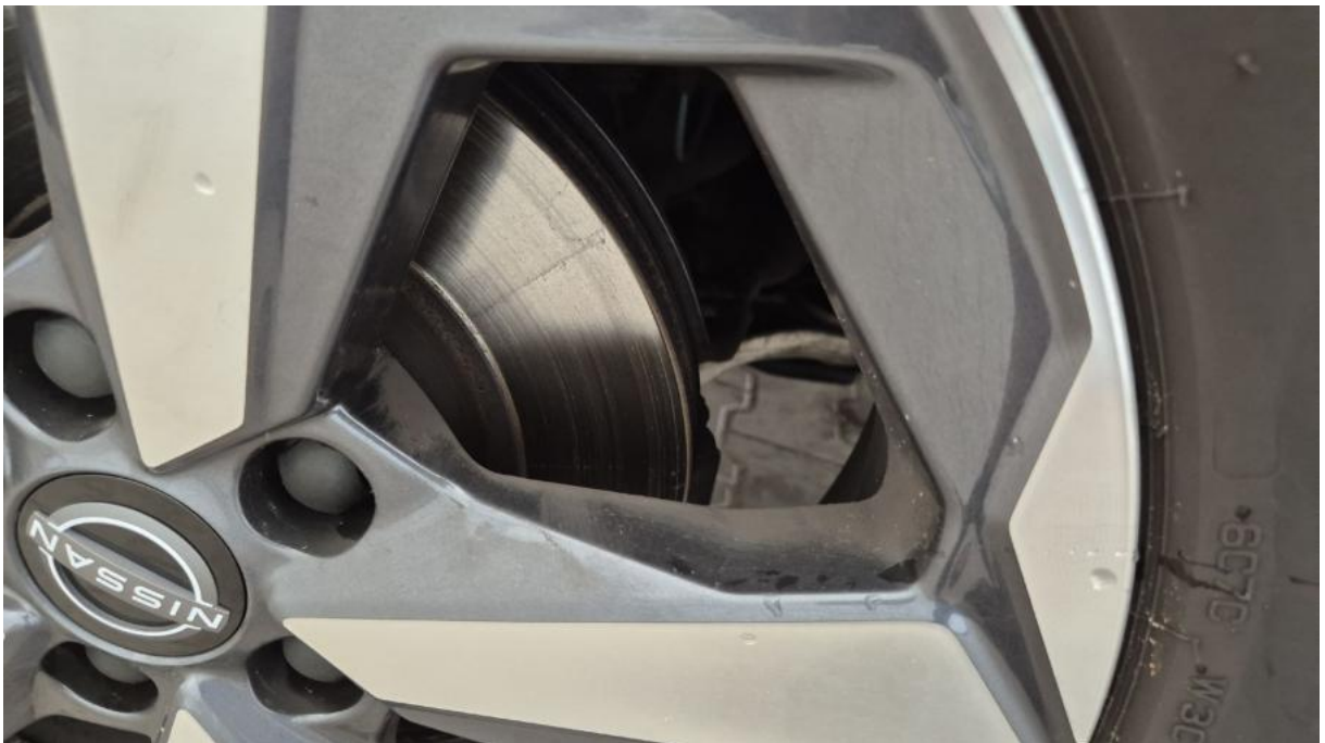
Fot. 28 Tarcza hamulcowa przednia lewa