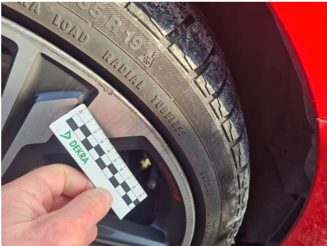
Fot. 49 Felga aluminiowa przednia P() - Rysa/odprysk 3