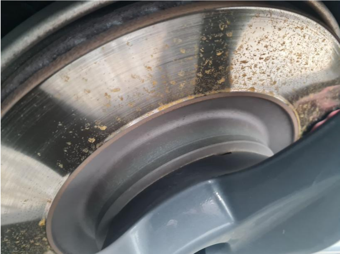
Fot. 31 Tarcza hamulcowa tylna prawa