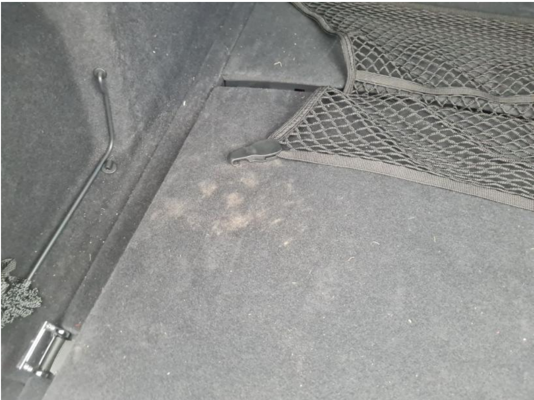
Fot. 37 Zdjęcie do protokołu