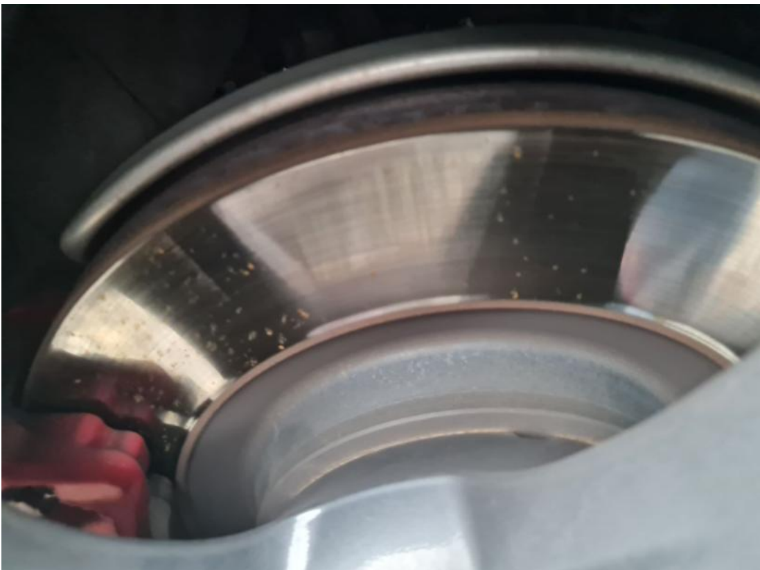
Fot. 32 Tarcza hamulcowa tylna lewa