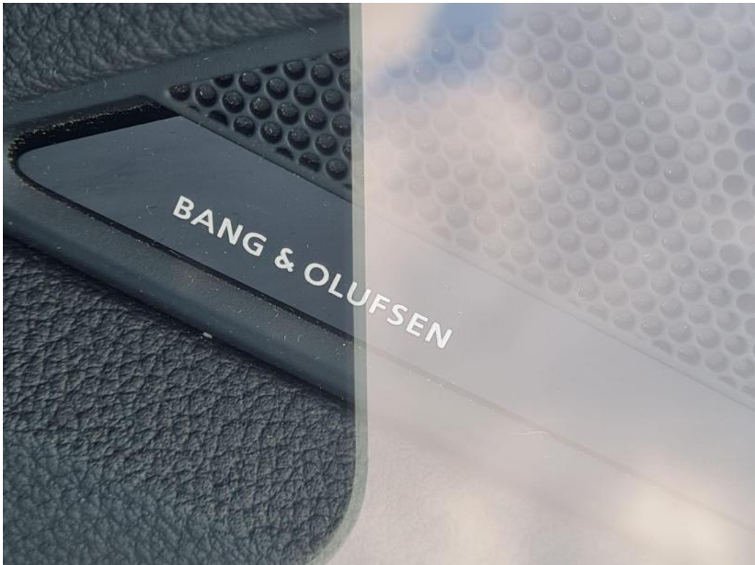
Fot. 41 Zdjęcie do protokołu