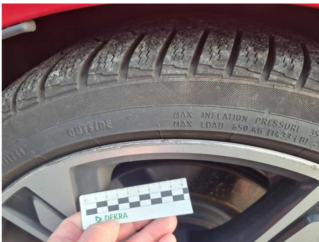
Fot. 56 Felga aluminiowa tylna P - Rysa/odprysk 2