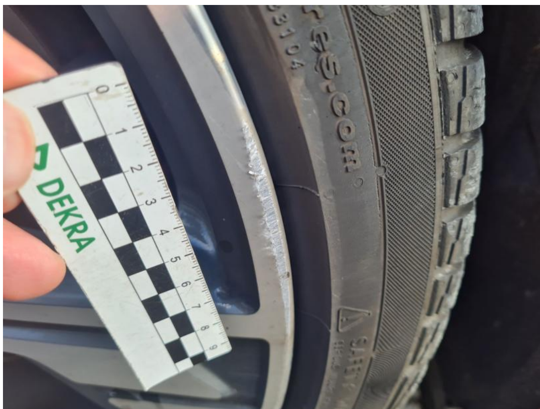
Fot. 57 Felga aluminiowa tylna P() - Rysa/odprysk 3