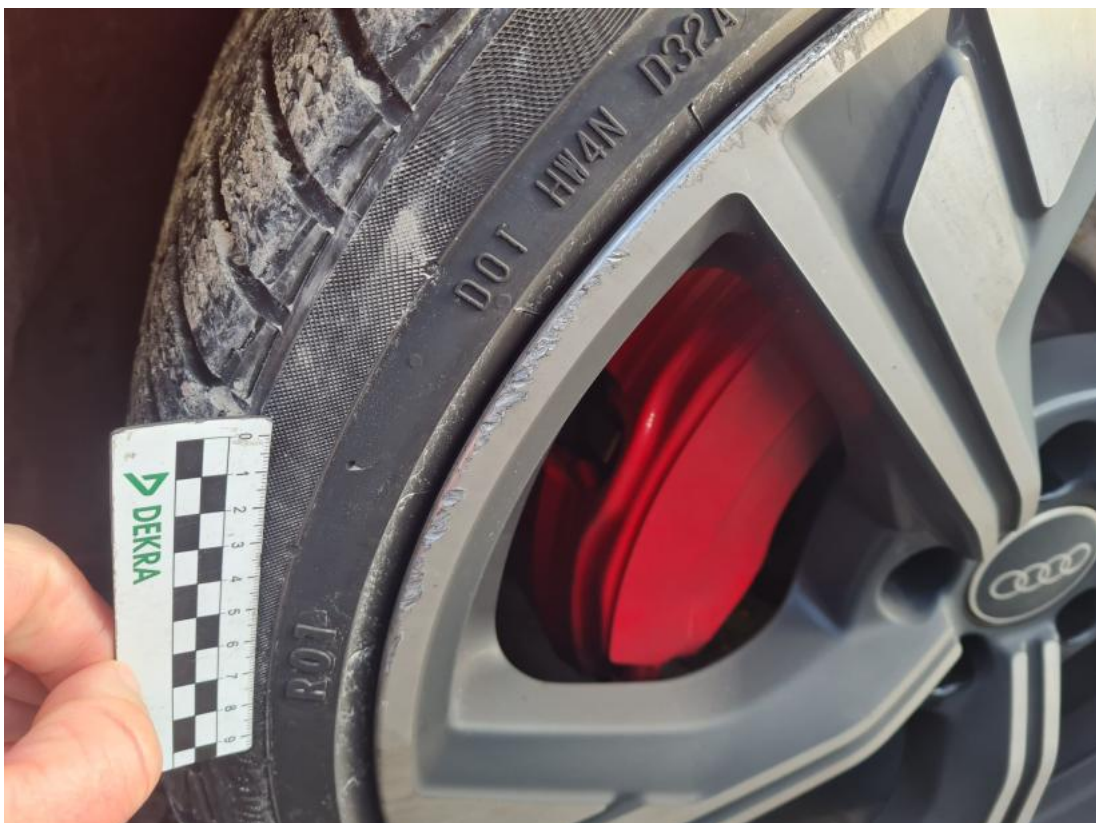
Fot. 48 Felga aluminiowa przednia P - Rysa/odprysk 2