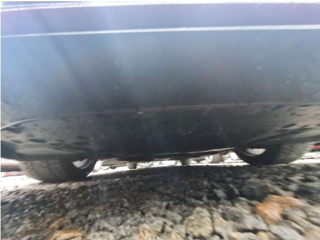
Fot. 27 Spód pojazdu przód