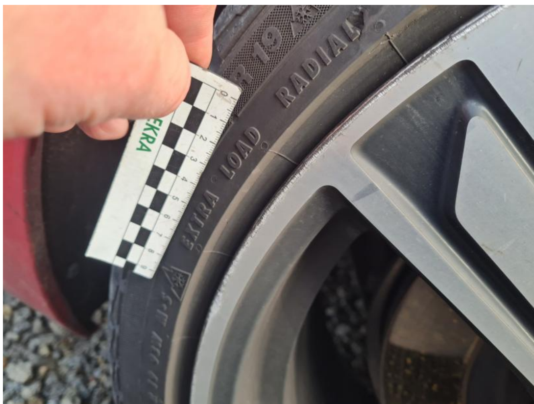
Fot. 55 Felga aluminiowa tylna P - Rysa/odprysk 1