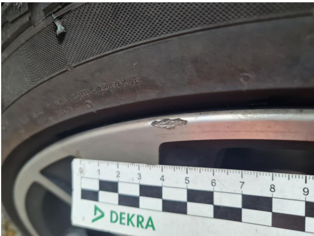
Fot. 60 Felga aluminiowa tylna L - Rysa/odprysk 1