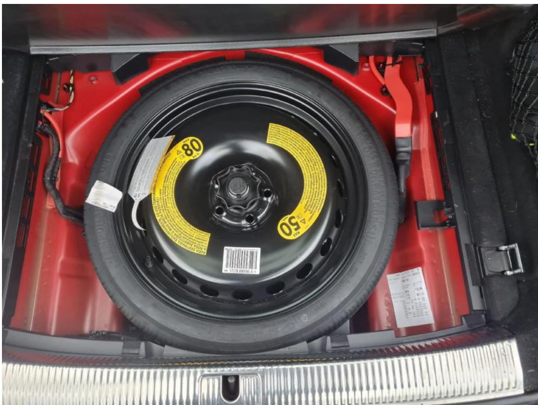
Fot. 26 Kołozapasowe