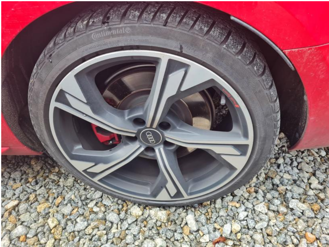
Fot. 59 Felga aluminiowa tylna L - zdjęcie poglądowe 1