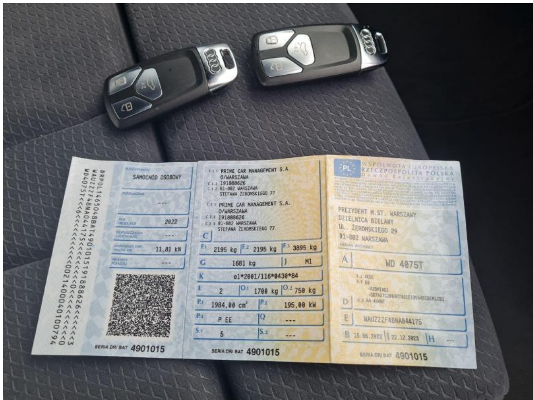
Fot. 33 Dowód rej. Str. 1