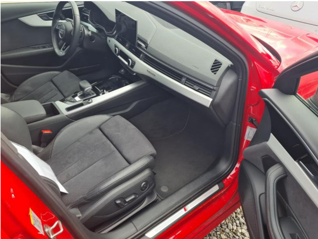
Fot. 39 Zdjęcie do protokołu