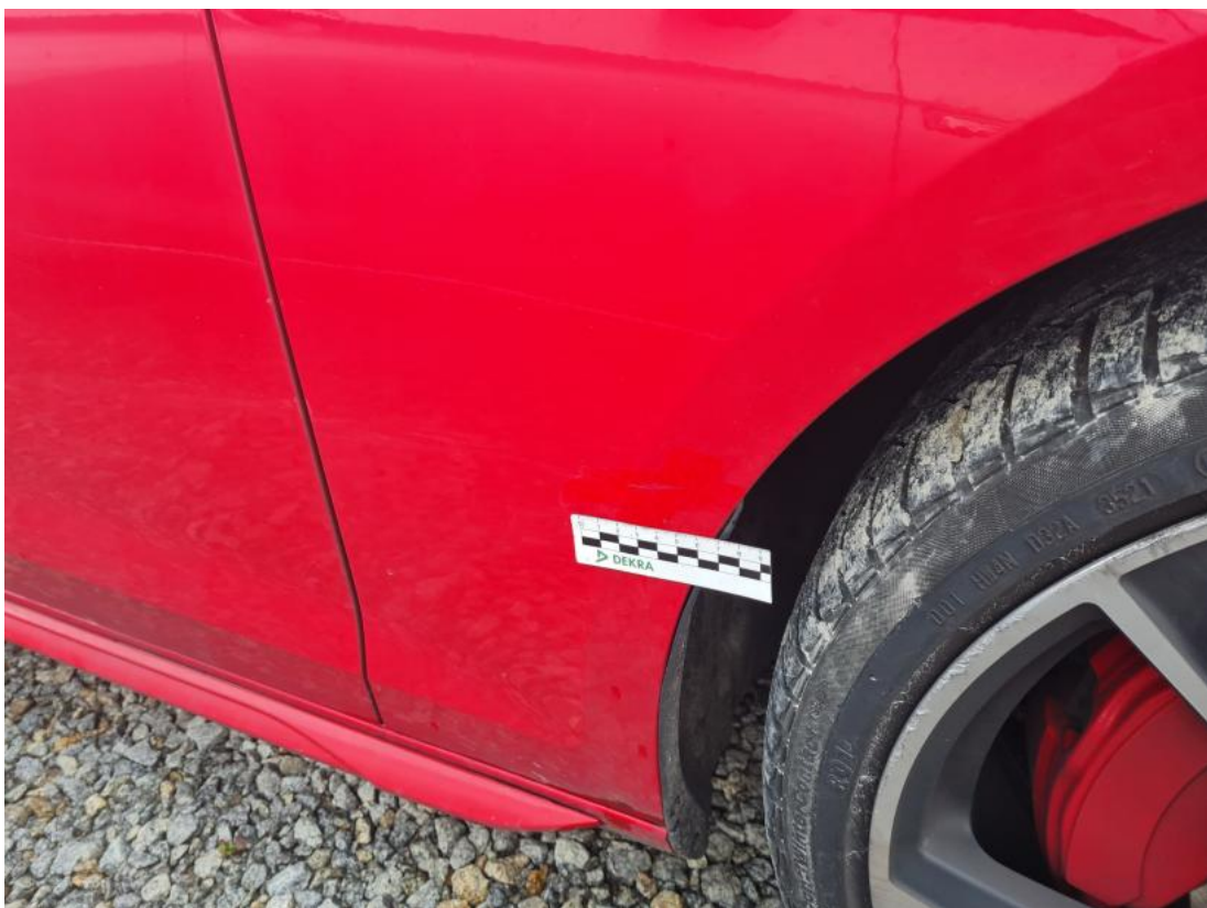
Fot. 42 Błotnik przedni P - zdjęcie poglądowe 1