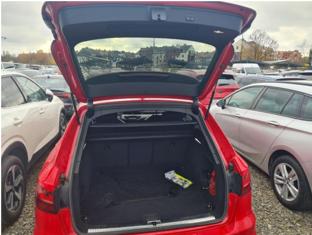
Fot. 25 Bagażnik