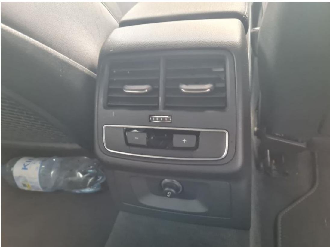
Fot. 38 Zdjęcie do protokołu