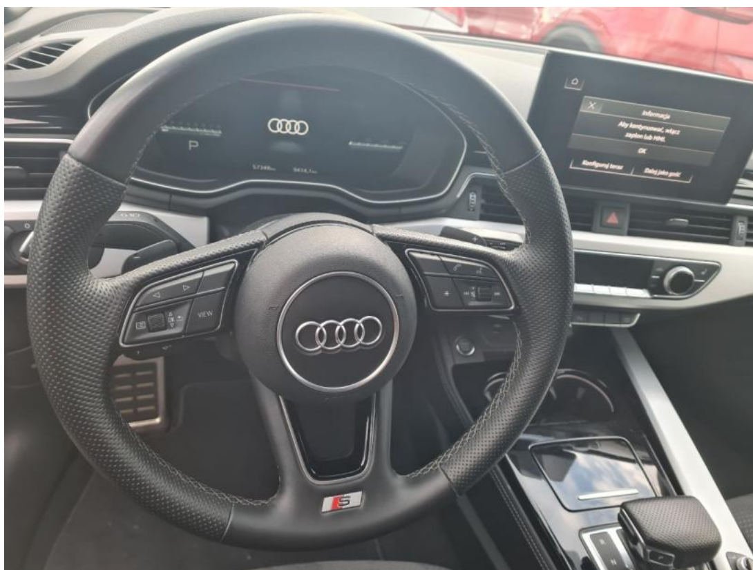
Fot. 22 Kierownica (na wprost)