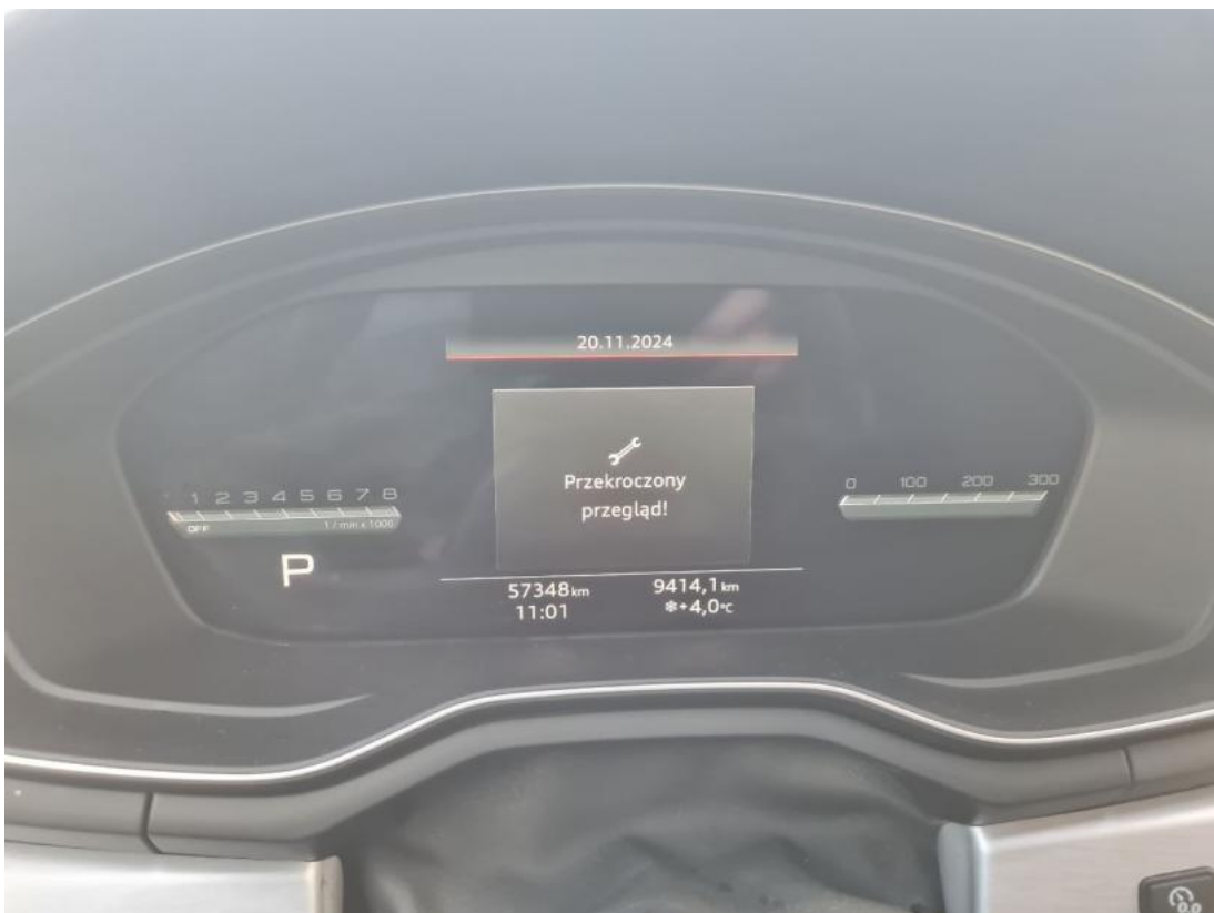
Fot. 40 Zdjęcie do protokołu