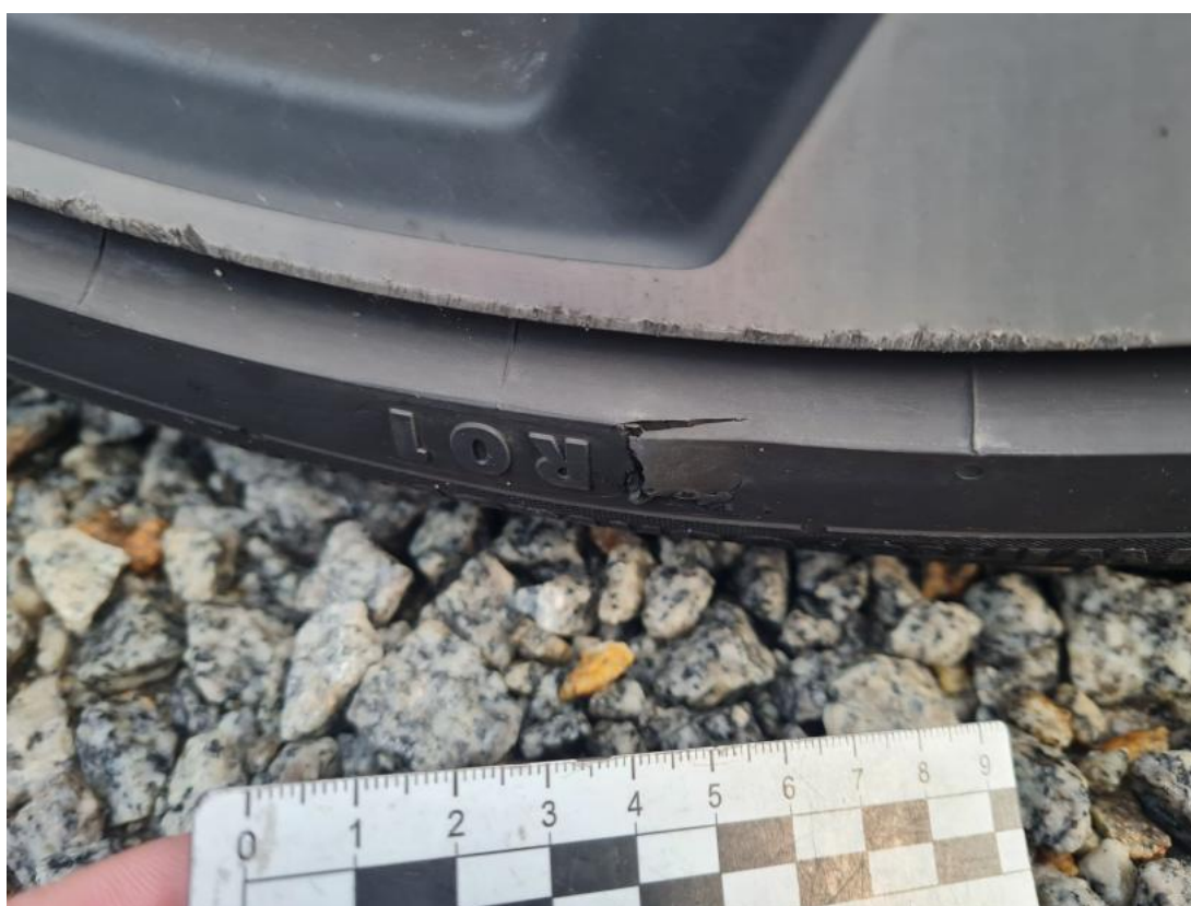
Fot. 58 Opona tylna P - Pęknięcie/rozerwanie 1