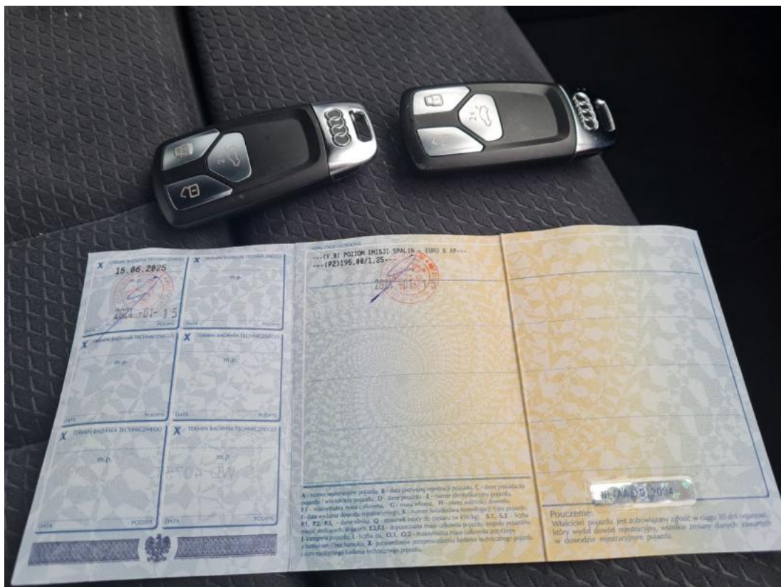
Fot. 34 Dow. Rej. Str.2 i klucze