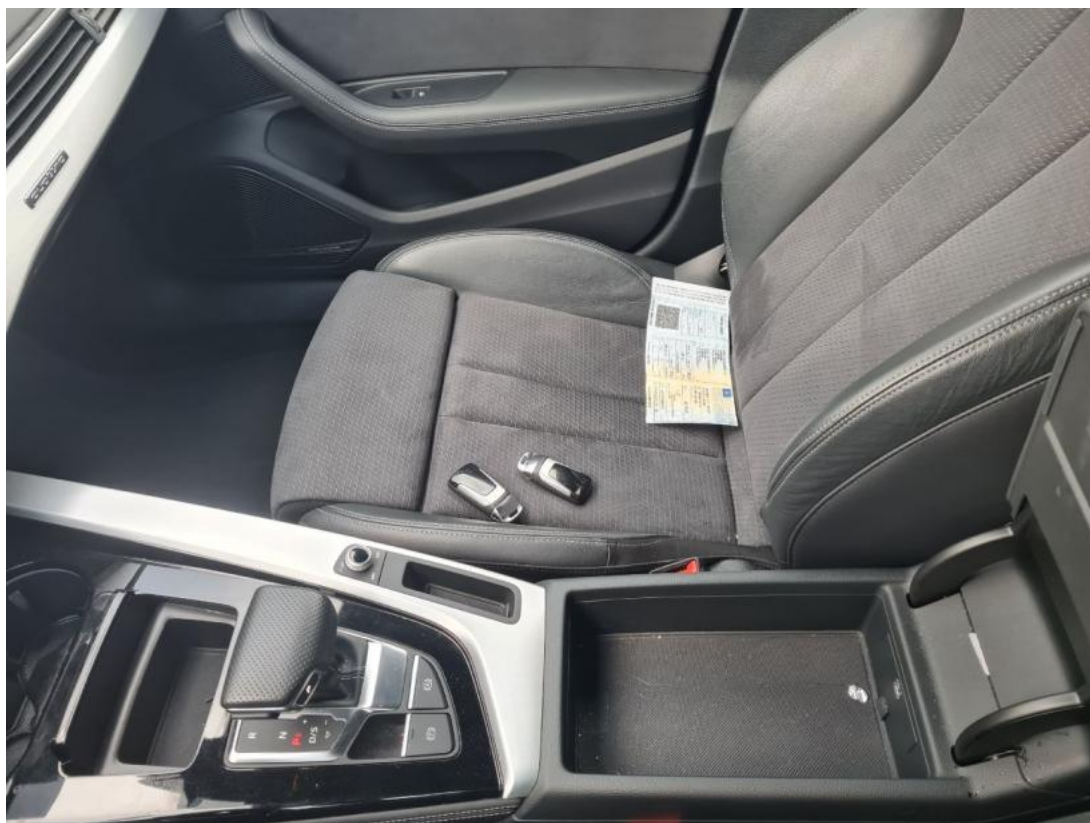
Fot. 21 Tunel środkowy