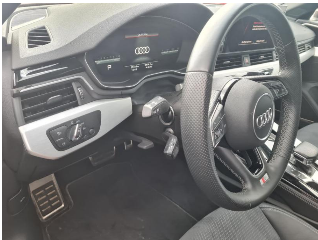
Fot. 23 Kierownica z lewej strony