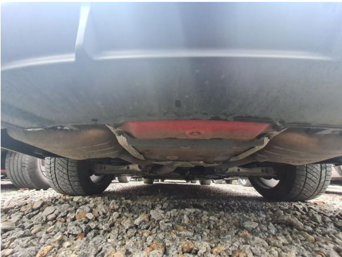
Fot. 28 Spód pojazdu tył