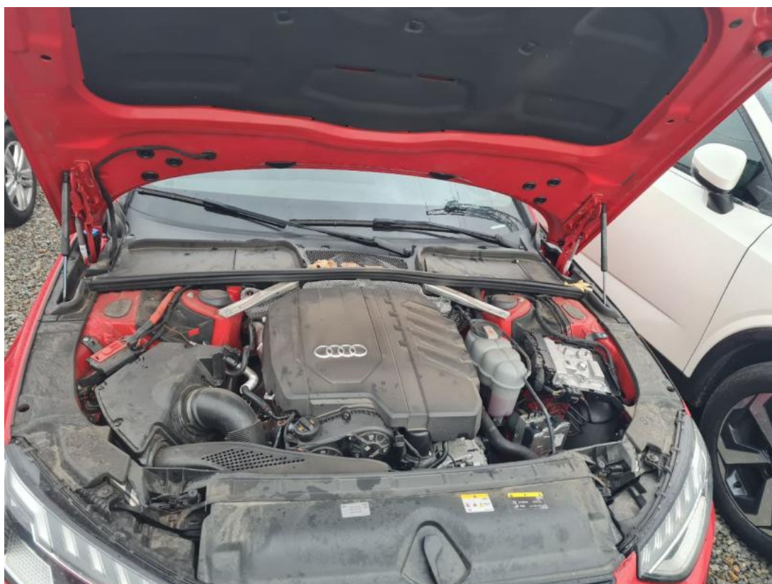
Fot. 24 Komora silnika