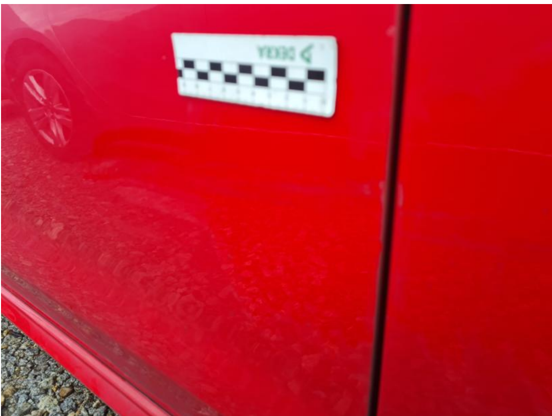
Fot. 52 Drzwi przednie P - Rysa/odprysk 1