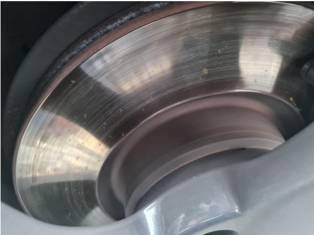
Fot. 29 Tarcza hamulcowa przednia lewa