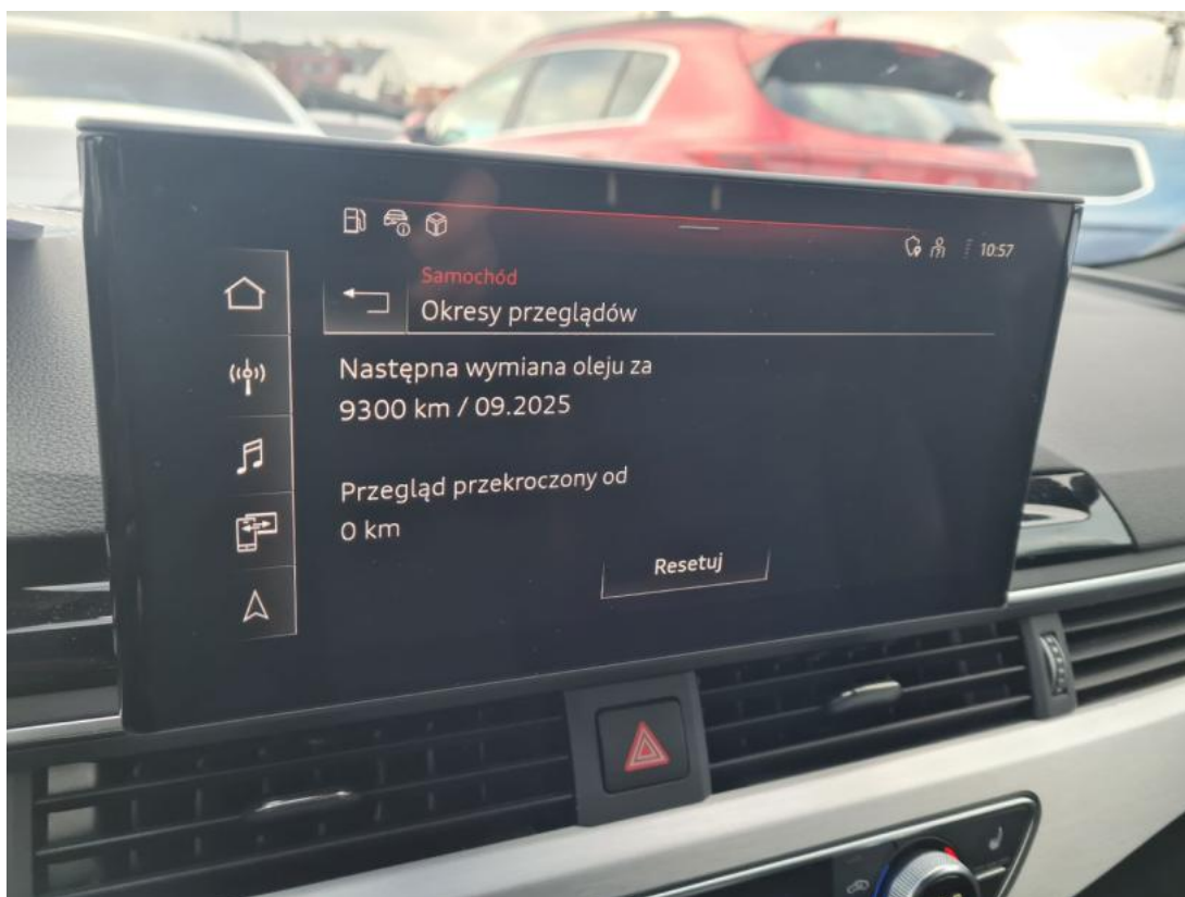
Fot. 16 Zestaw wskaźników - serwis