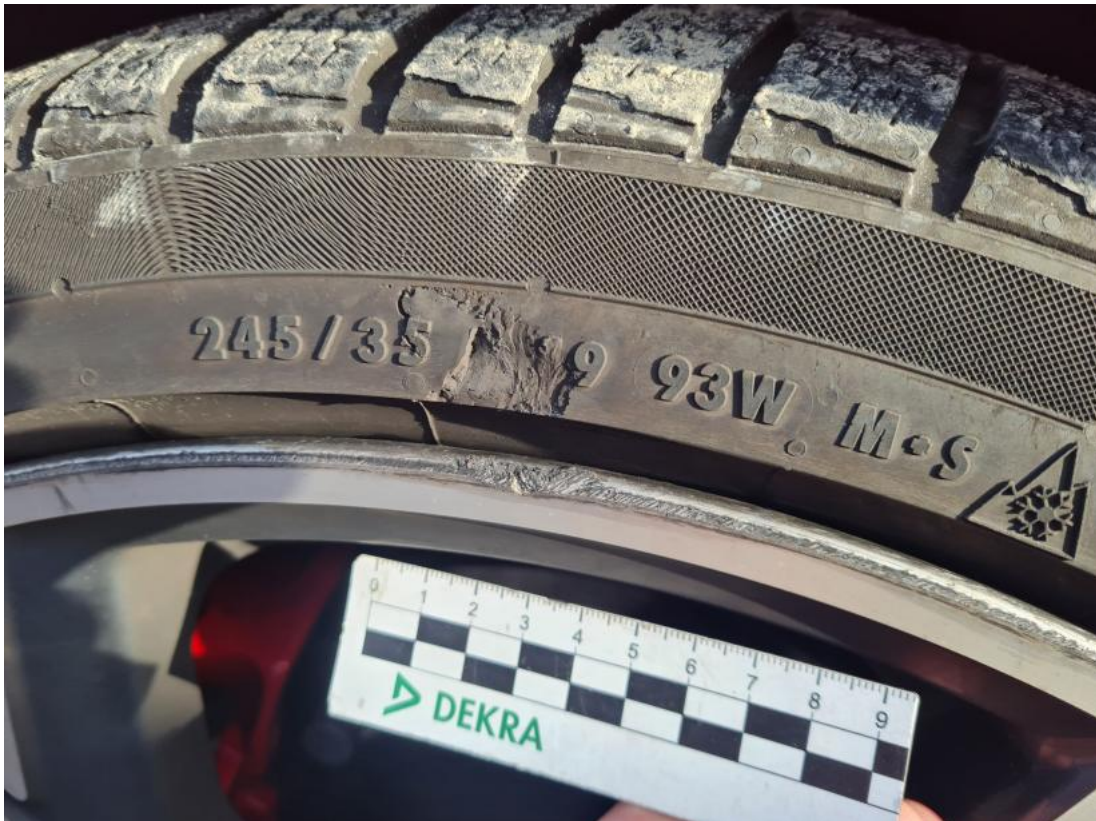
Fot. 47 Felga aluminiowa przednia P - Rysa/odprysk 1