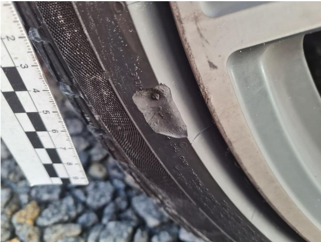
Fot. 51 Opona przednia P - Pęknięcie/rozerwanie 2