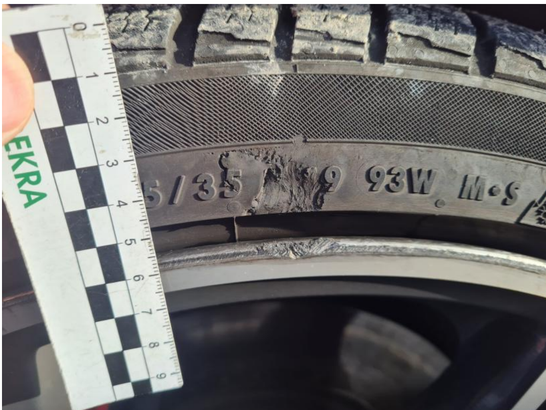
Fot. 50 Opona przednia P - Pęknięcie/rozerwanie 1