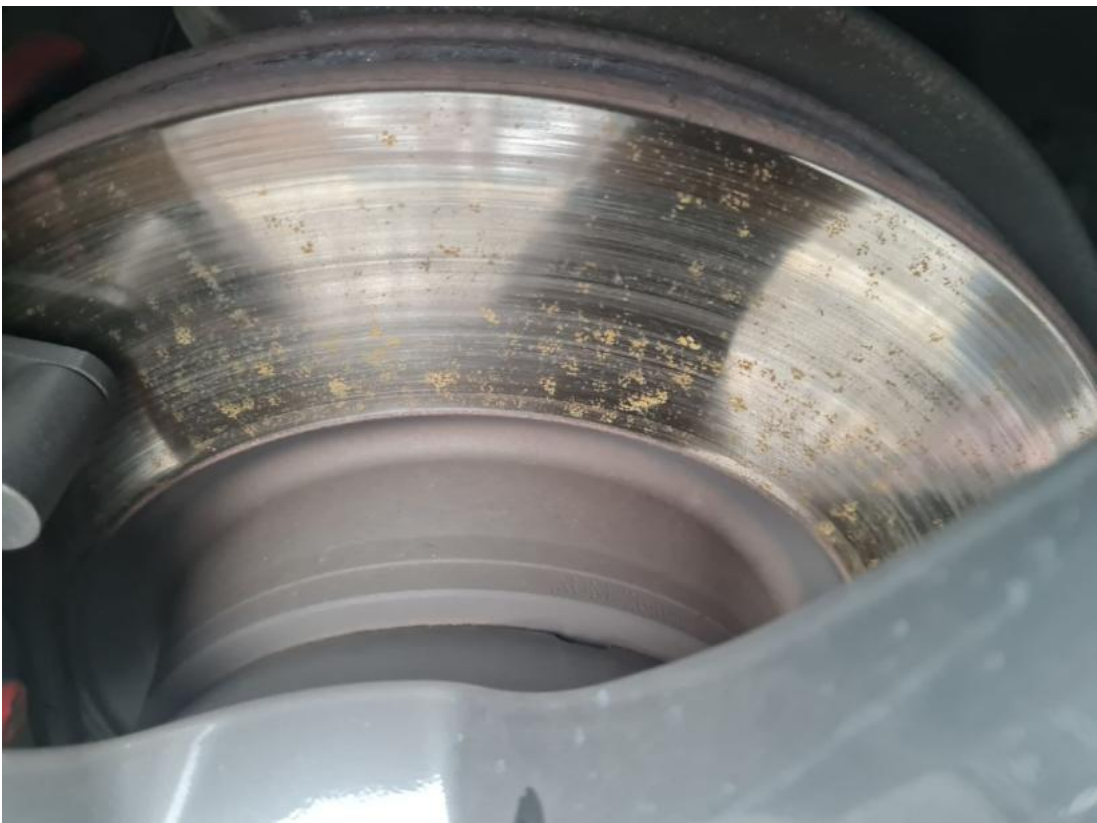
Fot. 30 Tarcza hamulcowa przednia prawa