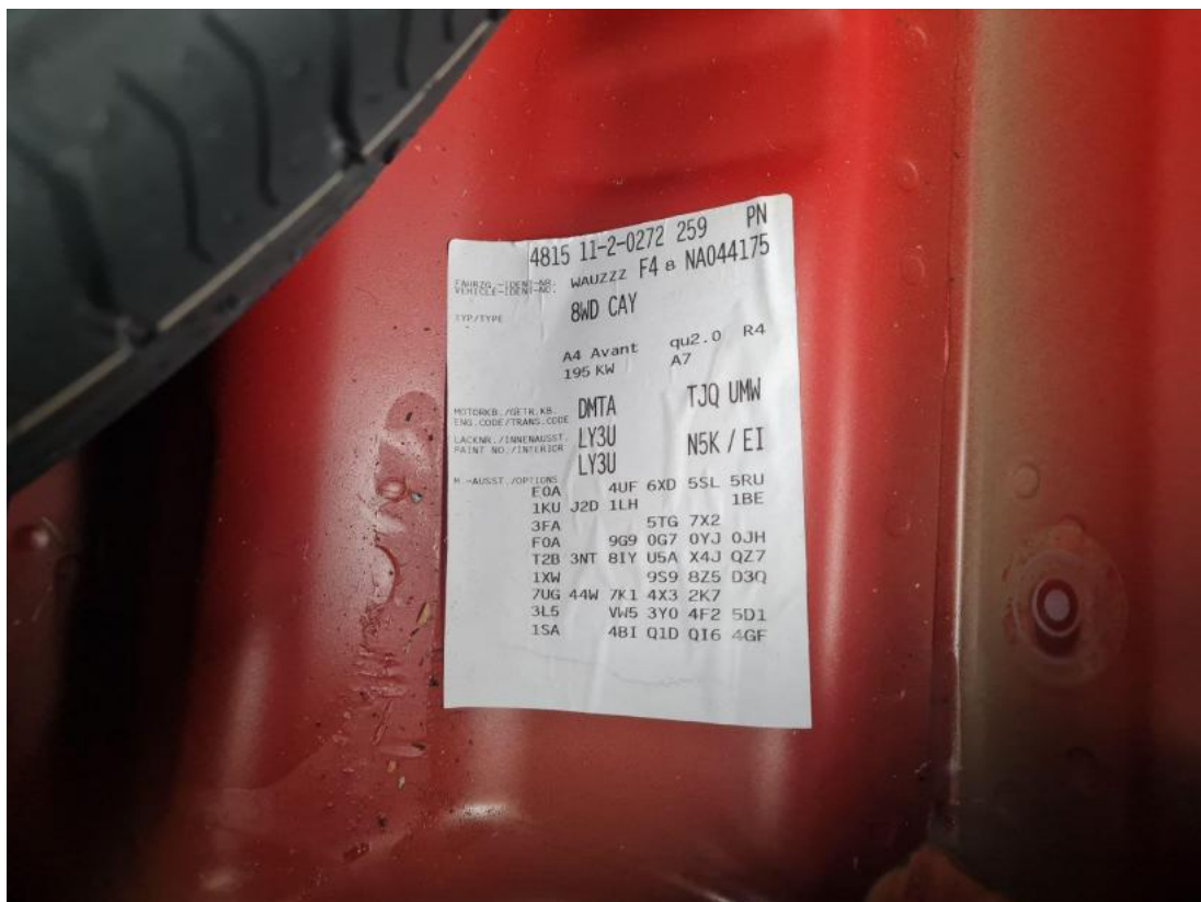
Fot. 36 Zdjęcie do protokołu