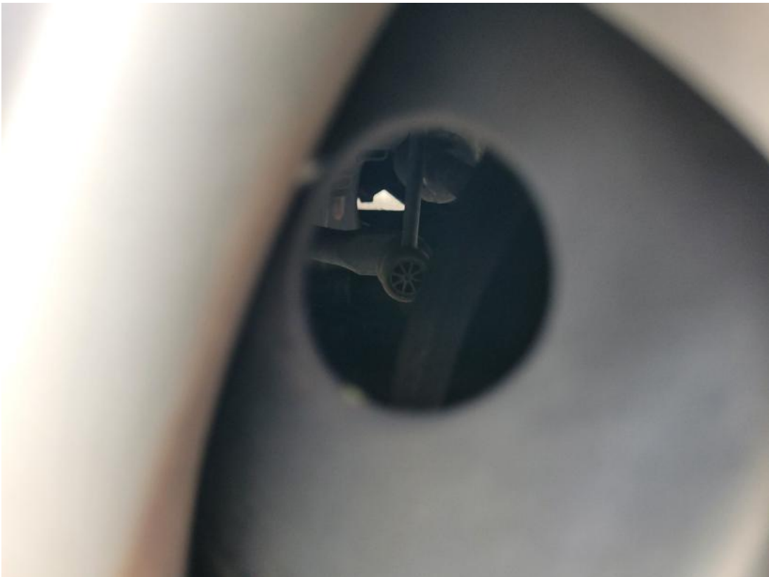
Fot. 29 Tarcza hamulcowa przednia prawa