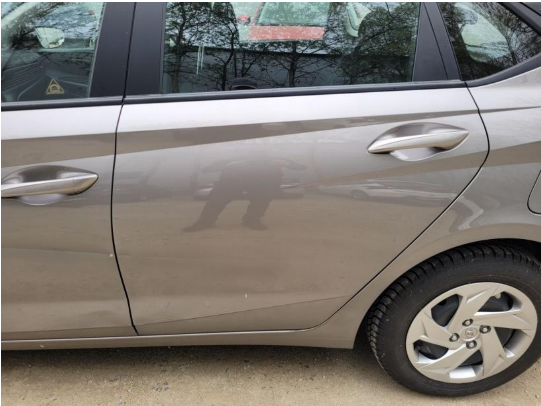
Fot. 39 Drzwi tylne L - zdjęcie poglądowe 1