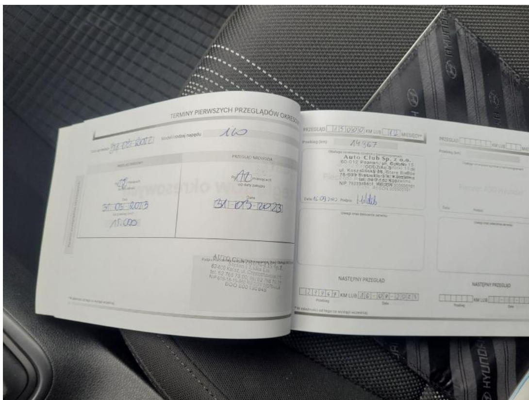
Fot. 33 Książka serwisowa – ostatni przegląd