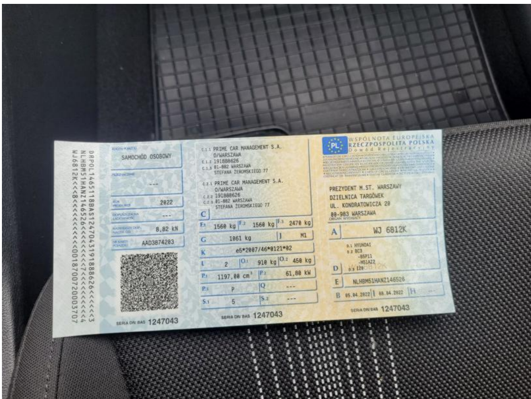
Fot. 30 Dowód rej. Str. 1