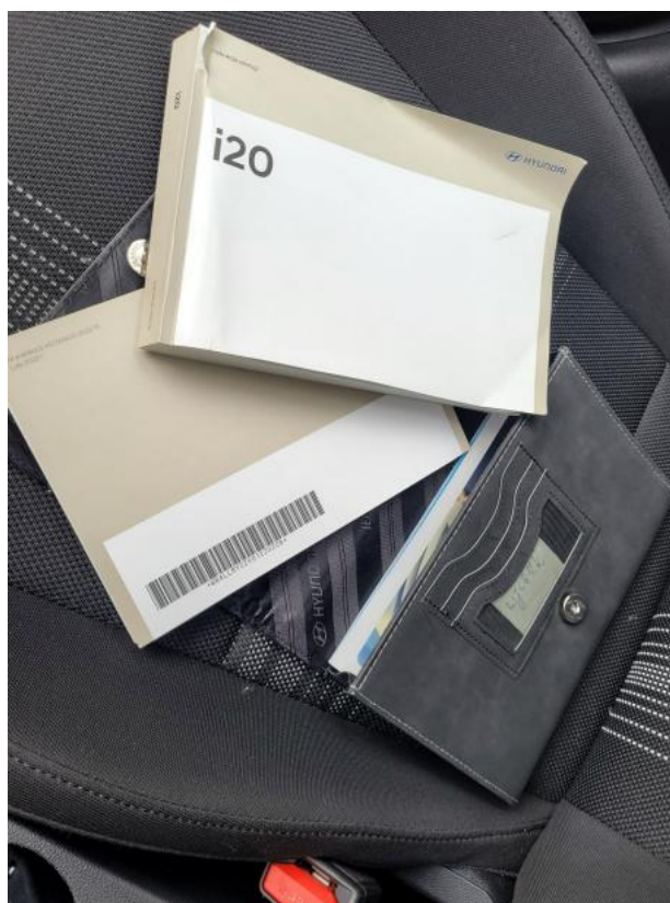
Fot. 34 Instrukcje