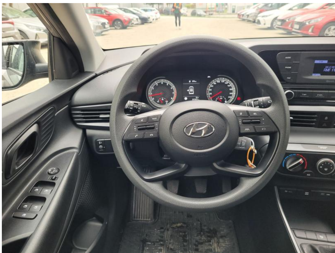
Fot. 21 Kierownica (na wprost)