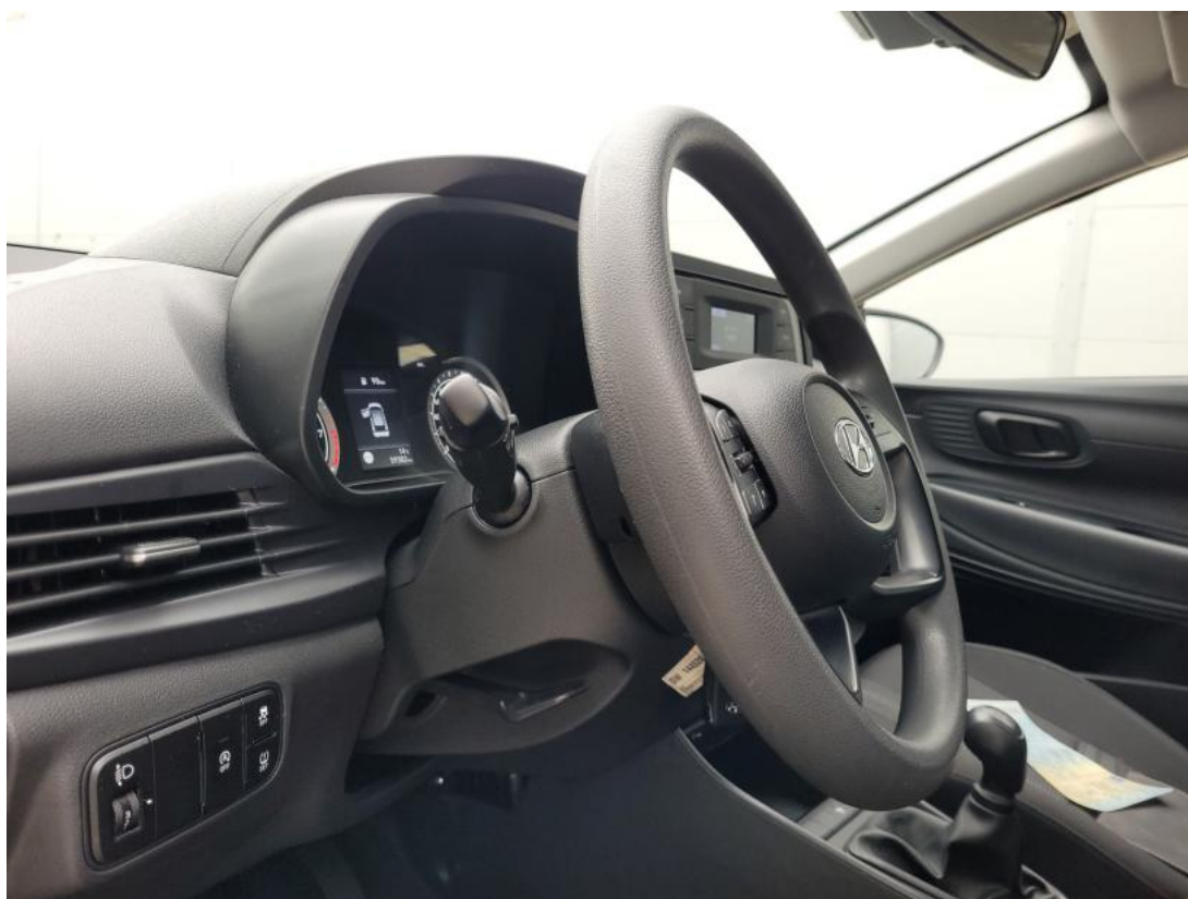
Fot. 22 Kierownica z lewej strony