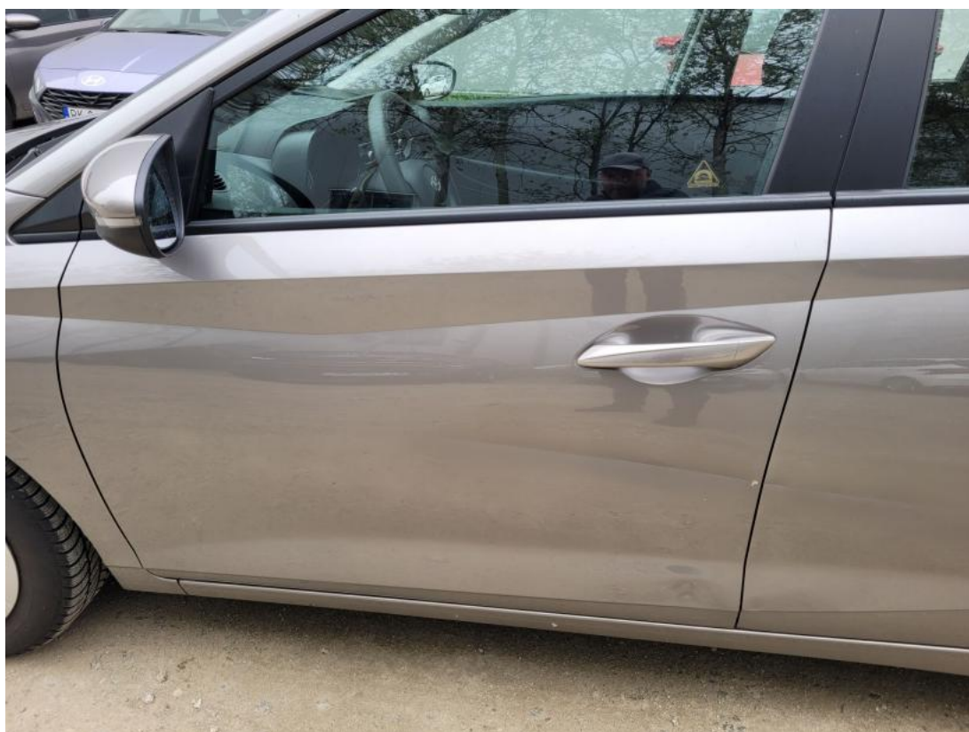
Fot. 36 Drzwi przed L - zdjęcie poglądowe 1