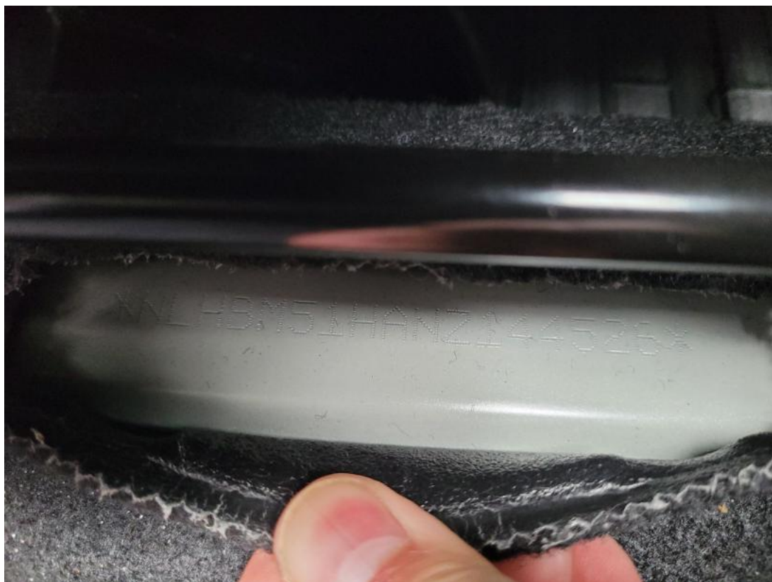
Fot. 35 Zdjęcie do protokołu