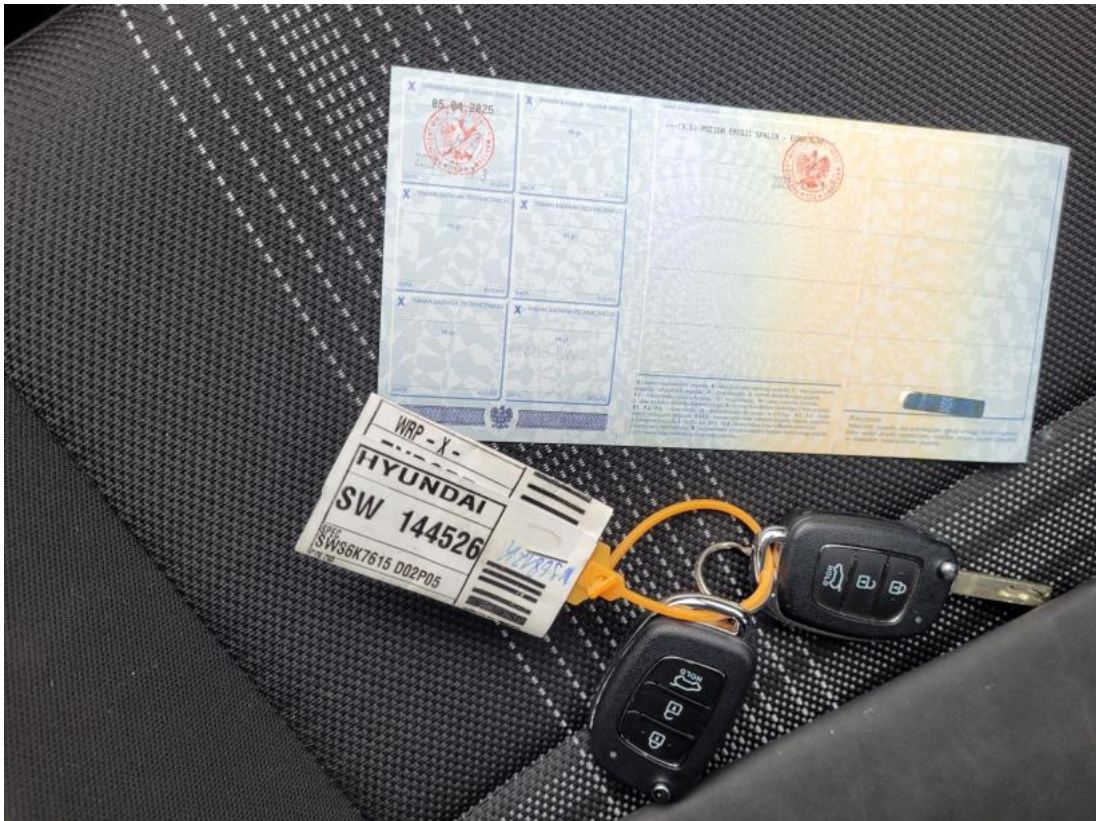
Fot. 31 Dow. Rej. Str.2 i klucze