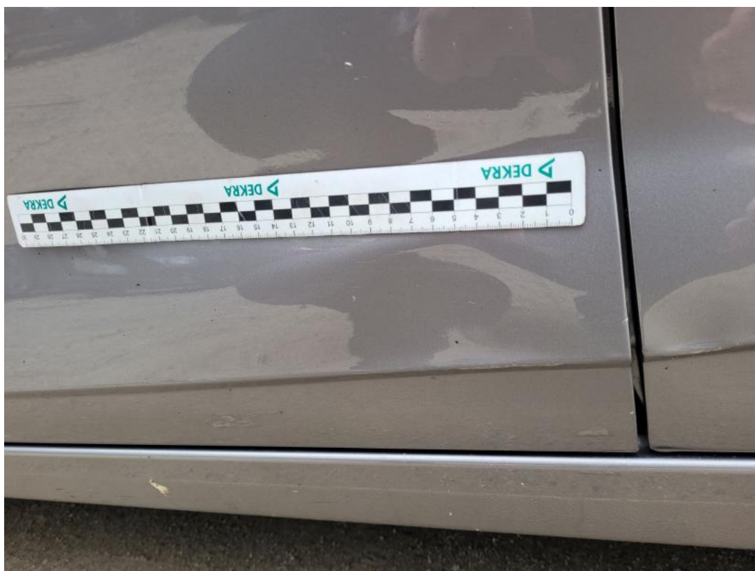
Fot. 38 Drzwi przed L - Wgniecenie/odkształcenie 2