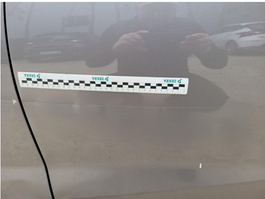
Fot. 40 Drzwi tylne L - Wgniecenie/odkształcenie 1