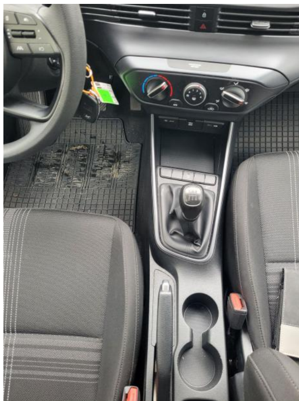
Fot. 20 Tunel środkowy