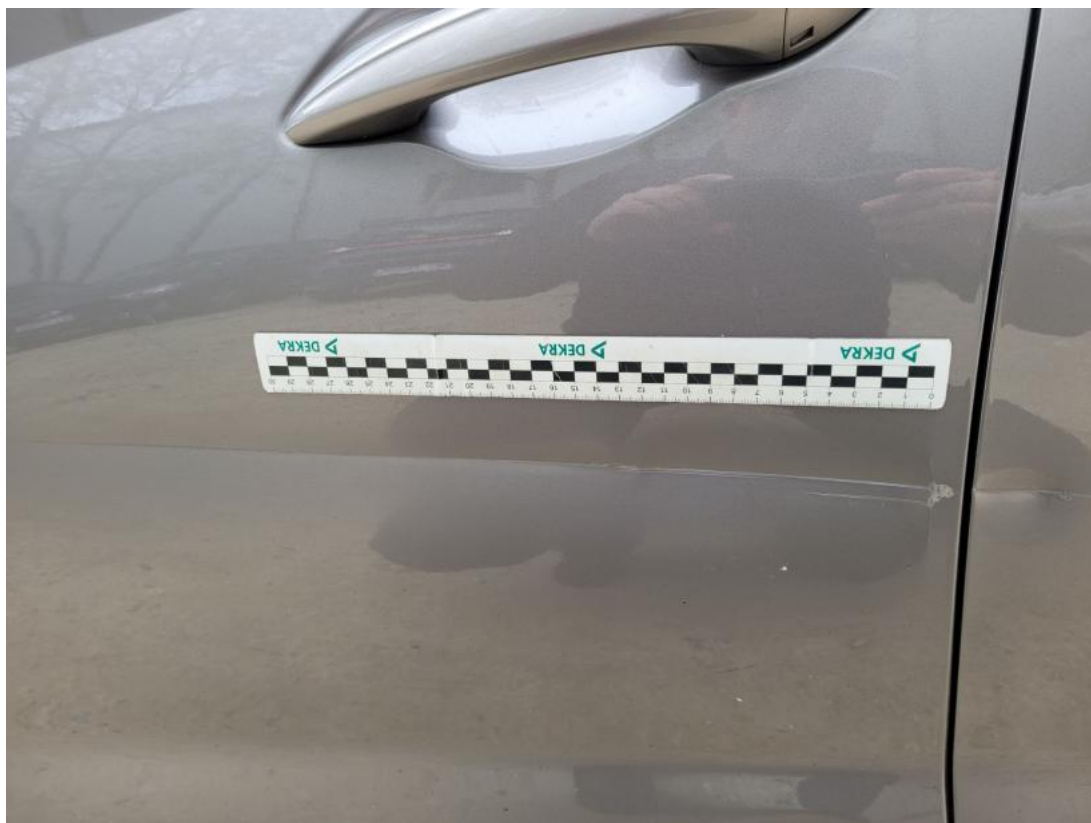
Fot. 37 Drzwi przed L - Wgniecenie/odkształcenie 1