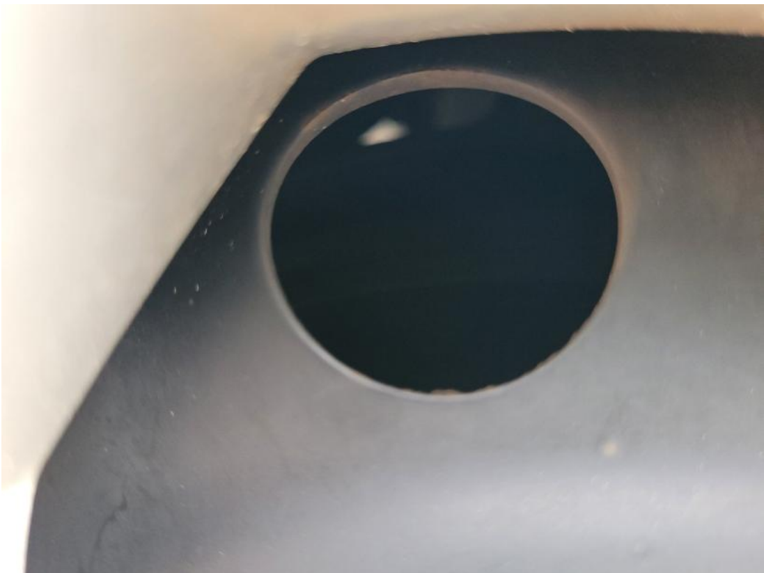
Fot. 28 Tarcza hamulcowa przednia lewa