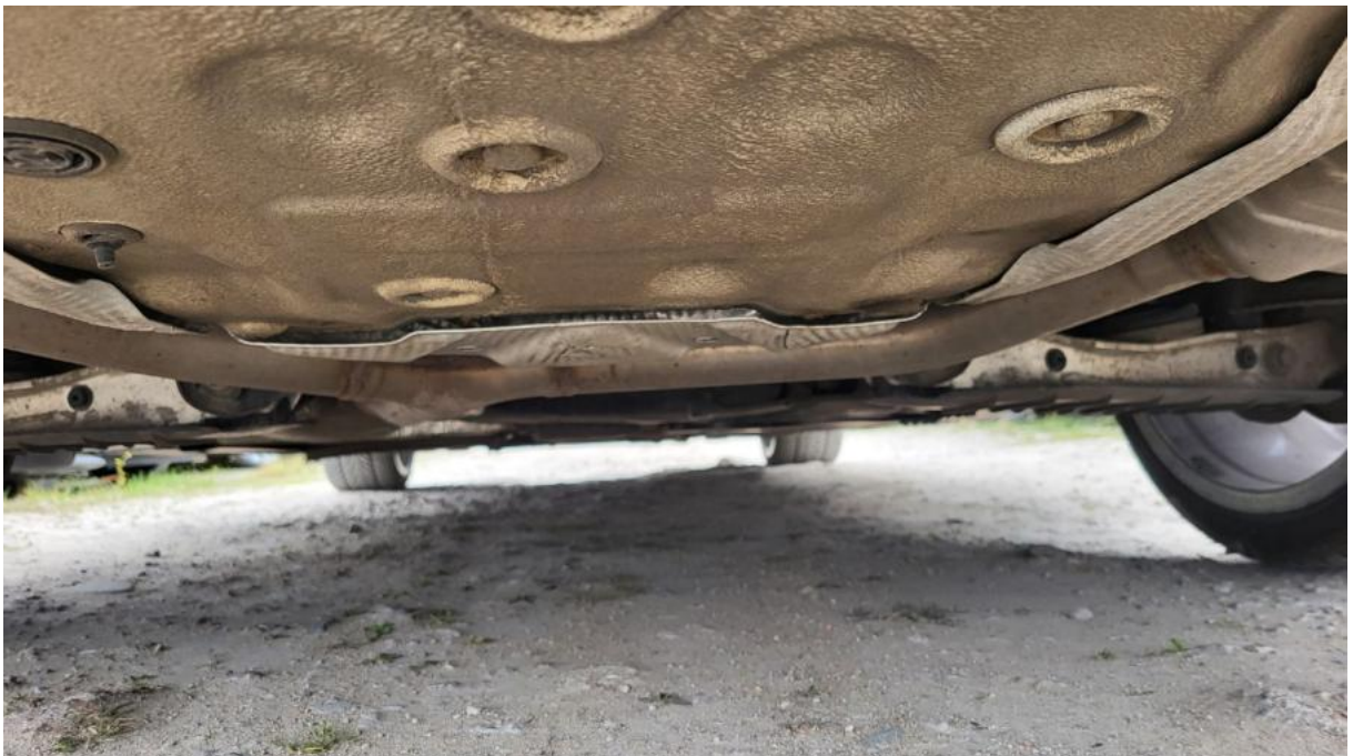
Fot. 26 Spód pojazdu tył