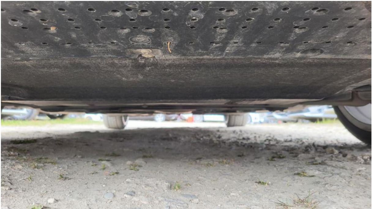
Fot. 25 Spód pojazdu przód