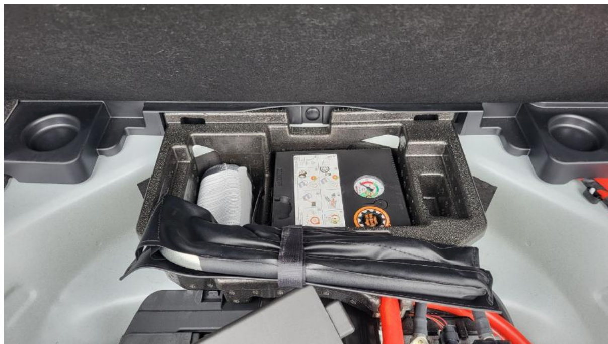
Fot. 32 Zestaw naprawczy koła