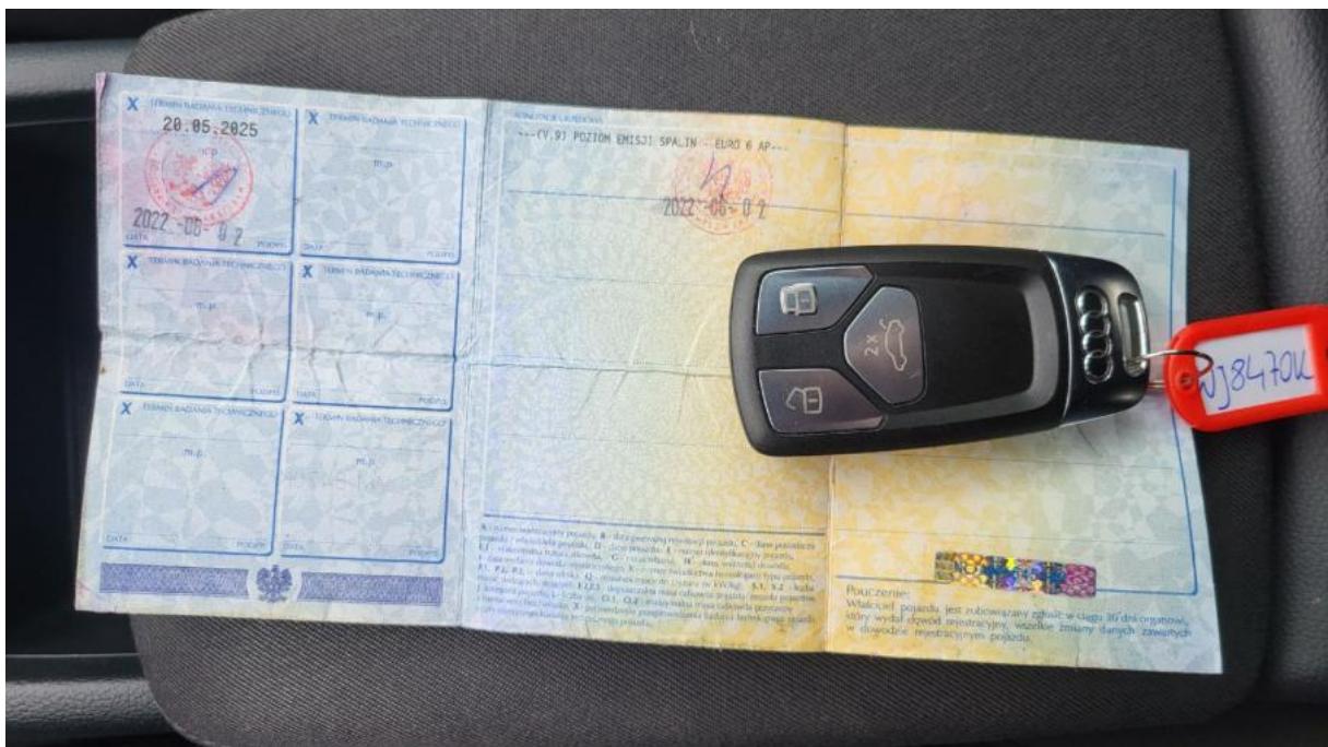
Fot. 28 Dow. Rej. Str.2 i klucze