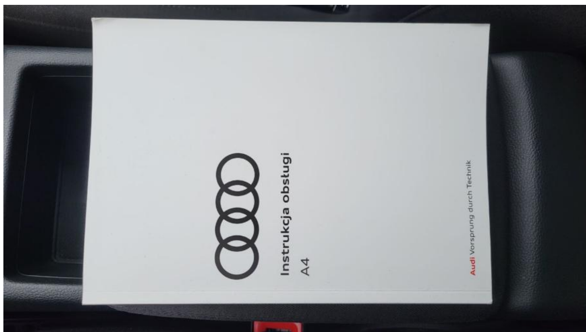
Fot. 31 Instrukcje