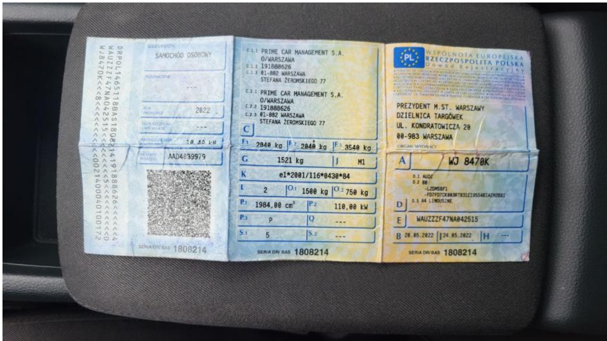
Fot. 27 Dowód rej. Str. 1