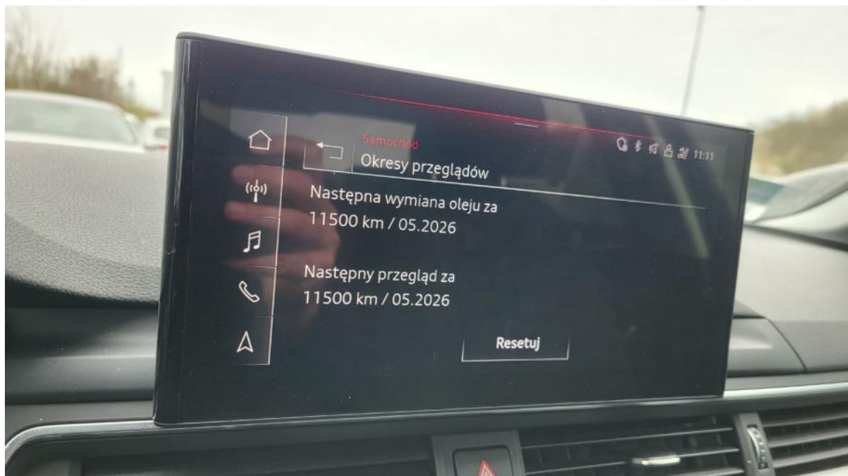
Fot. 30 Książka serwisowa – ostatni przegląd