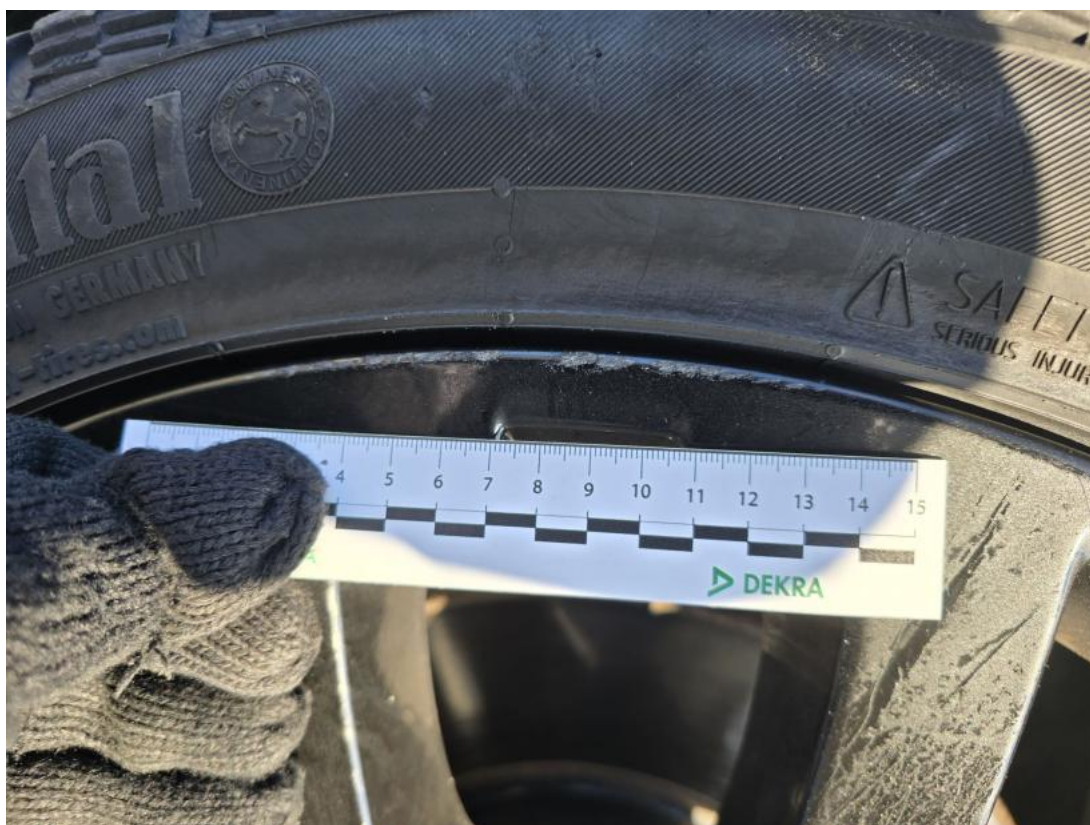
Fot. 49 Felga Aluminiowa przednia L - Rysa/odprysk 1