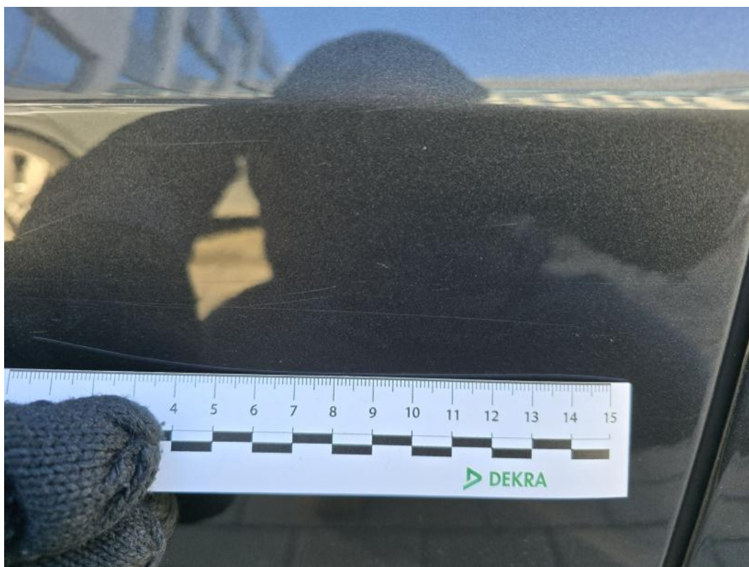
Fot. 41 Drzwi tylne P - Rysa/odprysk 1