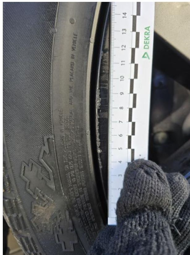
Fot. 39 Felga aluminiowa przednia P() - Rysa/odprysk 3