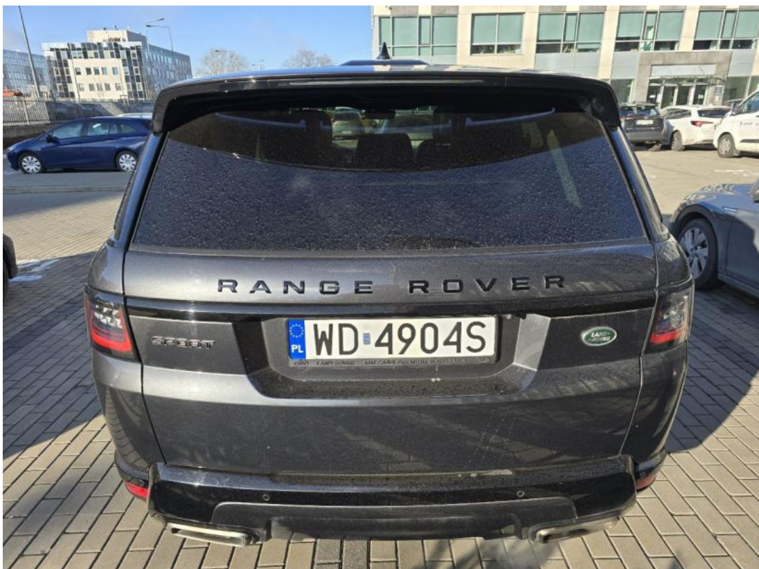
Fot. 8 Tyt