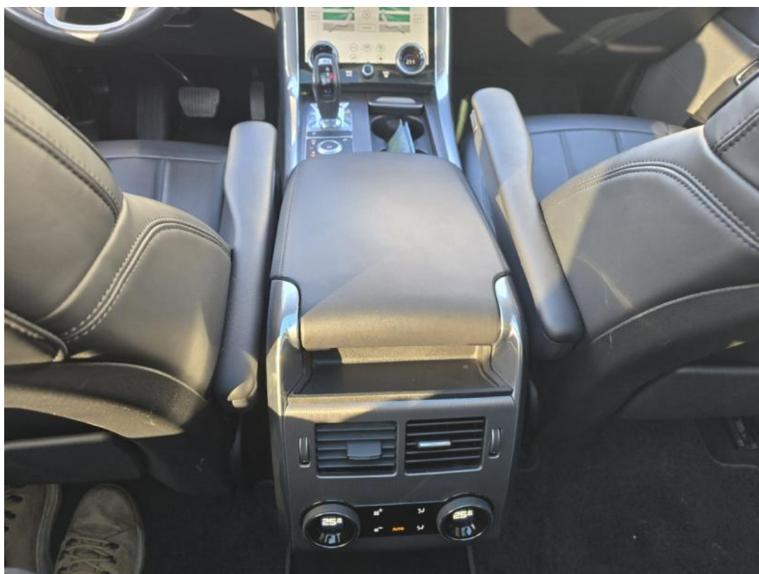
Fot. 20 Tuneł środkowy