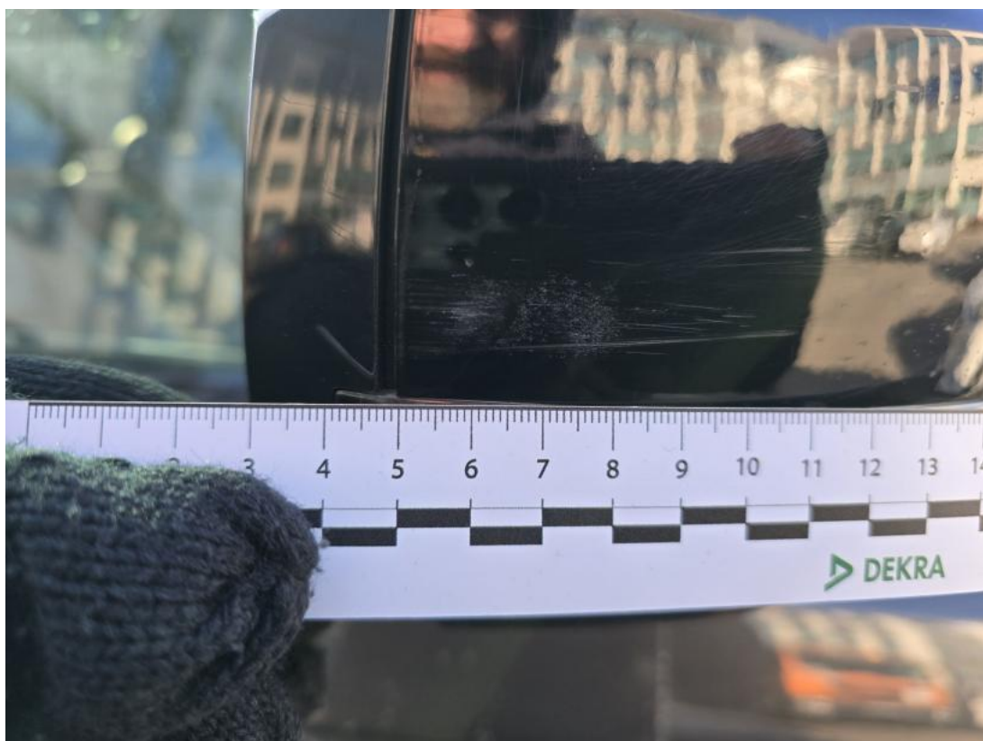
Fot. 43 Obudowa lusterka zew P - Rysa/odprysk 1