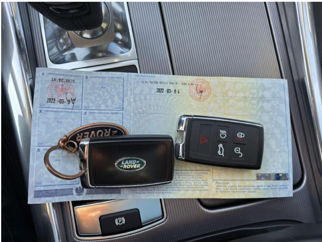
Fot. 33 Dow. Rej. Str.2 i klucze