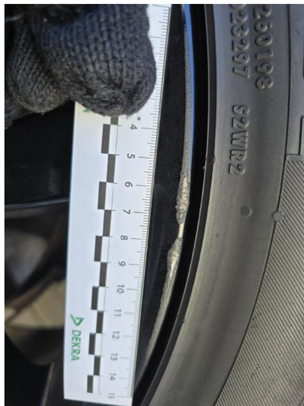
Fot. 38 Felga aluminiowa przednia P - Rysa/odprysk 1