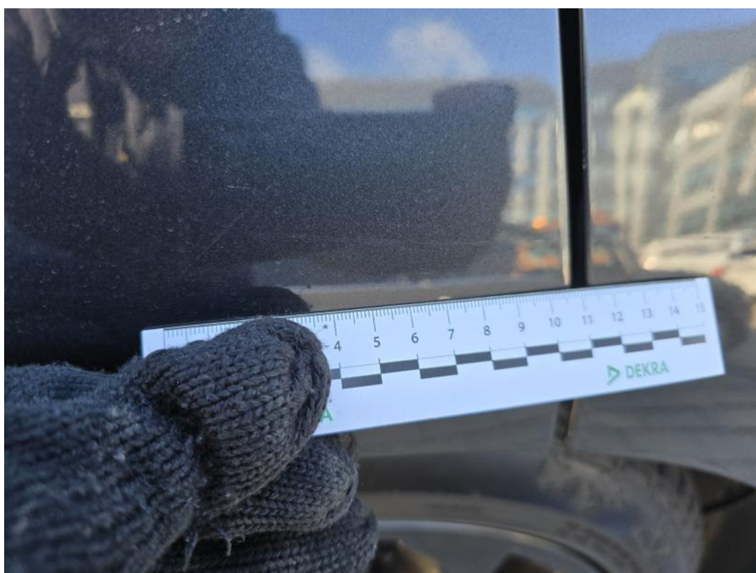
Fot. 44 Błotnik tylny P / Ściana boczna P - Rysa/odprysk 1