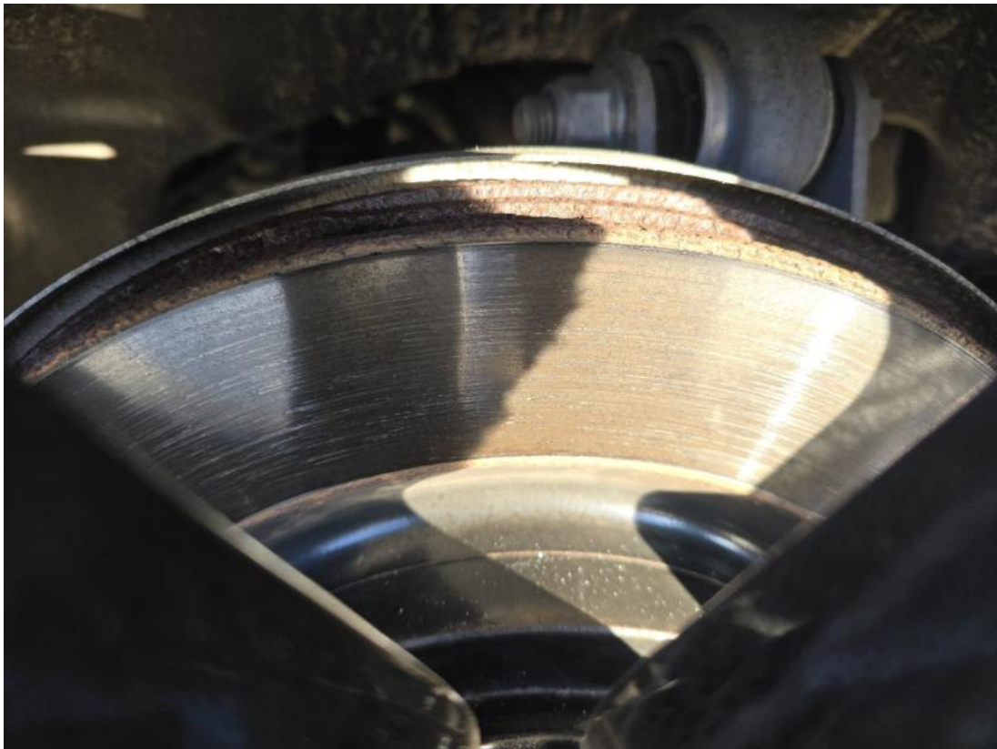
Fot. 31 Tarcza hamulcowa tylna lewa