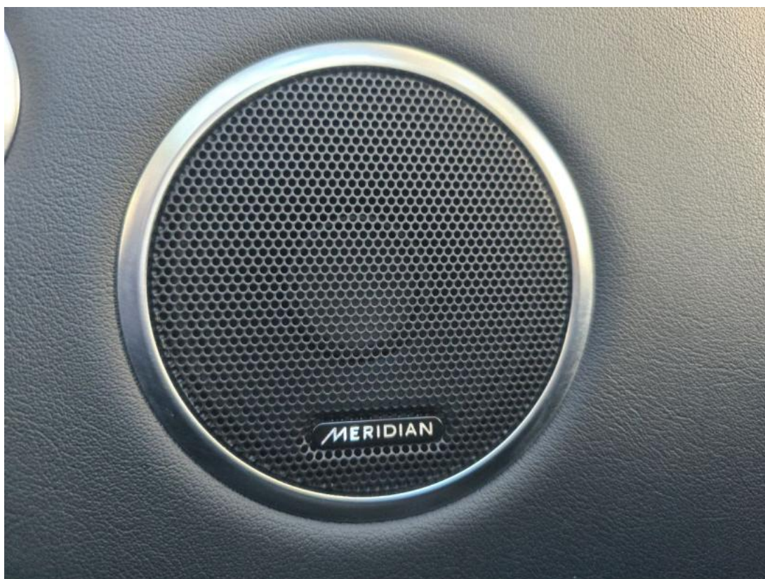
Fot. 36 dźwięk