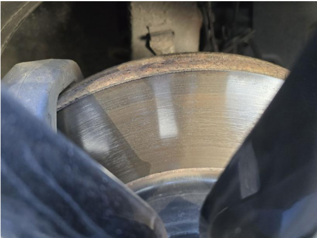
Fot. 29 Tarcza hamulcowa przednia prawa