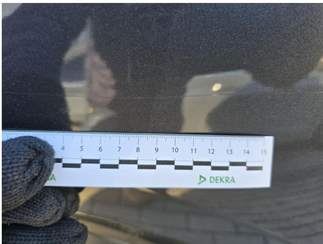
Fot. 42 Drzwi tylne P() - Rysa/odprysk 3