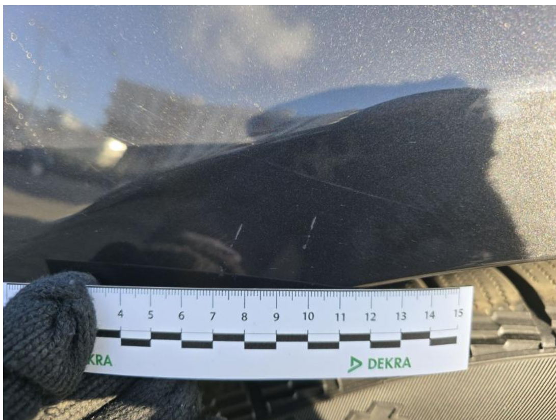
Fot. 48 Drzwi tylne L - Rysa/odprysk 1