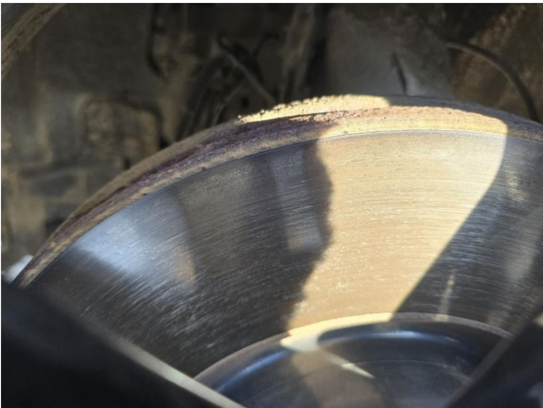
Fot. 28 Tarcza hamulcowa przednia lewa