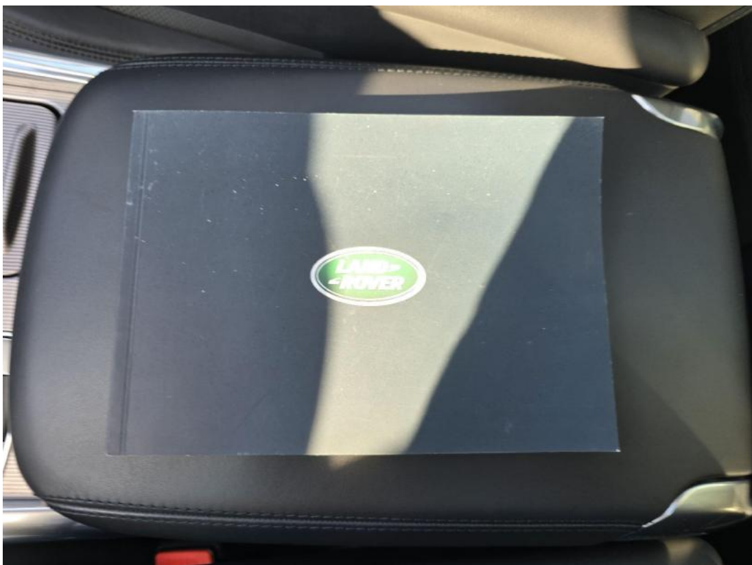
Fot. 34 Instrukcje