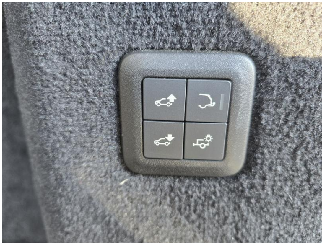
Fot. 35 hak