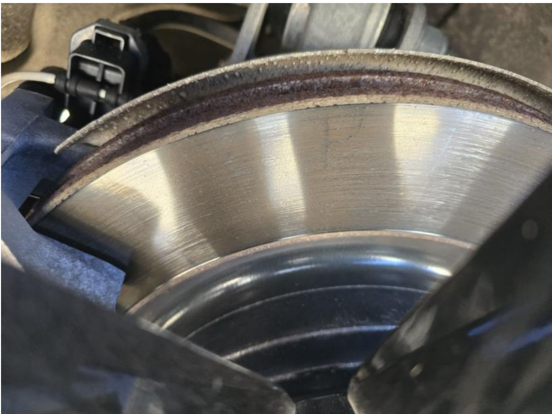
Fot. 30 Tarcza hamulcowa tylna prawa