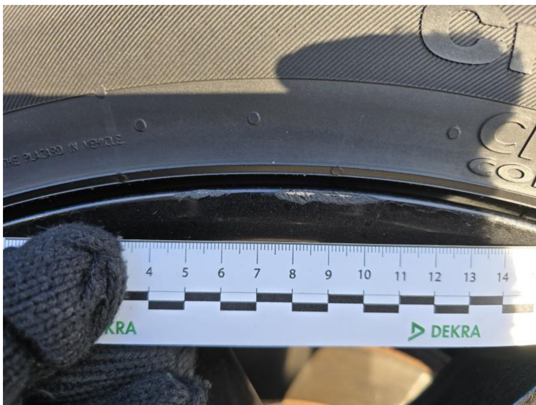
Fot. 47 Felga aluminiowa tylna L - Rysa/odprysk 1