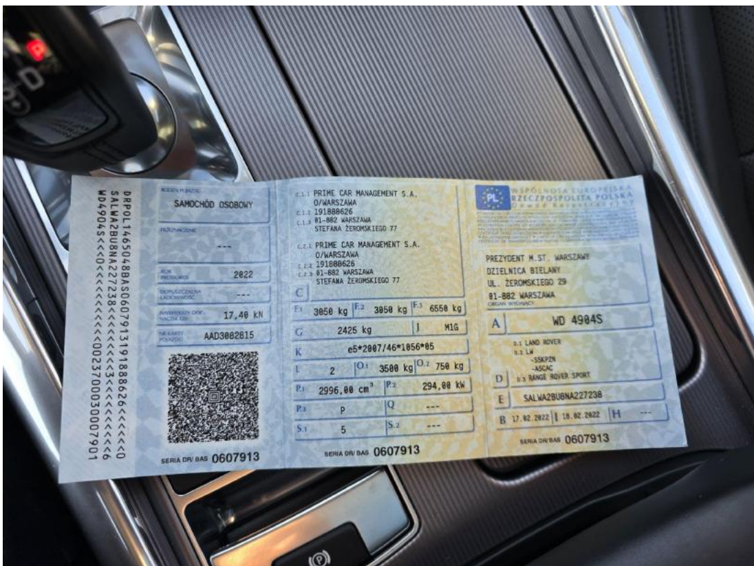
Fot. 32 Dowód rej. Str. 1