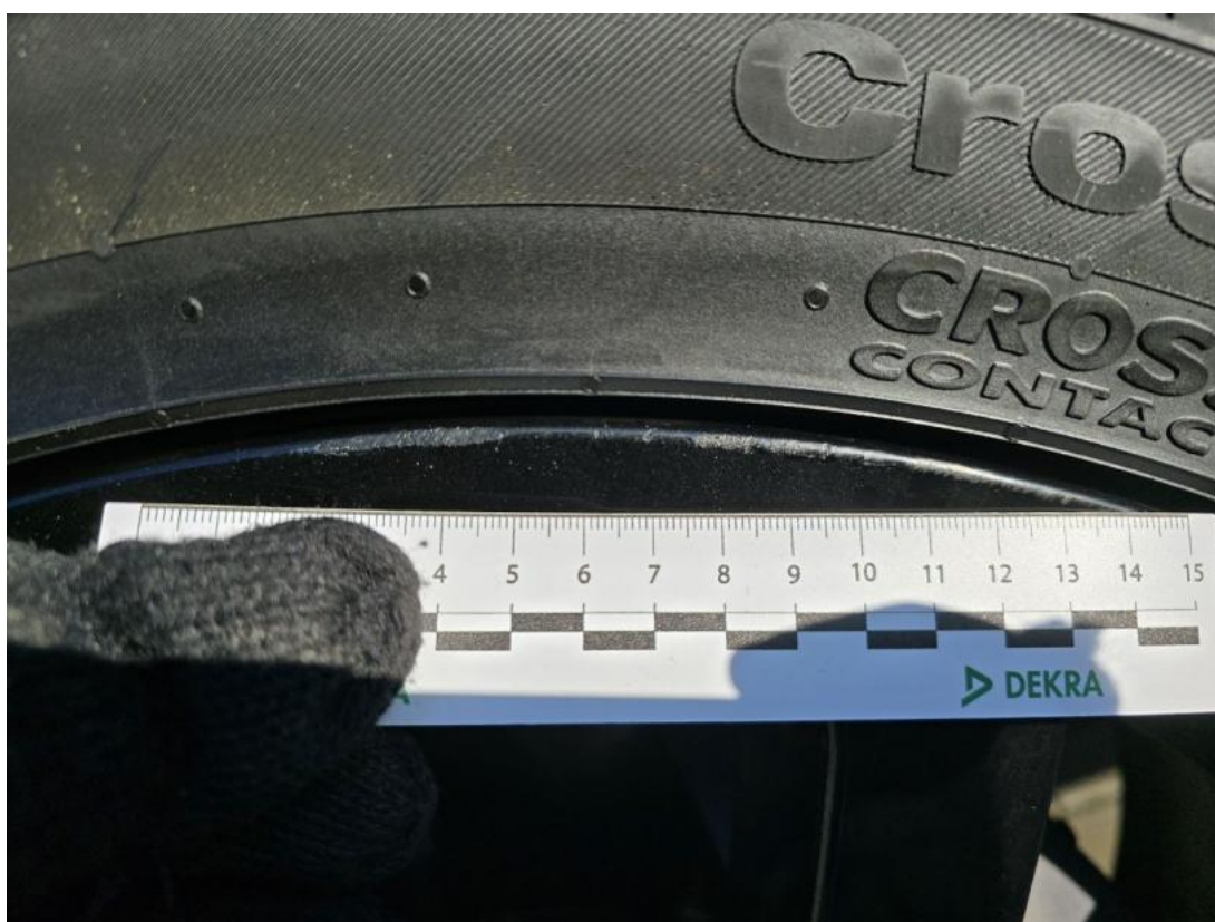
Fot. 50 Felga Aluminiowa przednia L() - Rysa/odprysk 3