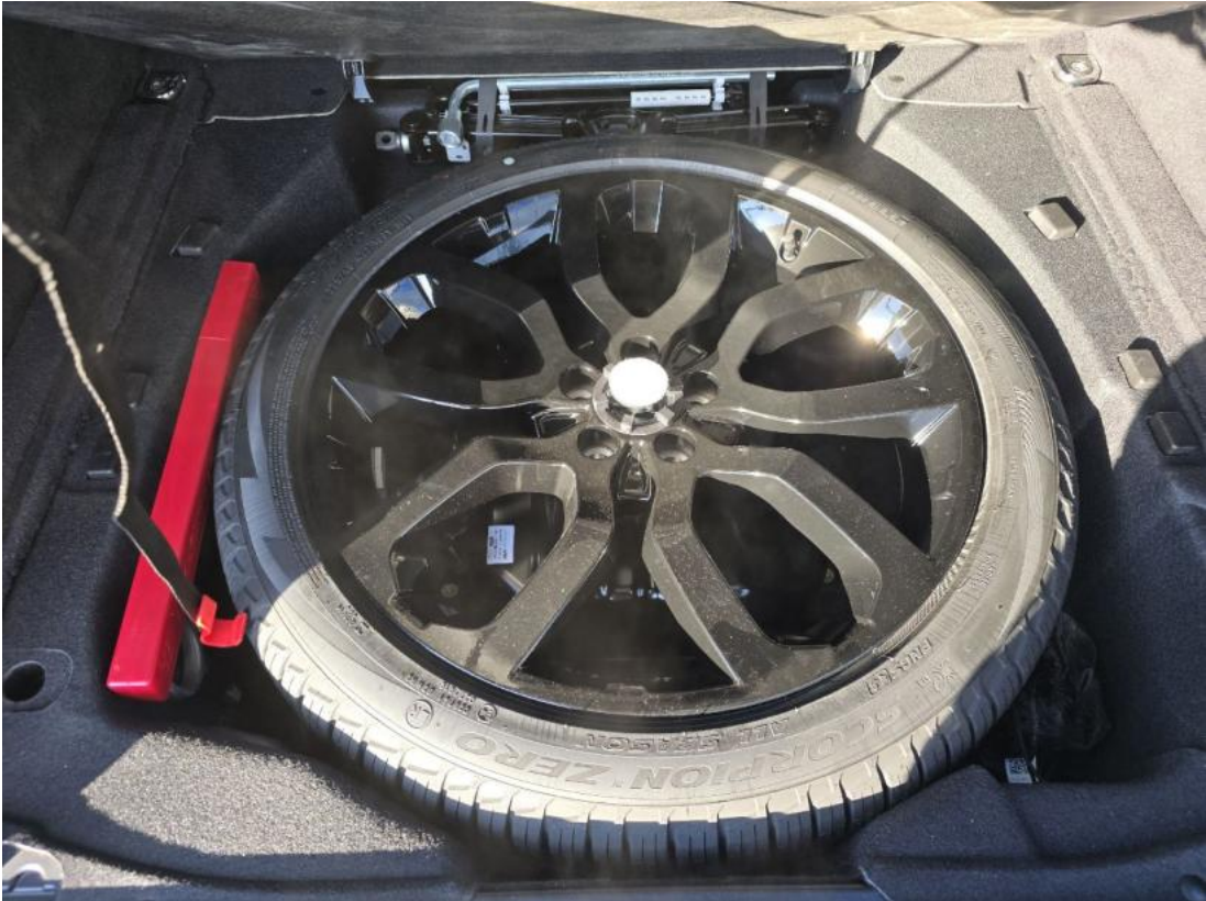
Fot. 25 Koło zapasowe