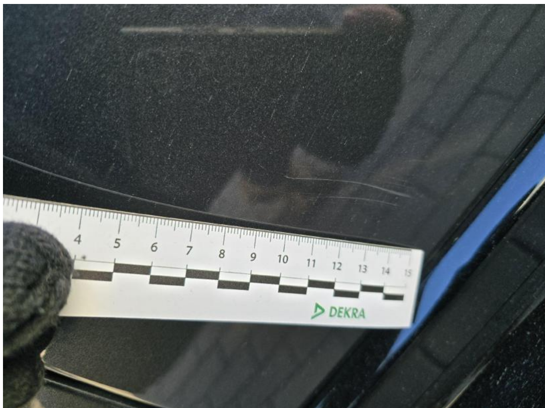
Fot. 40 Drzwi przednie P - Rysa/odprysk 1