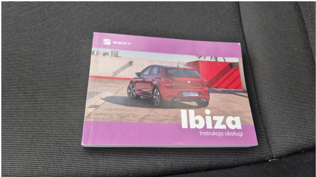
Fot. 31 Instrukcje