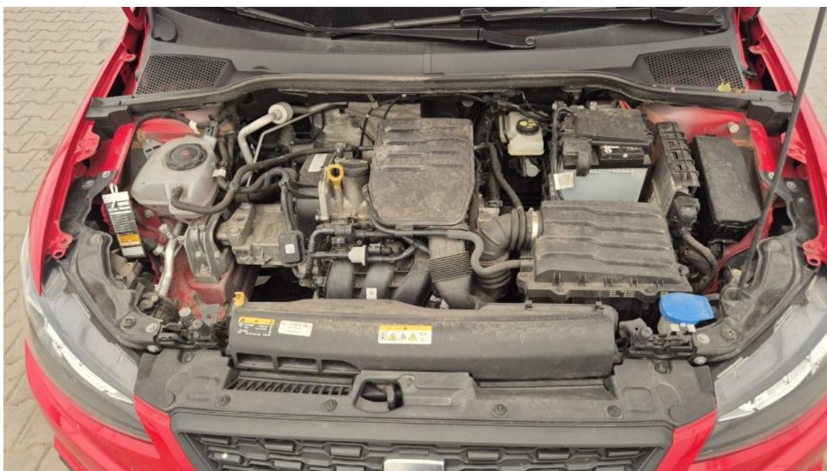
Fot. 23 Komora silnika