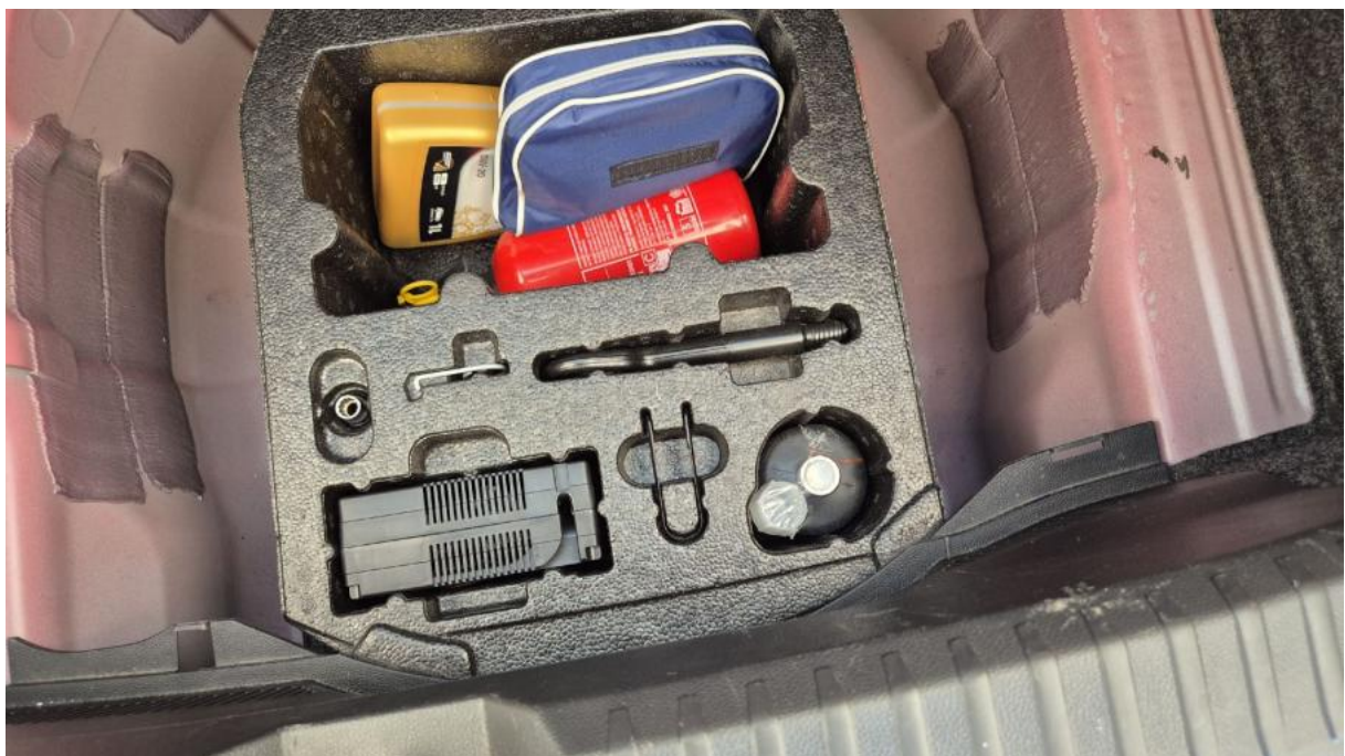
Fot. 32 Zestaw naprawczy koła