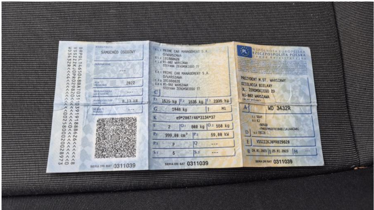
Fot. 27 Dowód rej. Str. 1