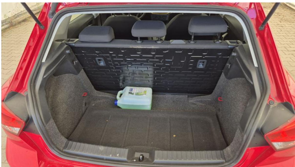
Fot. 24 Bagażnik