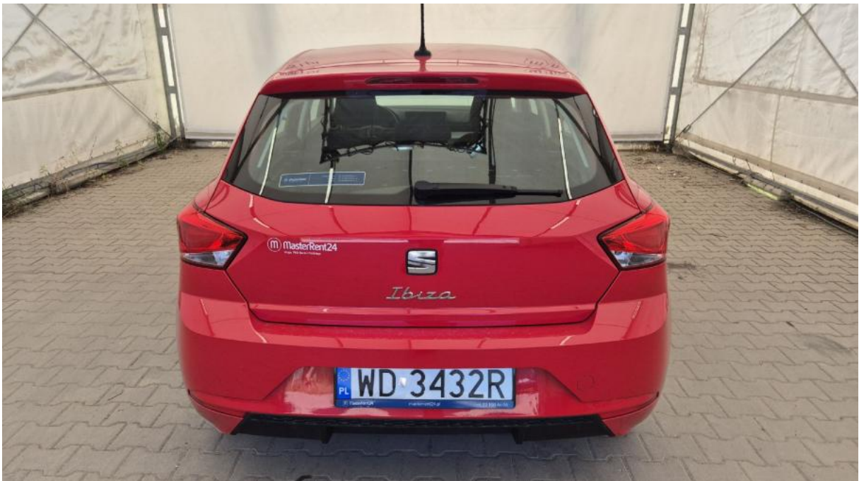
Fot. 8 Tyt