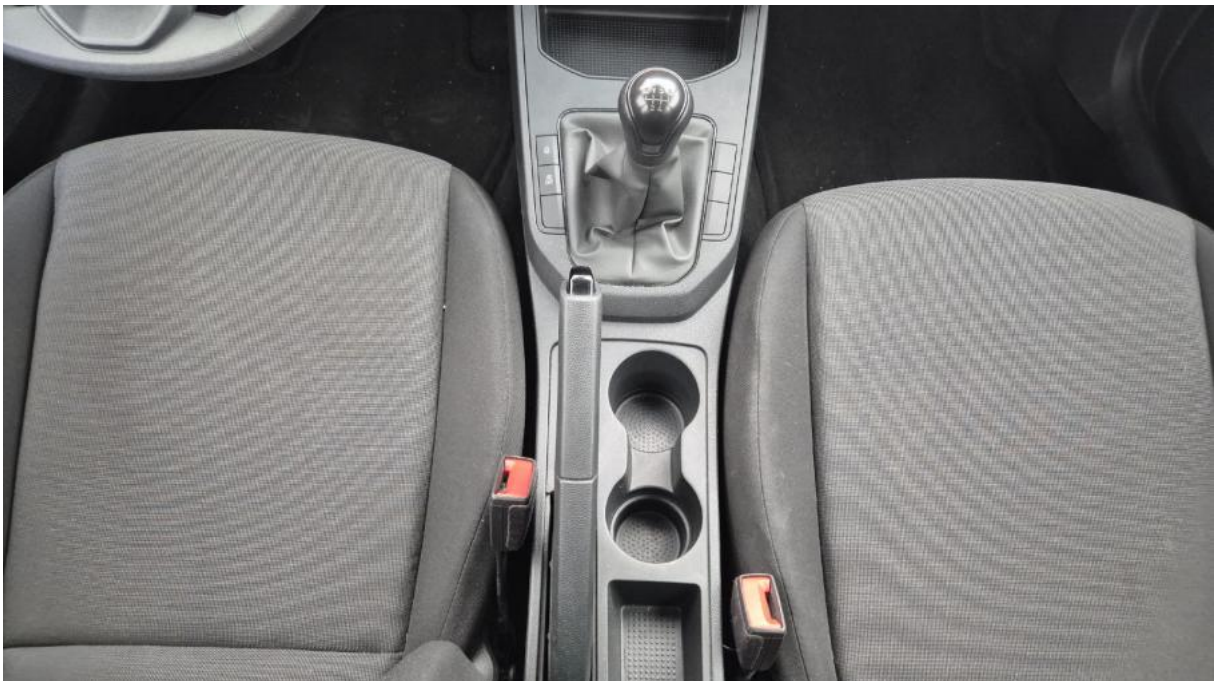
Fot. 20 Tuneł środkowy