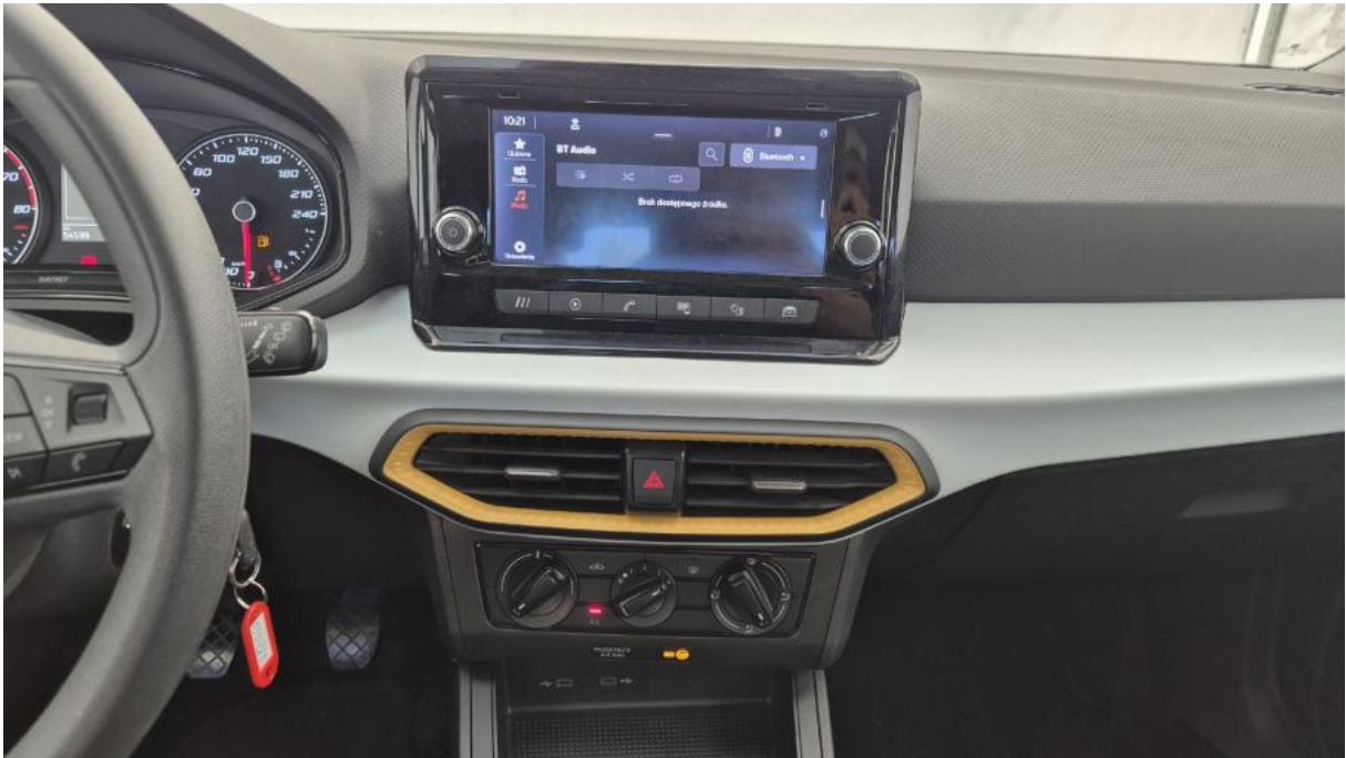
Fot. 19 Konsola środkowa