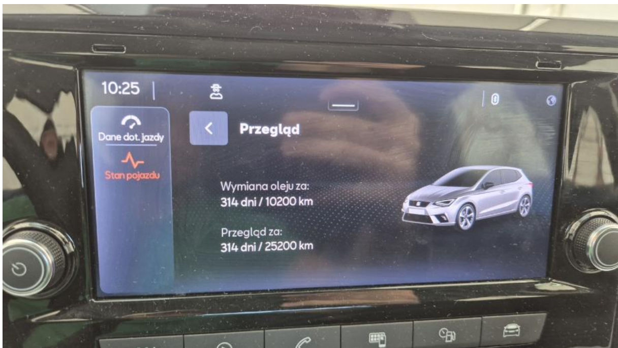
Fot. 30 Książka serwisowa – ostatni przegląd