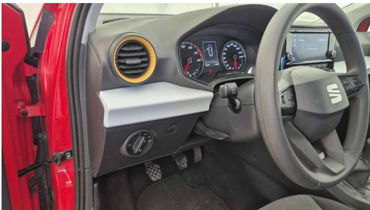
Fot. 22 Kierownica z lewej strony