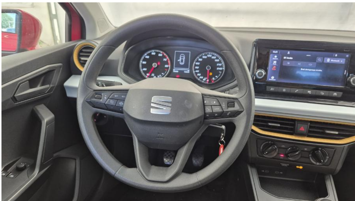
Fot. 21 Kierownica (na wprost)