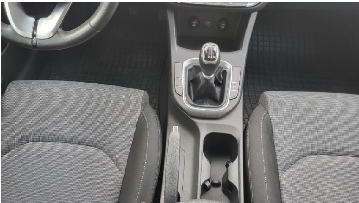
Fot. 20 Tuneł środkowy