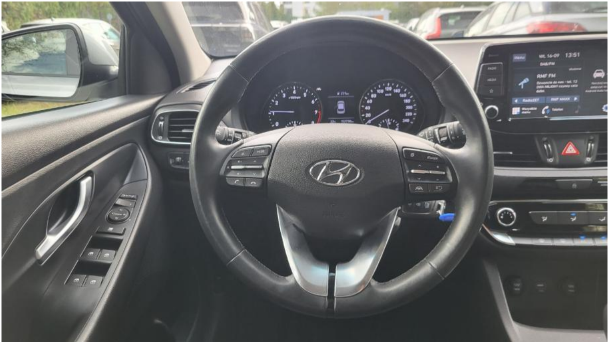
Fot. 21 Kierownica (na wprost)