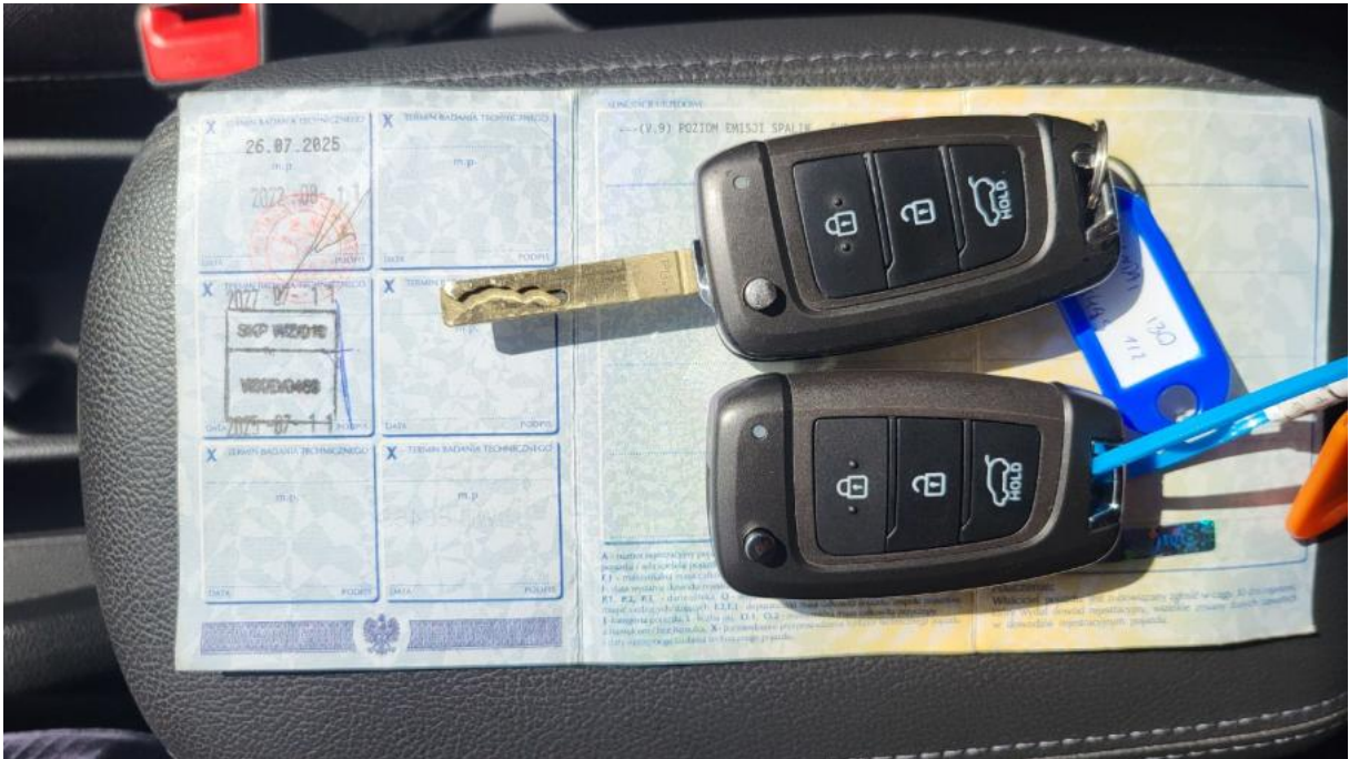
Fot. 29 Dow. Rej. Str.2 i klucze