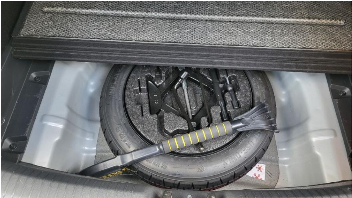
Fot. 25 Koło zapasowe