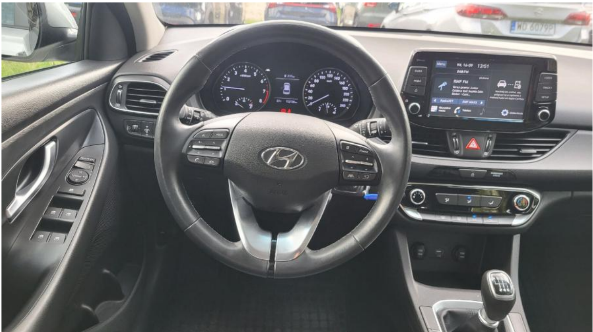
Fot. 22 Kierownica z lewej strony