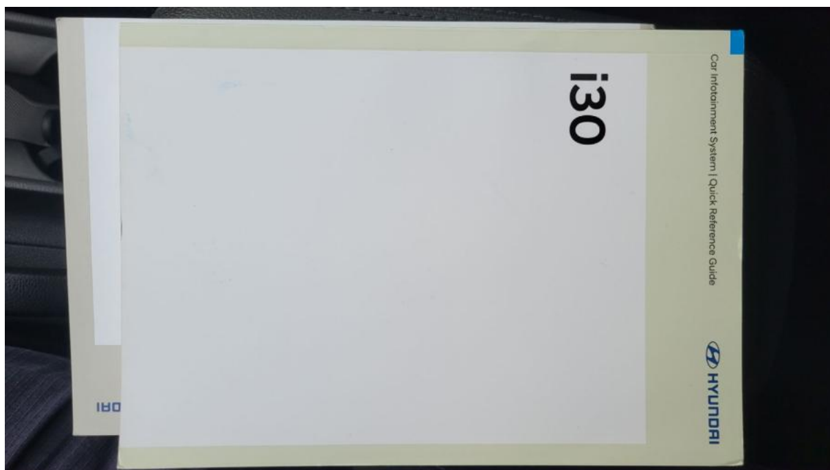
Fot. 32 Instrukcje