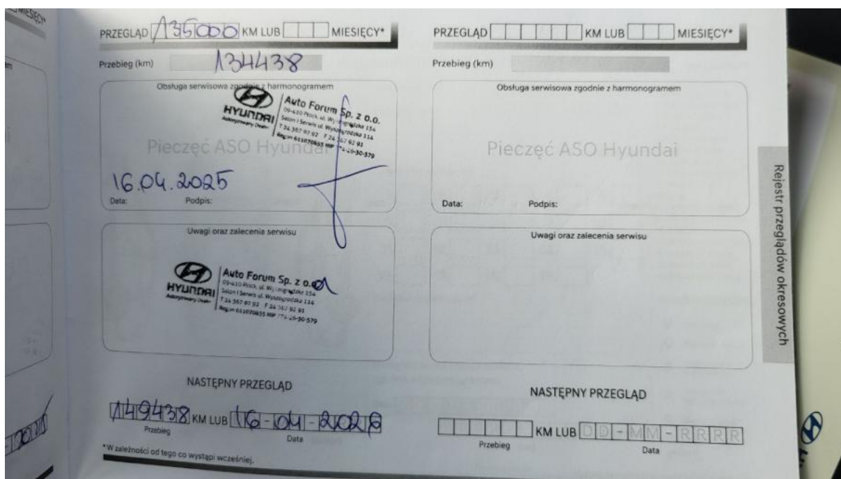
Fot. 31 Książka serwisowa – ostatni przegląd