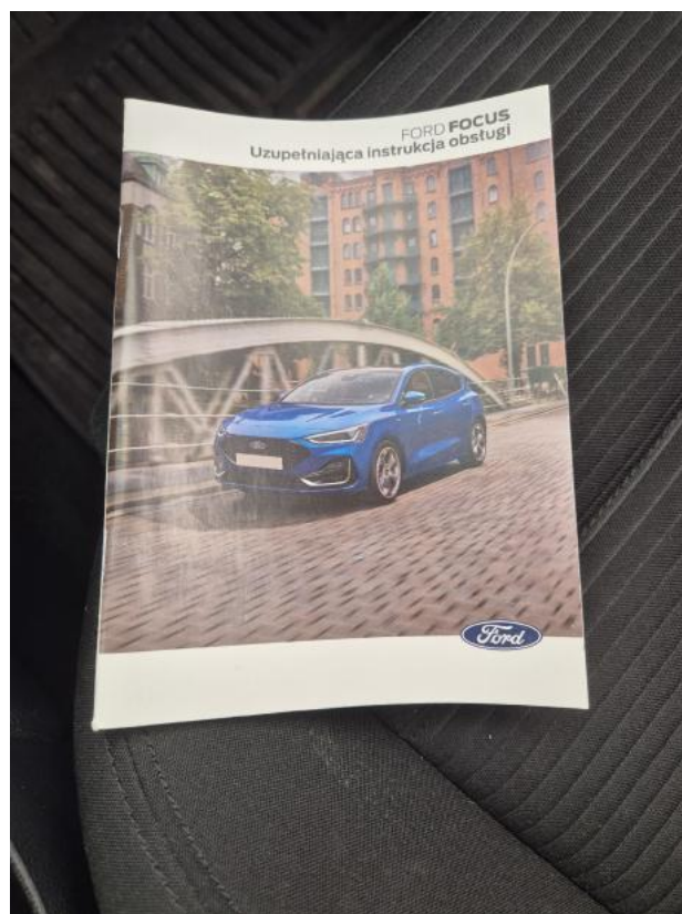
Fot. 35 Instrukcje