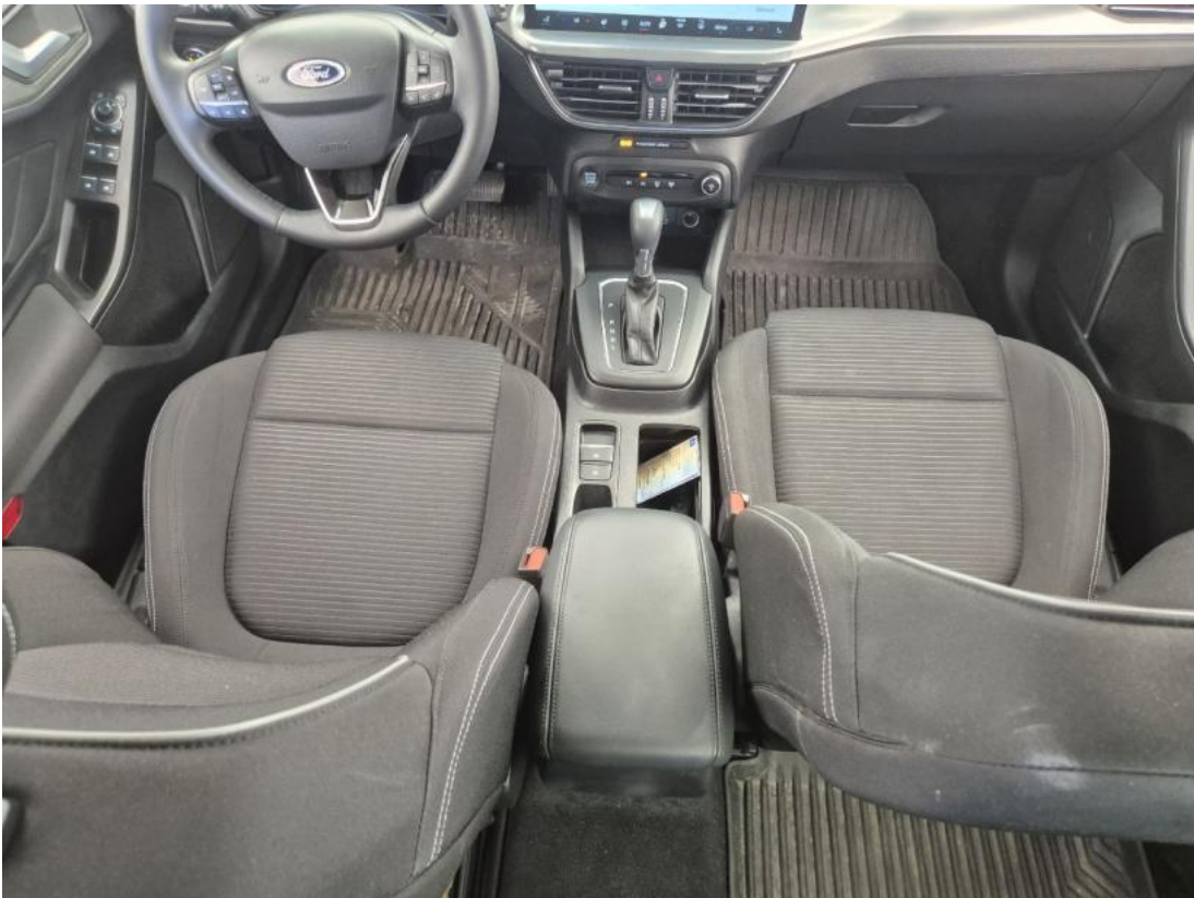
Fot. 21 Tunel środkowy