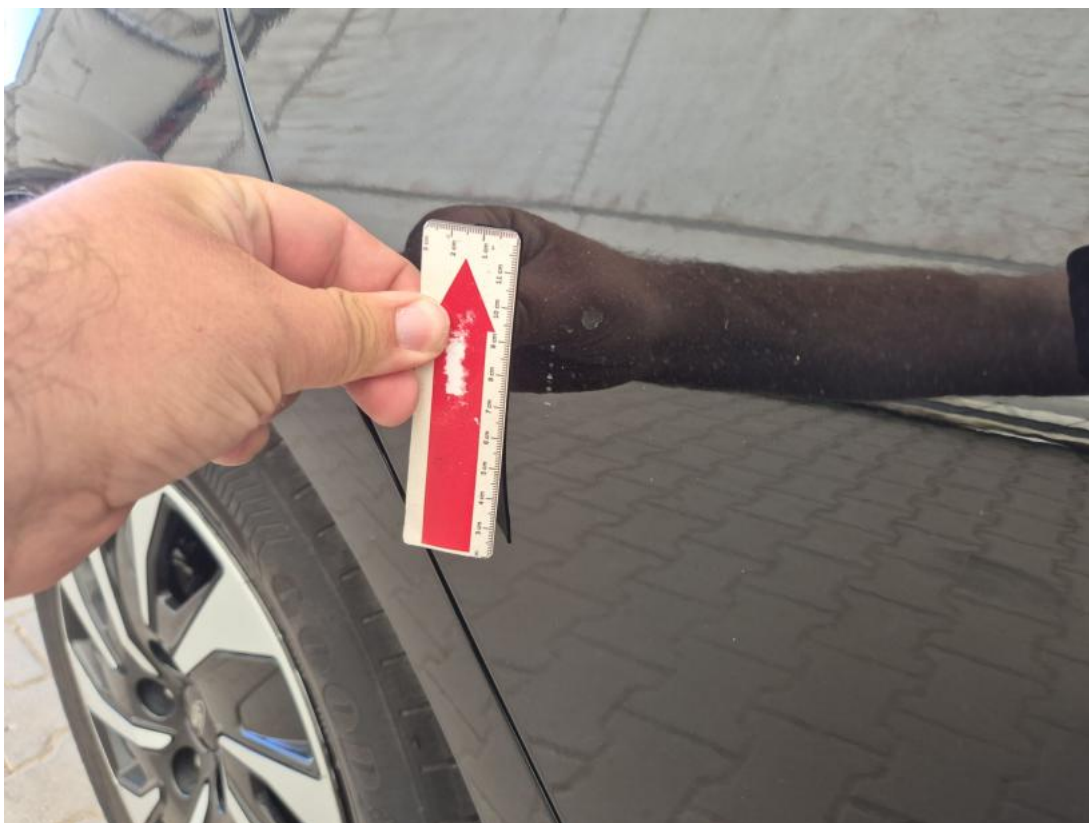
Fot. 43 Drzwi tylne P - zdjęcie poglądowe 1