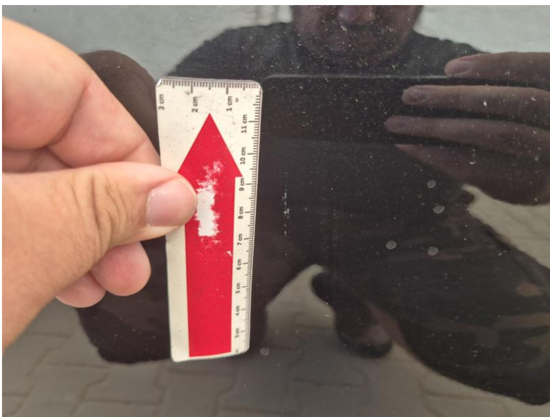
Fot. 44 Drzwi tylne P - Rysa/odprysk 1