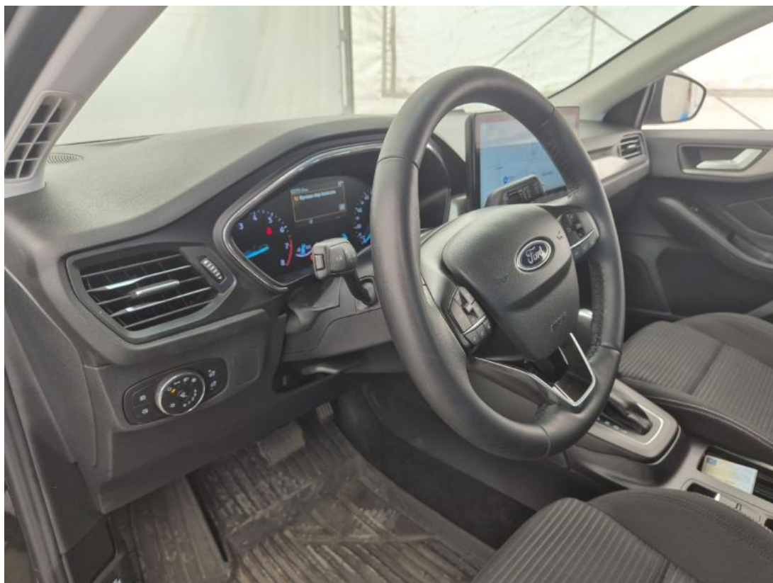
Fot. 23 Kierownica z lewej strony