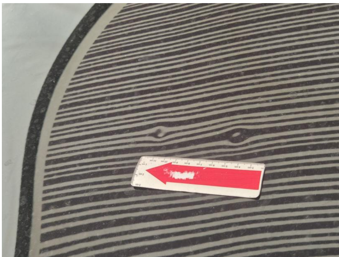
Fot. 36 Pokrywa komory silnika - Wgniecenie/odkształcenie 1