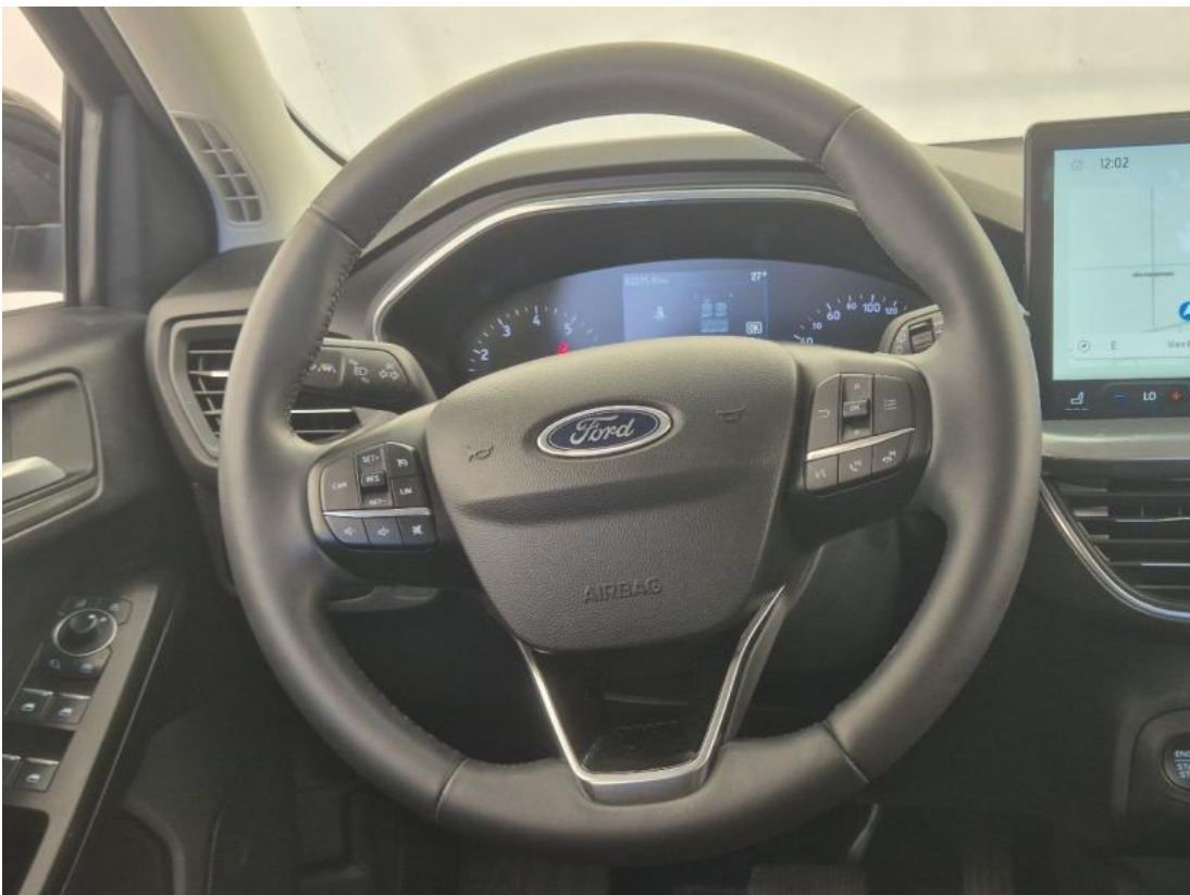
Fot. 22 Kierownica (na wprost)