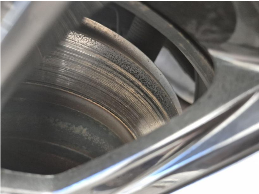
Fot. 31 Tarcza hamulcowa tylna prawa