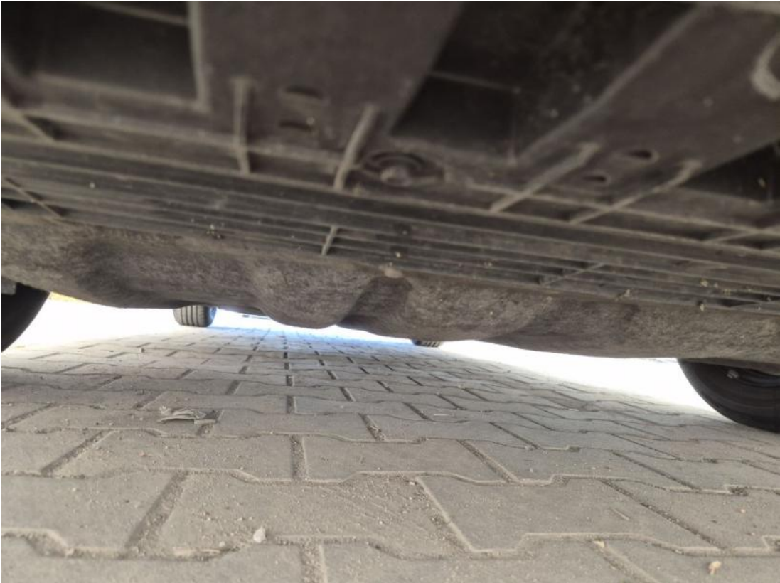
Fot. 27 Spód pojazdu przód