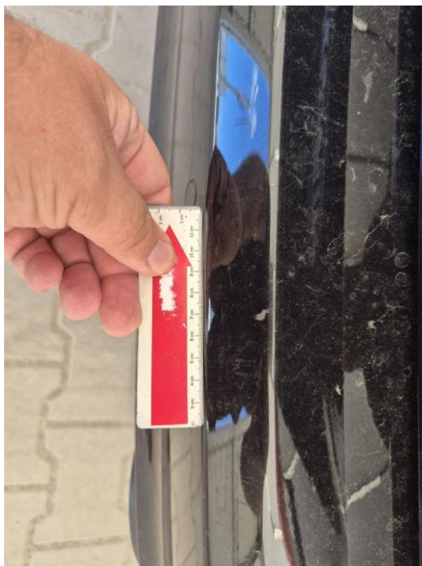
Fot. 47 Zderzak tylny - Rysa/odprysk 1