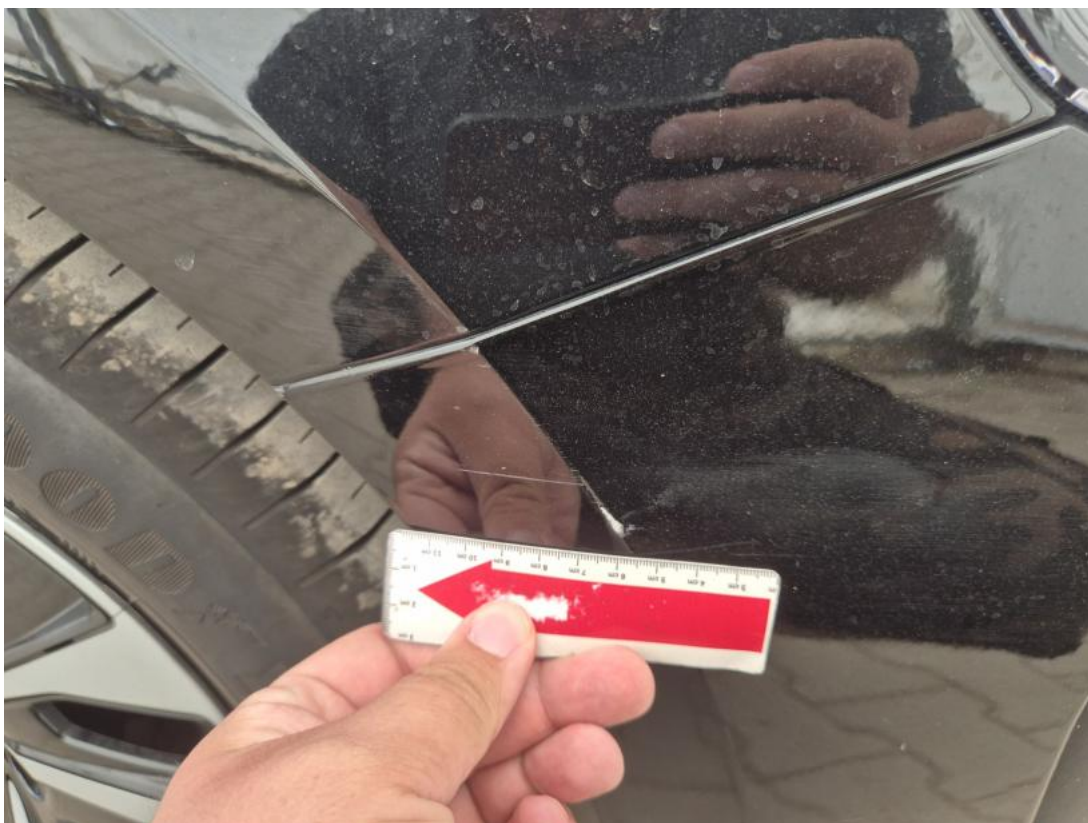
Fot. 39 Zderzak - Rysa/odprysk 1