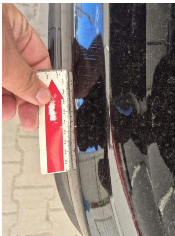
Fot. 48 Zderzak tylny - Rysa/odprysk 2