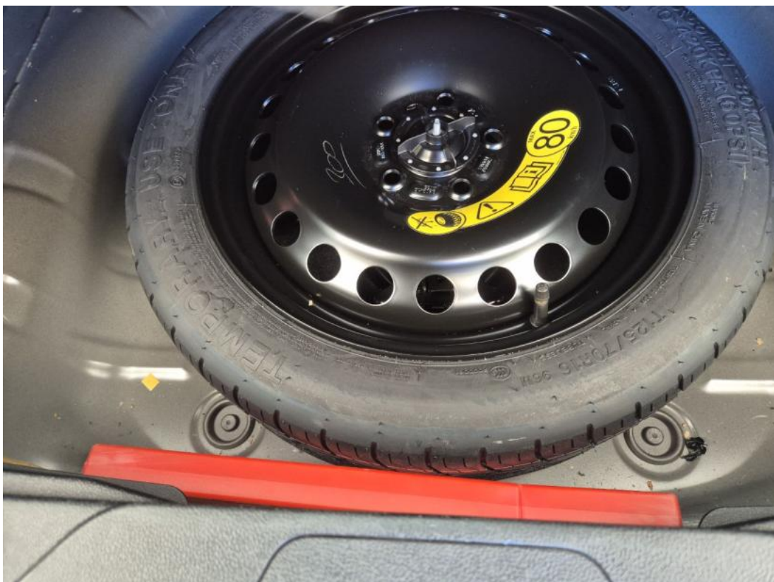
Fot. 26 Koło zapasowe