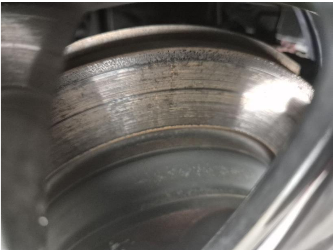
Fot. 32 Tarcza hamulcowa tylna lewa