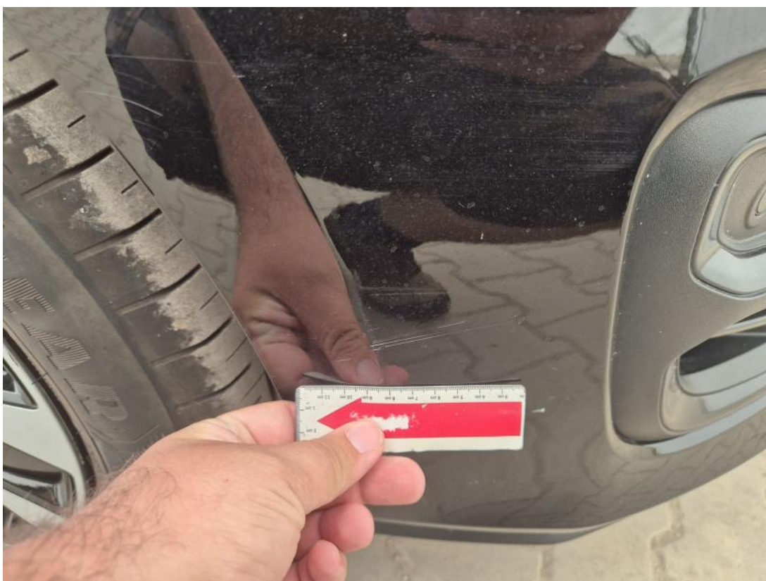
Fot. 40 Zderzak - Rysa/odprysk 2