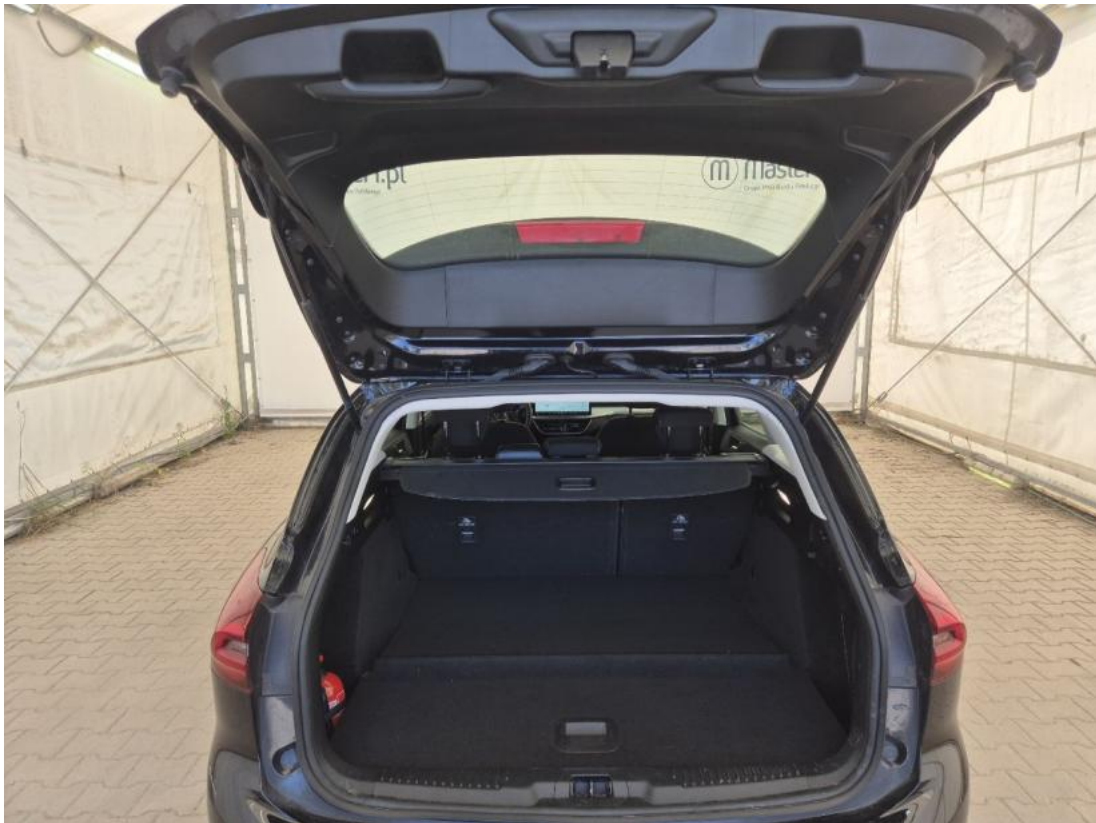
Fot. 25 Bagażnik