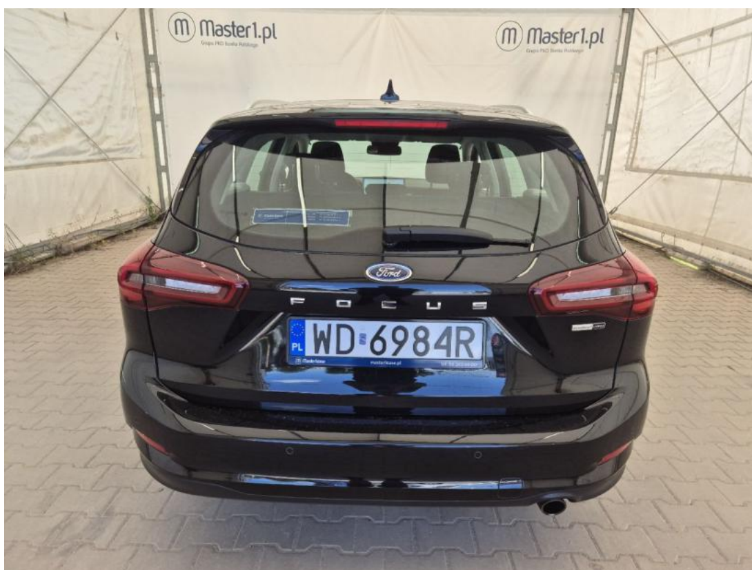
Fot. 8 Tyt