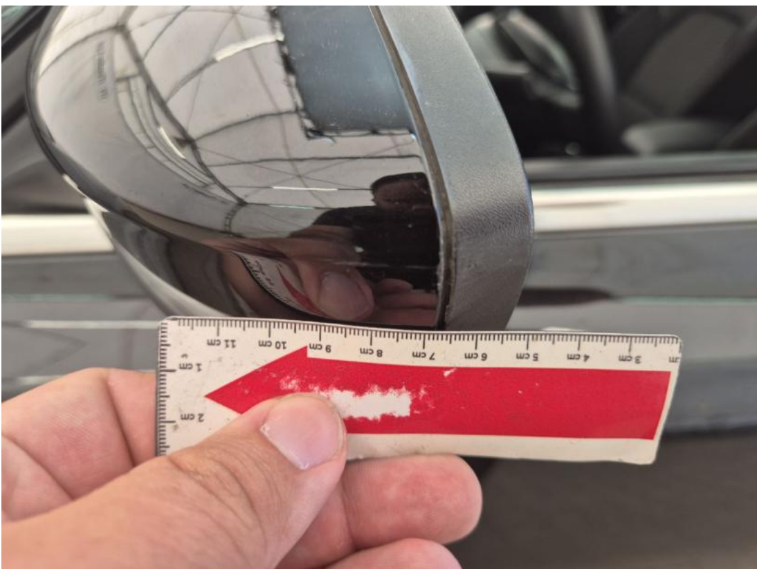
Fot. 56 Lusterko zew L - Rysa/odprysk 1