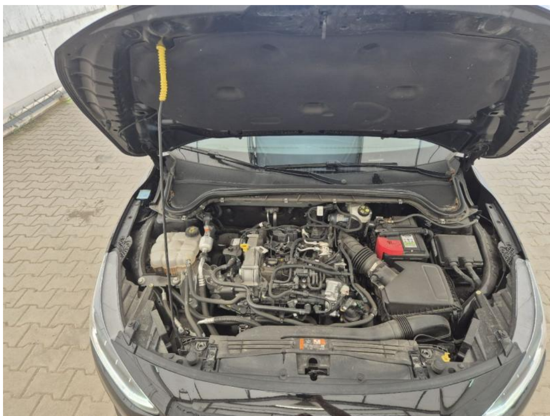
Fot. 24 Komora silnika