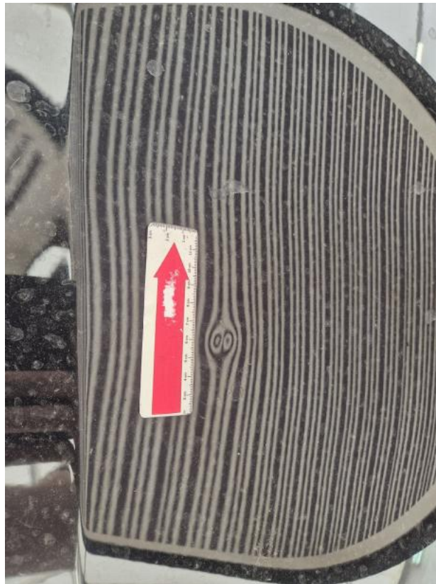
Fot. 37 Pokrywa komory silnika - Wgniecenie/odkształcenie 2