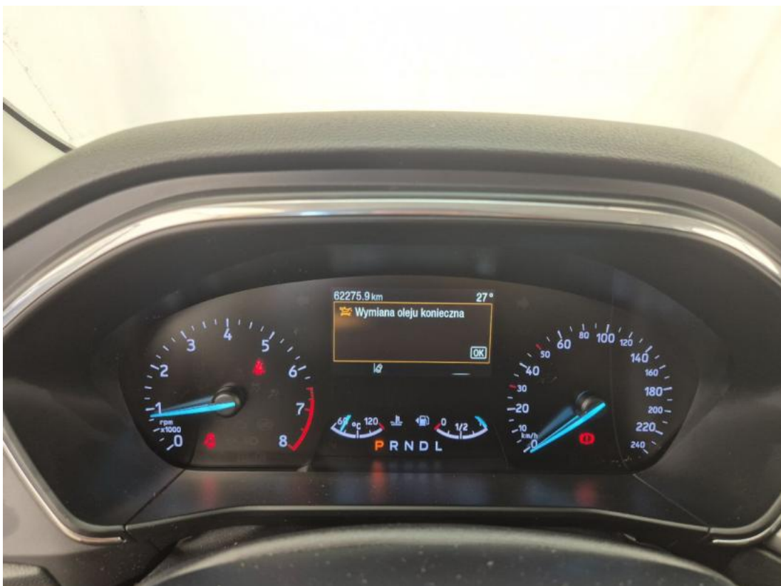
Fot. 16 Zestaw wskaźników - serwis