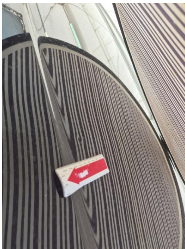
Fot. 50 Dach - Wgniecenie/odkształcenie 1