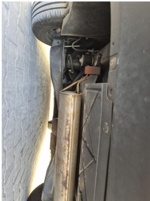
Fot. 28 Spód pojazdu tył