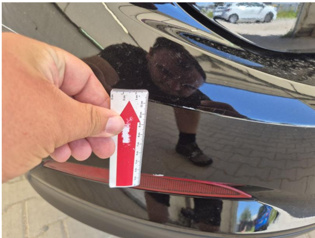
Fot. 49 Zderzak tylny() - Rysa/odprysk 3