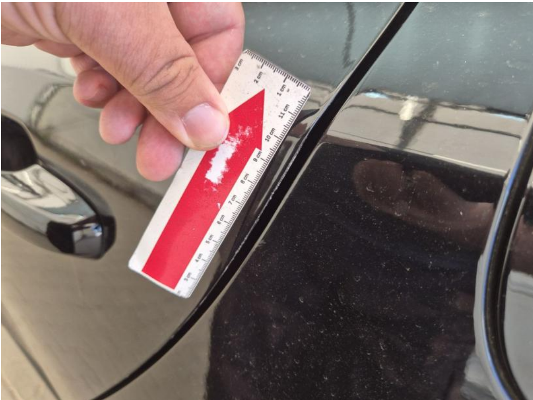
Fot. 55 Drzwi tylne L - Rysa/odprysk 1