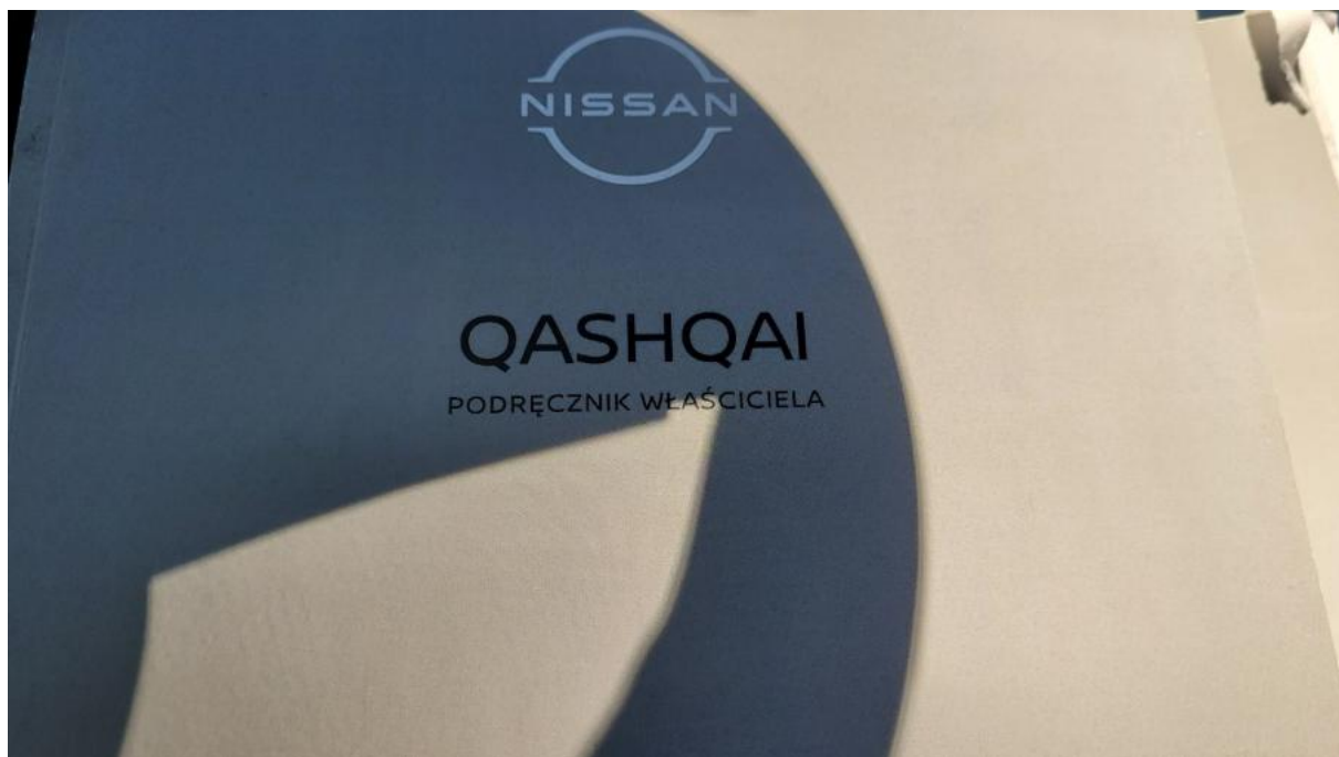
Fot. 32 Instrukcje