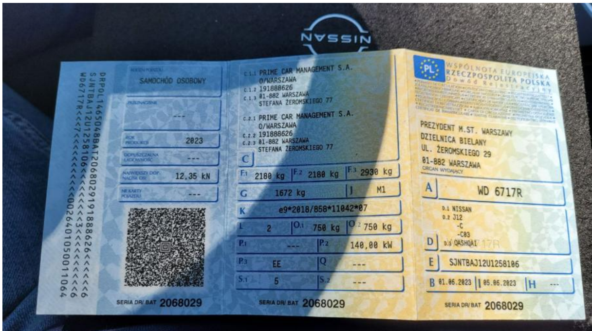
Fot. 28 Dowód rej. Str. 1