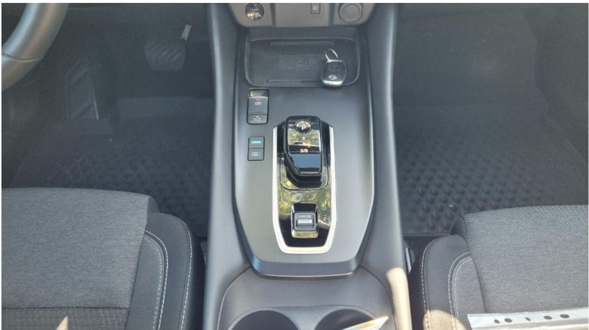
Fot. 20 Tuneł środkowy