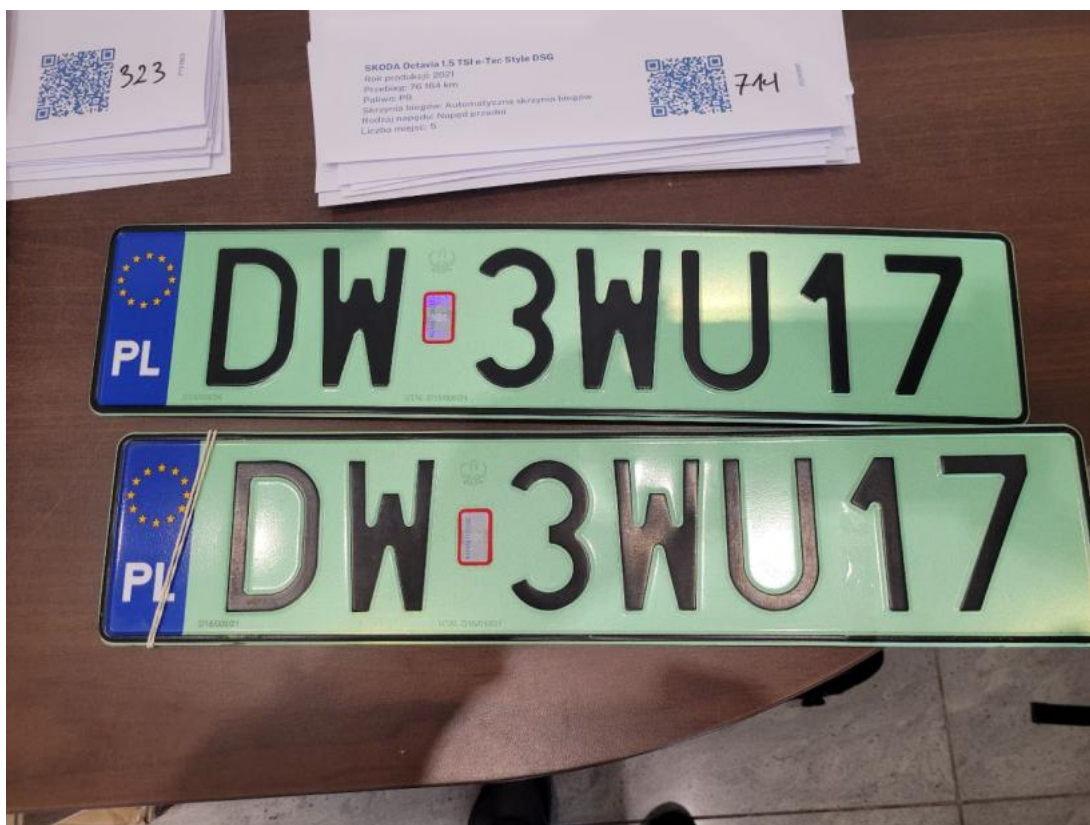
Fot. 34 Zdjęcie do protokołu