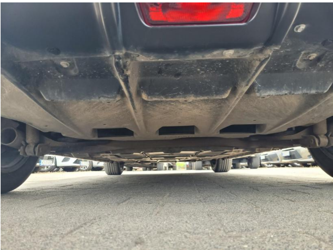
Fot. 26 Spód pojazdu tył