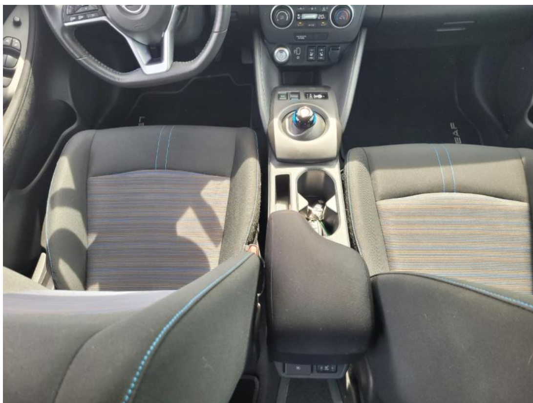
Fot. 20 Tuneł środkowy