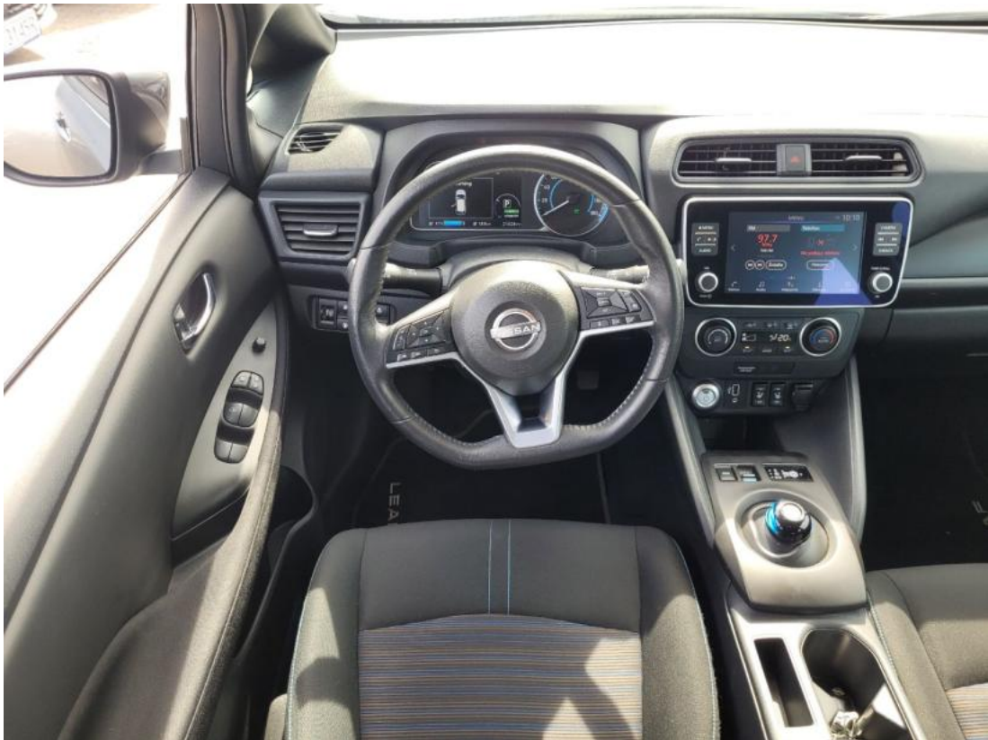
Fot. 21 Kierownica (na wprost)