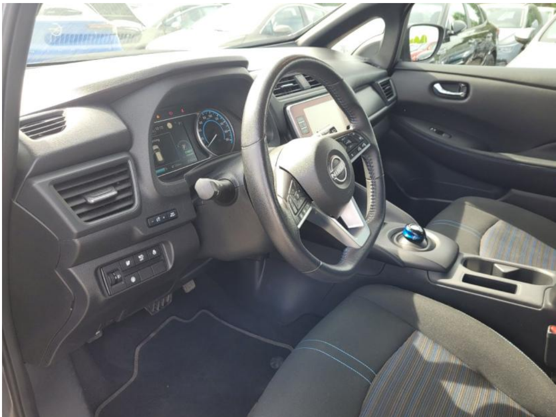
Fot. 22 Kierownica z lewej strony