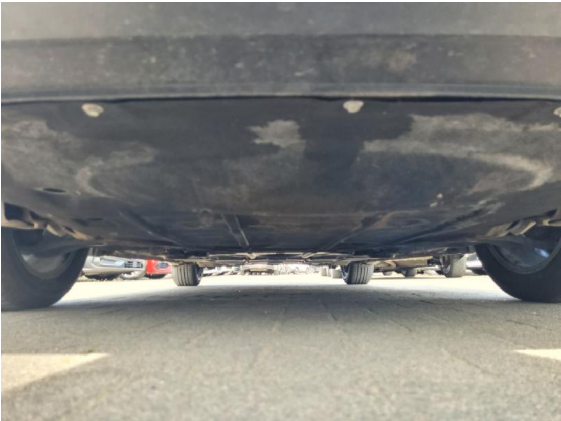
Fot. 25 Spód pojazdu przód