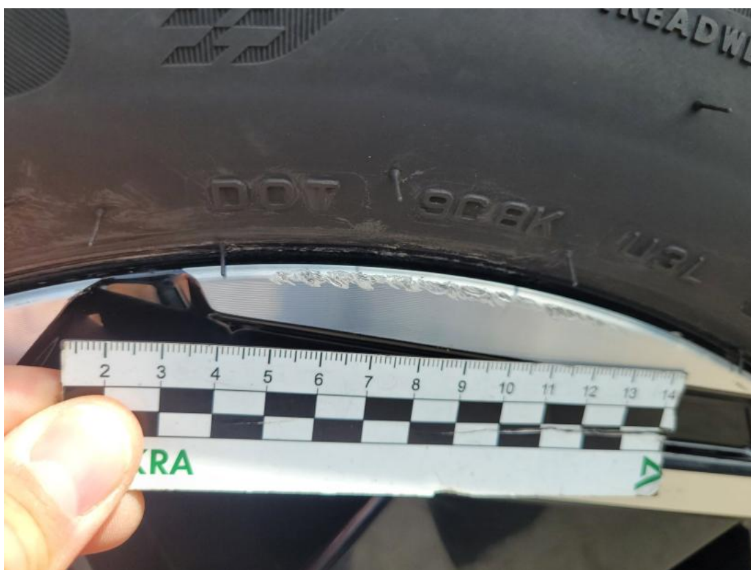
Fot. 36 Felga aluminiowa tylna P - Rysa/odprysk 1