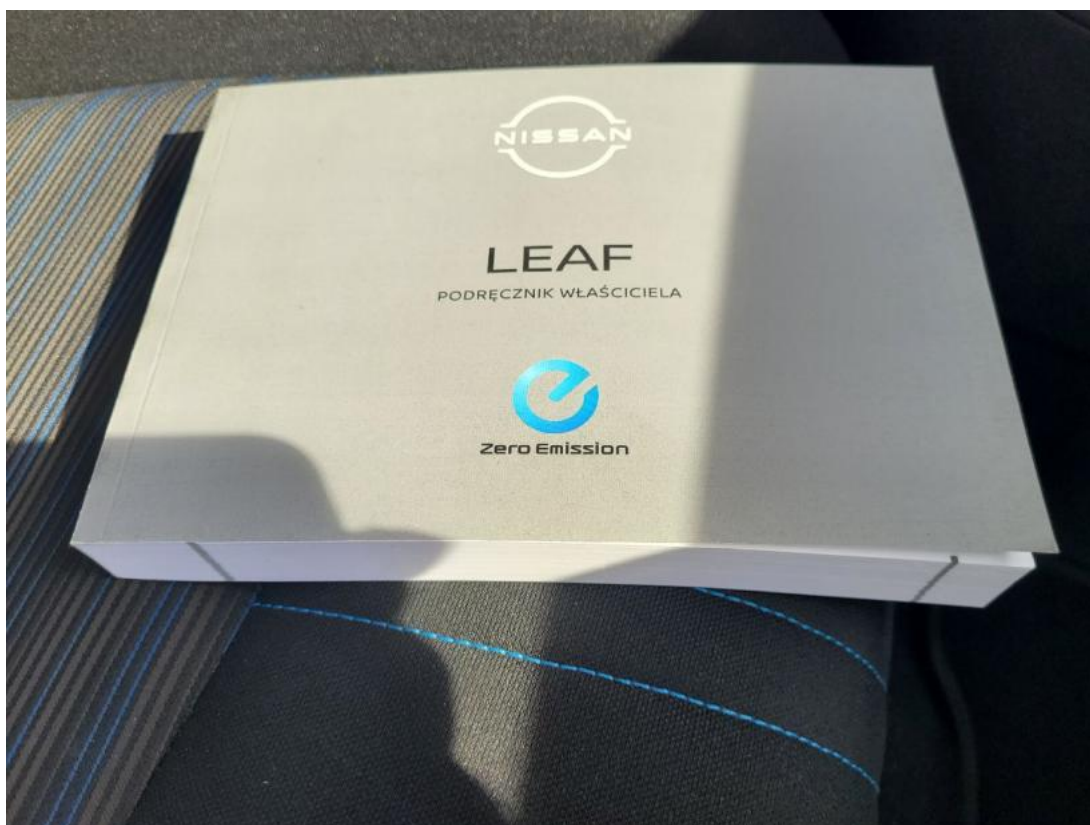
Fot. 33 Instrukcje