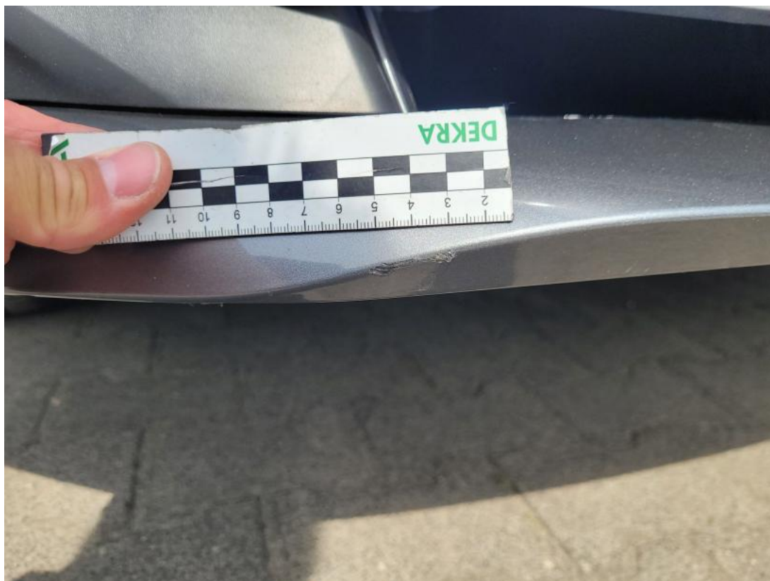
Fot. 35 Zderzak - Rysa/odprysk 1