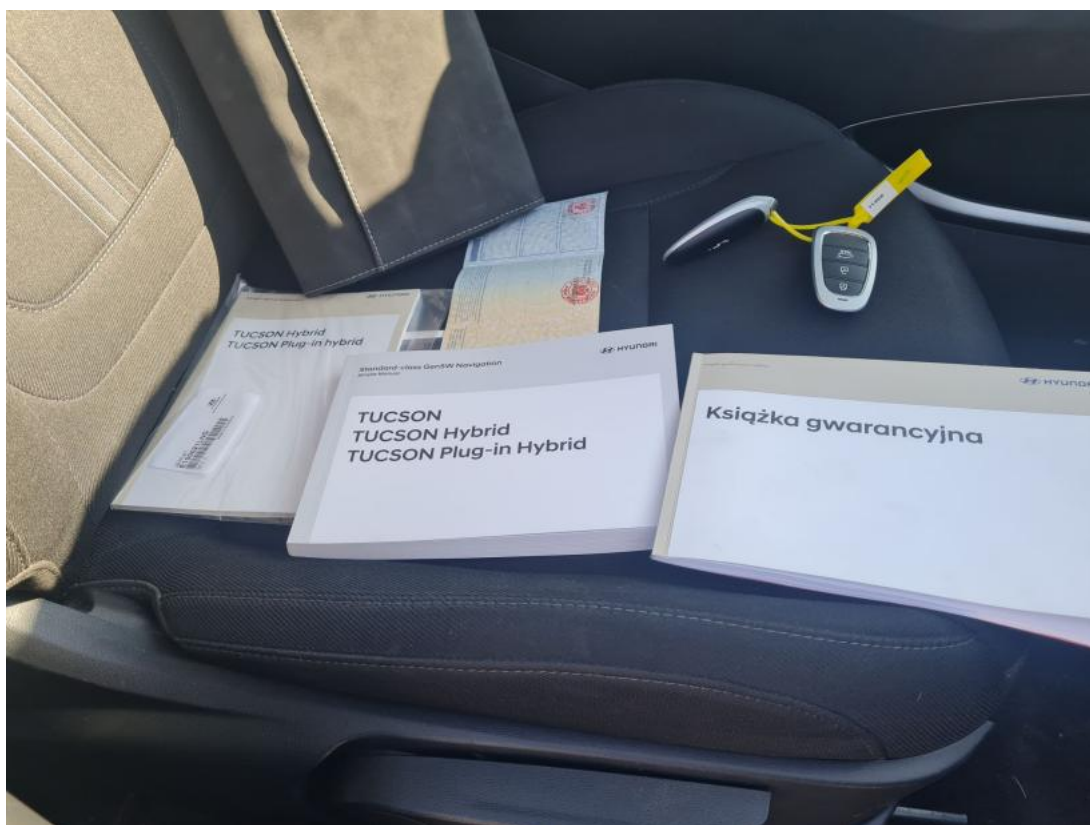
Fot. 35 Instrukcje