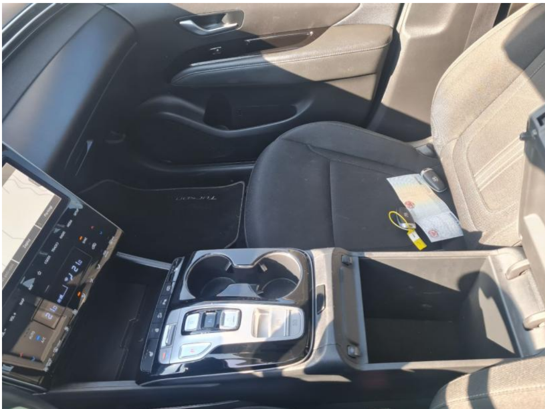
Fot. 20 Tuneł środkowy