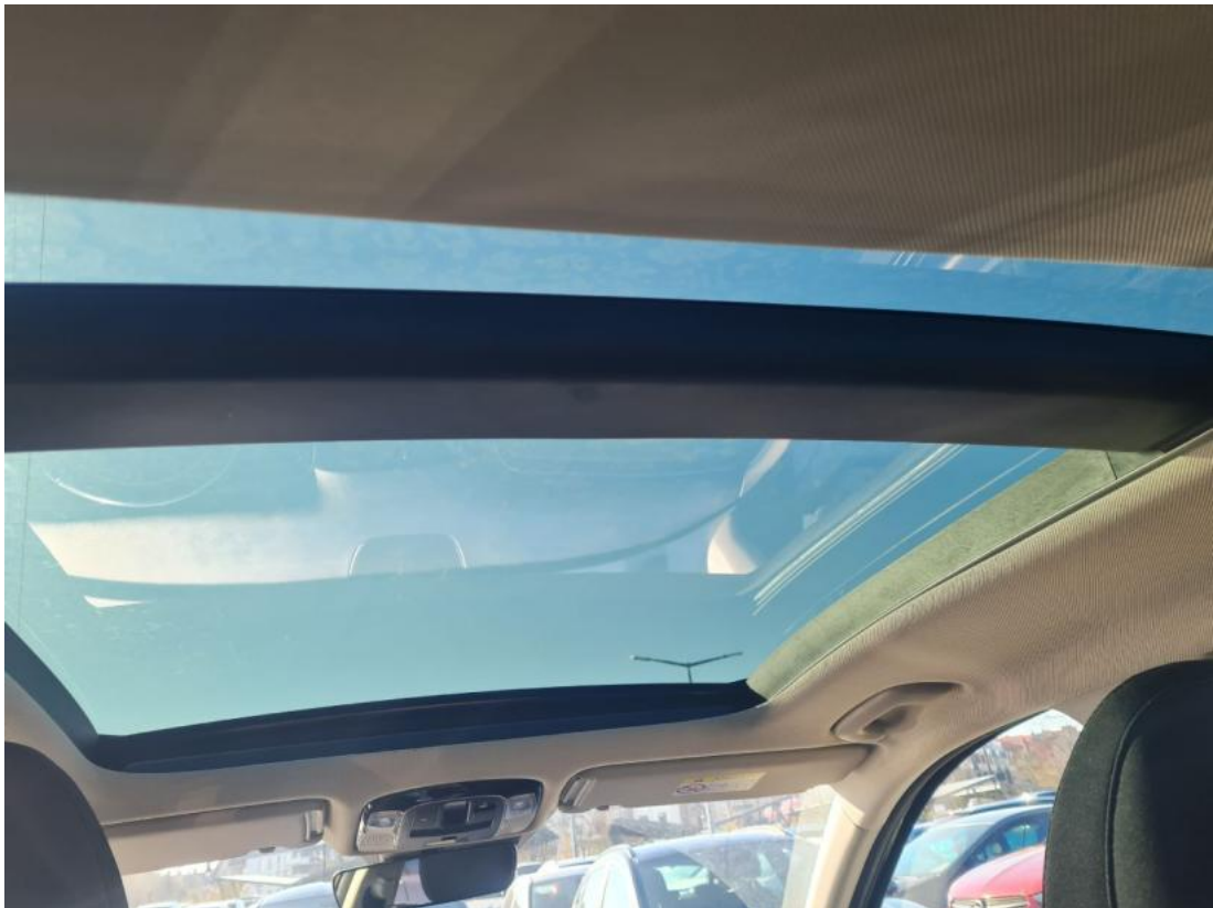
Fot. 37 Zdjęcie do protokołu