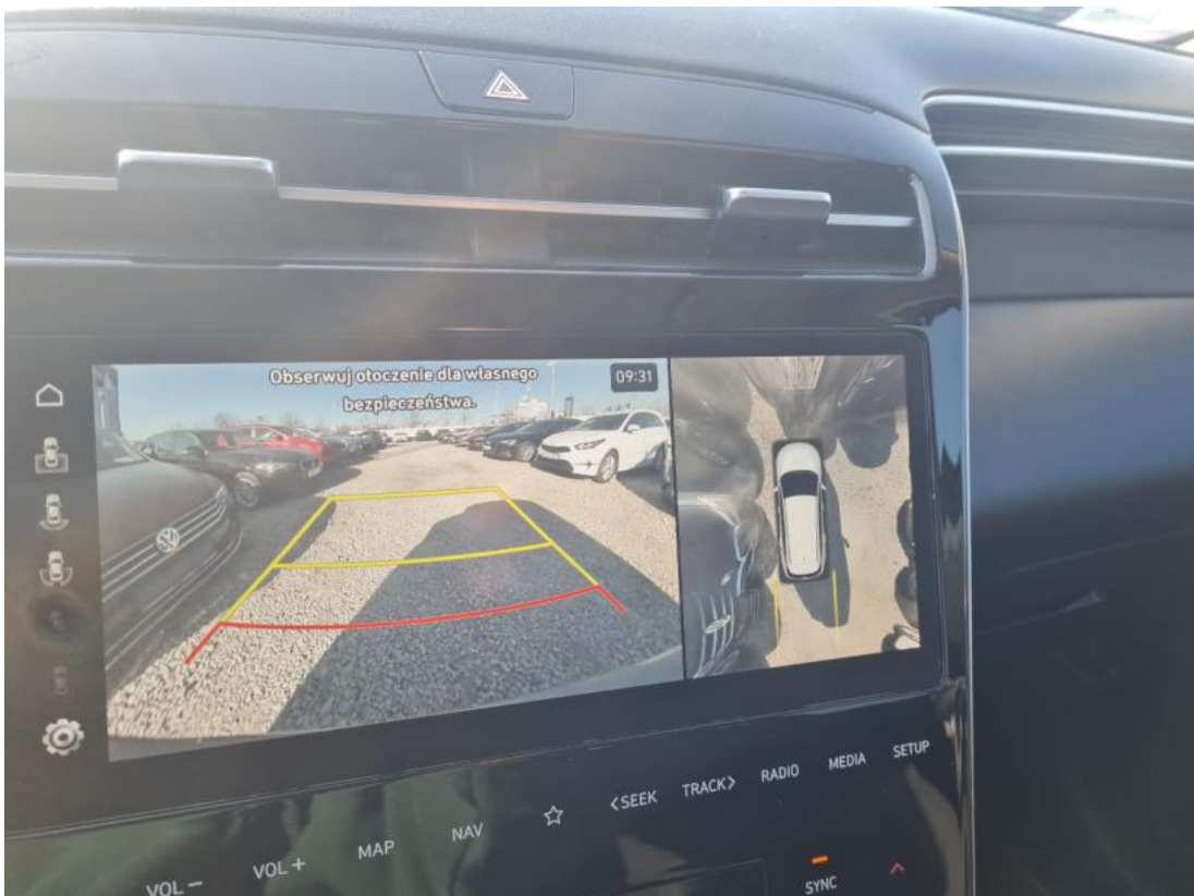
Fot. 40 Zdjęcie do protokołu