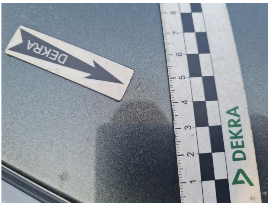
Fot. 42 Pokrywa komory silnika - Wgniecenie/odkształcenie 1