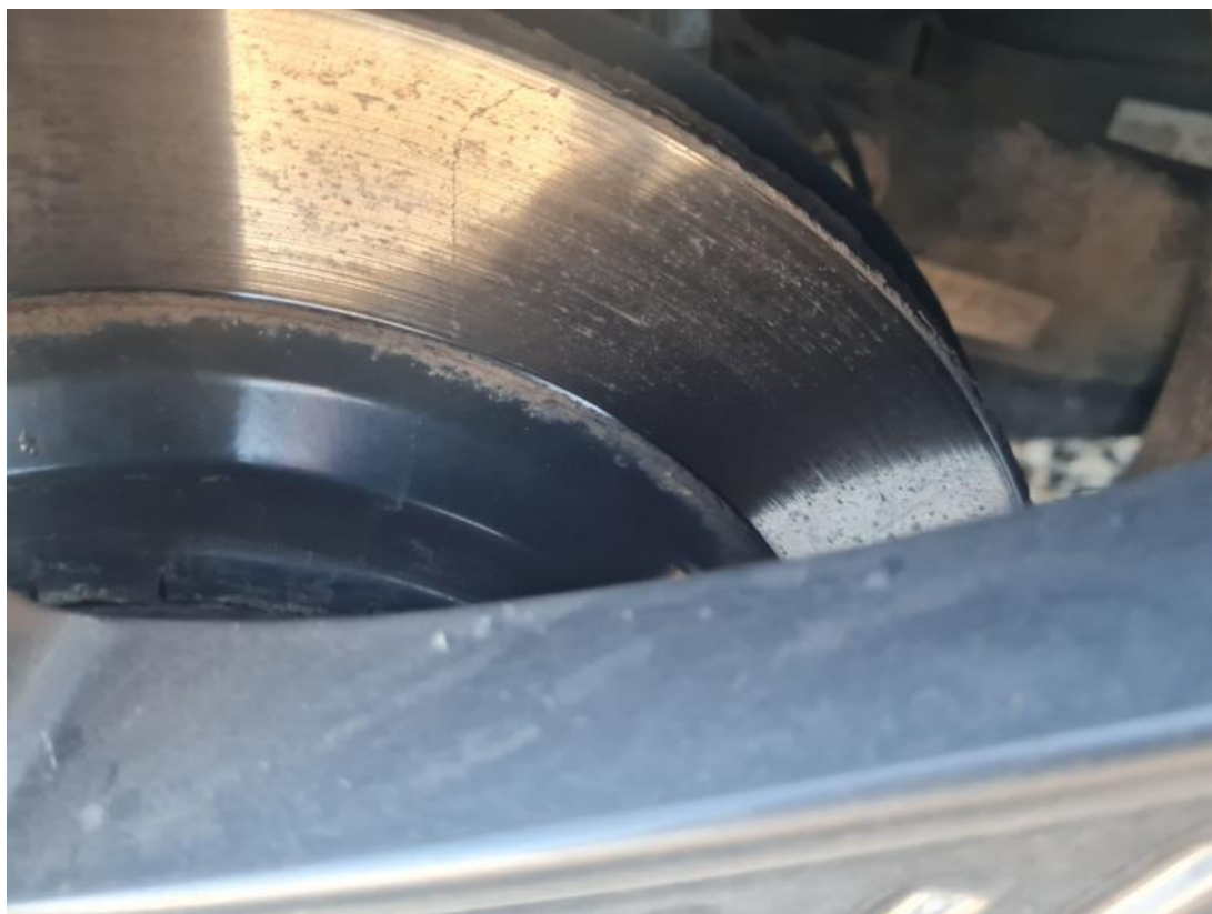
Fot. 29 Tarcza hamulcowa tylna prawa