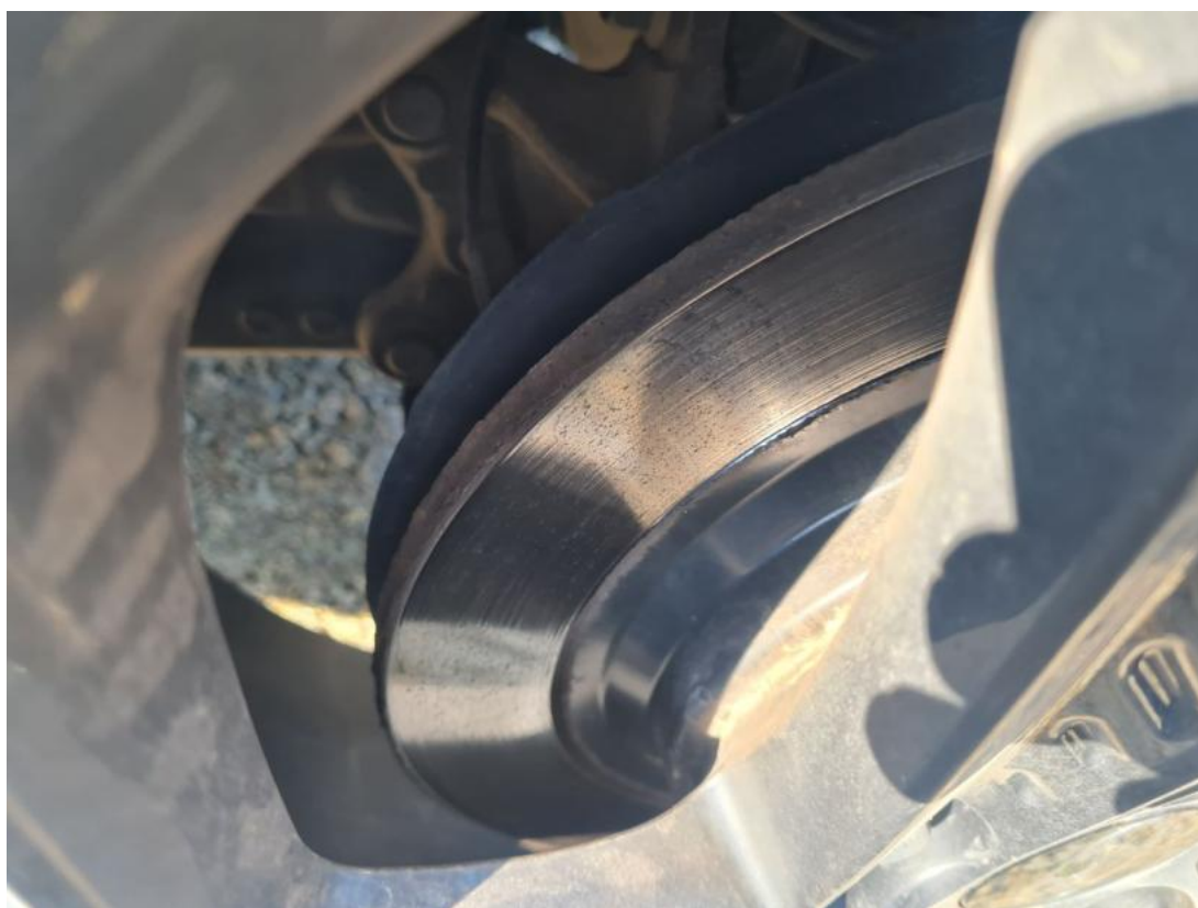
Fot. 30 Tarcza hamulcowa tylna lewa