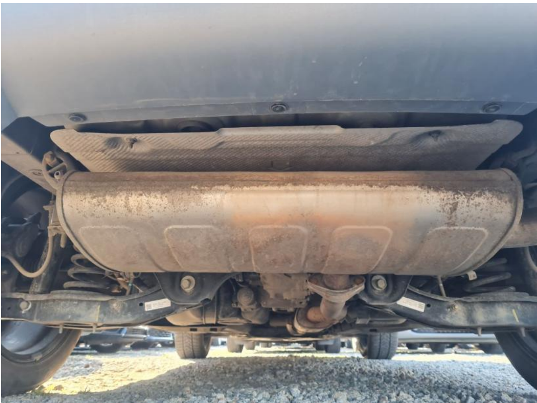
Fot. 26 Spód pojazdu tył