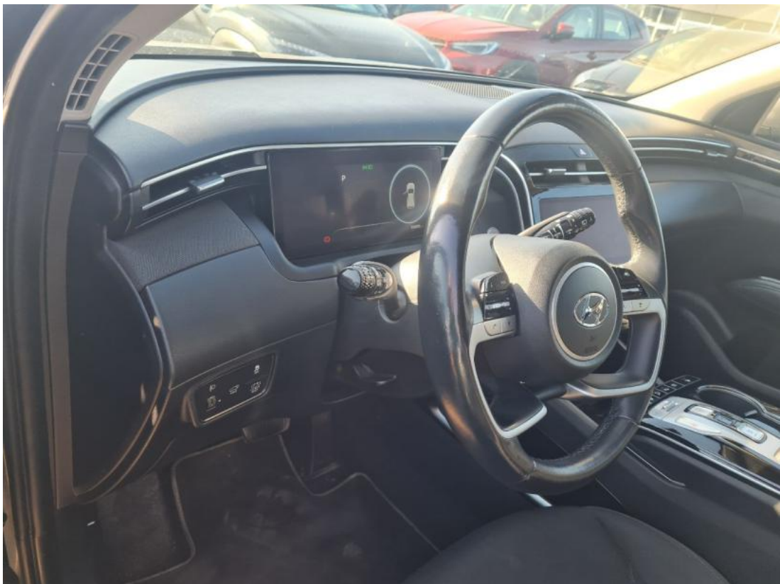
Fot. 22 Kierownica z lewej strony