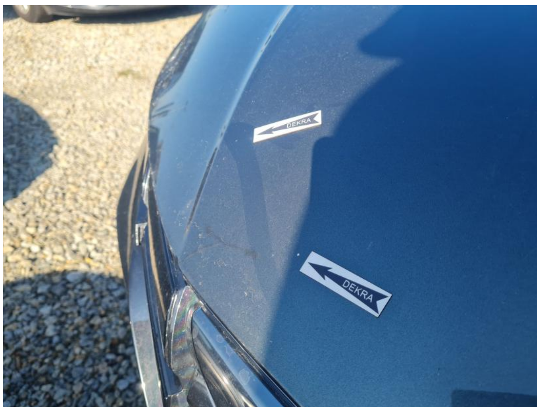
Fot. 41 Pokrywa komory silnika - Rysa/odprysk 1