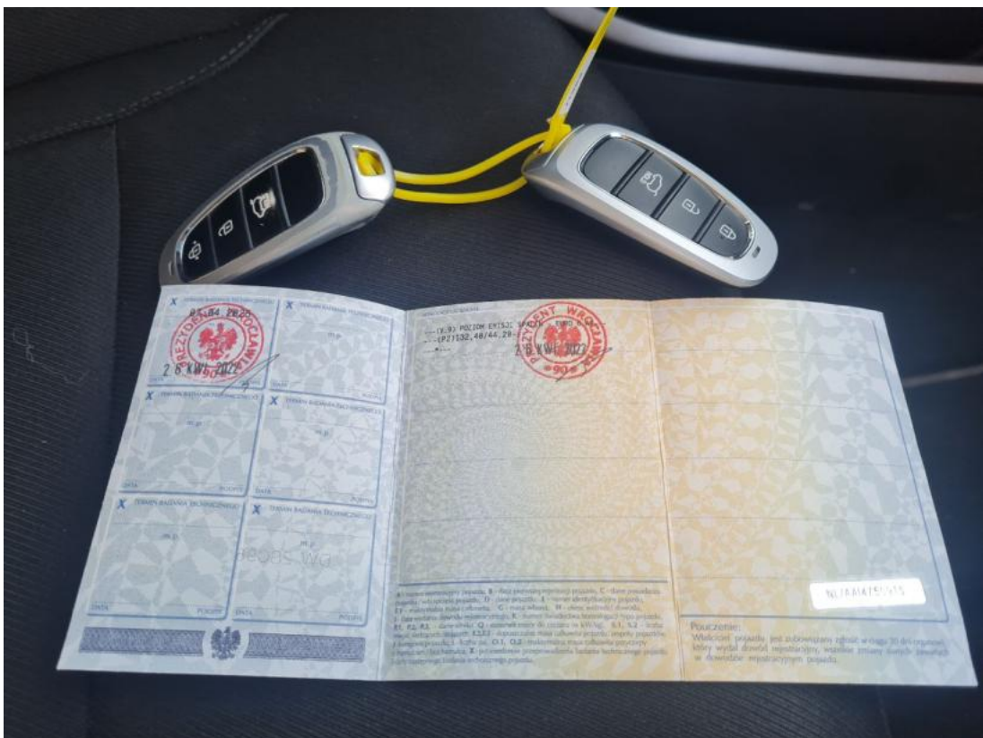
Fot. 32 Dow. Rej. Str.2 i klucze