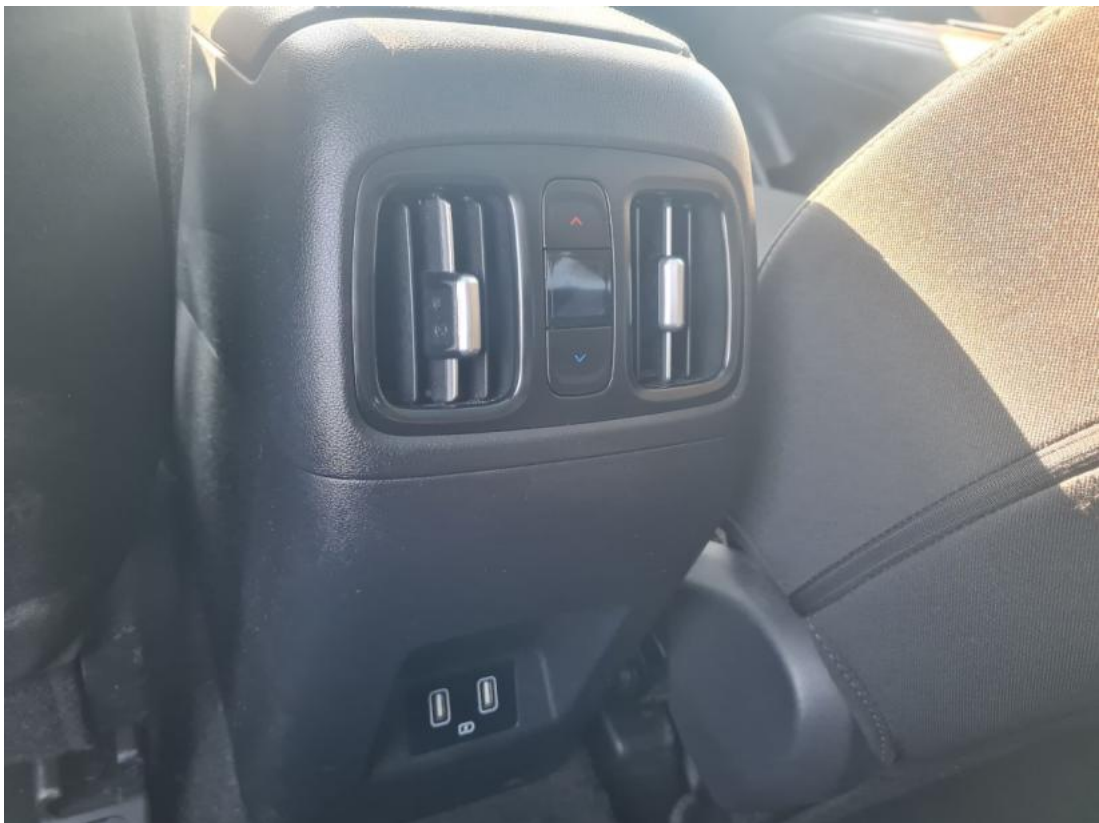
Fot. 38 Zdjęcie do protokołu