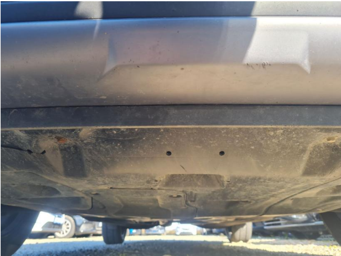
Fot. 25 Spód pojazdu przód