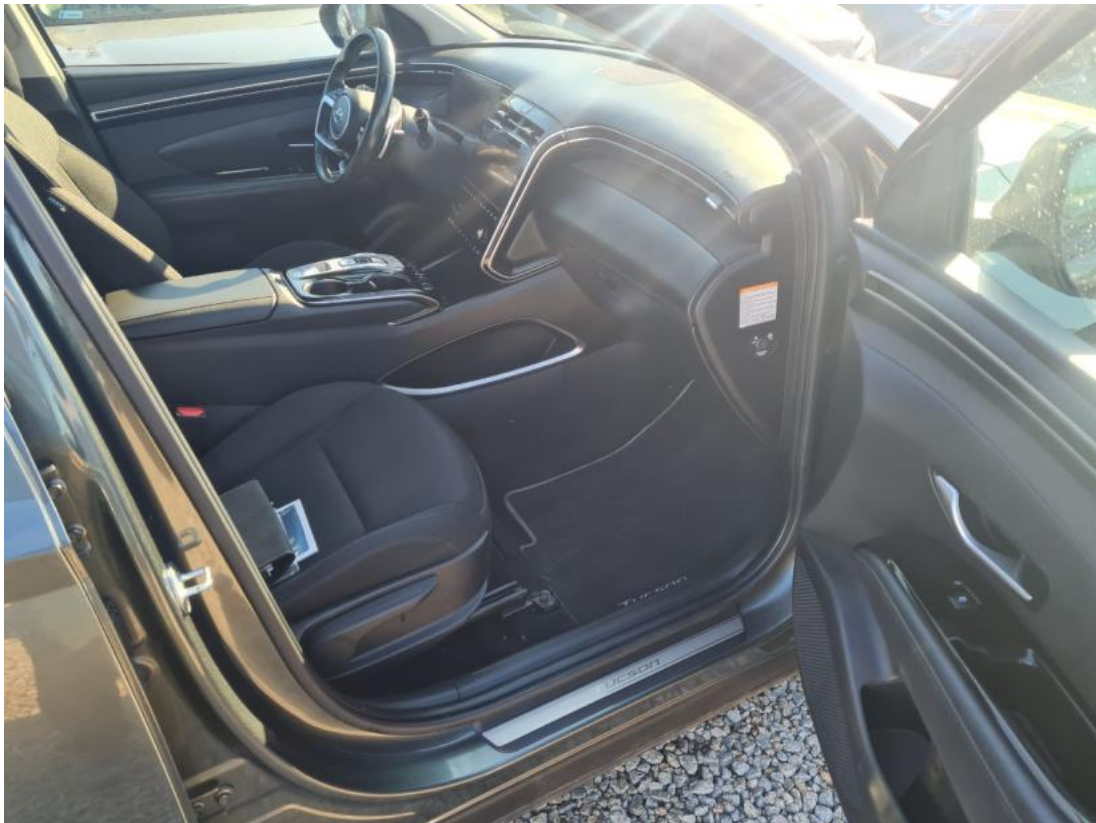
Fot. 39 Zdjęcie do protokołu