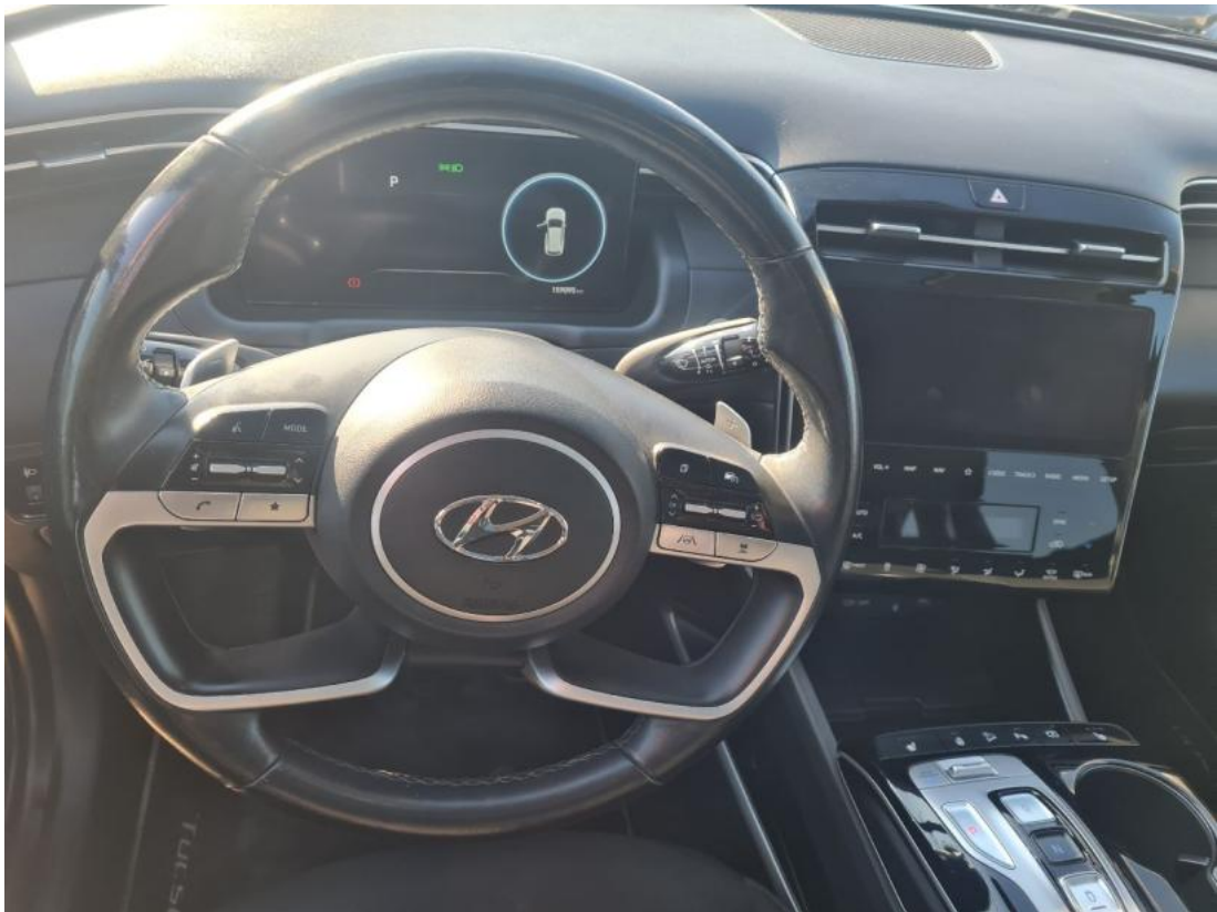
Fot. 21 Kierownica (na wprost)