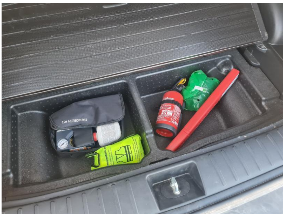
Fot. 36 Zestaw naprawy koła