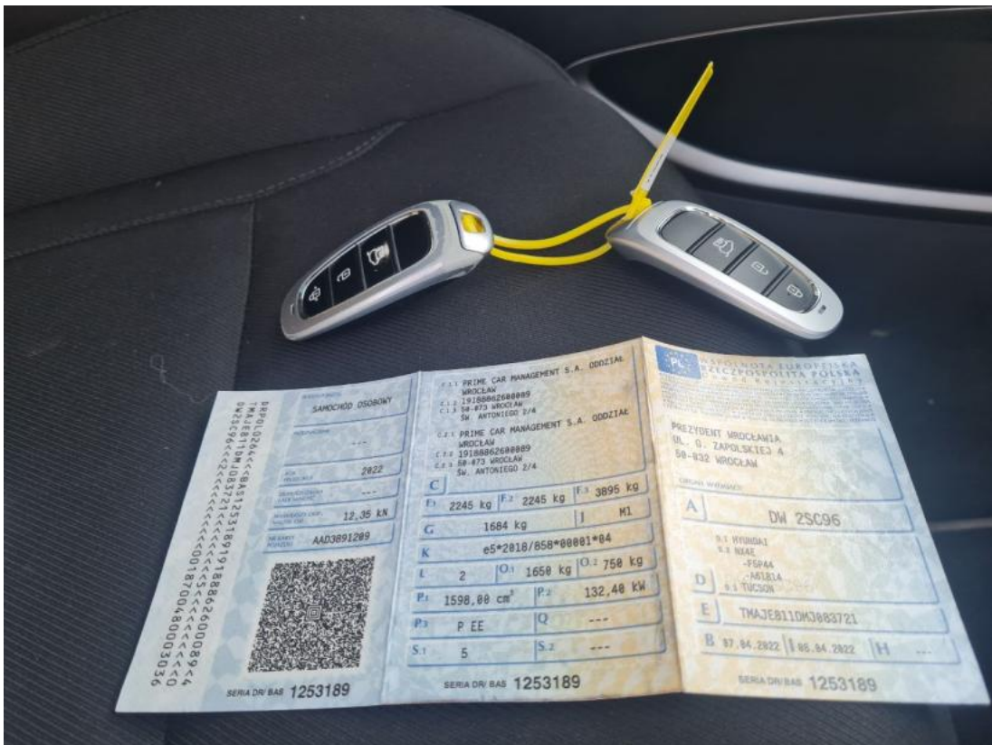
Fot. 31 Dowód rej. Str. 1