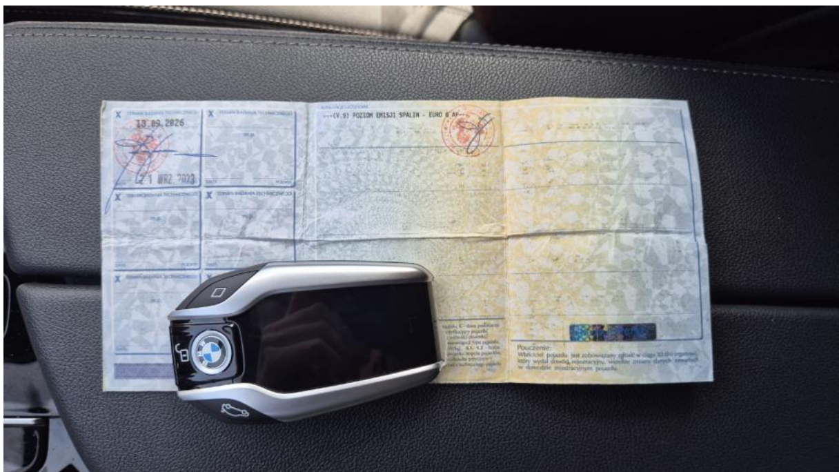
Fot. 28 Dow. Rej. Str.2 i klucze