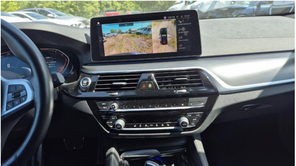
Fot. 19 Konsola środkowa