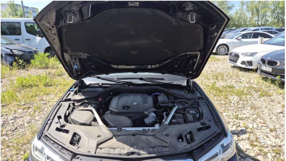
Fot. 23 Komora silnika