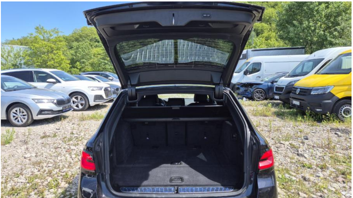
Fot. 24 Bagażnik