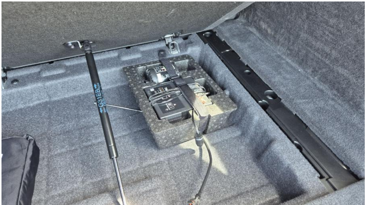
Fot. 32 Zestaw naprawczy koła