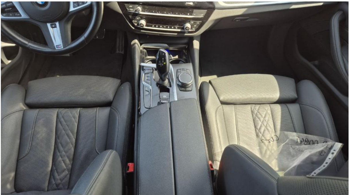
Fot. 20 Tunel środkowy