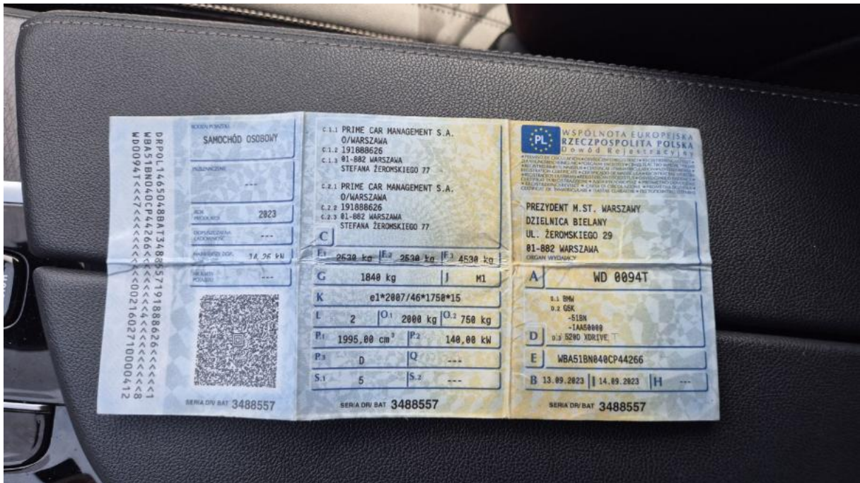
Fot. 27 Dowód rej. Str. 1